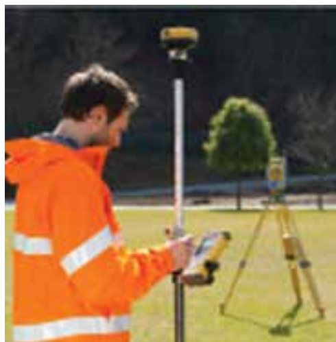
شکل ۷-۳ پیاده کردن تک نفره با RPU

سیستم یک نفره‌ای که در بالا شرح داده شد، برای پیاده کردن یک نقطه در جهت و فاصله معین از نقطه کنترلی که توتال استیشن در آن نصب شده به کار می‌رود. نقشه‌بردار دائماً صفحه نمایش RPU را که موقعیت او را نشان می‌دهد قرائت می‌کند. لذا آن قدر تغییر مکان می‌دهد تا در جهت و فاصله