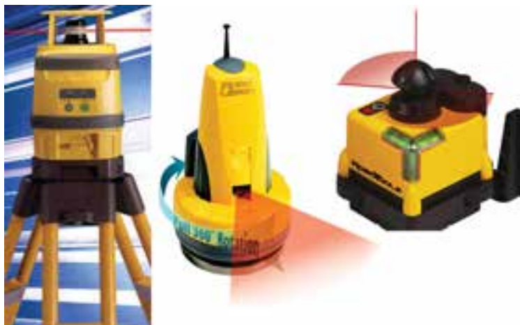
شکل ۷-۵ - تراز یاب چرخنده

پیاده کردن نقاط با GPS و PDA : همانند نقشه برداری تک نفره با RPU در اینجا به جای به کارگیری توتال استیشن برای تعیین موقعیت شاخص، از یک GPS استفاده می شود. برای این منظور آنتن GPS روی شاخص نصب شده و توسط کاربر در نقاط مورد نظر قرار داده می شود. GPS به صورت آنی نقاط را تعیین موقعیت نموده و نتیجه را روی صفحه کامپیوتر نمایشگر که روی شاخص نصب شده است به نام (Personal Data Assistant) PDA در کنار نقشه طرح نمایش می دهد. کاربر با نگاه به طرح آن قدر جابه جا می شود تا روی نقطه مورد نظر قرار گیرد. البته برای افزایش دقت در این روش، نیاز به دو گیرنده GPS می باشد که توضیح آن در فصل ششم ارائه شده است.