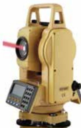
شکل ۷-۴- توتال لیزری بدون رفلکتور

ترازیاب چرخنده : این ترازیاب پس از استقرار و تراز شدن، یک صفحه افقی را با لیزر مشخص نموده و شاخص بارکددار آن، بسته به این که در چه نقطه ای از سطح زمین در دورتادور این ترازیاب قرار داده شود، به صورت آنی ارتفاع نقطه را روی صفحه نمایشگر خود نمایش می دهد. به این ترتیب می توان در پروژه های زیرسازی مسیرها و سایت های خاص مانند باند فرودگاه و کنترل های ارتفاعی پی بناها از این تجهیزات استفاده نمود.