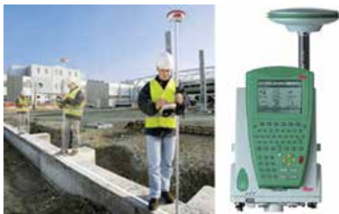
شکل ۷-۶ - پیاده کردن نقاط با GPS و PDA

پیاده کردن نقاط با GPS و PDA : همانند نقشه برداری تک نفره با RPU در اینجا به جای به کارگیری توتال استیشن برای تعیین موقعیت شاخص، از یک GPS استفاده می شود. برای این منظور آنتن GPS روی شاخص نصب شده و توسط کاربر در نقاط مورد نظر قرار داده می شود. GPS به صورت آنی نقاط را تعیین موقعیت نموده و نتیجه را روی صفحه کامپیوتر نمایشگر که روی شاخص نصب شده است به نام (Personal Data Assistant) PDA در کنار نقشه طرح نمایش می دهد. کاربر با نگاه به طرح آن قدر جابه جا می شود تا روی نقطه مورد نظر قرار گیرد. البته برای افزایش دقت در این روش، نیاز به دو گیرنده GPS می باشد که توضیح آن در فصل ششم ارائه شده است.