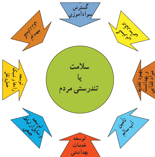
شکل ۲-۳- تجسم آنچه از هماهنگی بین بخشی برای تأمین سلامت مردم انتظار می‌رود.

ج) هماهنگی بین بخشی: ذکر این مطلب لازم است که سلامت افراد فقط با ارائه خدمات بهداشتی تأمین نمی‌شود بلکه سلامت مردم به آنچه می‌خورند، می‌نوشند، شغلی که در آن مشغولند، مسکن مناسب و بهداشتی، تفریحاتی که برای اوقات فراغت انتخاب می‌کنند و... بستگی دارد. پس در واقع باید بین بخش بهداشت و بخش‌های دیگر مانند کشاورزی، صنعت، حمل و نقل، آموزش و پرورش و وسایل ارتباط جمعی، همکاری وجود داشته باشد (شکل ۲-۳).