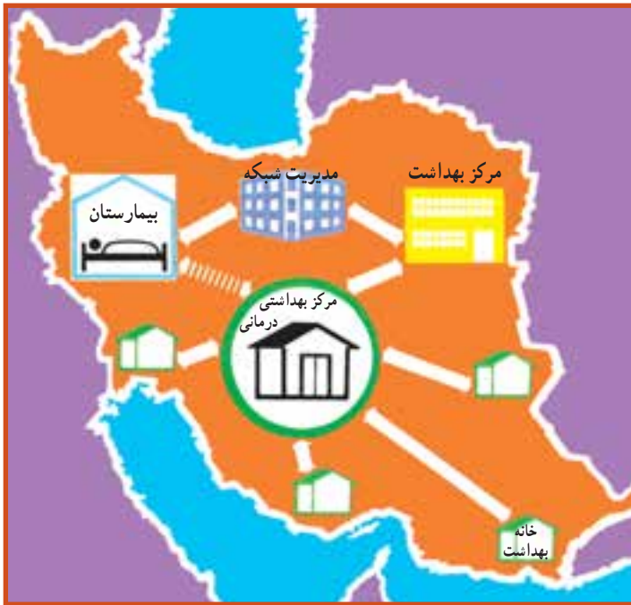
شکل ۴-۳- نظام عرضه خدمات بهداشتی

ز) مدیریت شبکه شهرستان: وظیفه هماهنگ‌سازی واحدهای مختلف بیمارستان و مرکز بهداشت شهرستان و نظارت بر فعالیت آنها را به عهده دارد، مدیر شبکه شهرستان، نماینده وزارت بهداشت، درمان و آموزش پزشکی در سطح شهرستان تلقی می‌شود. این نظام که اجزای آن در ارتباط و پیوستگی علمی و عملی با یکدیگر می‌باشند، اجراکننده برنامه‌های پیش‌بینی شده بهداشت و درمان کشور خواهد بود (شکل ۴-۳).