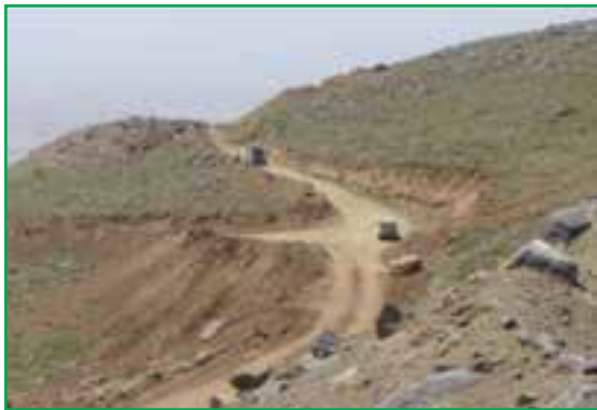
شکل ۵۹-۱- احداث راه در مراتع