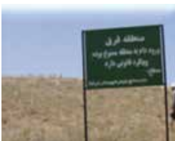
شکل ۱-۶۸- حفاظت و قرق مراتع