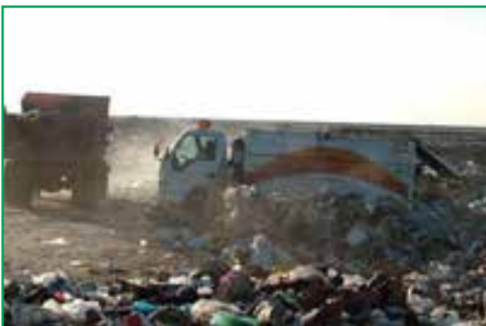
شکل ۸۳-۱- دفع غیربهداشتی زباله‌ها