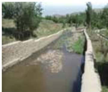
شکل ۱-۶۴- دیوار حاشیه رودخانه