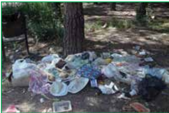
شکل ۸۲-۱- ریختن زباله در محیط

خاک، بستر حیات و زیستگاه بسیاری از موجودات و یکی از مهم‌ترین اجزای محیط طبیعی ماست که زمینه تأمین مواد غذایی مورد نیاز انسان و سایر جانوران را فراهم می‌کند. استان ما از توان بسیار بالایی در زمینه کشاورزی برخوردار است و بیشتر فعالیت‌ها در بخش کشت و زرع، باغداری و پرورش دام صورت می‌گیرد. امروزه توسعه این فعالیت‌ها موجب به‌کارگیری انواع کودهای شیمیایی و سموم دفع آفات نباتی در این بخش شده و استفاده گسترده از این مواد، موجبات آلودگی خاک را فراهم کرده است. از طرفی اقداماتی نظیر آبیاری با فاضلاب‌های شهری، ریختن زباله‌ها در محیط و آتش‌زدن بقایای محصولات کشاورزی، موجب آلودگی و تضعیف خاک‌های استان شده است.