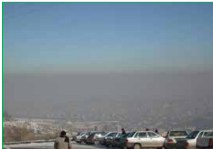
شکل ۷۷-۱- پدیده وارونگی دما در شهر همدان

ب) عوامل انسانی: در سال‌های اخیر به موازات رشد و توسعه زندگی شهری و استفاده بی‌رویه از سوخت‌های فسیلی در وسایل نقلیه، صنایع و وسایل گرمازا، آلودگی هوا در تمامی نقاط استان به شکل هشداردهنده‌ای افزایش یافته است که در این میان،