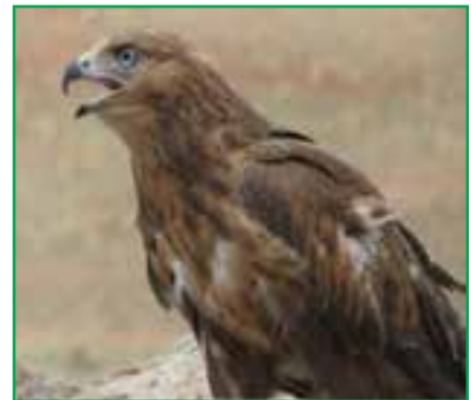
شکل ۱-۷۱- عقاب طلایی