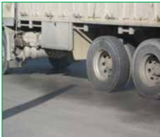
شکل ۲۹-۱- آلودگی هوا - خودروها

سهم وسایل نقلیه در آلودگی هوا بیشتر از دیگر منابع آلاینده است. از دیگر منابع آلوده کننده هوای استان می توان به صنایع آسفالت، ریخته گری، سیمان، کوره های آجرپزی و ... اشاره کرد.