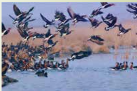
شکل ۷۵-۱- منطقه شکار ممنوع - شیرین سو

منطقه شکار ممنوع : منطقه شکار ممنوع نیز همچون مناطق حفاظت شده دارای شرایط مناسب جهت حفظ و تکثیر گونه‌های مختلف گیاهی و جانوری‌اند و با نظارت سازمان حفاظت محیط زیست دارای ممنوعیت شکار و صید، قطع درختان و آسیب‌رساندن به محیط است.