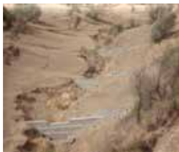
شکل ۱-۶۳- بند گابیونی (سنگ‌ها در تور سیمی)