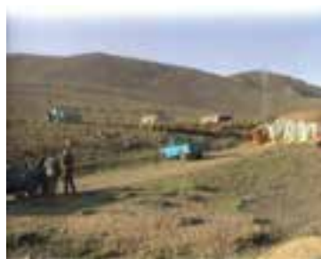
شکل ۱-۶۷- مدیریت و نظارت بر چرا