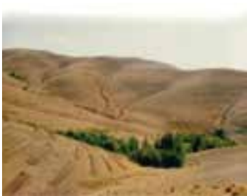
شکل ۱-۶۶- احداث بانکت‌بندی