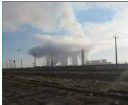
شکل ۲۸-۱- آلودگی هوا - صنایع