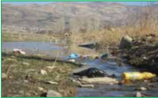
شکل ۸۱-۱- فاضلاب‌های شهری در بستر رودخانه‌ها

و به چرخه آب برمی‌گردند که باعث آلودگی آب و خاک می‌شوند. در اثر فعالیت‌های تولیدی و صنعتی در کارخانجات و واحدهای صنعتی استان نیز فاضلاب صنعتی تولید می‌شوند و در نتیجه مقدار قابل توجهی از مواد شیمیایی خطرناک را وارد آب‌های سطحی و زیرزمینی می‌کنند.