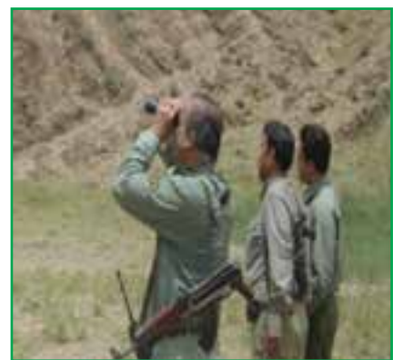
شکل ۱-۷۲- محیط‌بانان سازمان حفاظت از محیط زیست

بررسی کنید که در سال‌های اخیر کدام یک از گونه‌های گیاهی و جانوری محل زندگی شما از بین رفته است؟ نتیجه را به کلاس ارائه دهید.