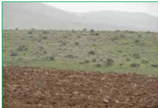
شکل ۶۰-۱- تبدیل مراتع به زمین کشاورزی