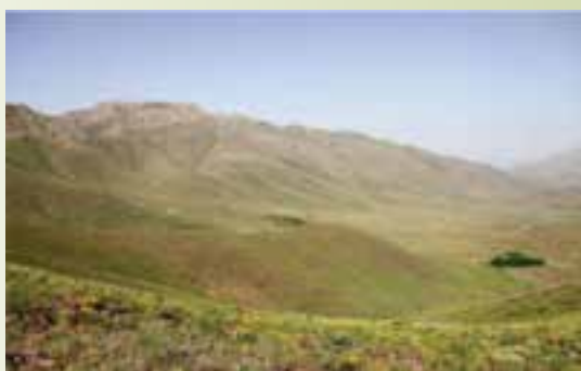
شکل ۷۴-۱- منطقه حفاظت شده لشگردر - ملایر

منطقه حفاظت شده لشگردر : این منطقه در جنوب شرقی شهر ملایر و در ۹۰ کیلومتری شهر همدان در محاصره ۱۴ روستای مجاور از جمله جوزان، مانیزان، فروز، ازناوله، زنگنه و احمد روغنی است و به لحاظ طبیعت مساعد از نظر آب، پوشش گیاهی و شرایط اقلیمی، همواره زیستگاه مناسبی برای جانوران و پرندگان است.