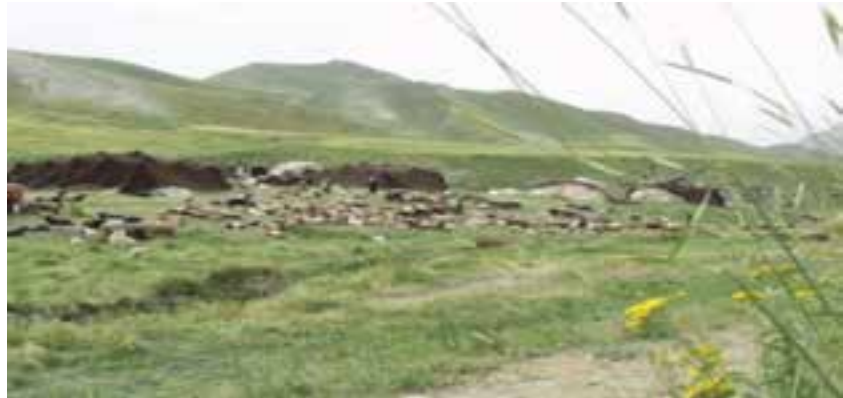
شکل ۵۷-۱- تغذیه دام عشایر