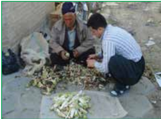
شکل ۵۸-۱- برداشت کنگر از مراتع