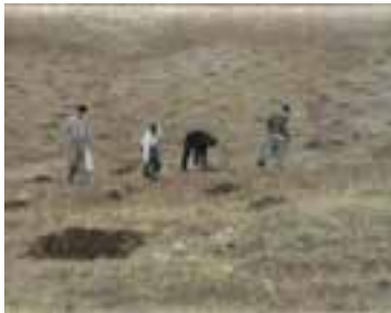
شکل ۱-۶۲- کپه‌کاری

عملیات مدیریتی: شامل حفاظت و قرق مراتع، تعیین سیاست‌های چرای تناوبی و مدیریت چرا و ترویج و آموزش بهره‌برداران.