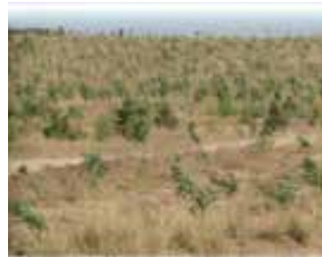
شکل ۱-۶۱- نهال‌کاری