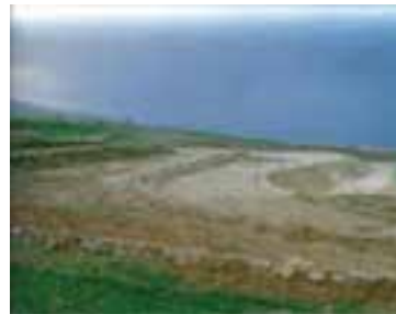
شکل ۱-۶۵- تراس‌بندی