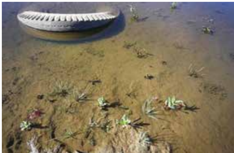
شکل ۸۰-۱- آلودگی آب ها بر اثر ریختن زباله به داخل آن

فاضلاب ها و زباله های شهری (خانگی و بیمارستانی)، کشاورزی و صنعتی، عمده ترین عوامل آلوده کننده آب های سطحی و زیرزمینی استان محسوب می شوند. سالانه بیش از ۵۰ میلیون مترمکعب فاضلاب شهری به عرصه های زیست محیطی وارد می شود. در فاضلاب های شهری باکتری های بیماری زای فراوانی وجود دارد که اگر باروش های مناسب نباشد یا دفع نگردند، در محیط باقی می ماند و خطرهای جدی برای انسان به بار می آورند. فاضلاب های کشاورزی نیز به دلیل همراه داشتن سموم آفت کش و کودهای شیمیایی به صورت محلول، در روان آب های کشاورزی باقی می ماند