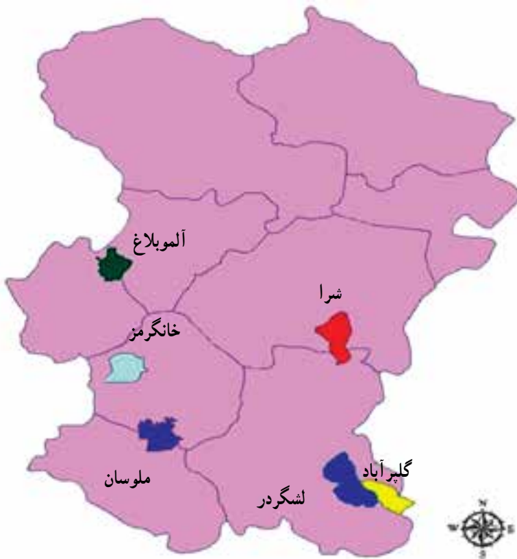
شکل ۱-۷۰- نقشه مناطق حفاظت شده استان

استان ما در حال حاضر، دارای ۶ منطقه مهم حفاظت شده است که عبارت‌اند از: گلپرایاد، خان‌گرمز، لشگردر، شرا، الموبلاغ، ملوسان و دو منطقه شکار ممنوع شیرین سو و و آق‌گل. (نقشه ۱-۷۰)