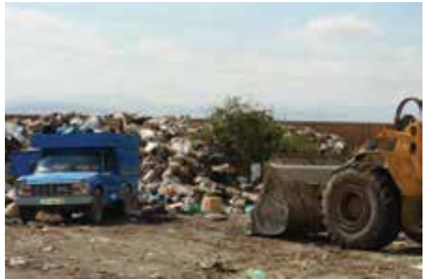
شکل ۷۳-۱- شیوه‌های نامناسب جمع‌آوری، انتقال و دفن زباله در استان