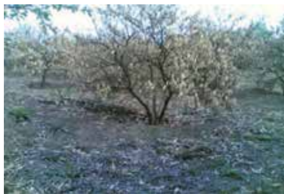
شکل ۶۹-۱- آناز سرمازدگی در باغات استان