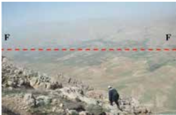
شکل ۶۳-۱- گسل سالوک از گسل‌های فعال استان

آخرین فعالیت گسل‌های استان مربوط به گسل امین آباد، در شمال غرب شهر اسفراین است که منجر به زمین لرزه‌ای با قدرت ۴/۵ درجه در مقیاس ریشتر شد. این زمین لرزه در نیمه شب جمعه ۱۸ آذرماه ۱۳۹۰ بر اثر فعال شدن قسمت شمال غربی این گسل رخ داد. این زلزله خسارات مالی و جانی نداشت ولی سبب ترس و وحشت مردم شد.