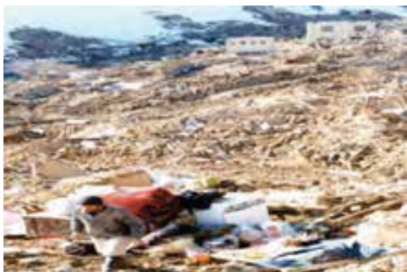
شکل ۱-۶۰- روستای ناوه پس از زلزله

زلزله: زلزله مخرب‌ترین پدیده طبیعی است که همه ساله خسارت‌های جانی و مالی زیادی به انسان‌ها وارد می‌کند. خراسان شمالی از استان‌های زلزله خیز کشور است. به علت فراوانی و طول زیاد گسل‌ها و جوان بودن چین خوردگی‌ها در استان، تاکنون زلزله‌های بسیاری در این استان به وقوع پیوسته است. از مخرب‌ترین آنها می‌توان به زمین لرزه‌های سال ۱۳۵۲ دهنه اجاق در شهرستان اسفراین و زلزله ۱۹ بهمن سال ۱۳۷۵ روستای ناوه در شهرستان بجنورد اشاره نمود. هر چند، زلزله‌ها، سبب تخریب ساختمان‌ها می‌شوند ولی رعایت نکات ایمنی در ساختمان سازی می‌تواند تا حدودی از خسارات آن بکاهد. تأثیر این نکته را در مقایسه شکل‌های (۱-۵۹) و (۱-۶۰) می‌توانید به خوبی مشاهده کنید.