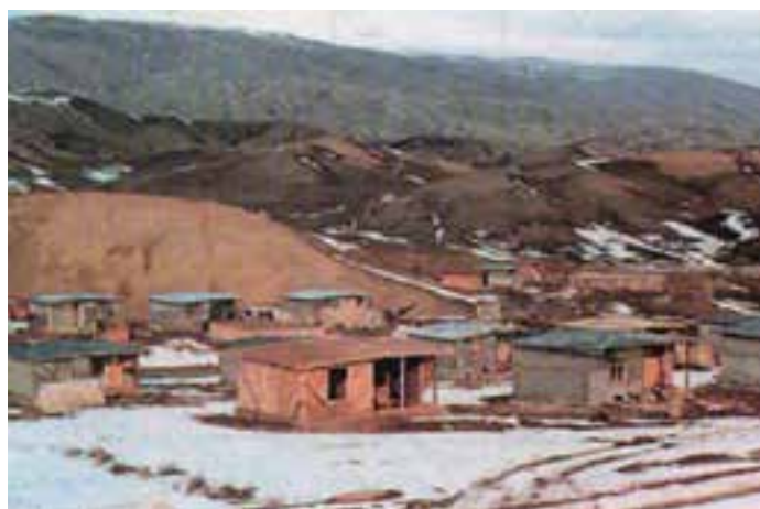
شکل ۱-۶۱- بازسازی روستای زلزله زده توپ چنار شهرستان مانه و سملقان با استفاده از اسکلت زوگالی (چوبی)