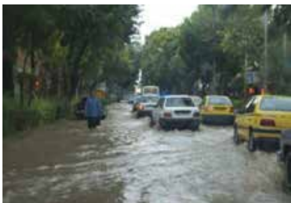
شکل ۶۵-۱- آب‌گرفتگی خیابان‌های شهر بهجنورد در سیلاب سال ۱۳۸۷

علل وقوع سیلاب در استان منشأ طبیعی و انسانی دارد. از مهم‌ترین دلایل طبیعی آن می‌توان به ذوب ناگهانی برف و یخ در کوهستان‌ها، بارش‌های رگباری، کم شدن پوشش گیاهی و شیب زمین و از مهم‌ترین عوامل انسانی می‌توان به عدم اعمال مدیریت صحیح در حوضه‌های آبخیز، برداشت غیر اصولی مصالح رودخانه‌ای، تجاوز به حریم رودخانه‌ها، توسعه شهرها و روستاها در عرصه‌های سیل‌گیر اشاره نمود.