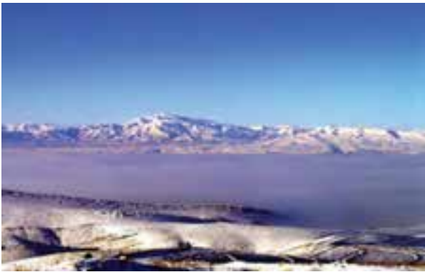
شکل ۷۱-۱- پدیده وارونگی دما در دشت بجنورد

آلودگی هوا: رشد بی‌رویه جمعیت، مکان‌یابی و گسترش نامناسب صنایع، افزایش روز افزون وسایل نقلیه موتوری، موقعیت جغرافیایی و محصور شدن برخی از شهرهای استان در میان کوه‌ها و پدیده وارونگی دما، باعث آلودگی هوای استان شده‌اند. در حال حاضر بیش از ۳۰۰ واحد صنعتی در استان مشغول فعالیت هستند. فعالیت این واحدها و شرایط طبیعی برخی از شهرهای استان سبب شده است این شهرها با مشکل آلودگی هوا مواجه شوند.