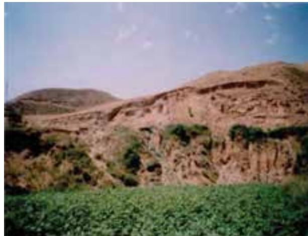
شکل ۶۷-۱- لغزش چرخشی در روستای اترآباد علیای بجنورد

سرمازدگی : به علت قرارگیری استان در مسیر اصلی ورود توده هوای سرد و خشک سیبری، در بعضی از سال‌ها، تشدید فعالیت زبانه این توده هوا در اوایل پاییز (سرمازدگی زودرس) و اوایل بهار (سرمازدگی دیررس)، سبب سرمازدگی ناگهانی محصولات باغی و زراعی شده و خسارات زیادی را به کشاورزان استان وارد می‌کند.