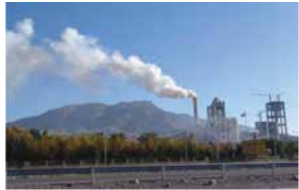
شکل ۷۰-۱- صنایع استان یکی از منابع آلودگی هوا

مسئولیت نظارت بر آلودگی هوا در استان بر عهده سازمان محیط زیست است. این سازمان جهت کاهش آلودگی هوا اقداماتی انجام داده است که از مهم‌ترین آنها می‌توان به موارد زیر اشاره نمود: