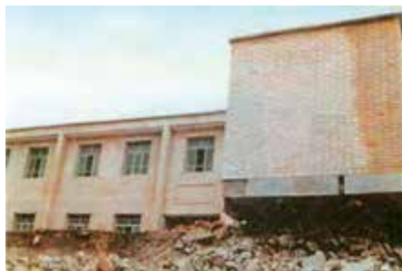
شکل ۱-۵۹- ساختمان دبستان روستای ناوه پس از زلزله