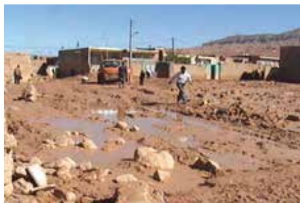
شکل ۶۴-۱- ورود سیلاب‌ها به مناطق مسکونی روستای فرتان اسفراین