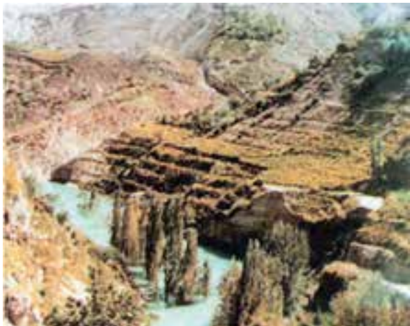
شکل ۶۸-۱- زمین لغزش در روستای اسطرخی شیروان