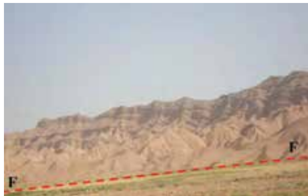
شکل ۶۲-۱- گسل امین آباد از گسل‌های فعال استان

سیل: بعد از زلزله، سیل مخرب‌ترین خطر طبیعی استان به حساب می‌آید. خراسان شمالی از نظر وقوع سیلاب در بین استان‌های کشور جایگاه دوم را دارد.