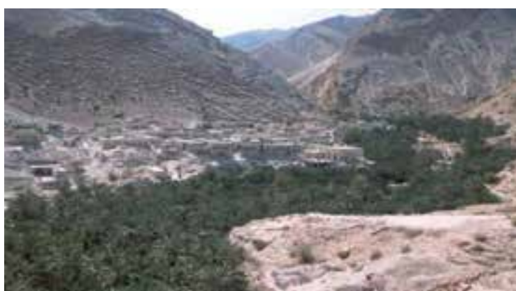
شکل ۲-۵- شکل روستای طولی و متمرکز