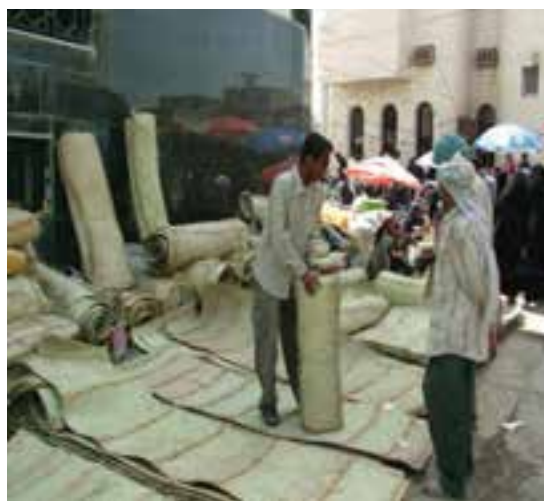
شکل ۲-۴- نمونه‌ای از منابع درآمد روستائیان استان