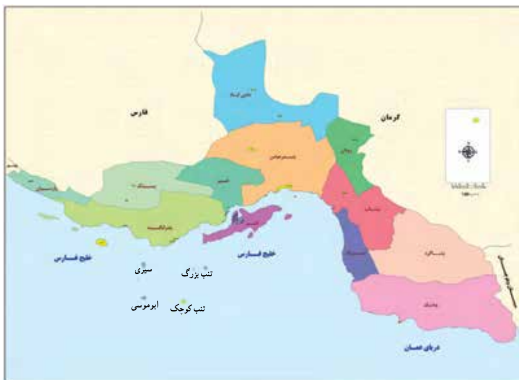
شکل ۱-۲- نقشه تقسیمات سیاسی استان هرمزگان به تفکیک شهرستان

استان هرمزگان بر اساس آخرین تقسیمات کشوری دارای ۱۳ شهرستان، ۳۴ شهر، ۸۵ دهستان، ۳۸ بخش و ۲۹۱۰ آبادی و ۱۴ جزیره است.