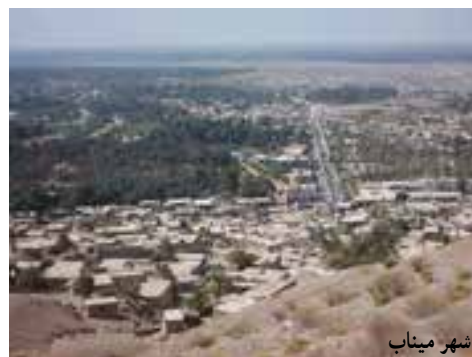
شکل ۲-۷- چشم اندازی از شهر اهوموسی، بندرعباس، میناب و قشم