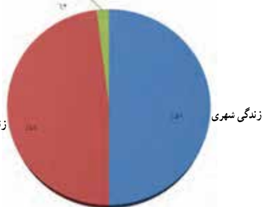
شکل ۲-۲- نمودار شیوه زندگی در هرمزگان در سال ۱۳۸۵ برحسب درصد