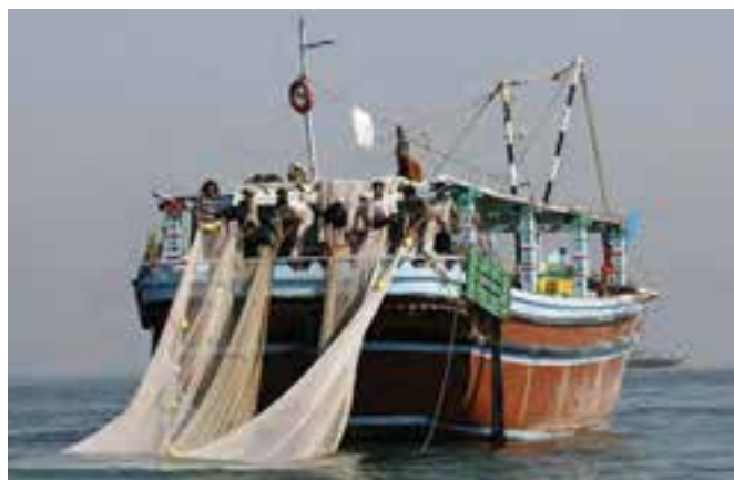
شکل ۱۰-۲- صیادی

مهمترین منابع در آمد جزیره نشینان: ویژگی‌های طبیعی جزایر، کمبود آب شیرین و عدم خاک حاصلخیز، نزدیکی آن‌ها به امارات متحده عربی و سهولت رفت و آمد موجب شده که شغل بیشتر جزیره نشینان خرید و فروش کالا، صیادی و دریانوردی باشد و همین عوامل باعث شده که در گذشته، گروهی از مردم این جزایر برای پیدا کردن کار مناسب و درآمد بیشتر جزیره را ترک نمایند؛ اما با اقداماتی که دولت در سال‌های اخیر انجام داده است مانند ایجاد مناطق آزاد تجاری، بازارچه‌های مرزی، دستگاه‌های آب شیرین‌کن، فروشگاه‌های زنجیره‌ای، بانک‌ها و غیره، تحولی در زندگی مردم زحمت‌کش بومی پیش آمده است که چشم‌انداز روشنی را در پیش‌رو خواهند داشت.