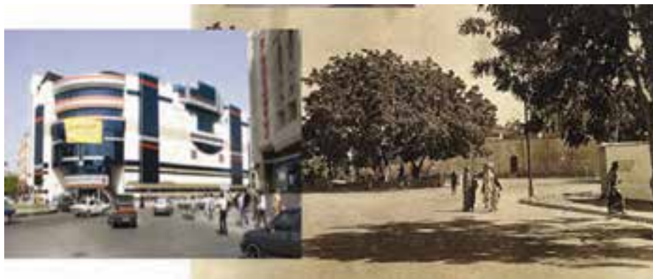
شکل ۲-۶- توسعه شهر بندرعباس (میدان ۱۷ شهریور)

به نظر شما شهرنشینی در استان نسبت به گذشته چه تفاوتی یافته است؟ به دو تصویر زیر که مربوط به نقطه‌ای از شهر بندرعباس است توجه کنید. چه عواملی سبب این تغییرات شده است؟