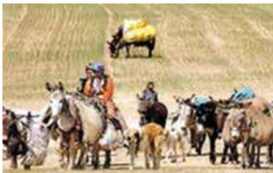
شکل ۲-۳- زندگی کوچ‌نشینی

استان هرمزگان به دلیل داشتن آب و هوای معتدل در فصل زمستان محل مناسبی برای قشلاق کوچ‌نشینان است. در استان هرمزگان تعداد عشایر کوچنده کم است و به حدود ۱۸۰۰۰ نفر می‌رسد که به دو صورت درون کوچ (منطقه بیلاقی آن‌ها داخل استان است) و برون کوچ (منطقه بیلاقی آن‌ها خارج از استان است) زندگی می‌کنند. بزرگترین ایل استان، ایل کوهشاهی است که بیلاق و قشلاق خود را در محدوده کوهشاه احمدی می‌گذرانند و دام‌های عشایر استان‌های کرمان و فارس نیز هنگام قشلاق از مراتع استان هرمزگان استفاده می‌کنند.