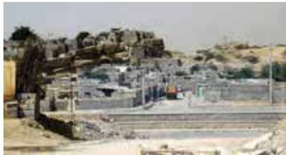
شکل ۱۱-۲- حاشیه‌نشینی در بندرعباس