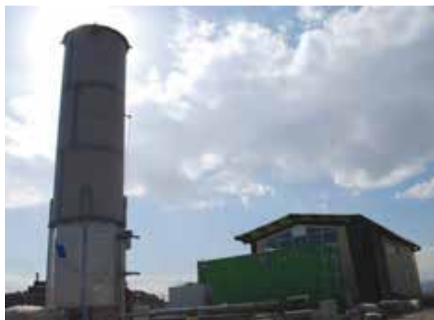
شکل ۶۴-۱- نیروگاه بیوگاز مشهد با تولید 600 کیلو وات ساعت برق

مؤثرترین راه کاهش مضرات و هزینه‌های دفع زباله، جداسازی در مبدأ است که از آلودگی ناشی از مخلوط شدن و فعل و انفعالات شیمیایی پیشگیری می‌نماید و تبدیل آن به محصولات جدید و قابل استفاده را در بر دارد. البته این امر نیازمند مشارکت وسیع شهروندان است. تولید روزانه 180^{\circ} تن زباله در شهر مشهد و هزینه‌های سنگین مالی و زیست محیطی برای دفن و یا سوزاندن آن باعث شده است که بازیافت، تولید کود (کمپوست) و احداث کارخانه‌های بیو گاز و... در استان مورد توجه قرار گیرد.