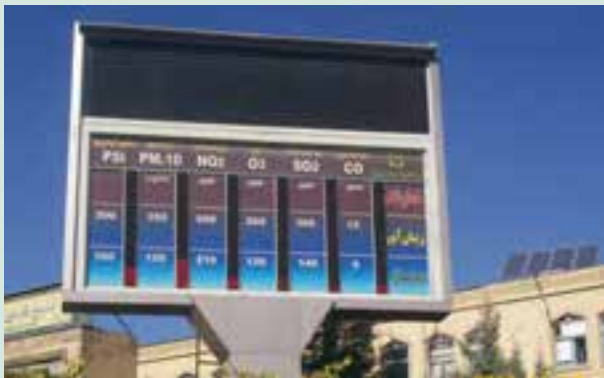
شکل ۶۱-۱- ایستگاه پایش کیفیت هوا- صدف (ترافیکی)- بلوار وکیل آباد- جمعه ۱۳۸۹/۹/۲۶

آلاینده‌هایی که در هوای شهر از طریق سوخت خودروها و سایر موارد تولید می‌شوند بیشتر شامل: منواکسید کربن CO، دی اکسید نیتروژن NO 2 ، دی اکسید گوگرد SO 2 ، ازن O 3 و ذرات معلق (Dust) است. اداره کل حفاظت محیط‌زیست در سطح شهر از طریق ۱۲ ایستگاه پایش کیفیت هوا اقدام به جمع‌آوری اطلاعات از گازها و ذرات معلق در هوای شهر می‌نماید. شکل ۶۱-۱ برخی از این آلاینده‌ها را نشان می‌دهد.