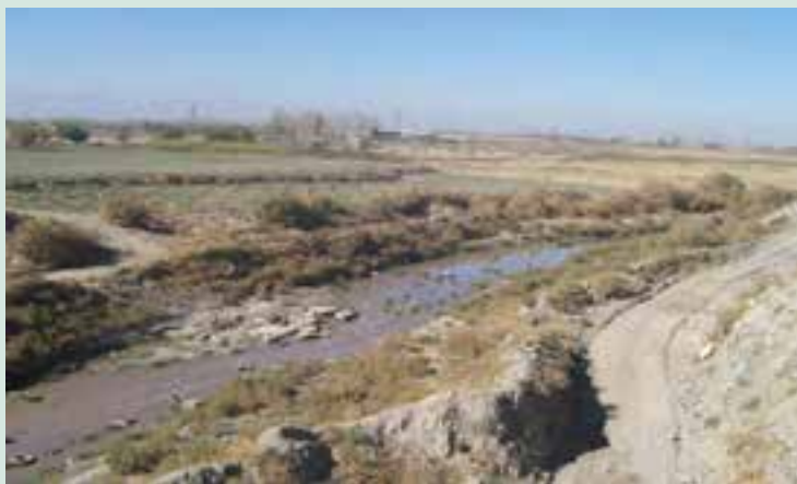
شکل ۶۲-۱- بخشی از مسیر کشف رود در حاشیه شهر مشهد

رودخانه کشف رود که در گذشته مظهر پاکي و به دریا معروف بود، اکنون با ورود فاضلاب‌های انسانی و صنعتی حاشیه شهر مشهد به این رودخانه، تبدیل به یکی از مهم‌ترین مظاهر آلودگی زیست محیطی منطقه شده است. فاضلاب‌های صنعتی حاصل بخشی از فعالیت‌های شهرک صنعتی، واحدهای آبکاری، صنایع پوست و چرم، واحدهای قالب‌سویی و فاضلاب‌های خانگی مسیر رودخانه هستند که به‌طور غیر قانونی به بستر آن وارد شده و باعث آلودگی شدید آب شده‌اند. متأسفانه برخی کشاورزان منطقه در حاشیه این رودخانه آلوده برای آبیاری زمین‌های کشاورزی به ویژه صیفی‌کاری استفاده می‌کنند و محصولات حاصل از این شیوه نادرست آبیاری در نهایت وارد بازار مصرف و به خصوص شهر مشهد می‌شود.