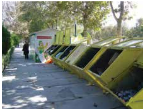
شکل ۶۳-۱- ایستگاه‌های ثابت جمع‌آوری زباله مشهد

بازیافت زباله باعث کاهش آلودگی‌های زیست محیطی، حفظ منابع و ذخایر زیرزمینی، کاهش وابستگی به خارج در زمینه کالا و مواد اولیه و به‌طور کلی جلوگیری از اتلاف منابع و سرمایه‌های ملی می‌شود.