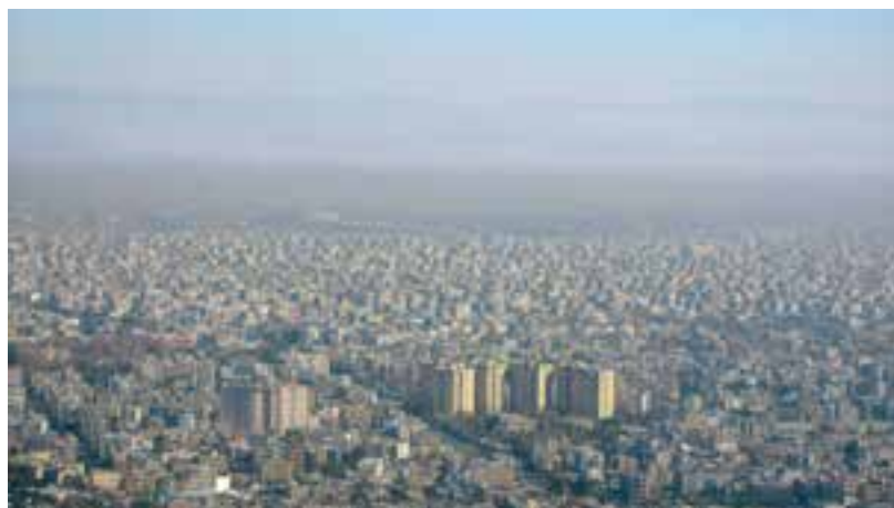
شکل ۶۰-۱- نمای از آلودگی هوا در شهر مشهد

آلودگی هوا بیشتر در شهرها و به ویژه مشهد مطرح است، زیرا بیش از ۵۰ درصد جمعیت استان را در خود جای داده است. منابع آلودگی هوای شهرها عبارتند از: الف) منابع ایستا: واحدهای صنعتی، کارگاه‌ها، مناطق مسکونی و تجاری.