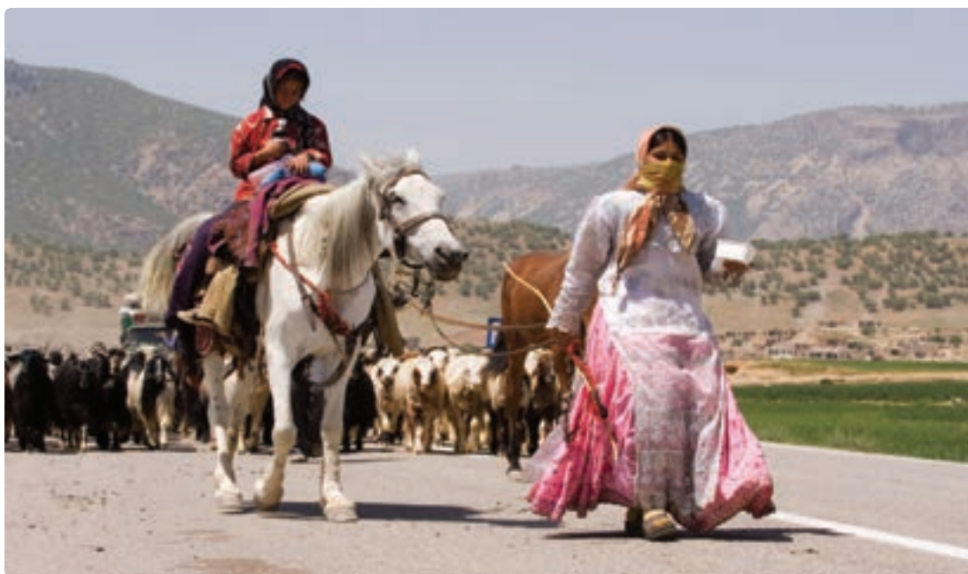
شکل ۱-۷- کوچ عشایر در استان بوشهر

همچنین گستره وسیعی از استان بوشهر قلمرو زیست و محل اسکان دائمی و فعالیت عشایر است. اگرچه جمعیت عشایری نسبت کمی از جمعیت استان را در بر می‌گیرد، ولی به اقتضای شیوه زیست این گروه، بخش عظیمی از خاک استان قلمرو زیست طوایف مختلف ایل قشقایی است. شهرستان دشتستان بیشترین جمعیت عشایری استان را در خود جای داده است.