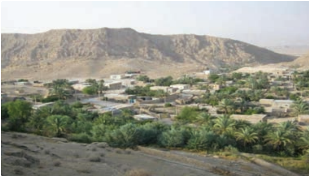
شکل ۵-۷- روستای کوهستانی سرمک

— خاک : وجود خاک‌های شور در بیشتر نقاط استان مانع جدی در استقرار روستاهای استان بوده است. دشت‌های دامنه‌ای به دلیل نداشتن محدودیت‌های خاک نواحی کوهستانی و دشت‌های پست از شرایط مساعد و مناسب طبیعی برخوردار و امکان استقرار جمعیت را فراهم آورده‌اند.