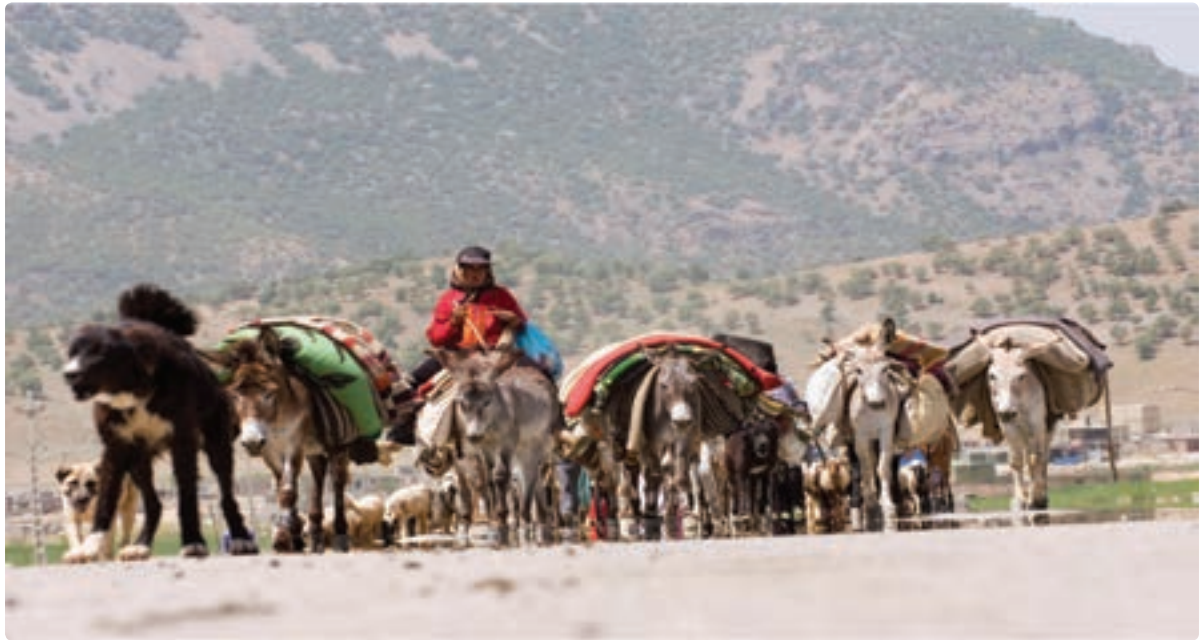
شکل ۲-۷- کوچ عشایر استان

شغل اصلی عشایر علاوه بر دامداری، تولید صنایع دستی، زراعت و باغداری می‌باشد. مناطق استقرار عشایر در استان به ترتیب جمعیت، شهرستان‌های دشتستان - دشتی - تنگستان - دیروجم را در بر می‌گیرد. مناطق بیلاقی عشایر استان بوشهر در استان فارس شهرستان‌های اقلید، صغاد، بهمن، مرودشت و شیراز، در استان اصفهان سمیرم و شهرضا و در استان چهارمحال و بختیاری بروجن و بلداجی است.