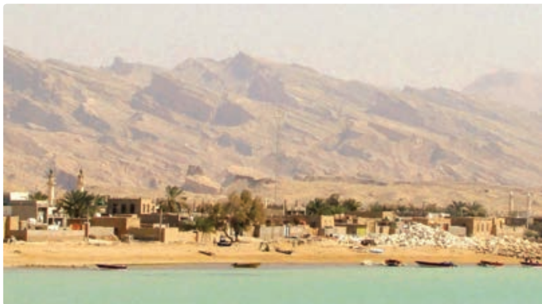
شکل ۶-۷- تصویری از روستای ساحلی خورشهاب

— راه ارتباطی: بیشتر روستاها به موازات شبکه خطوط ارتباطی اصلی در سطح استان شکل گرفته‌اند، به طوری که حیات روستاهای جاده‌ای به رفت و آمد در راه‌های ارتباطی موجود وابسته‌اند و فعالیت‌های خدماتی نقش اساسی در توسعه و رونق این روستاها دارد.