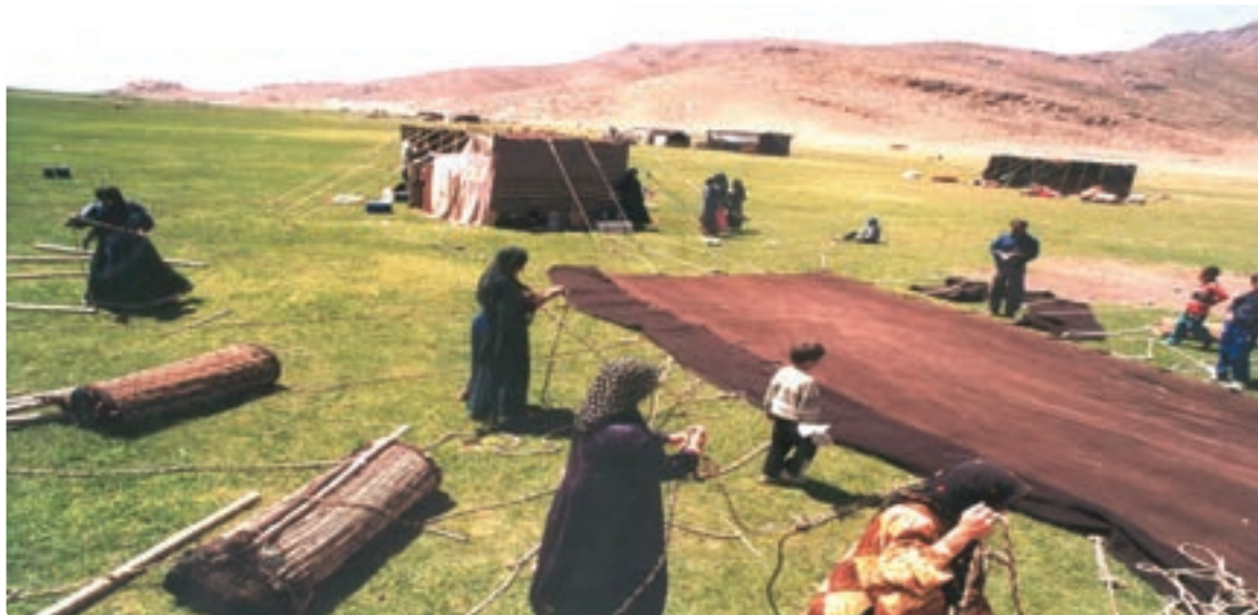
شکل ۴-۷- سیاه جادر از صنایع دستی عشایر قشقایی