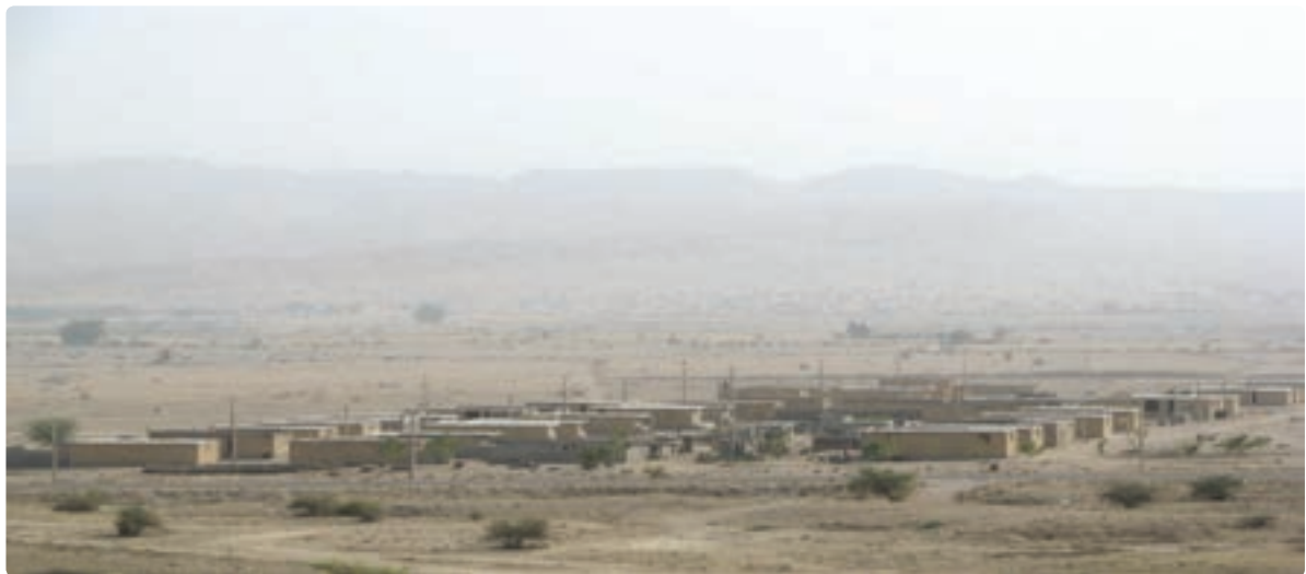
شکل ۳-۷- اسکان عشایر در ایل شهر بوشکان

شغل اصلی عشایر علاوه بر دامداری، تولید صنایع دستی، زراعت و باغداری می‌باشد. مناطق استقرار عشایر در استان به ترتیب جمعیت، شهرستان‌های دشتستان - دشتی - تنگستان - دیروجم را در بر می‌گیرد. مناطق بیلاقی عشایر استان بوشهر در استان فارس شهرستان‌های اقلید، صغاد، بهمن، مرودشت و شیراز، در استان اصفهان سمیرم و شهرضا و در استان چهارمحال و بختیاری بروجن و بلداجی است.