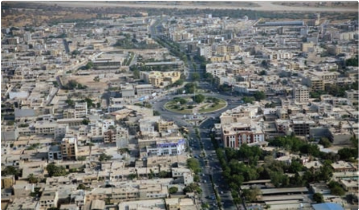
شکل ۷-۷- نمایی از شهر بوشهر

قدیمی‌ترین نشانه‌های به‌دست آمده از سکونت انسان در سرزمین بوشهر به دوران حکومت ایلامی‌ها و تمدن بین‌النهرین برمی‌گردد. منطقه تجاری بوشهر در آن زمان دهکده‌ای به نام لیان بود. از دوره هخامنشیان نیز آثار با ارزشی در شهرستان دشتستان کشف شده است. در زمان اردشیر بابکان شهر رام اردشیر در دو فرسنگی شهر بوشهر بنا گذاشته شد که اکنون به نام ریشهر معروف است. نحوه شکل‌گیری مراکز شهری استان بیانگر استقرار جمعیت و فعالیت‌های اقتصادی وابسته به منابع آب و فعالیت‌های مرتبط با دریا در ساحل می‌باشد. شکل‌گیری این مراکز از شمالی‌ترین نقطه استان تا جنوبی‌ترین آن که عمدتاً بر روی نوار ساحلی، دشت‌ها و کوهپایه‌ها بوده که نشانگر توزیع مناسب آنها از نظر استقرار و فاصله بین این مراکز است. شهر بوشهر به‌عنوان مرکز استان و دیگر شهرهای ساحلی از دیرباز مراکز تجارت و فعالیت‌های بندری بوده‌اند.