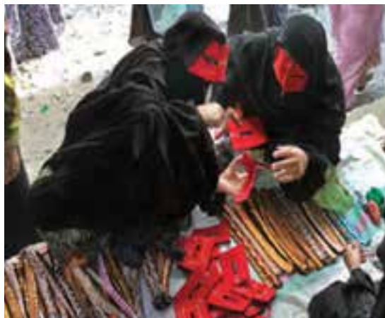
شکل ۳-۳- نمونه ای از صنایع زینتی