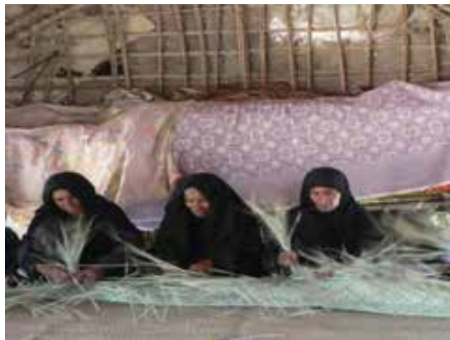
شکل ۱۲-۳- صنایع حصیربافی

یکی دیگر از صنایع حصیری پروند است. پروند طناب بسیار محکم و کلفت از برگ نخل خرماست که معمولاً باغبانان در نخلستان‌ها برای بالا رفتن از درخت خرما از آن استفاده می‌کنند. پروند از مقاومت بسیار بالایی برخوردار است که می‌توان آن را به صورت کاملاً حساب شده، تهیه و برای بستن شناورهای کوچک به اسکله استفاده کرد. از جمله محاسن آن، این است که در برابر آب و آفتاب مقاوم می‌باشد.