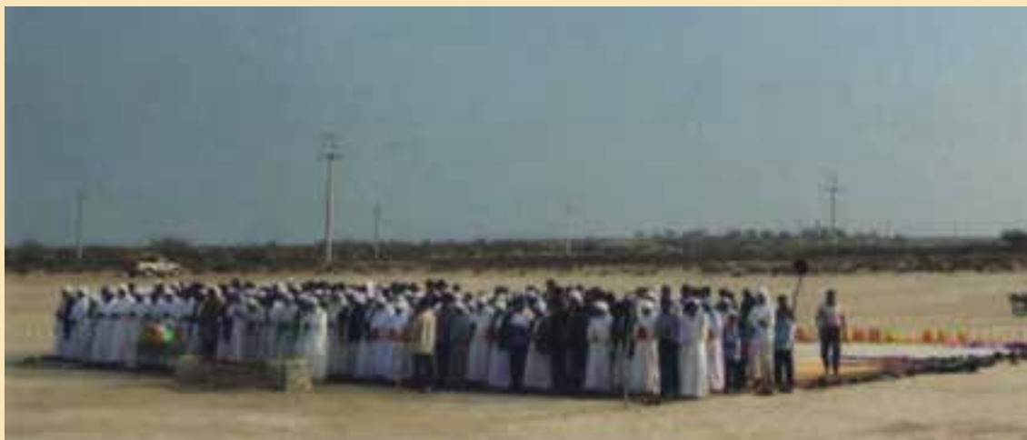
شکل ۵-۳- قبلهٔ دعا) نماز باران

به هنگام خشکسالی و نباریدن باران، ریش سفیدان و بزرگان، با شور و مشورت با یکدیگر و با صلاحدید روحانی محلی یک روز جمعه را به اتفاق مردان و کودکان در یک نقطه‌ای معین، نماز باران را به جا می‌آورند. آیا می‌دانید علت همراهی کودکان در این مراسم چیست؟