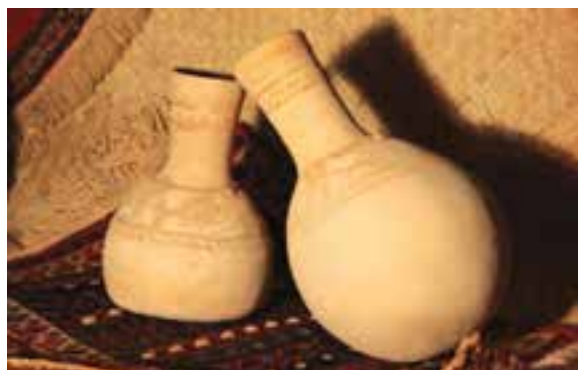
شکل ۱۱-۳- صنایع سفالگری

انواع صنایع سفالگری: یکی از صنایع سفالگری کوزه است، که در گویش محلی جهله می‌گویند و جالب‌تر اینکه با استفاده از آن نوعی ساز را با هنرمندی هر چه تمام‌تر می‌نوازند که این خود نشان از هنرمندی و خلاقیت مردمان این مرز و بوم دارد. در گذشته که مخازن فایبر گلاس و فلزی نبود، آب را در منازل در خمره نگهداری می‌کردند.