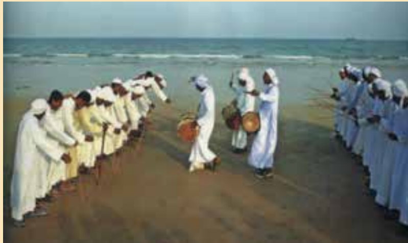
شکل ۶-۳- جشن صیادی