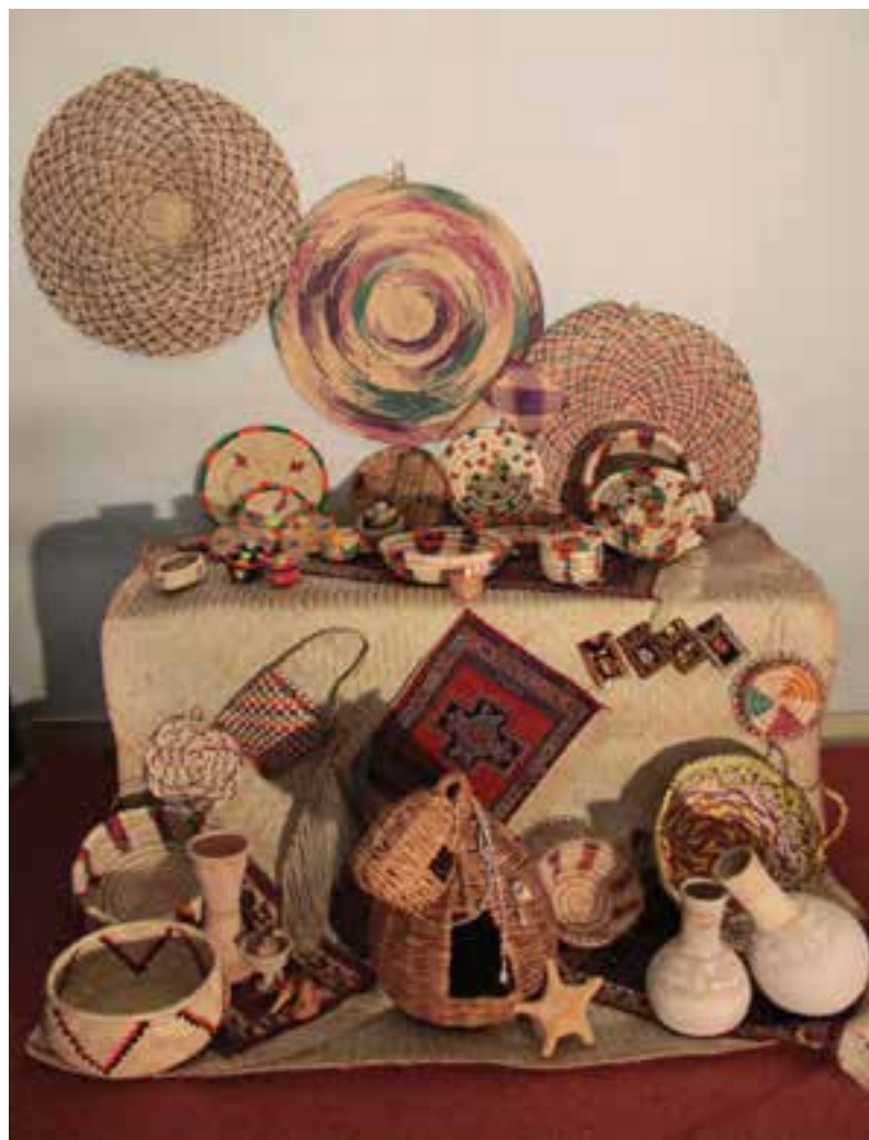
شکل ۱۰-۳- نمونه‌هایی از صنایع دستی استان

صنعت سفالگری: از جمله قدیمی‌ترین آثار تاریخی به‌جا مانده از گذشتگان ظروف سفالی است. در شرق استان هرمزگان دستان توانای هنرمندان این خطه ظروف سفالی زیبا و کارآمد را از خاک می‌سازند که در زندگی روزمره مورد استفاده بوده است.