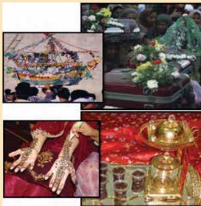
شکل ۴-۳- نمونه‌ای از آیین حنابندان و ساخت بران به شیوه سنتی در استان

مراسم عروسی در هرمزگان یکی از پرشورترین و زیباترین رویدادهای زندگی است که ترکیبی از سنن و ارزش‌های مذهبی به خود گرفته است. امروزه گسترش ارتباطات، مهاجرپذیر بودن استان و میل مردمان به تحول باعث شده که تغییرات هر چه کند و بطئی نه تنها در این مراسم بلکه در سایر ابعاد فرهنگی و اجتماعی ایجاد شود. مراسم عروسی در هرمزگان چندین مرحله دارد که عبارت‌اند از: انتخاب همسر و خواستگاری، عقد کنان، حنابندان، ساخت بران و عروسی که هریک با آداب و شیوه‌های خاصی برگزار می‌شوند. عروسی در استان به روایت تصویر