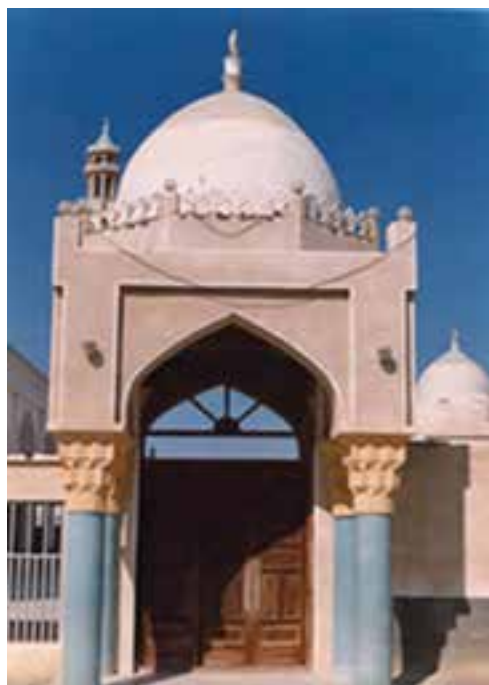
شکل ۱-۳- مسجد شیخ برخ، جزیرهٔ قسم

دین مردم هرمزگان اسلام است و آن‌ها پیرو دو مذهب شیعه و سنی‌اند. پیروان این دو مذهب از دیر باز با خوشی و همدلی در کنار هم زندگی می‌کنند و معنای وحدت و همدلی میان آنان را می‌توان به طور مشهود احساس کرد. اسلام برای اولین بار در قرن دوم از طریق جزیره قسم به نواحی ساحلی جنوبی وارد گردید. قدیمی‌ترین بنای اسلامی در این جزیره، مسجد شیخ برخ در روستای کوشه است. این مسجد یک بار بر اثر زلزله ویران شد، اما در اواخر قرن سوم بازسازی شد. به‌طور کلی، مساجد این استان بسیار با شکوه بنا شده‌اند که توجه هر تازه‌واردی را به خود جلب می‌کنند و این نشان از اعتقادات قلبی و باورهای دینی عمیق مردم مسلمان هرمزگان دارد.