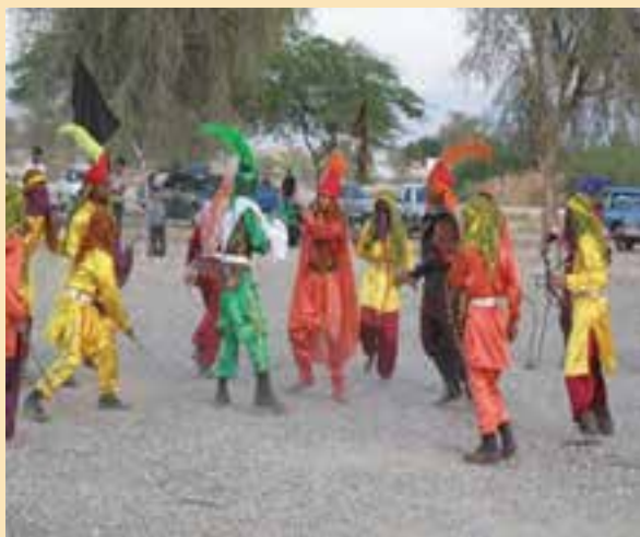
شکل ۹-۳- نمونه ای از مراسم تعزیه و علم گردانی

بازی های محلی : عموماً بازی ها در استان دارای هدف و متناسب با موقعیت های جغرافیایی هر منطقه هستند. بازی های محلی متنوعی در استان وجود دارد؛ مانند : زمازا، هفت سنگا، سنگ چلیکا و ... که با هدف تقویت قدرت جسمانی، تمرکز، کنترل و هماهنگی فکر و اعضای بدن انجام می شوند.