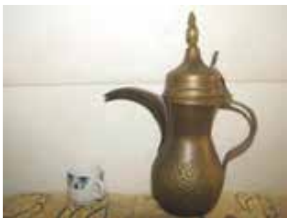
دله قهوه (قهوه جوش)