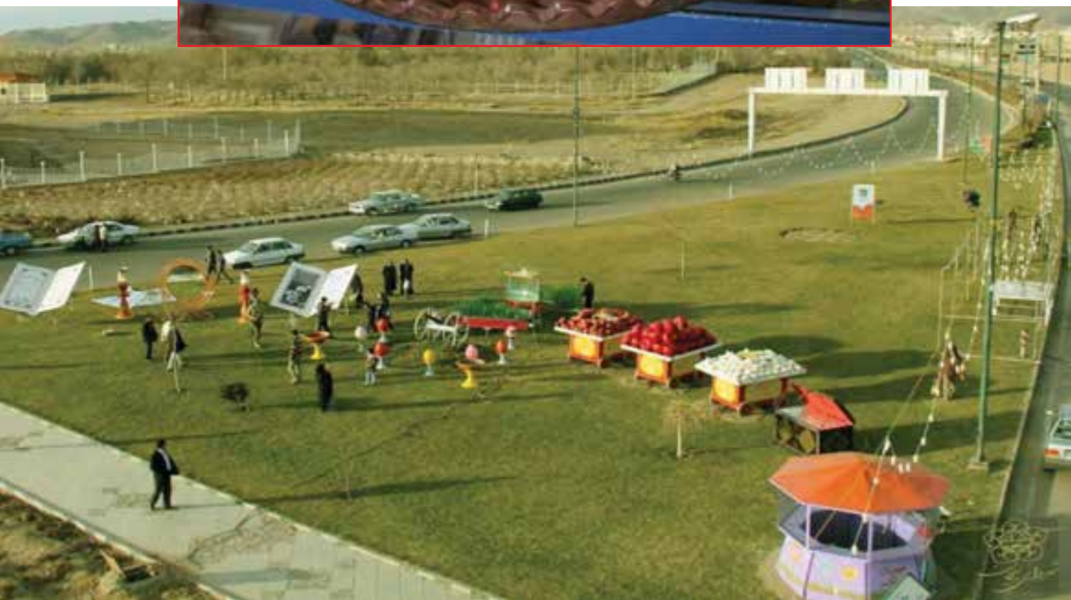
شکل ۱-۳- سفره هفت سین همراه با صنایع دستی بومی استان