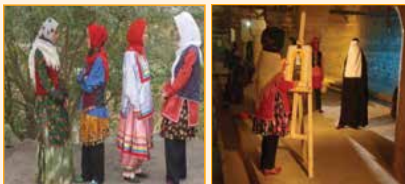
شکل ۳-۴- نمونه‌ای از لباس‌های محلی استان

نیم ساق: نوعی جوراب شلواری است که در میهمانی‌ها و مسافرت‌ها استفاده می‌شود. هم‌زمان با رشد صنعتی و گسترش شهرنشینی به خصوص در شهرهای بزرگی چون شهر زنجان پوشش‌های یاد شده تغییر یافته و حتی برخی از آنها به فراموشی سپرده شده‌اند. در حال حاضر در شهرها و روستاهای بزرگ‌تر استان، پوشش غالب زنان و مردان را همان پوشش معمولی رایج در کل کشور تشکیل می‌دهد و برای دیدن پوشش‌های محلی بایستی به روستاها و شهرهای کوچک استان که نفوذ صنعتی کمتر بوده مراجعه کرد.