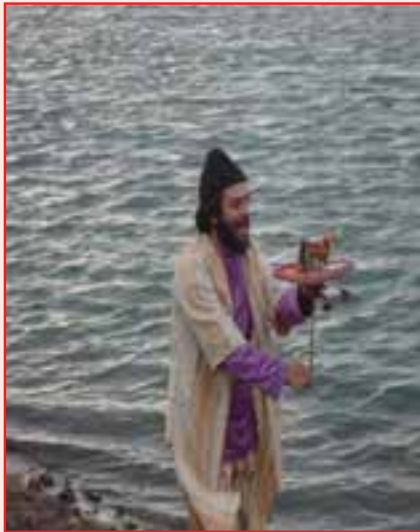
شکل ۲-۳- نمایش تکم گردانی