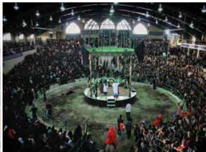
شکل ۳-۷- مراسم تعزیه در شهر ارمغان‌خانه