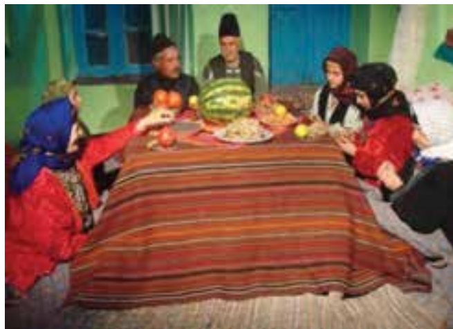
شکل ۳-۳- نمونه ای از مراسم شب چله در روستا

یلدا به عنوان طولانی ترین شب سال که به چله نیز معروف است، در استان زنجان هم مانند سایر استان ها از حال و هوای ویژه ای برخوردار است. به طوری که اهالی استان، برای پذیرایی و برگزاری مراسم خاص آن با خرید آجیل، هندوانه، و میوه های مختلف و شیرینی به استقبال این شب طولانی می روند. همچنین خانواده داماد برای عروس، با تهیه هدایایی همراه با خوراکی های این شب که در مجموعه ای به نام «خونچا» گردآوری کرده اند به دیدار خانواده عروس می روند. در این شب بزرگترها با شاهنامه خوانی و قصه های شیرین ایرانی اعضای خانواده را سرگرم کرده و این شب را گرمی می دارند.