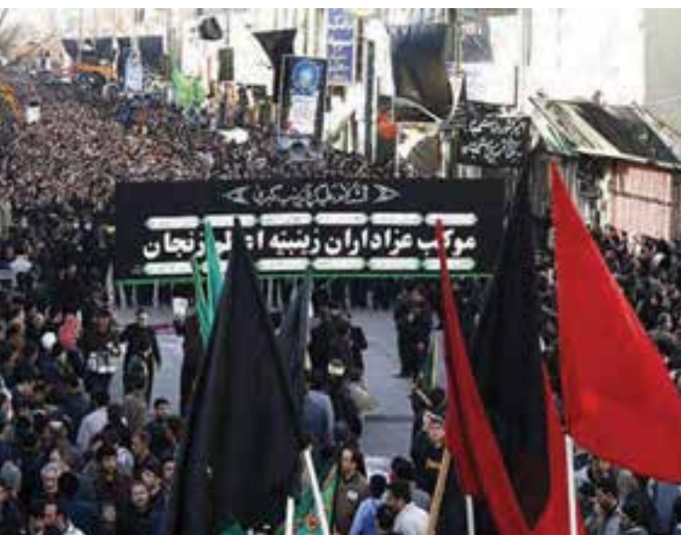
شکل ۳-۸- عزاداری زینبیه اعظم زنجان