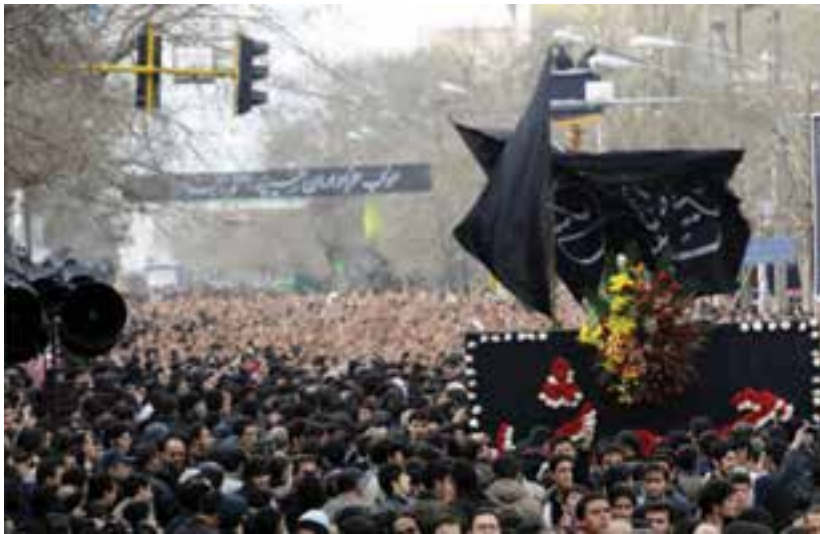
شکل ۳-۶- مراسم عزاداری حسینیه اعظم زنجان

و خیل عظیمی از شیعیان جهان نظاره‌گران هستند. این مراسم در اسفند سال ۱۳۸۷ (هشتم محرم سال ۱۴۳۰ هجری قمری) به‌عنوان دهمین میراث معنوی کشور به ثبت ملی رسیده است. شبییه‌خوانی یا تعزیه: نوع دیگری از عزاداری‌های رایج در استان است که مردم استان در شهرها و خصوصاً در اکثر روستاها با اجرای آن به عزاداری ائمه اطهار علیهم السلام می‌پردازند. شهر ارمغان‌خانه در اجرای تعزیه در استان شهرت خاصی دارد.