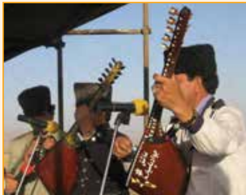
شکل ۵-۳- موسیقی محلی استان

موسیقی بومی استان زنجان از گنجینه موسیقی فولکلوریک و کلاسیک آذری تأثیر پذیرفته است و در حال حاضر نیز وجه غالب ترکیب موسیقی بومی، به‌ویژه مناطق روستایی استان را تشکیل می‌دهد. پیوستگی فرهنگی و قومی مردم استان با مردم آذری زبان از یک‌سو و ارتباط آن با منطقه‌هایی، غیر از زبان آذری از سوی دیگر، زمینه شکل‌گیری نوعی از موسیقی محلی ویژه را فراهم آورده است، که به موسیقی زنجانی معروف