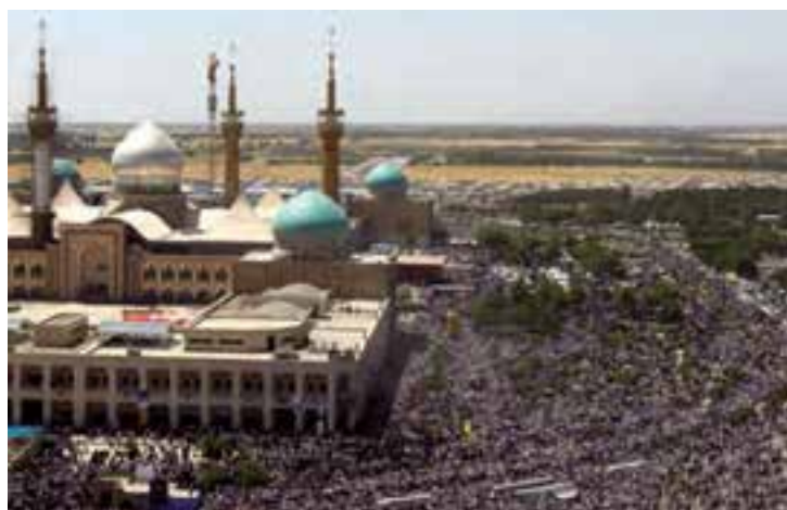
شکل ۱۷-۴- حرم مطهر امام خمینی (ره)

اکنون نیز جای آن دارد که با پاس داشتن خون شهدای گرانقدر، حفظ دستاوردهای رشادت های آن عزیزان و ادامه راه آن ها، رضایت خداوند بزرگ را نیز فراهم آوریم.