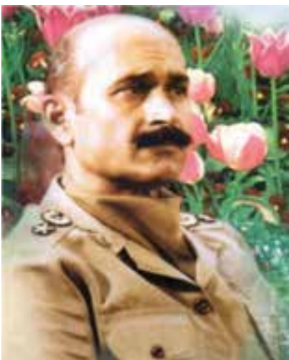
شکل ۱۰-۴- شهید فلاهی

از دیگر کمک‌های مردمی به رزمندگان علاوه بر اهدای کالا، می‌توان به اهدای خون نیز اشاره کرد. مردم هر وقت احساس می‌کردند به خون آن‌ها نیاز است، دریغ نمی‌کردند. همچنین، آنان با شرکت فعال در راهپیمایی‌ها به مناسبت‌های مختلف، به رغم بمب‌گذاری‌ها و حملات هوایی دشمن، موجب تقویت روحیه رزمندگان می‌شدند و دشمنان را مأیوس می‌کردند.