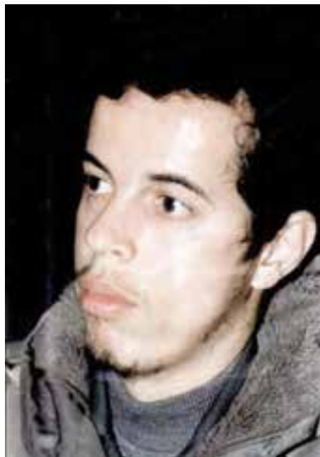
شکل ۱۲-۴- شهید حسن باقری

از روحانیان ممتاز می‌توان از مرحوم آیت‌الله طالقانی یاد کرد. او شکنجه‌های بسیاری در زندان طاغوت کشید و از یاران امام خمینی (ره) و اولین امام جمعه تهران پس از انقلاب بود. آیت‌الله طالقانی شاگردان بسیاری برای مبارزه با رژیم ستم‌شاهی تربیت کرد که شهید چمران یکی از کسانی بود که در مجالس درس ایشان شرکت می‌کرد.