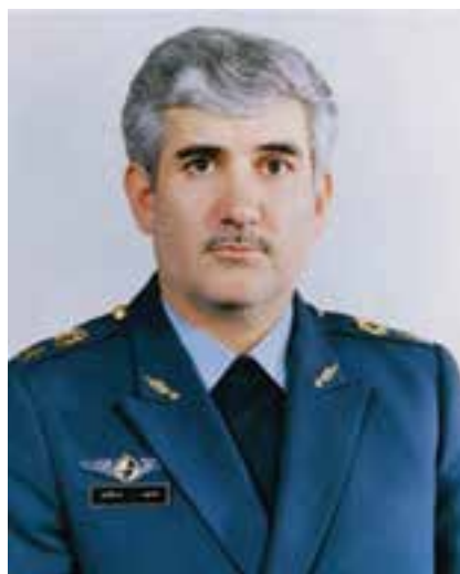
شکل ۹-۴- شهید ستاری