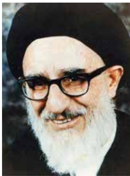
شکل ۱۴-۴- مرحوم آیت‌الله طالقانی