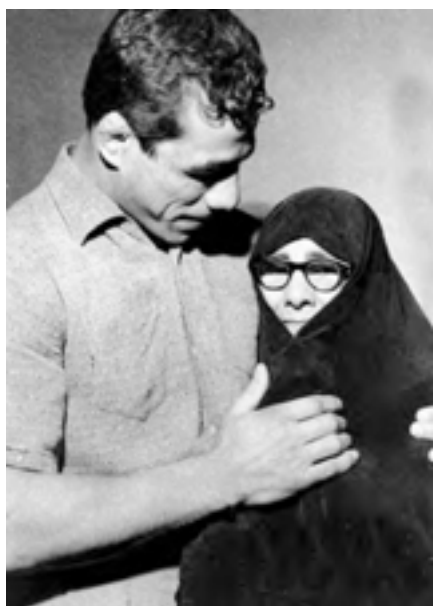
شکل ۱۵-۴- جهان پهلوان تختی

از روحانیان ممتاز می‌توان از مرحوم آیت‌الله طالقانی یاد کرد. او شکنجه‌های بسیاری در زندان طاغوت کشید و از یاران امام خمینی (ره) و اولین امام جمعه تهران پس از انقلاب بود. آیت‌الله طالقانی شاگردان بسیاری برای مبارزه با رژیم ستم‌شاهی تربیت کرد که شهید چمران یکی از کسانی بود که در مجالس درس ایشان شرکت می‌کرد.