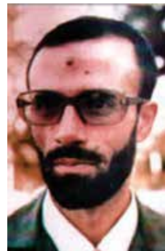
شکل ۸-۴- شهید کلاهدوز

شخصیت‌های برجسته‌ی زیادی را می‌توان از تهران نام برد که سنگرهای خود را در مجلس شورای اسلامی، مدرسه و... ترک کردند و به جبهه‌ها شتافتند و به درجه رفیع شهادت نائل آمدند؛ از آن جمله می‌توان شهید مصطفی چمران را نام برد. همچنین از میان سرداران سپاه و ارتش نیز افراد برجسته‌ای بودند که با وجود مسئولیت‌های کلان کشوری، سنگرها را بر صندلی‌ها ترجیح دادند و همچون سایر رزمندگان به خطوط مقدم جبهه رفتند؛ از جمله تیمسار ولی‌ا... فلاهی، شهید ستاری، شهید حسن باقری، شهید کلاهدوز و شهید سید مرتضی آوینی (شهید اهل قلم) روایتگر «روایت فتح».