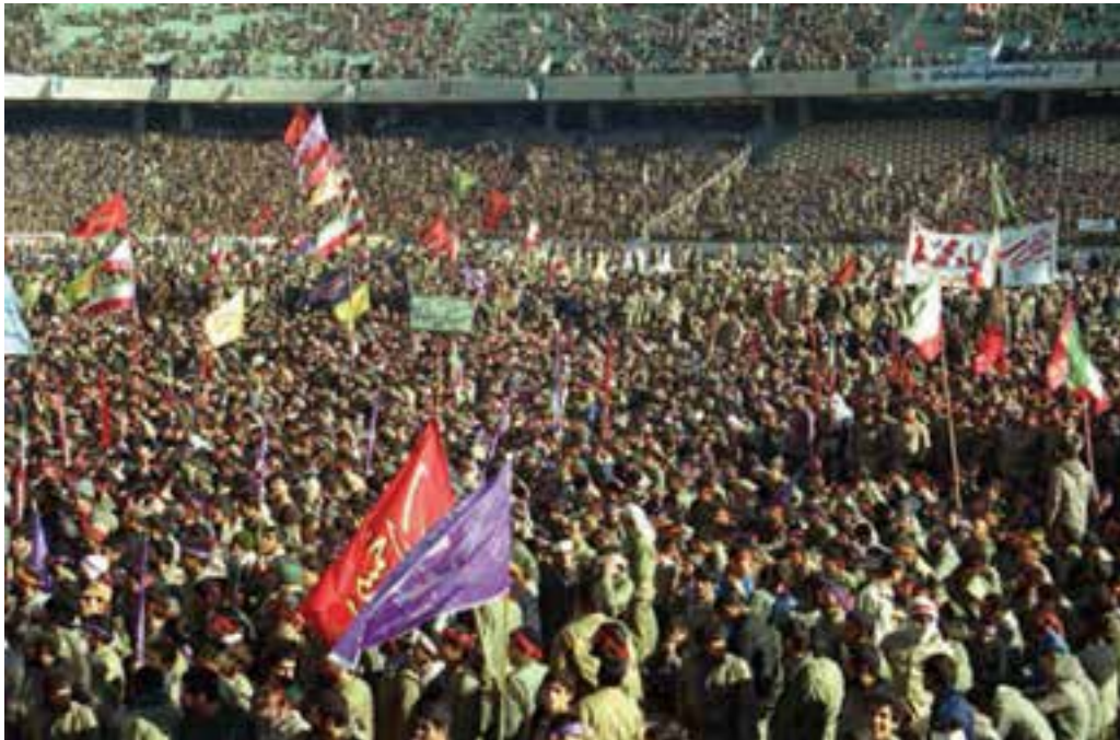
شکل ۷-۴. اعزام سراسری یکصد هزار نفری سپاه حضرت محمد (ص) از شهر تهران

شهر تهران به دلیل مرکزیت سیاسی، نقش بسیار ارزشمندی در دفاع از کیان اسلامی در دوران هشت سال دفاع مقدس بر عهده داشت. استان تهران اگرچه از نظر جغرافیایی دور از مرزها به سر می‌برد، ولی به واسطه پایتخت بودن و پشتیبانی خطوط جبهه، تقریباً مانند شهرهای مرزی مورد حملات هوایی قرار می‌گرفت. تهران به دلیل برخورداری از استعدادهایی در زمینه جذب و انتقال نیرو نسبت به سایر شهرها موقعیت ویژه‌ای داشت، به همین جهت، از اولین شهرهایی بود که در آغاز جنگ تحمیلی مورد حمله قرار گرفت. وجود پادگان‌های متعدد و فرودگاه‌های نظامی، خود استعداد بالقوه‌ای برای جذب نیروهایی شده بود که در بدو پیروزی انقلاب به دامن مردم پناه آورده بودند و پس از آغاز جنگ، عمده آن‌ها به پادگان‌ها برگشتند و به دفاع از سرزمین مقدس خود پرداختند. استان تهران با برخورداری از جمعیت کثیری نسبت به سایر استان‌ها و دارا بودن پادگان‌ها و مراکز دفاعی متعدد، به طور طبیعی نقش بسیار خطیری در دفاع از میهن اسلامی بر عهده داشت. با آغاز جنگ تحمیلی علیه جمهوری نوپای اسلامی، حضور داوطلبانه و فعال نیروهای مردمی، بسیاری از مشکلات را حل کرد. علاوه بر آن، حضور ارزشمند نیروهای مردمی در قالب نیروهای داوطلب، از پایگاه‌های بسیج ادارات و مساجد نیز شکوه دیگری از این عظمت را نشان داد که اوج آن را در اعزام سراسری یکصد هزار نفری سپاه حضرت محمد (ص) شاهد بودیم.