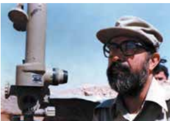
شکل ۱۱-۴- شهید دکتر مصطفی چمران

شخصیت‌های برجسته‌ی زیادی را می‌توان از تهران نام برد که سنگرهای خود را در مجلس شورای اسلامی، مدرسه و... ترک کردند و به جبهه‌ها شتافتند و به درجه رفیع شهادت نائل آمدند؛ از آن جمله می‌توان شهید مصطفی چمران را نام برد. همچنین از میان سرداران سپاه و ارتش نیز افراد برجسته‌ای بودند که با وجود مسئولیت‌های کلان کشوری، سنگرها را بر صندلی‌ها ترجیح دادند و همچون سایر رزمندگان به خطوط مقدم جبهه رفتند؛ از جمله تیمسار ولی‌ا... فلاهی، شهید ستاری، شهید حسن باقری، شهید کلاهدوز و شهید سید مرتضی آوینی (شهید اهل قلم) روایتگر «روایت فتح».