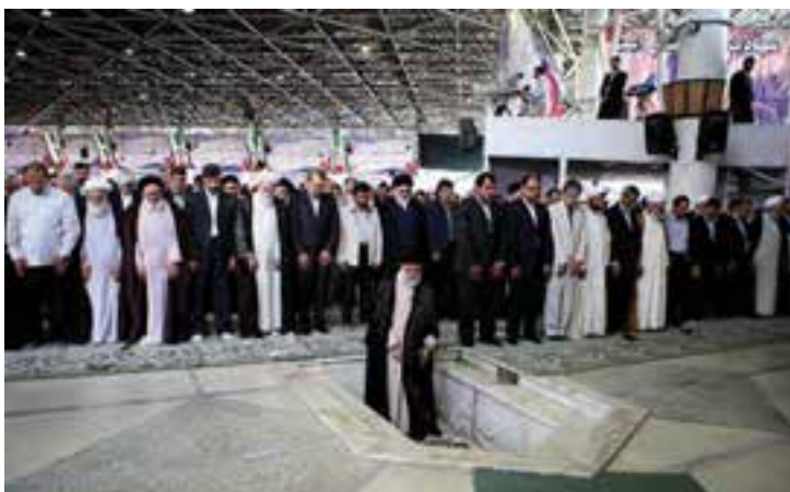
شکل ۱۶-۴- نماز جمعه تهران به امامت مقام معظم رهبری

مردم تهران نه تنها در صحنه دفاع حضور فعال داشتند بلکه با تشکیل ستاد معین بازسازی، همچنان حضور خود را در صحنه حفظ کردند و در زمینه آبادسازی مناطق آزاد شده به خصوص خرمشهر، به تلاش های خود ادامه دادند.