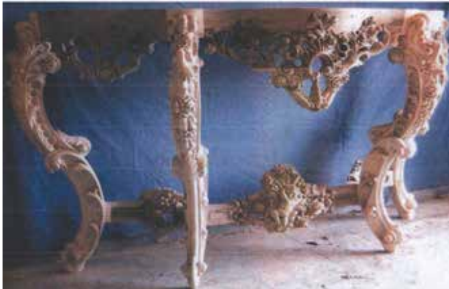
شکل ۳-۳- نمونه‌ای از منبت کاری هنرمندان قم

۳- درودگری و منبت کاری : منبت کاری ضریح‌ها، صندوق‌ها، منبرها، درهای زیارتگاه‌ها، صندلی و پوشش طاق‌ها از جمله هنرهای دست ساز چوبی هنرمندان و استادان قمی است.