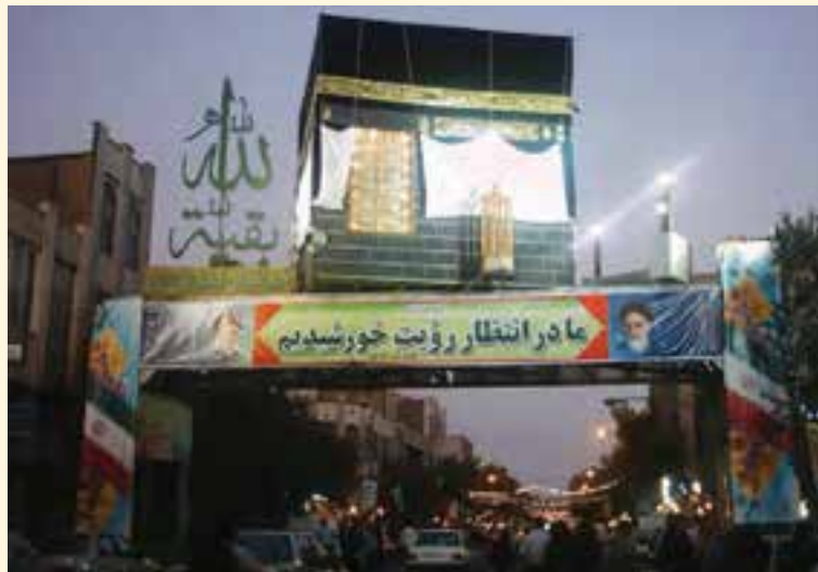
شکل ۳-۶- خیابان چهارمردان در مراسم نیمه شعبان

ث) مراسم یادمان ورود حضرت معصومه (س) به قم: روز بیست و سوم ربیع الاول سال ۲۰۱ هجری قمری، روز ورود حضرت معصومه (س) از مسیر ساوه به قم است. در این روز، مردم قم و خادمان حرم در یک حرکت نمادین به اتفاق شخصی که نماد موسی ابن خزیج است تا بیرون شهر به استقبال آن حضرت می‌روند. این شخص که افسار شتر حضرت را به دست دارد، آن بانوی بزرگوار را به منزل شخصی خود هدایت می‌کند و در پایان مراسم، ضریح و مرقد مطهر آن حضرت گلباران می‌شود.