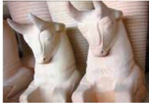
شکل ۳-۴- نمونه‌هایی از هنر سنگ‌تراشی در استان