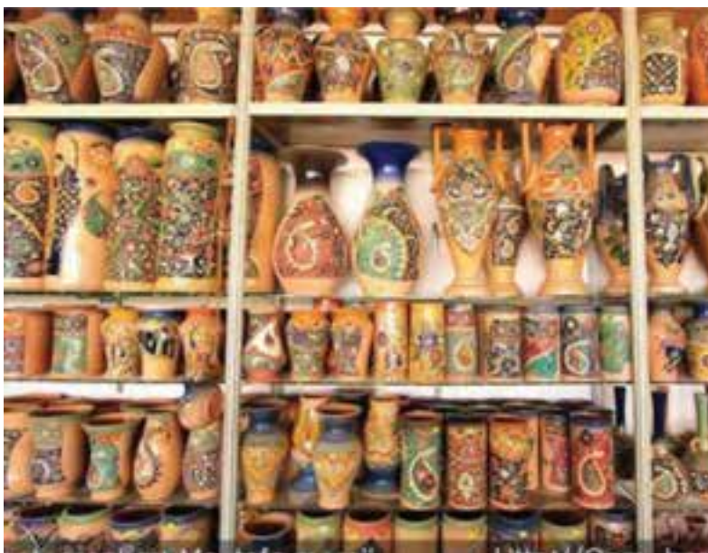
شکل ۲-۳- سفالگری در قم