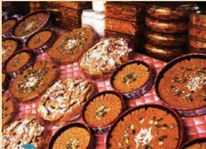
شکل ۳-۵- سوهان قم