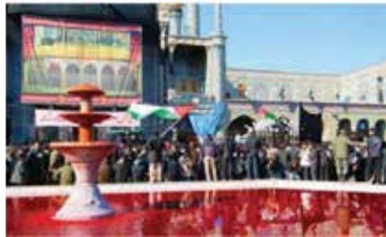
شکل ۸-۳- مراسم عزاداری حضرت اباعبدالله الحسین (ع) در حرم مطهر

ب) رحلت حضرت معصومه (س) : در روز رحلت حضرت معصومه (س)، خادمان حرم با حالت حُزن و اندوه و با ذکر صلوات از میدان میر به طرف حرم مطهر حرکت می‌کنند و مردم در صحن مطهر حضرت معصومه (س) عزاداری می‌کنند. - مردم شهر قم به‌ویژه زنان، سفره‌های نذری مختلفی را برپا می‌کنند؛ این مراسم تأثیرات معنوی، روانی و اجتماعی زیاد دارد.