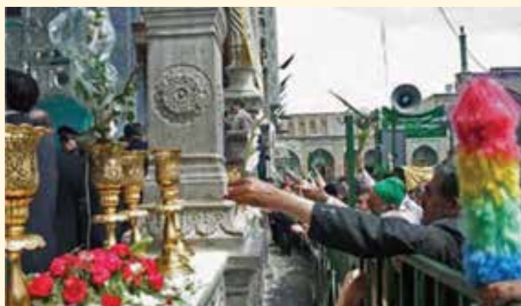
شکل ۳-۷- برگزاری مراسم یادمان ورود حضرت معصومه (س) به قم در حرم مطهر

ث) مراسم یادمان ورود حضرت معصومه (س) به قم: روز بیست و سوم ربیع الاول سال ۲۰۱ هجری قمری، روز ورود حضرت معصومه (س) از مسیر ساوه به قم است. در این روز، مردم قم و خادمان حرم در یک حرکت نمادین به اتفاق شخصی که نماد موسی ابن خزیج است تا بیرون شهر به استقبال آن حضرت می‌روند. این شخص که افسار شتر حضرت را به دست دارد، آن بانوی بزرگوار را به منزل شخصی خود هدایت می‌کند و در پایان مراسم، ضریح و مرقد مطهر آن حضرت گلباران می‌شود.