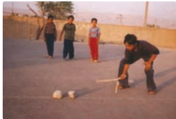
شکل ۱۵-۹- بازی چوکیلی