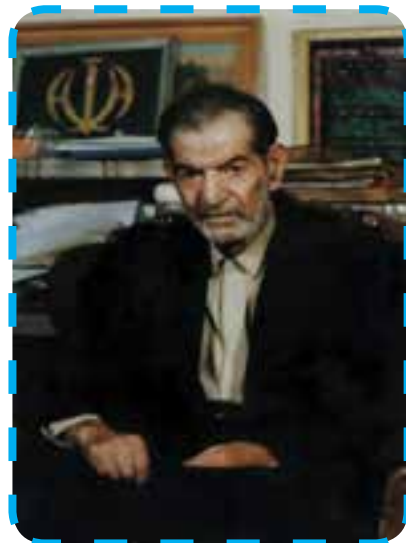
شکل ۳-۴- شهریار

منظومه «حیدر بابایه سلام» او در سال ۱۳۳۱ و ۱۳۳۲ منتشر شد و بسیار مورد استقبال قرار گرفت. این منظومه درخشان‌ترین اثر ادبی زبان ترکی است و تاکنون به ۸۷ زبان زنده دنیا ترجمه شده است.