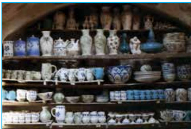
شکل ۱۴-۳- سفالگری در زنوز

صنایع دستی برجسته این استان شامل قالی‌بافی، ورنی‌بافی، گلیم‌بافی، سوزن‌دوزی، جاجیم‌بافی، تذهیب، هنرهای چوبی، سفالگری، نقاشی روی چرم، سبذبافی و... است. رونق صنعت زیبای فرش‌بافی در این استان به حدی است که عمده‌ترین صادرات غیرنفتی استان را به خود اختصاص داده است. فرش این استان معمولاً به کشورهای آلمان، فرانسه، ایتالیا و انگلیس صادر می‌شود.