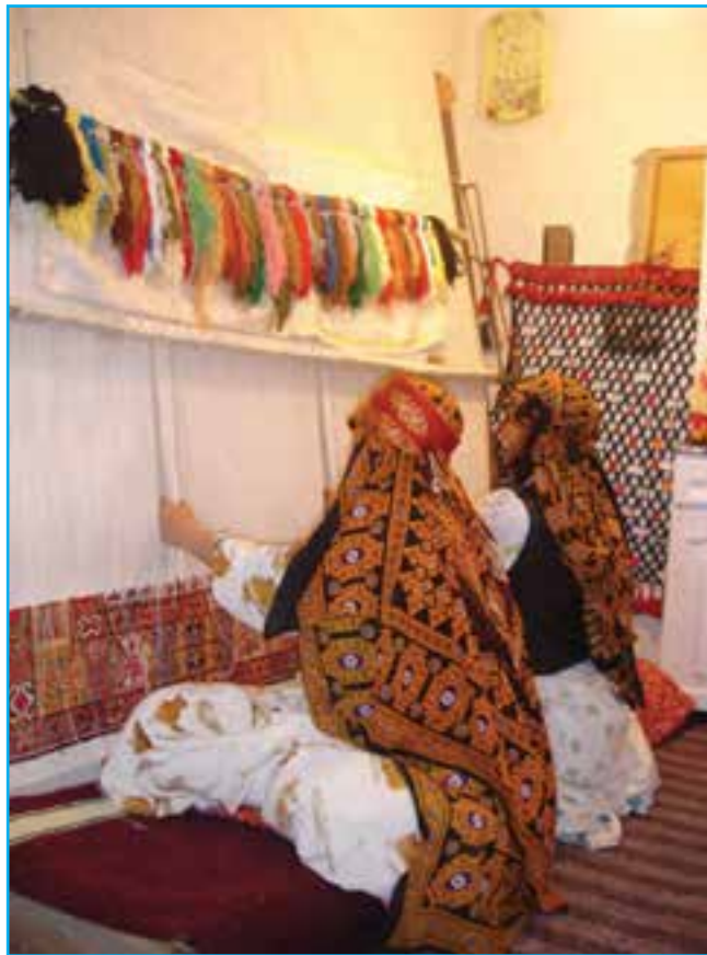
شکل ۱۱-۳- قالی‌بافی در استان

استان آذربایجان شرقی در بسیاری از زمینه‌های هنری پیشرو بوده و مکتب خاص خود را داشته است و توانسته در طول تاریخ صفحات درخشانی را از حضور فعال و مؤثر مردان و زنان هنرمند خود به نمایش بگذارد.