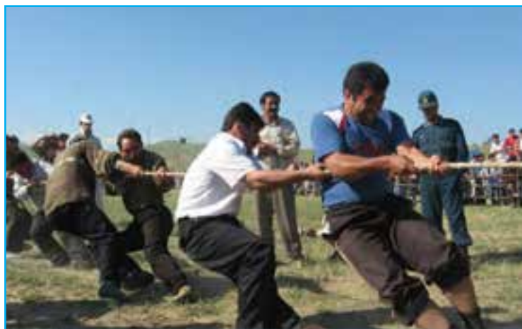
شکل ۷-۳- تصویری از مسابقه طناب‌کشی در میان عشایر

در گذشته در مناطق مختلف آذربایجان همچون دیگر مناطق ایران، کودکان و نوجوانان اوقات فراغت خود به صورت‌های گوناگون سپری می‌کردند که هم موجب تفریح و شادی آنان می‌شد و هم آنها را با فنون و مهارت‌های اجتماعی آشنا می‌ساخت. متأسفانه امروزه این بازی‌ها که پر از شادی و نشاط جای خود را به وسایل ارتباط جمعی به ویژه تلویزیون، بازی‌های رایانه‌ای، آتاری و ... داده است که هم آثار نامناسبی بر سلامت روح و روان کودکان و نوجوانان برجای می‌گذارد و هم سلامت جسمی آنان را به مخاطره می‌اندازند. در آذربایجان با توجه به تنوع این منطقه انواع بازی‌های محلی مشاهده می‌شود. از جمله آن‌ها می‌توان به بازی: بنفشه بنده دوشر، بش‌داش، طناب کشی، تیرنا ووردی، پیل دسته (کلینگ آغاج)، آرادا ووردی، گیزلین پالانج (قایم باشک) و ... اشاره کرد.