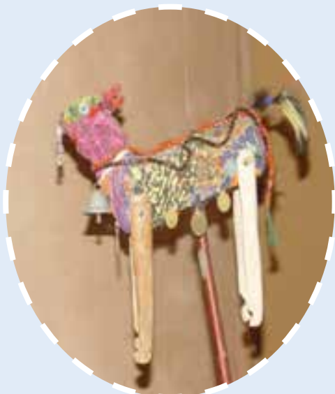
شکل ۹-۳- تصویری از «تکم» در روستا

دسته‌ای از پیک‌ها سایاچی لار نام داشتند و آنان نیز با خواندن اشعار در وصف بهار و طبیعت آمدن عید را نوید می‌دادند.