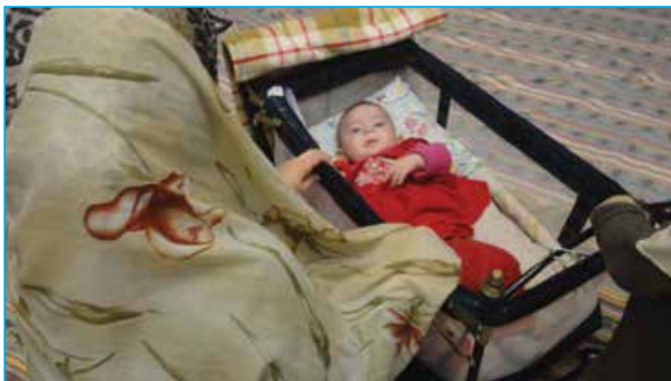
شکل ۳-۶ - لالایی موجب آرامش جسم و روح مادر و کودک می شود.

لالایی ها بخش لطیفی از ادبیات شفاهی سرزمین ماست که به عنوان نخستین ارتباط کلامی مادر با کودک، مهر و محبت مادرانه را به طرز زیبایی در وجود کودکان جاری می سازد و موجب آرامش جسم و روح مادر و کودک می شود. از دیرباز در آذربایجان لالایی ها در فرهنگ عامیانه مردم جایگاه مهمی داشته است.