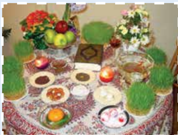
شکل ۱۰-۳- تصویری از مراسم عید نوروز در استان