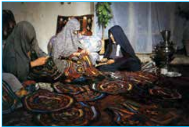
شکل ۱۳-۳- سوزن‌دوزی در میقان