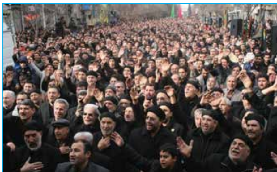
شکل ۲-۳- تصویری از مراسم سینه زنی در ایام محرم در استان

شبیہ خوانی، برخی روستاییان با روشن نمودن سماور زغالی جلوی منازل خود از عزاداران حسینی پذیرایی می کردند. امروزه این مراسم با گذشت زمان شکل های متفاوتی پیدا کرده است.