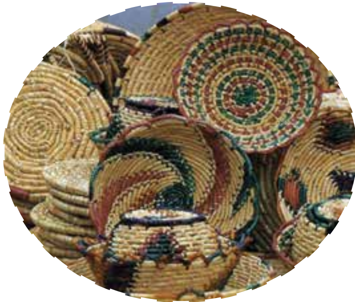
شکل ۱۵-۳- سبدهافی در کشکسرای

از سبدهافی نیز باید به عنوان یکی از صنایع در حال انقراض یاد کرد. این صنعت خانگی در گذشته نه چندان دور در بیشتر مناطق آذربایجان رونق داشته است. سبدهافی از ساقه‌های گندم و جو در مناطقی از شهرستان مرند (کشکسرای) و سبدهافی از چوب موسون در روستاهای اطراف مراغه پیشینه تاریخی زیادی دارد. زنان این مناطق این سبدها را در طرح‌ها و رنگ‌های بسیار زیبا می‌بافتند و این سبدها بیشتر مصارف خانگی داشته است.