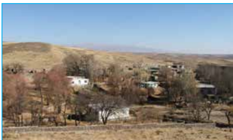
شکل ۵-۳- تصویری از روستای خشکتاب (زادگاه شهریار)

یکی از دلایل شاهکار بودن منظومه «حیدر بابا به سلام» آن است که دربرگیرنده فرهنگ عامه این دیار است. تصویر ارائه شده در این شعر، نه تنها تصویر واقعی روستای خشکتاب بلکه نمایی از تمام روستاهای ایران است. شهریار که به حق او را شهریار شعر و سخن نامیده اند، در قالب های مختلف شعر فارسی، مانند قصیده، مثنوی، غزل، قطعه، رباعی و قالب های آزاد شعر سروده است. از غزل های او می توان به «همای رحمت» و «آمدی جانم به قربانت» و «سهندیه شهریار» اشاره کرد.