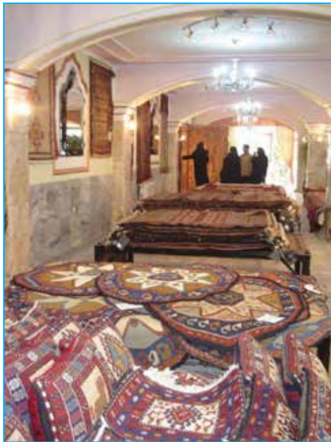
شکل ۱۲-۳- نمایشگاه و فروشگاه صنایع دستی عشایر

در این میان صنایع دستی به عنوان جلوه‌ای بدیع از هنرهای سنتی در آذربایجان توانسته همواره تحسین نظاره‌گران را برانگیزد.