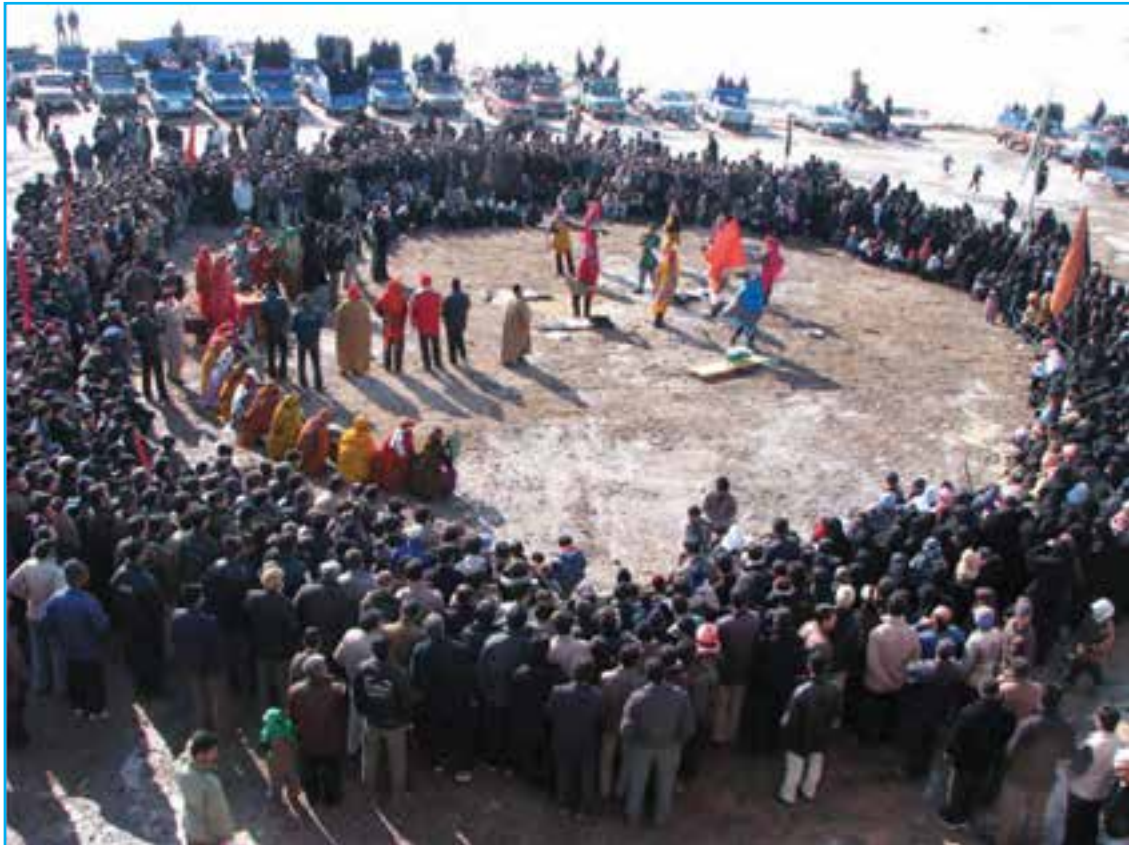
شکل ۳-۳- تصویری از مراسم شبیه‌خوانی