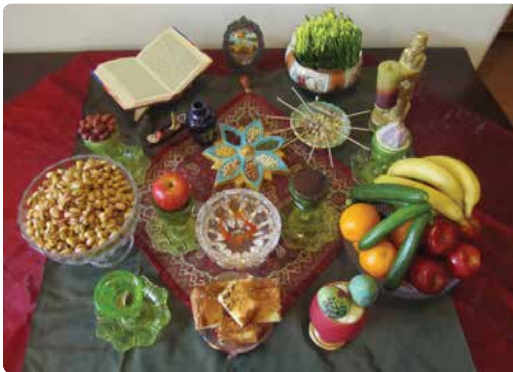
شکل ۲-۹- سفره هفت سین

سرخ، مانند هندوانه، انار و سیب را که نمادی از خورشید است تناول می‌کنند. چهارشنبه‌سوری : در این آیین کهن ایرانیان هفت بوته‌خار را آتش می‌زدند و از روی آن می‌پریدند و اشعاری را می‌خواندند که آثاری از آن در فرهنگ عامیانه ما موجود است. پس از برافروختن بوته‌های خار، خاکستر آن را جمع می‌کردند و از خانه بیرون می‌بردند. در بازگشت نیز اهل خانه را به تندرستی و دور کردن بلا یا مژده می‌دادند. در کنار آتش‌بازی آداب و رسوم دیگری مانند خوردن آجیل مشکل‌گشا، قاشق زنی، پختن آش و کوزه شکستن نیز مرسوم بود. همه این آیین‌ها تمایل مردم را برای تقسیم شادی با یکدیگر نشان می‌دهد اما بسیاری از این مراسم‌ها به دست فراموشی سپرده شده است و صمیمیت و شادمانی آن را تنها در حکایت پدربزرگ‌ها و مادربزرگ‌ها می‌توان شنید و تصور کرد. عید نوروز : مهم‌ترین جشن باستانی متداول در میان مردم استان، جشن نوروز است. به راه انداختن پیک‌های نوروزی، خانه‌تکانی، رویاندن دانه‌های گیاهی و آتش زدن بوته و شاخه‌های خشک درختان در شب چهارشنبه‌سوری، برگزاری مراسم یاد بود درگذشتگان، خرید لباس نو، خرید شیرینی و آجیل، گستردن سفره‌های نوروزی و ... از جمله آیین‌هایی است که در استقبال از بهار در سرتاسر خطه ایران برگزار می‌شود. هنگام تحویل سال خانواده‌ها در کنار سفره هفت‌سین می‌نشینند و دعای مخصوص لحظه تحویل سال را می‌خوانند و بعد از آن برای دید و بازدید به خانه اقوام می‌روند؛ به یکدیگر هدیه می‌دهند و سال خوبی برای هم آرزو می‌کنند. روز سیزدهم فروردین اعضای خانواده به دشت و سبزه‌زار می‌روند و سبزه سفره‌های هفت‌سین را به طبیعت می‌سپارند.