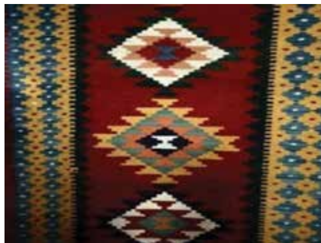
شکل ۱۳-۳- گلیم منطقه نمین