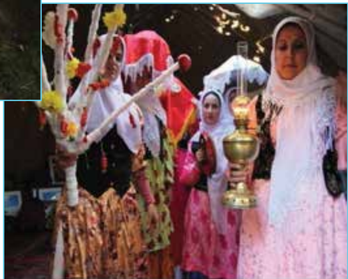
شکل ۹-۳ بردن بایراملیق برای عروس

الف) مراسم چهارشنبه‌سوری: درآموزه‌های ادیان الهی چهار عنصر آب، خاک، باد و آتش به‌عنوان عناصر اربعه تطهیرکننده ناپاکی‌ها شناخته می‌شود. به همین دلیل از دوران کهن چهار چهارشنبه آخر سال به نام یکی از این عناصر نام‌گذاری شده است. (اولین به نام یتل، دومین به نام توپراق، سومین به نام اُود و چهارمین به نام سو چهارشنبه‌سی نام‌گذاری شده بود.) امروزه تنها در شب آخرین چهارشنبه سال مراسم پریدن از روی آتش و در روز آخرین چهارشنبه در برخی نقاط استان از روی آب رد می‌شوند که به آن نئو اوستی گفته می‌شود.