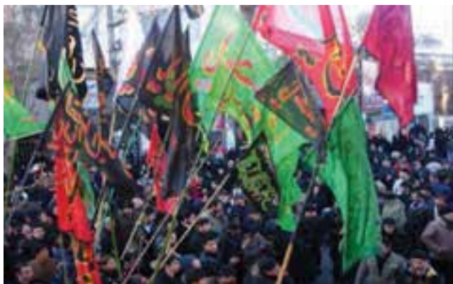
شکل ۳-۶- عزاداری در استان اردبیل

عزاداری ماه محرم : عزاداری ماه محرم در استان اردبیل با قدمت چندین صد ساله با برنامه زمان‌بندی خاصی از سالروز شهادت حضرت مسلم بن عقیل آغاز می‌گردد. قبل از فرا رسیدن ماه محرم اهالی محلات، مساجد را با پوشاندن پارچه‌های سیاهی که بر روی آنها اشعار حماسی و مرثیه‌ای نوشته شده آماده عزاداری می‌نمایند. با مراسم خاص تشت گذاری که بیانگر اعلان بیعت و وفاداری با آرمان‌های شهدای تشنه لب کربلاست، مردم به استقبال ماه محرم می‌روند.