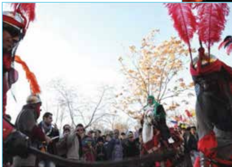
شکل ۸-۳- شبیه‌خوانی در عاشورای حسینی