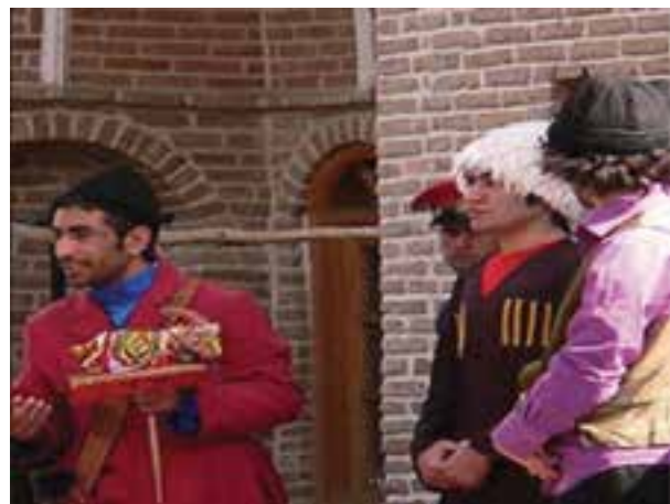
شکل ۱۱-۳- مراسم تکم‌گردانی