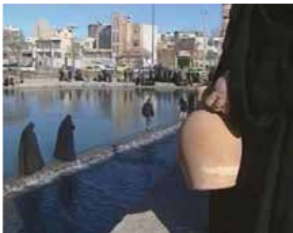
شکل ۱۲-۳- مراسم نثو اوستی یا سواوستی (رد شدن از روی آب)

ب) عید نوروز: نوروز بایرانی یکی از اعیاد باستانی کهن ایرانی است که نه تنها پس از ورود اسلام از بین نرفته، بلکه با عجب شدن با آموزه‌های روشنگر دین مبین اسلام با شکوه بیشتری برگزار می‌گردد. در گذشته در منطقه ما آمدن عید نوروز توسط تکم‌چی‌ها که به‌عنوان سفیران یا پیک‌های آواز خوان شناخته می‌شدند به مردم نوید داده می‌شد.