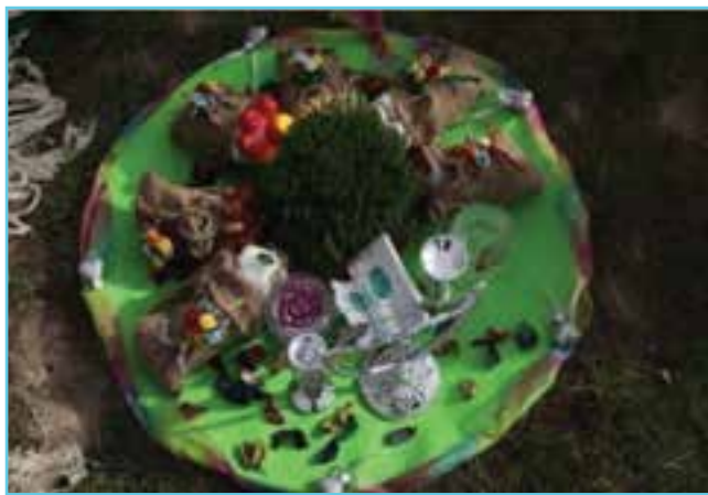
شکل ۱۰-۳ سفره هفت سین

استان اردبیل به‌عنوان قسمتی از سرزمین آذربایجان، با توجه به پیشینه کهن و غنی که از آن برخوردار است گنجینه‌هایی گرانبها از مراسم سنتی را در خود جای داده است. این آیین‌ها ریشه در باورهای عمیق دینی و الهی مردم این منطقه دارد. برخی از سنت‌ها از دوران قبل از اسلام وجود داشته و مردم آذربایجان با تطبیق آیین‌های سنتی با آموزه‌های اسلامی از آنها در زندگی‌شان بهره‌جسته‌اند. آیین‌هایی مانند چهارشنبه‌سوری، عید نوروز، شب چله و... که هنوز در استان اردبیل پا برجاست.