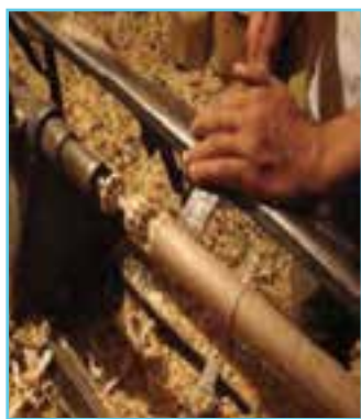
شکل ۱۶-۳- خراطی در استان اردبیل