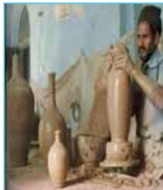
شکل ۱۵-۳- سفالگری در استان اردبیل