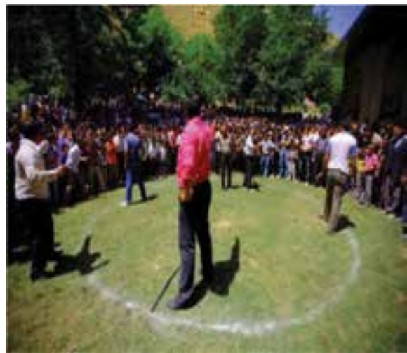
شکل ۳-۳. بازی محلی قیش قاپدی