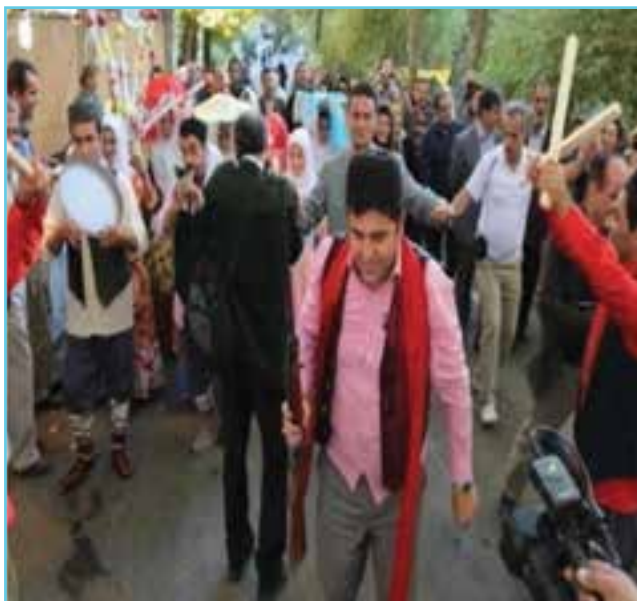
شکل ۱-۳- حضور عاشیق‌ها در مراسم‌های مختلف

داستان‌ها، حماسه‌ها و عاشقانه‌ها توسط «عاشیق‌های آذری» همراه موسیقی و ساز و آواز در سفرهای مختلف اجرا می‌شد. عاشیق‌ها در اکثر مراسم‌ها از عروسی گرفته تا تولد نوزاد از کوچ ایل گرفته تا جنگ و... حضور فعال داشتند بر همین اساس اشعار و آهنگ‌های متناسب با شرایط زمانی و مکانی ساخته و ارائه می‌کردند که از جمله توانایی‌های آنها سرودن اشعار فی‌البداهه در مقابل عاشیق دیگر می‌بود.