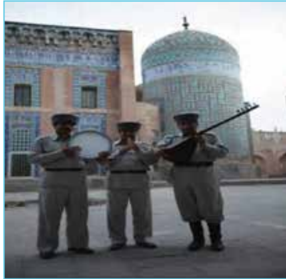
شکل ۲-۳- یک گروه عاشیق