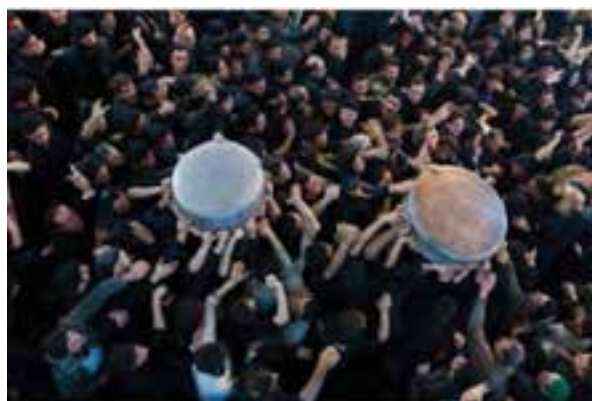
شکل ۳-۵- مراسم تشت گذاری در ماه محرم