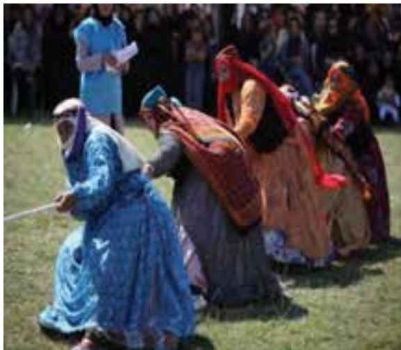
شکل ۳-۴. بازی محلی طناب کشی

از جمله بازی های محلی استان ما می توان به : قیش قاپدی (ربایش کمر بند) بش داش، چیلنگ آغاج، گیردکان، ال اوسته کیمین الی، آی ننه قوردی قوردی، گیزلین پاچ، گیرجنه، شاه وزیر، طناب کشی و ده ها بازی دیگر اشاره نمود.