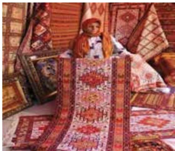
شکل ۱۴-۳- ورنی عشایر مغان

دستی ساخته شده که در هر واحد آن، ذوق و هنر و خلاقیت فکری صنعتگر سازنده به خوبی متجلی می یابد صنایع دستی گویند. این هنرها از دیرباز به عنوان یکی از شاخص های مهم علمی، هنری، فرهنگی و اجتماعی توسط استادان و هنرمندان چیره دست استان ما در زندگی مردم نقش پررنگی داشته است. با تغییرات اجتماعی به وجود آمده در شیوه های زندگی مردم بسیاری از این صنایع یا کاملاً از بین رفته و یا تنوع و شیوه تولیدشان تغییر کرده است. با این حال ورنی عشایر مغان و گلیم منطقه نمین مهر اصالت از سازمان فرهنگی هنری یونسکو دریافت کرده است. در استان اردبیل فعالیت های مربوط به صنایع دستی در بیش از ۶۰ رشته مختلف انجام می شود که به معرفی برخی از آنها پرداخته می شود :