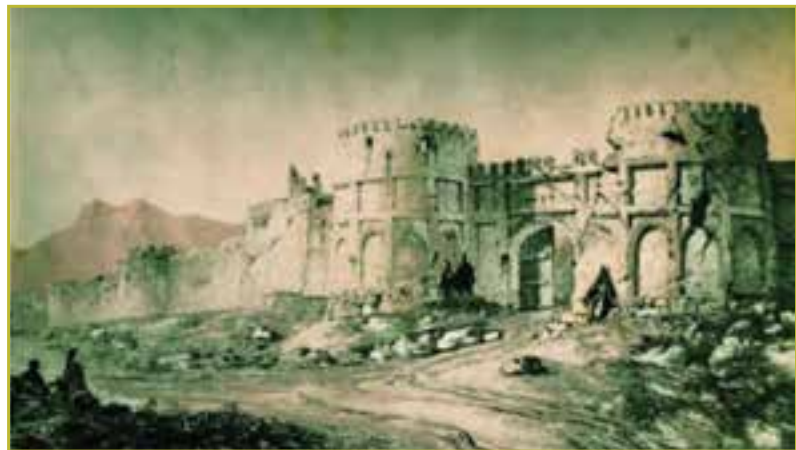
شکل ۷-۴- برج و باروی زنجان

کشف سفال فراوان مربوط به عصر سلجوقی در مرکز زنجان و سکه هایی از منطقه سجاس و روستای ورمزیار و کثرت رجال کشوری و سیاسی زنجان در تاریخ دوره سلجوقی مؤید این مطلب است. همچنین در این زمان شاهد ظهور به عرصه آمدن برخی شخصیت های علمی و دینی هستیم. جمعیت شهر نیز رو به فزونی نهاد و شهر زنجان تا حدودی آباد گردید. یکی از وزرای بزرگ سلطان سنجر و برکیارق سلجوقی، در زنجان چندین مدرسه و دارالشفای بنا کرد.