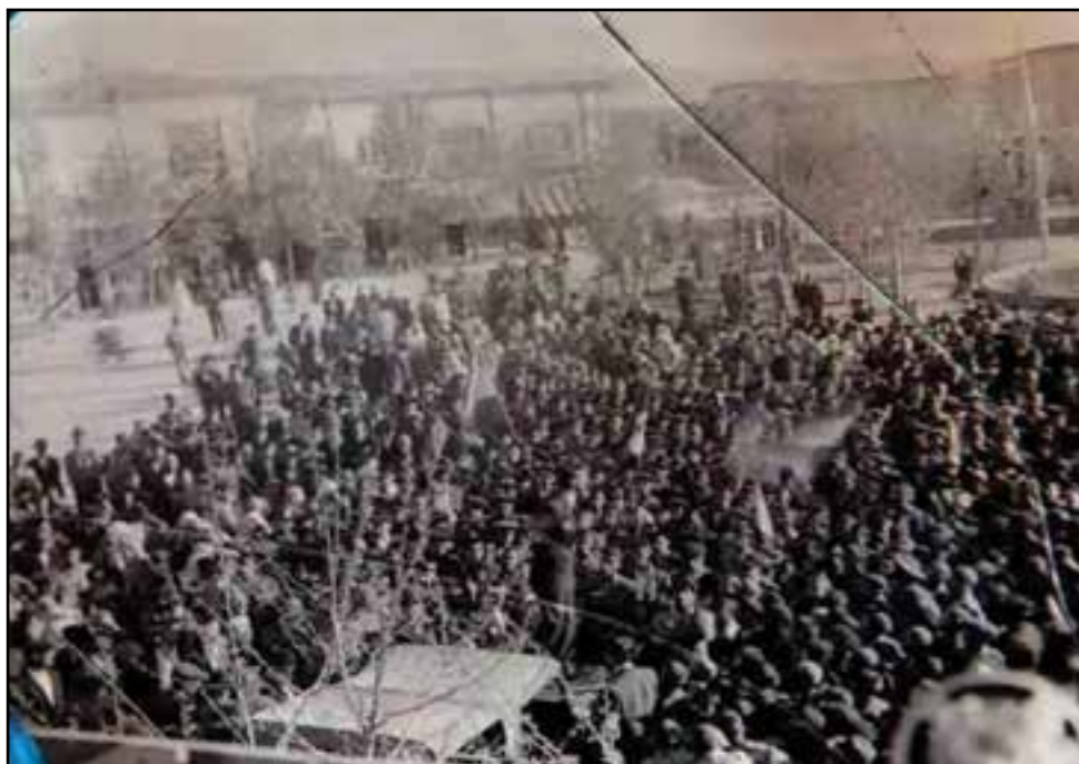
شکل ۹-۴- تصویری منحصر به فرد از حمایت مردم استان از نهضت ملی شدن نفت

لازم به ذکر است مردم استان بنا به شواهد موجود، در نهضت ملی شدن نفت ایران نیز حضوری همه‌جانبه و پرشور داشته‌اند.