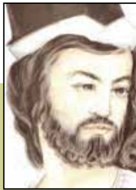
شکل ۱۷-۴- سهروردی (شیخ اشراق)