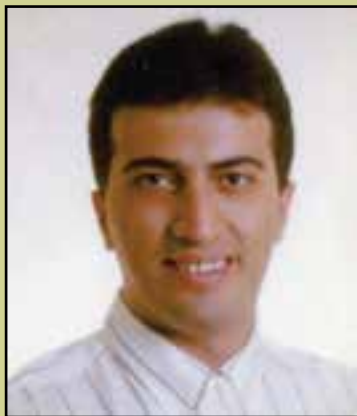
شکل ۲۲-۴- دکتر امیر اعلم غضنفریان