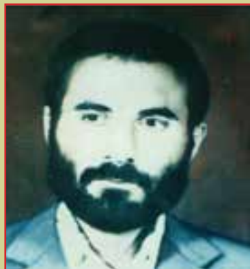
شهید مجتبی رهبری فرمانده گردان ابوذر