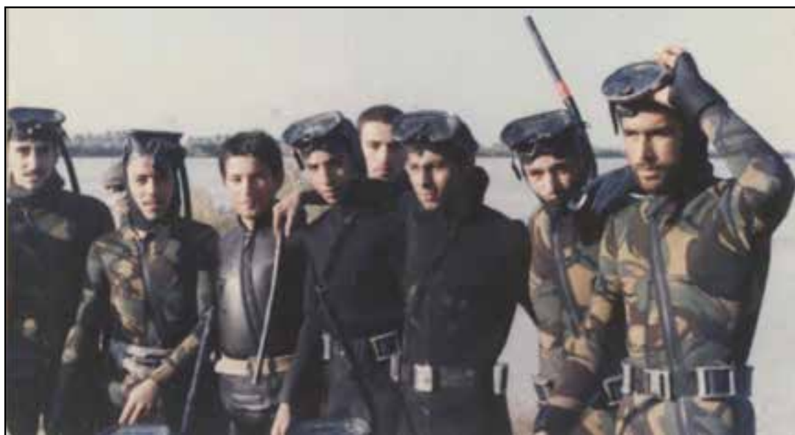
شکل ۲۳-۴- غواصان دریادل زنجان

مردم غیور و دلاور استان زنجان در طول ۸ سال دفاع مقدس، رشادتهای زیادی از خود نشان دادند از جمله رزمندگان این استان در عملیات‌های مختلف به‌عنوان خط‌شکنان معروف بودند. این استان در طول جنگ تحمیلی، شهدا، جانبازان و آزادگان بسیاری را تقدیم نظام جمهوری اسلامی کرده است.