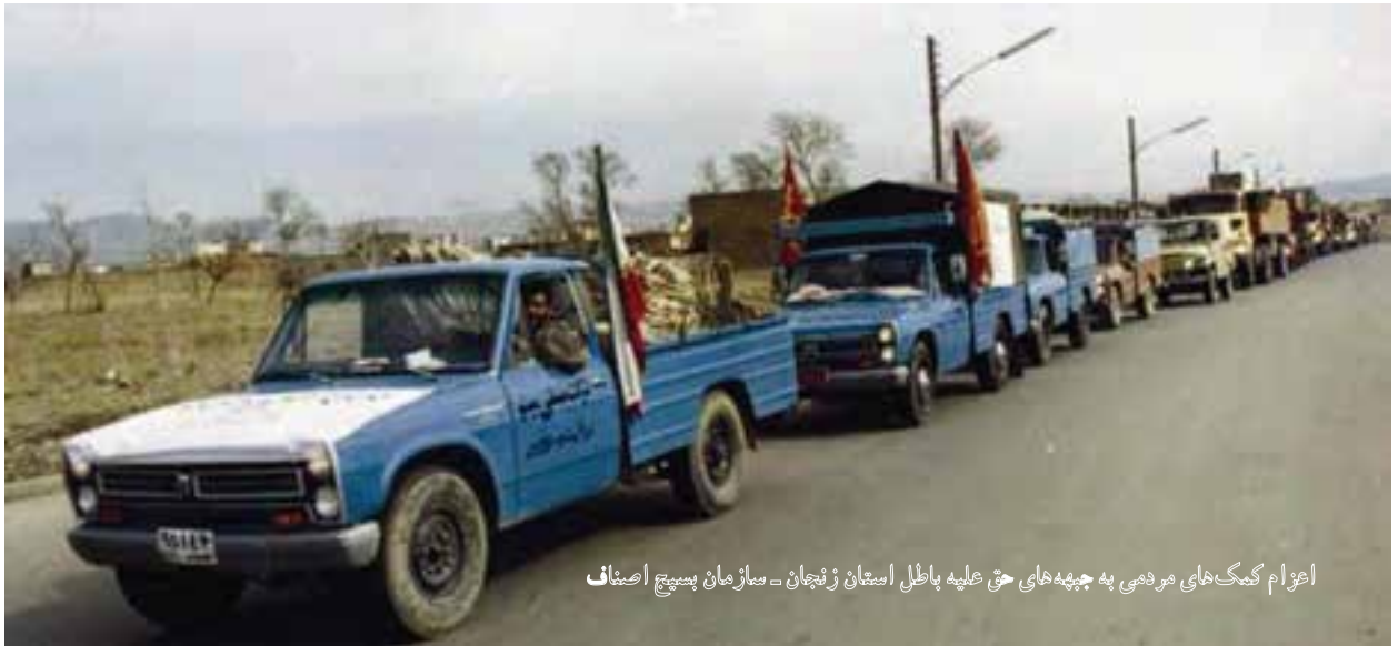
اعزام کمک‌های مردمی به جبهه‌های حق علیه باطل استخوان زنجان - بازارمان پستیچ اصناف