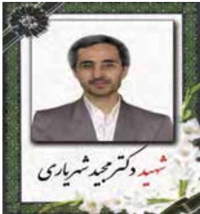
شکل ۱۵-۴- شهید دانشمند دکتر مجید شهبازی

آیا در محل زندگی خود شخصیت‌هایی را می‌شناسید که به جدول ۲-۴- اضافه نمایید؟