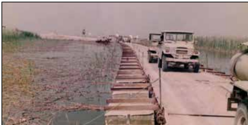
شکل ۲۸-۴- فعالیت جهادگران استان در دفاع مقدس