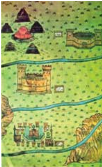
شکل ۶-۴- کاروانسرای سرچم

همچنین در این دوره، این منطقه از نظر اقتصادی و فرهنگی و هنری دارای رونق چشمگیری بوده است. بیشتر آثار تاریخی و مذهبی استان زنجان، مانند: مساجد جامع قروه، سجاس، گلابر، کاروانسرای نیک بی، سرچم، آثار تاریخی سلطانیه، خدابنده و ابهر در این زمان ساخته شده اند.