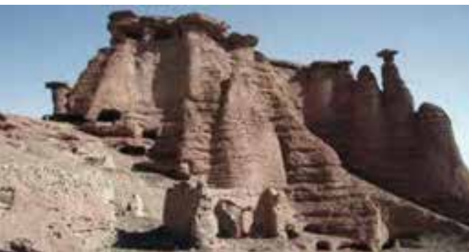
شکل ۳-۴- قلعه بهستان ماه نشان یکی از مراکز اولیه تاریخ