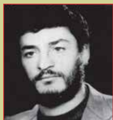
شهید مهدی پیرمحمدی فرمانده گردان ولیعصر (عج)