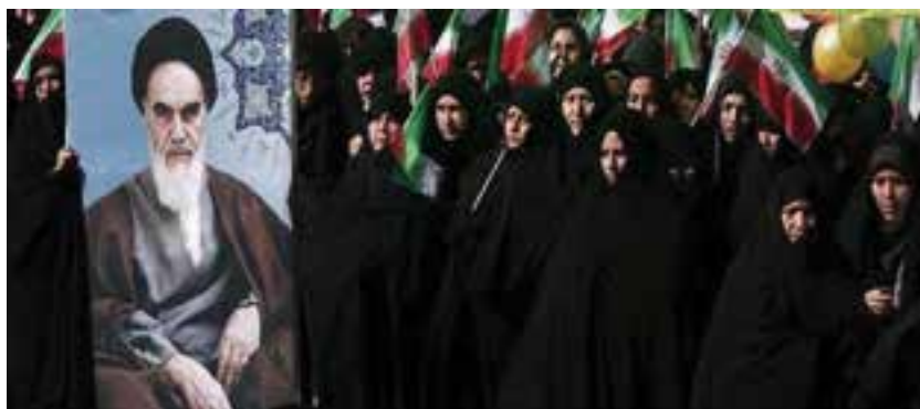
شکل ۱۰-۴- زنان در استان زنجان در پیروزی انقلاب نقش به‌سزایی داشتند