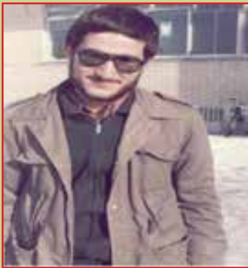
شهید حمید احدی فرمانده گردان