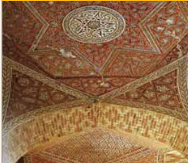
شکل ۱۴-۴- تزئینات معرق یکی از ایوان‌های گنبد سلطانیه

تزئینات، هماهنگی، استحکام و بالاخره فلسفهٔ ایجاد آن و... این بنا هم سطح با کلیسای جامع مریم مقدس در فلورانس ایتالیا و مسجد ایا صوفیای استانبول در جهان جزء بناهای ممتاز شناخته شده است.