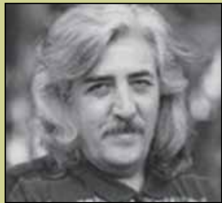
شکل ۲۰-۴- حسین منزوی - شاعر و غزل سرا