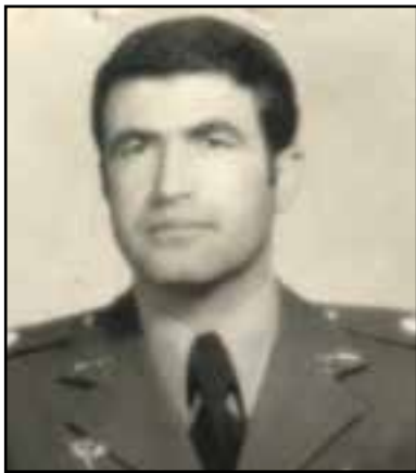
شکل ۲۶-۴- سرلشکر شهید مخبری