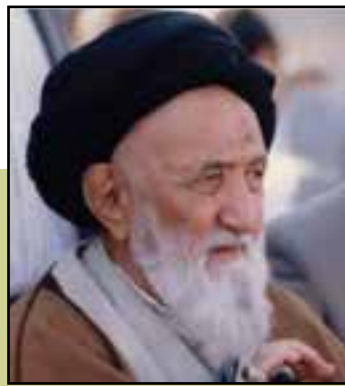
شکل ۱۸-۴- مرحوم آیت الله موسوی زنجانی