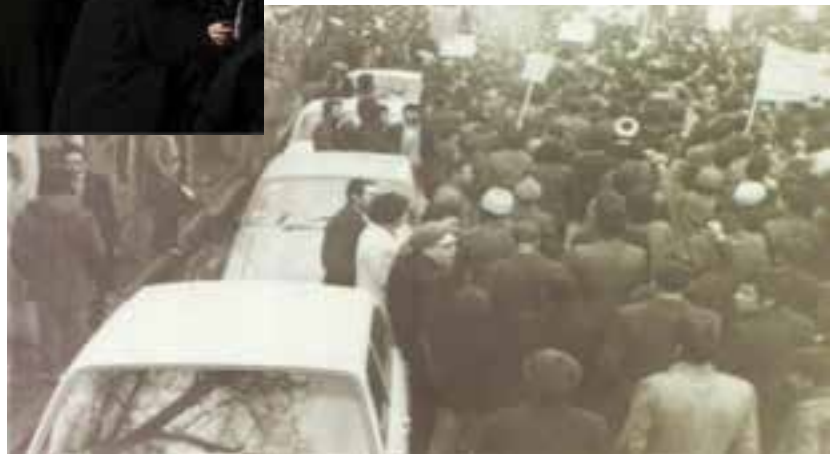
شکل ۱۱-۴- اولین تظاهرات علنی استان علیه رژیم