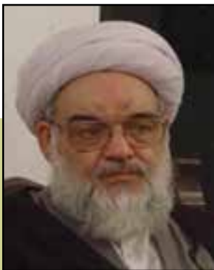
شکل ۱۹-۴- مرحوم استاد عمید زنجانی

آیا در محل زندگی خود شخصیت‌هایی را می‌شناسید که به جدول ۲-۴- اضافه نمایید؟