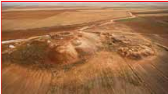
شکل ۲-۴- تپه نور سلطانیه

قرار دارد. دارای آثاری مربوط به چند دوره تاریخی است، قدیمی‌ترین آثار این تپه مربوط به دوره مفرغ (حدود ۵۰۰۰ سال قبل) است و همچنین در اینجا آثاری از دوره‌های آهن، اشکانی و ساسانی و دوران اسلامی نیز وجود دارد.