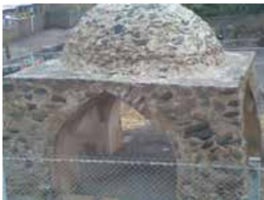
شکل ۴-۵- آتشکده الزین طارم

اگر قول مورخان در انتساب شهر زنجان به دوره ساسانی را بپذیریم، این شهر نیز در دوره ساسانی پایه‌ریزی شده است. همچنین وجود آتشکده‌های متعدد در مناطق مختلف استان در حدود یکصد سال پس از ورود اعراب به ایران که آثار برخی از آنان در شهرستان طارم باقی است تأییدکننده این مطلب است.