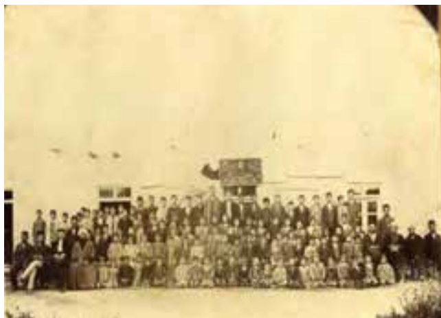
شکل ۸-۴- تصاویری از اولین مدارس استان