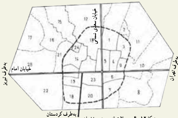
شکل ۱۲-۴- محلات قدیمی شهر زنجان