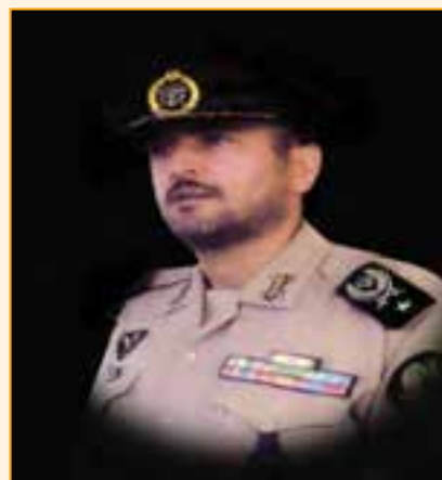
شکل ۲۵-۴- جانباز شهید امیر سرتیپ رحمان فروزنده

این استان با تقدیم ۳۰۰۰ شهید، ۶۳۶۰ جانباز و ۵۸۸ آزاده از کارنامه درخشانی در دفاع مقدس برخوردار است.