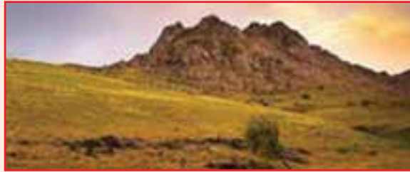
شکل ۱-۴- تپه خالصه خرمدره

سها چای تپه : این تپه تاریخی در شهرستان ایجرود و در مجاورت روستای سها و شیوه قرار دارد. تپه با توجه به قرار داشتن در محدوده سد گلابر، طی یک عملیات نجات بخشی توسط میراث فرهنگی استان زنجان مورد کاوش باستان شناسی قرار گرفت. این تپه تاریخی دارای آثاری از دوره مس و سنگ با تاریخ مطلق ۶۲۰۰ سال قبل است. آثار معماری روستایی شامل مقبره انسان‌ها با قطعات سفال، ابزارهای سنگی و بیکره‌های سفالی می‌باشد.