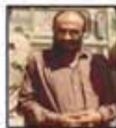
شهید حاج محمد علی شاکری فرمانده پندشاهی جنگ شمال کشور