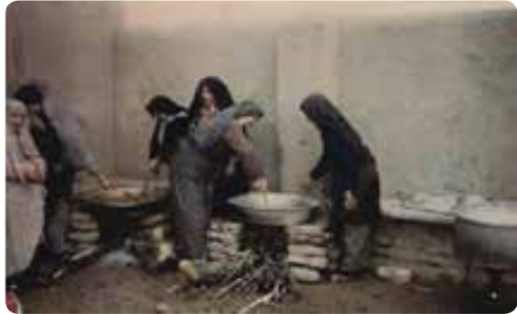
شکل ۸-۴. طرح قلمک‌ها و جمع‌آوری و ارسال کمک‌های مردمی به جبهه‌های نبرد حق علیه باطل

۸۵۰۰۰ قلمک در ۴ ماه در سال ۱۳۶۵ برای جبهه‌ها بوده است. دانش‌آموزان با تقدیم ۶۳۰ شهید گرانقدر آگاهی و بصیرت خود را به جامعه نشان دادند.