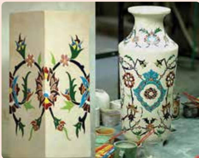
شکل ۳-۶- دو نمونه از صنایع دستی استان

قالی بافی: قالی دست‌رنج گمنام‌ترین و رنجکش‌ترین مردمان این سرزمین است و شاید همین گمنامی سرپنجه‌های هنرمندان است که چهره افتخار ملی را بر صفحه روزگار حک کرده است. می‌توان فرش دستباف را آینه تمام‌نمای افکار، احساسات، روحیات و خلق و خوی مردمی دانست که به کار تولید مشغول‌اند. قالی بافی و تولید قالی و قالیچه از دیرباز جزء تولیدات مهم استان سمنان به‌شمار می‌رفته است. شهرستان مهدی‌شهر و شاهرود از مراکز مهم تولید قالی و قالیچه در استان به‌شمار می‌روند. دارهای قالی اکثراً در استان عمودی است و قالی بافان بیشتر مواد اولیه خود را از خارج از استان تأمین می‌کنند. در مناطق عشایرنشین استان از پشم گوسفندان به‌عنوان مواد اولیه قالی بافی استفاده می‌شود. گلیم بافی: گلیم به‌عنوان نخستین زیرانداز بشر، دارای سابقه بسیار طولانی است. گلیم که در مقایسه با قالی دارای شیوه بافتی آسان‌تر است و به همان نسبت قیمت ارزان‌تری دارد، هنری در انحصار روستاییان و عشایر به حساب می‌آید. بافت گلیم خاص دختران و زنان خانه‌دار است و همین هنرمندان بی‌نام و بی‌ادعا هستند که به کمک سرپنجه‌های خویش نقوشی اعجاب‌انگیز می‌آفرینند. روستاهای شهرستان گرمسار، سمنان، مهدی‌شهر، دامغان و شاهرود از مراکز تولید گلیم در استان به‌شمار می‌آیند.