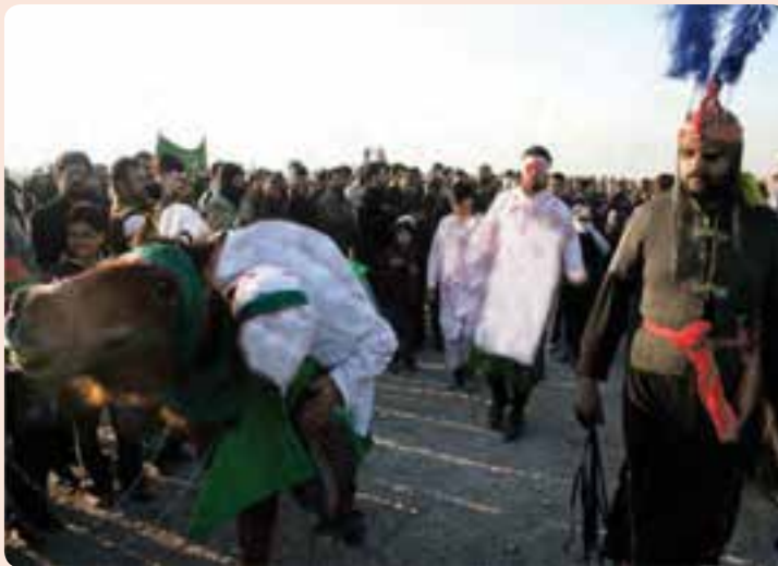
شکل ۱-۳- مراسم تعزیه خوانی ایام محرم در استان