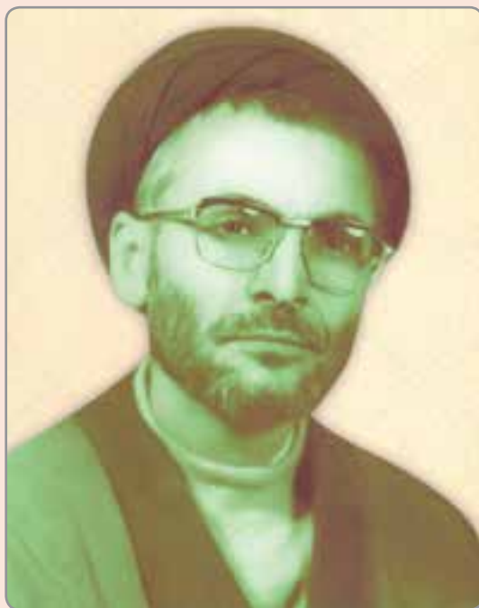
شکل ۱۴-۴- شهید حجت‌الاسلام سید کاظم موسوی

این شاعر طبیعت‌سرا و تیزهوش به زبان‌های فارسی و عربی تسلط داشته و از شعرای عرب نیز در اشعار خود تأثیر پذیرفت. این شاعر پرآوازه ادبیات ایران در سال ۴۳۲ هجری قمری از دنیا رفت.