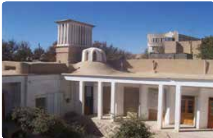
شکل ۳-۴- فضاهای زیستی اندرونی، سازگار با محیط و بادگیر در شاهرود