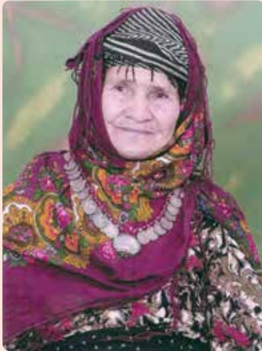
شکل ۳-۵- پوشش لباس زنان عشایر الیکایی در شهرستان گرمسار

ایران مورد استفاده است در این خطه از کشور نیز رواج دارد. از مهم ترین لباس های محلی مردان و زنان استان سمنان در گذشته می توان به موارد زیر اشاره کرد : لباس های محلی مردان شامل : سرپوش مردانه، تن پوش تابستانی مردانه، تن پوش زمستانی مردانه و پاپوش مردانه، کت چقا، شلوار کمری، گیوه و ... . لباس های محلی زنان شامل : چارقد، پیراهن کمر چین دار، شلیته، تنبان، جلیقه، اُرسی، چادر محلی و ... .