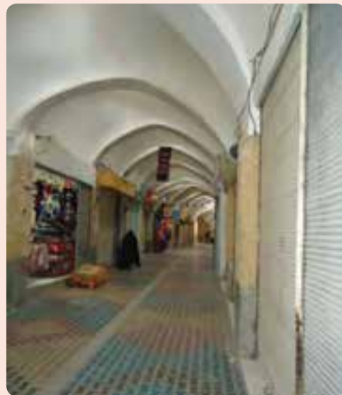
شکل ۵-۴- بازار سرپوشیده سمنان