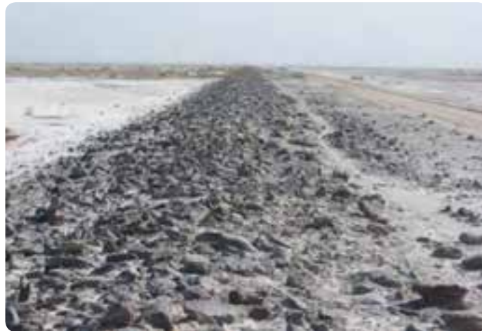
شکل ۲-۴- جاده سنگ فرش جهت عبور کاروان‌ها در جنوب گرمسار