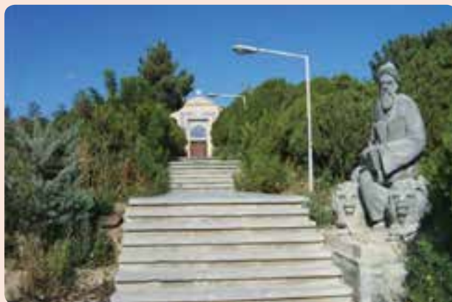
شکل ۱۲-۴- آرامگاه عارف نامی شیخ ابوالحسن خرقانی روستای خرقان در شهرستان شاهرود

منسوب است، نورالعلوم است. این عارف بزرگ در سال ۴۲۵ هجری قمری در هفتاد و سه سالگی در روستای خرقان بسطام دیده از جهان فرو بست.