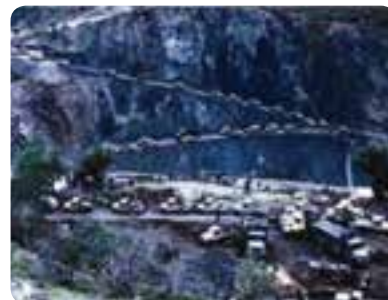
شکل ۷-۴- پشتیبانی جهاد سازندگی از جبهه‌های نبرد حق علیه باطل

احداث خاکریز، نصب پل، احداث جاده، بازسازی روستاها و شهرهای آسیب دیده به ویژه احداث جاده استراتژیک در عملیات طریق القدس در منطقه بستان و جاده سید الشهداء (ع) در جزیره مجنون از موارد مهم آن است. همچنین مدیریت قرارگاه حمزه سید الشهداء (ع) بر عهده جهاد استان بوده است که پذیرای ۱۲۰۰۰ نفر از رزمندگان جهادی استان و ۱۳۰۰۰ نفر از سایر استان‌ها بوده است. در مجموع تعداد ۱۱۳ نفر از رزمندگان جهاد سازندگی در طول ۸ سال دفاع مقدس به شهادت رسیدند.