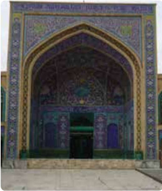
شکل ۳-۴- مرقد مطهر یحیی بن موسی بن جعفر (ع) در شهر سمنان

از مهم‌ترین رویدادهای منطقه سمنان در زمان عباسیان، سفر حضرت امام رضا (ع) به مرو و توقف آن حضرت در سمنان است که در ۲۰۱ هجری قمری، از مدینه به بغداد آمد و از راه همدان، نهاوند، قم و ری وارد سمنان شدند. به دستور وی حضرت یحیی بن موسی بن جعفر (ع) برای ارشاد مردم، در سمنان مستقر شد که بعدها توسط مأموران حکومت عباسی به شهادت رسید و مرقد مطهر ایشان در بخش مرکزی این شهر واقع شده است.