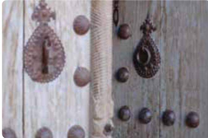
شکل ۳-۳- نقوش روی در و انواع کوبه