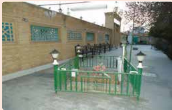
شکل ۱۳-۴- آرامگاه حاج ملا علی حکیم الهی در شهر سمنان

زادگاه خویش مراجعت کردند و با تدریس و برگزاری مراسم نماز جماعت و جمعه مردم را هدایت می کردند. ایشان به لحاظ ساده زیستی و زهد و تقوا در میان عامه مردم جایگاه ویژه‌ای داشت و در علم و حکمت سرآمد روزگار خویش بود. در حکمت، نجوم، در علوم الهی و مسائل اجتماعی نظریه‌های بسیار روشنی را ابراز می کرد. این حکیم فرزانه ۲۵ اثر داشته که در پی وقوع سیل از بین رفته است. در سال ۱۳۳۳ هجری قمری در سمنان رحلت کرد. آرامگاه او در ضلع غربی میدان امام خمینی (ره) سمنان واقع شده است.