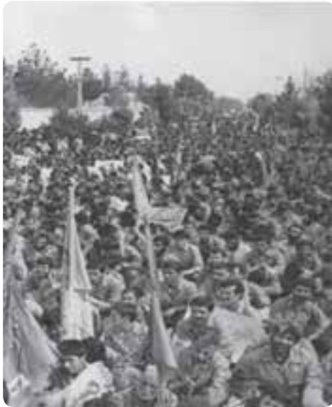
شکل ۶-۴- اعزام نیروهای مردمی از استان

روزنامه‌ها نوشتند: گروه کثیری از نیروهای تازه نفس رزمی طی یک اقدام سریع و فوق‌العاده از استان سمنان راهی جبهه‌های خون و شرف میهن اسلامی شدند.