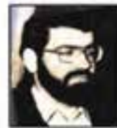
شهید سید اکبر آملی جانشین مسئول کل هیئت