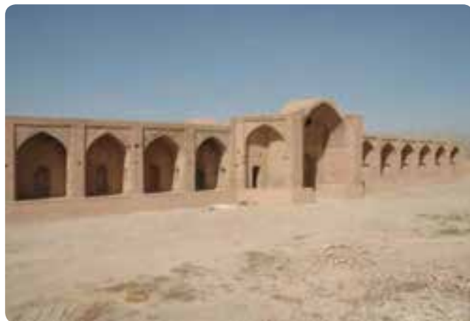
شکل ۴-۴- نمونه‌ای از کاروانسرای شاه عباسی ایوانکی در شهرستان گرمسار

ج) قومس در دوران صفویان و افشاریان: در اواخر دوران تیموری ایالت قومس و فیروزکوه در دست امیرحسین