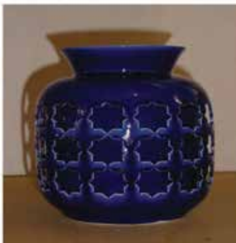
شکل ۷-۳- نمونه‌هایی از صنایع دستی استان سمنان