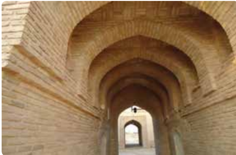
شکل ۲-۳- معماری سنتی (طاق‌های آجری) در سمنان

● معماری: به ساخت بنا و پرداختن به ظاهر و نمای ساختمانی هنر معماری می‌گویند که ریشه در فرهنگ هر قوم دارد. معماری استان سمنان نیز مانند معماری ایران آمیخته‌ای از فرهنگ باستانی و اسلامی است که در هر منطقه با توجه به شرایط محیطی و مصالح نمود پیدا می‌کند. از جمله می‌توان به نوع گنبدها، طاق‌ها و نقوش به کار رفته در بناهای تاریخی استان اشاره کرد که گویای سبک خاص معماری ایرانی و اسلامی است.