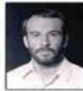
شهید حاج علی‌اکبر شاکری مسئول هیئت از روزنامه ایران