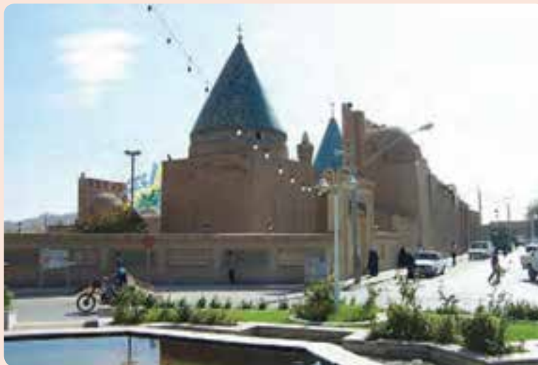
شکل ۱۱-۴- آرامگاه عارف بزرگ بایزید بسطامی، بسطام در شهرستان شاهرود

از نوشته‌های منتسب به ایشان کتاب‌های النور و دستورالجمهور است. بایزید در سال ۱۸۰ هجری قمری از دنیا رفت. آرامگاه ایشان در شهر بسطام در جوار مرقده امام زاده محمد بن صادق (ع) است.