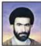
شهید سید ابوالقاسم حاجه کبیری مسئول هیئت و نطق‌ها هنگام روزنامه ایران