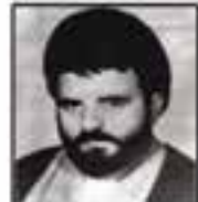
شهید سید احمد نوری فرمانده هیئت باغچه آبی