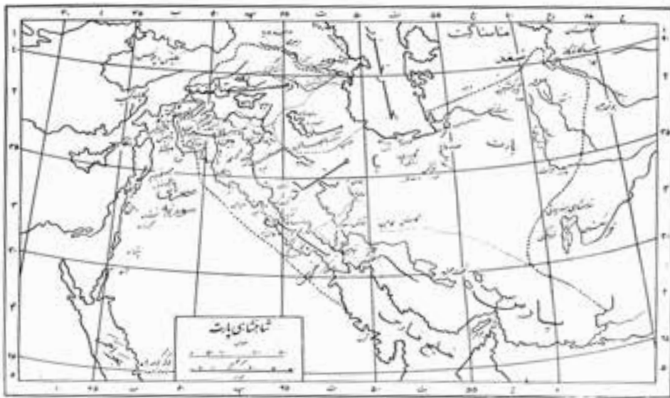
شکل ۳-۱۰- نقشه پادشاهی پارت

شمال استان (سیستان) در دوران باستان و قبل از اسلام : سیستان در جنوب شرقی ایران واقع شده است و همواره سرزمین اساطیر و رستم، پرورش خانه پهلوانی، خاستگاه نخستین تمدن‌های پیشرفته بشری و معبر کاروان‌های تجاری بوده است. سکاها در قرن دوم قبل از میلاد در منطقه سیستان امروزی ساکن شدند و در سیستان حکومتی بنا نهادند و بیش از دو هزار سال در این منطقه ماندگار شدند. این منطقه محل استقرار خاندان سورن یکی از هفت خاندان بزرگ ایرانی است که بدون اعلام حمایت آنها هیچ حکومتی پایدار نمی‌شد و رسمیت نمی‌یافت. همچنین سیستانی‌ها از ارکان اصلی قدرت امپراتوری ساسانی بودند و پادشاهان ساسانی عنوان سکان شاه را با افتخار بر نام خویش می‌افزودند و حتی قبل از اسلام به آیین حق طلبی، یکتاپرستی، پذیرش و گسترش دین پیامبر آسمانی یعنی زرتشت معتقد بودند. بهرام دوم پادشاه ساسانی بعد از فتح سیستان فرزند بهرام سوم را به حکومت سیستان گمارد و او را سکان شاه خواندند.