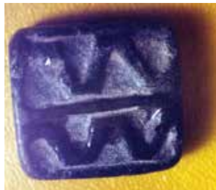
شکل ۲-۱. مهرها و جام پویانمایی (انیمیشن) شهر سوخته سیستان