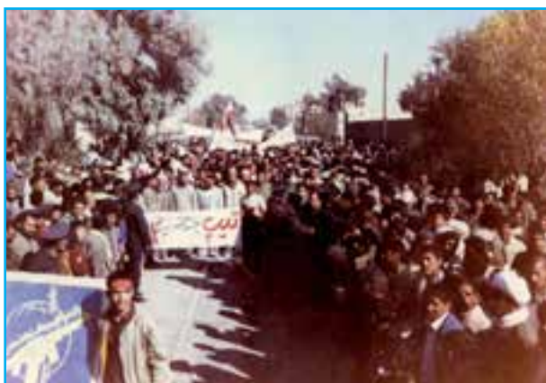
شکل ۱-۲- اعزام رزمندگان به جبهه

به شکل زیر نگاه کنید؛ هر یک از این عکس‌ها چه موضوعی را نشان می‌دهد؟