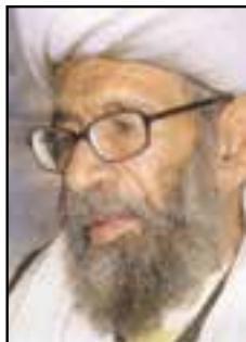
شکل ۱۲-۱۱- آیت‌الله مرادعلی بختیاری

۱۳۳۴ به قصد خدمت به زاهدان هجرت کرد و امامت مسجد نور را به عهده گرفت. در سال ۱۳۴۰ مولوی عبدالعزیز به طور رسمی امام جمعه اهل سنت زاهدان شد. عموم مردم استان اعتقاد خاصی به مولوی عبدالعزیز داشتند و می‌دانستند تصمیم‌گیری‌ها و خواسته‌های مولوی به نفع مردم و به خیر و صلاح منطقه است؛ بنابراین از دل و جان به سخنان ایشان گوش می‌دادند. مولوی معتقد بود در سایه امنیت امکان رشد منطقه تحقق می‌یابد و ناامنی به ضرر جامعه است. این روحانی بزرگوار هم از نظر اهل تشیع و اهل تسنن مورد احترام بود. اخلاص و ایمان، تدبیر و خیرخواهی مردمی وی در کنار آیت‌الله کفعمی زبازرد همه است. مولوی در سال ۱۳۴۷ به نجف (عراق) رفت و با امام خمینی (ره) ملاقات کرد. در سال ۱۳۵۸ به علت عارضه قلبی به تهران منتقل شد و در بیمارستان قلب شهید رجایی که امام راحل هم آنجا بستری بود، وی را بستری نمودند. مولوی در سال ۱۳۶۶ به علت بیماری جان‌به‌جان آفرین تسلیم کرد و طبق وصیت ایشان در روستای حیط کنار آرامگاه پدرش به خاک سپرده شد.