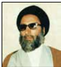
شکل ۸-۱۱- سید محمدتقی حسینی طباطبایی

چلنگ از توابع شهر زابل در خانواده‌ای روحانی، متدین و کشاورز متولد شد. پدر بزرگش سیدحسن از روحانیون مبارز شهر بود که به علّت سخترانی علیه رضاخان به بیرجند تبعید شد. پدرش سیدعلی نیز مردی متقی و پرهیزکار و از معتمدین شهر بود. تحصیلات دینی خود را از شهر زابل شروع کرد و از محضر اساتید بزرگ مشهد، علم و معرفت آموخت. وی در سال ۱۳۴۰ ازدواج کرد. بعد به زادگاهش زابل برگشت و به عنوان امام جماعت و نماینده آیت‌الله حکیم به ارشاد مردم پرداخت و خانه او پناه دردمندان و تبعیدشدگان به زابل بود که به همین جهت مدت‌ها در زندان قصر تهران زندانی شد. بعد از انقلاب به عنوان نماینده مردم سیستان در انتخابات مجلس برگزیده شد. در سن ۵۳ سالگی در هفتم تیر ماه ۱۳۶۰ به همراه شهید بهشتی و سایر کبوتران خونین بال در حادثه انفجار حزب جمهوری عاشقانه به سوی معبود ازلی پرگشود.