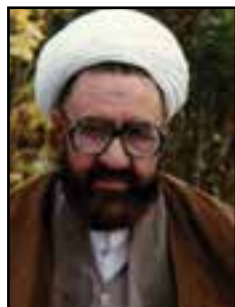
شکل ۷-۱۱- آیت‌الله مرتضی مطهری

شهید مرتضی مطهری: آیت‌الله... مرتضی مطهری در سال ۱۲۸۹ در فریمان در ۷۵ کیلومتری شهر مشهد در خانواده روحانی اصالتاً سیستانی چشم به جهان گشود، ابتدا در مکتب‌خانه و از سن ۱۲ سالگی در حوزه‌های علمیه مشهد و بعد قم به تحصیل مقدسات علوم اسلامی همت گماشت و نزد اساتیدی من جمله آیت‌الله... بروجردی و امام خمینی (ره) به تحصیل اصول فقه و عرفان پرداخت. وی در سال ۱۳۵۸ به شهادت رسید. از استاد آثار ارزشمند زیادی از جمله آشنایی با قرن، داستان راستان، انسان کامل، حقوق زن در اسلام و... به جای مانده است و نیز پدر بزرگ استاد مطهری مرحوم آخوند محمدعلی، زاده سیستانی کتابی به نام «وقایع الایام» در ۱۰۰۵ صفحه به خط بسیار خوش از خود باقی گذاشته است.