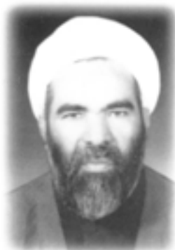
شکل ۱۳-۱۱- شهید حجت‌الاسلام حاج شیخ علی مزاری

آیت‌الله مرادعلی بختیاری: آیت‌الله بختیاری در سال ۱۳۰۸ در روستای محمدشاه کرم منطقه سیستان به دنیا آمد. دوران ابتدایی را در آن روستا و شهر زابل گذراند. در دوره جوانی به قم نزد آیت‌الله بروجردی رهسپار شد و بعد به نجف اشرف رفت و مدت ۲۳ سال از عمر خود را در نجف نزد بزرگان دین سپری کرد. آیت‌الله بختیاری سیستانی پس از آنکه امام از ترکیه به نجف آمدند، چهار سال در محضر امام خمینی (ره) بنیانگذار کبیر انقلاب اسلامی ایران به تحصیل اشتغال داشت. در سال ۱۳۴۸ شمسی ایشان جهت پاسخگویی به مسایل دینی مردم سیستان عازم سرزمین مادری‌اش شد. آیت‌الله مرادعلی بختیاری در سن ۸۱ سالگی به دیار باقی شتافت.