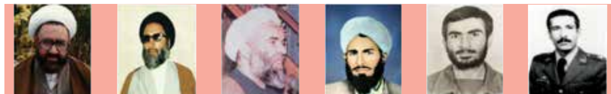
محمد امین میرمراذهی حاج قاسم میر حسینی مولوی فیض محمد حسین بر حجت السلام علی مزاری حسین طباطبایی آیت ا... مرتضی مطهری