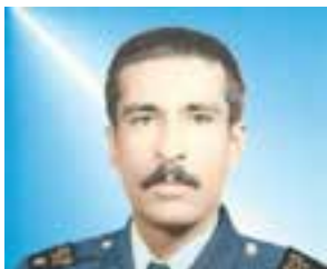
شکل ۱۵-۱۱- شهید محمدامین میرمراذهی

خلبان شهید محمد امین میرمراذهی : سرتیپ خلبان شهید محمدامین میرمراذهی از برادران اهل تسنن و قشر بلوچ بود که در روستای سیب از شهرستان سیب و سوران در آذرماه سال ۱۳۳۲ متولد شد. او از طایفه میرمراذهی یکی از اقوام اصیل و نجیب قوم بلوچ بود و پدر ایشان حاج گهرام نیز یکی از افراد متعهد و ریش سفیدان منطقه است. دوران ابتدایی را در روستای سیب و دوره دبیرستان را در شهرستان سراوان با کسب نمرات بالایی طی کرد و از شاگردان ممتاز دبیرستان خویش بود و در تعطیلات تابستان دوشادوش پدرش در کارهای کشاورزی به عنوان یک وظیفه کار می کرد. در سال ۱۳۵۳ به استخدام هوانیروز ارتش درآمد و پس از گذراندن دوره فن پرواز با بالگرد در اصفهان موفق به پذیرفته شدن دوره خلبانی بالگرد شد. در سال ۱۳۵۷ در روستای خودش درباره مسائل روز و مشارکت مردم در تظاهرات علیه حکومت شاهنشاهی سخنرانی کرد. در سال ۱۳۵۸ ازدواج کرد. خلبان شهید سرتیپ محمدامین میرمراذهی در عملیات های متعدد جنگی حماسه های جاوید و به یاد ماندنی خلق کرد و طعم تلخ موشک ها و راکت های بالگردش را دشمنان ایران بارها و بارها چشیدند. در آخرین مأموریت، این خلبان فداکار در عملیات رمضان در تاریخ ۲۳ تیرماه ۱۳۶۱ به اتفاق همزمش به درجه رفیع شهادت نایل شد.