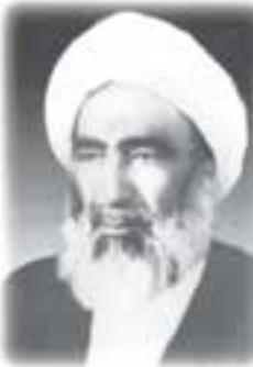
شکل ۱۰-۱۱- آیت‌الله کفعمی خراسانی

آیت‌الله حاج شیخ محمد کفعمی خراسانی : وی در سال ۱۲۸۹ شمسی در خانواده‌ای مذهبی در شهر مشهدالرضا (ع) به دنیا آمد. پدر ایشان شیخ رجبعلی محدثی از روحانیونی بود که در کنار کشاورزی و طلبگی، مرد سیاست هم بود و به همین دلیل از تشکیل مجالس مذهبی به دستور رضاخان ممنوع شد. وی مدتی در زابل به تبلیغ دین پرداخت و باعث بیداری مردم و قیام آنان بر ضد عمال امیرقاین شد. در سال ۱۳۲۵ آیت‌الله کفعمی به درخواست مؤمنان زاهدان به این شهر مهاجرت کرد. وی فعالیت گسترده‌ای برای از بین بردن اختلاف اهل تشیع و اهل تسنن که قرن‌ها از جانب استعمارگران دامن زده شده بود، انجام داد و جلوی تبلیغات فرق ضاله را گرفت و وفاق زیادی بین شیعیان ایجاد کرد. در سال ۱۳۴۳ کنار حضرت آیت‌الله خامنه‌ای که به زاهدان آمده بودند، قرار داشت. پس از پیروزی انقلاب اسلامی ایشان به استقبال حضرت امام رفت و در این سفر وظیفه خطیر نمایندگی حضرت امام (ره) و امامت جمعه زاهدان به عهده ایشان گذارده شد و تا زمانی که وضعیت جسمانی ایشان اجازه می‌داد، این وظیفه را برعهده داشت. سرانجام پس از چند دهه زندگانی پاک و خدمات تابناک با دید فراملی در منطقه سیستان و بلوچستان، در ۳۱ تیر ۱۳۶۲ دعوت حق را لبیک گفت. امروزه همه مردم استان فارس و بلوچ و ... از ایشان به نیکی یاد می‌کنند.