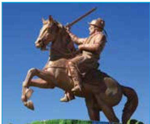
شکل ۴-۱۰- یعقوب لیث صفاری