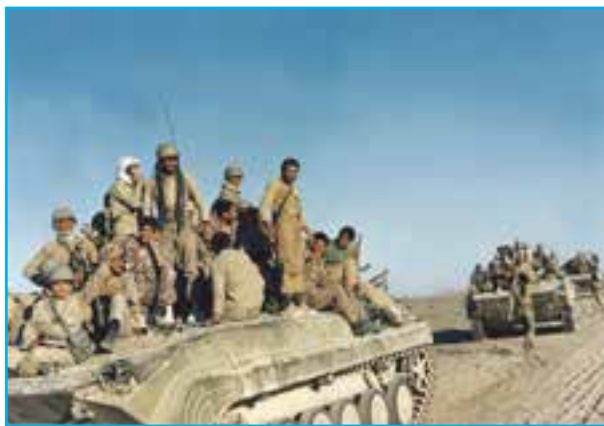
شکل ۱-۱- رزمندگان در جبهه‌ها

استان سیستان و بلوچستان به علت موقعیت جغرافیایی خاص خود و واقع شدن در همسایگی دو کشور بی‌ثبات افغانستان و پاکستان در خط اول دفاع از سرزمین ایران و مبارزه با اشراک و قاچاقچیان موادمخدر قرار گرفته است. در دوران دفاع مقدس نیز مردم این استان با پاسداری از سرزمین‌های غربی، و کیان و تمامیت سرزمین ایران در برابر هجوم بیگانگان نقش کلیدی و مهمی را ایفا کرده‌اند و از هیچ‌گونه فداکاری و ایثاری در این زمینه دریغ نکرده‌اند؛ چرا که خاک ایران را ناموس خود دانسته و دفاع از اسلام و ایران را واجب می‌دانند.