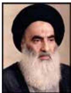
شکل ۶-۱۱- آیت‌الله سیستانی

آیت‌الله العظمی حاج سیدعلی حسینی سیستانی: آیت‌الله سیستانی در سال ۱۳۴۹ ه.ق متولد شدند. خاندان ایشان از سادات حسینی هستند که در عهد صفوی در اصفهان می‌زیستند و سلطان حسین صفوی جدّ اعلاّی ایشان سیدمحمد را به منصب شیخ‌الاسلامی در سیستان منصوب کرد و از آن زمان تا حدود ۴۰۰ سال در سیستان ساکن بودند و خاندان ایشان در سیستان زندگی می‌کنند. سیدعلی جدّ معظمّله اولین شخصی بود که از سیستان به شهر مقدّس مشهد مهاجرت کرد. آیت‌الله سیستانی شهرت و محبوبیت زیادی در عراق، کشورهای خلیج فارس، هند، آفریقا به ویژه در میان جوانان دارند و از مراجع تقلید سرشناس و برجسته می‌باشند.