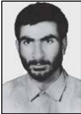
شکل ۱۴-۱۱- شهید قاسم میرحسینی