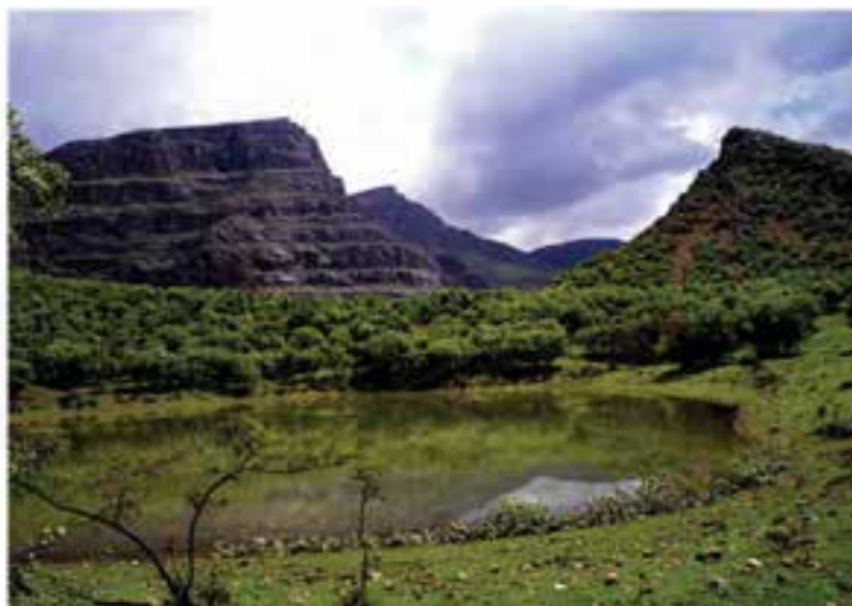
شکل ۱۳-۱۲- چشم‌اندازهایی از طبیعت استان