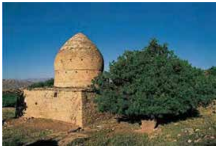
شکل ۱۱-۱- آرامگاه شجاع‌الدین خورشید

در نیمه دوم قرن ششم هجری حکومت لرستان به شجاع‌الدین خورشید سپرده شد. جانشینان وی با عنوان اتابکان لر کوچک بیش از چهار قرن یعنی تا سال ۱۰۰۶ هـ.ق./۹۷۶ هـ.ش. بر لرستان حکومت کردند. اتابکان اگر چه با درایت خویش مانع یورش چنگیز مغول شدند و مغولان با حکام لر کوچک از در صلح درآمدند، اما از حمله تیمور لنگ از امان نماندند و با وجود مقاومت تحسین برانگیز مردم لرستان، سپاه تیمور شهرهای خرم‌آباد و بروجرد را ویران کرد.