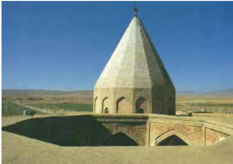
شکل ۱۲-۱۰- گنبد امامزاده قاسم از نا

حکومت طولانی اتابکان لر کوچک برای لرستان، آبادانی، امنیت و رونق به همراه داشت و در شکل‌گیری ویژگی‌های فرهنگی و اجتماعی مردم منطقه اهمیت زیادی داشت. لرستان در این دوره از آبادترین ایالت‌های ایران به شمار می‌رفت.