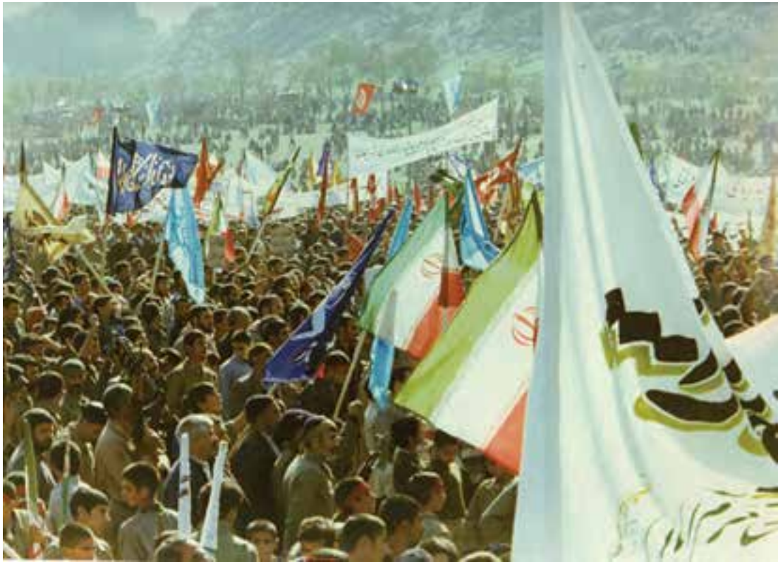
شکل ۲-۱۱- اعزام بسیجیان استان به جبهه‌های جنگ تحمیلی