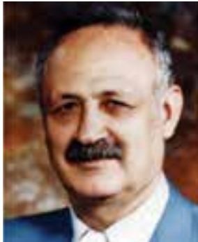
دکتر عبدالحسین زرین‌کوب