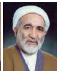
آیت‌الله مهدی قاضی