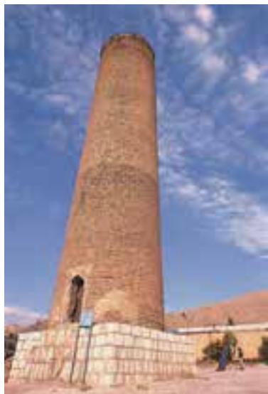
شکل ۱۰-۹- مناره خرم‌آباد