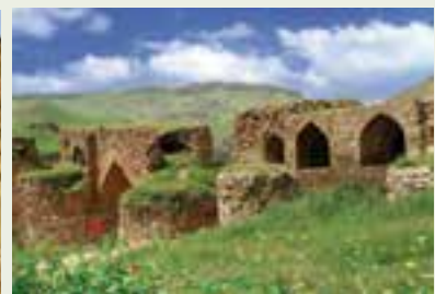
شکل ۷-۱۲- مهم‌ترین پل‌های تاریخی استان