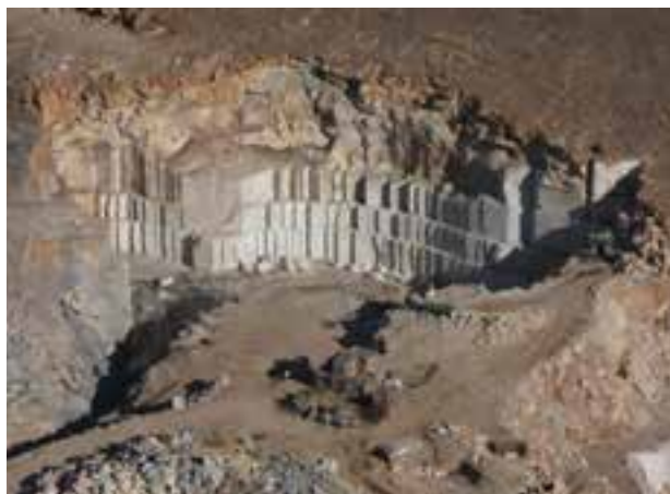
شکل ۵- ۱۳