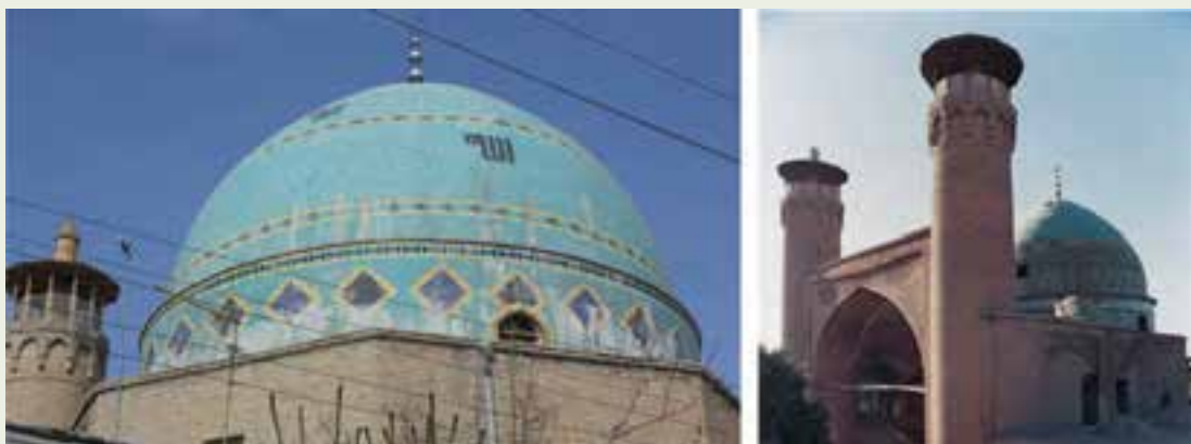
شکل ۸-۱۲- مسجد جامع بروجرد

مسجد جامع بروجرد: این مسجد زیبا و بی‌نظیر چون نگینی در مرکز شهر باصفای بروجرد واقع شده است. زمان ساخت آن مربوط به عهد سلجوقی و یکی از کهن‌ترین مساجد غرب کشور است. بر اساس کتیبه‌های موجود در زمان شاهان صفوی این مسجد دارای تزئینات آجری و کاشیکاری بوده است. گرچه مسجد جامع بروجرد در اثر حوادث گوناگون طبیعی آسیب دیده، اما هنوز شکوه خود را به عنوان یکی از نمونه‌های فرهنگ و تمدن لرستان حفظ کرده است.