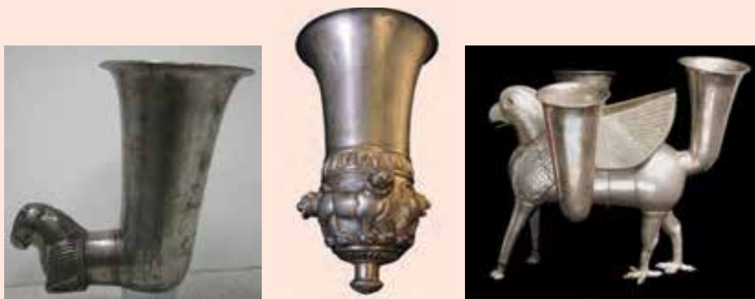
شکل ۵-۱۰- آثار پیدا شده در غار کلماکره

غار کلماکره در ۱۵ کیلومتری شمال غرب شهر پلدختر، بزرگترین گنجینه ایران باستان و یکی از چند گنجینه بزرگ کشف شده در جهان است. این غار به طور تصادفی در سال ۱۳۶۷ ه.ش کشف شد و متأسفانه مورد هجوم سوداگران آثار باستانی قرار گرفت. آثار به غارت رفته این گنجینه بزرگ هم‌اکنون در موزه‌های کشورهای آمریکا، انگلیس، سوئیس، فرانسه و... به نمایش گذاشته شده‌اند. بیشتر اشیای غار کلماکره از جنس نقره هستند.