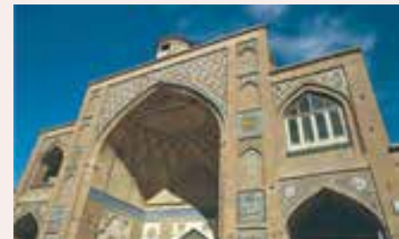
شکل ۱۲-۱۲- برخی از جاذبه‌های گردشگری استان