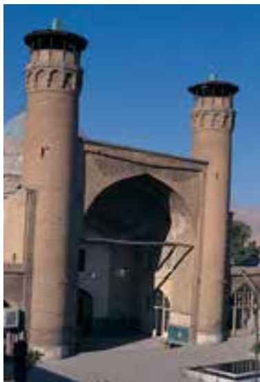
شکل ۱۰-۱- مسجد جامع بروجرد

آلبویه و خلیفه عباسی قرار گرفت. از جمله اقدامات وی در لرستان می‌توان به تعمیر و بازسازی برخی پل‌های ارتباطی اشاره کرد. خاندان حسویه تا اوایل قرن پنجم هجری در لرستان حکومت کردند. در عصر حکومت سلجوقیان بر ایران، مدتی خاندان بُرْسُقی از کارگزاران و فرماندهان سلجوقی بر مناطقی از لرستان از جمله شاپور خواست و الشتر حکومت می‌کردند. کشف سنگ قبرهایی مربوط به خاندان برسقی در الشتر، یادآور حاکمیت این خاندان بر لرستان است. سنگ‌نوشته خرم‌آباد از دوران حکمرانی برسقیان برجای مانده است.