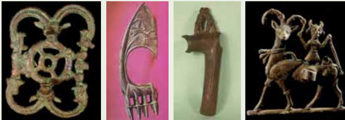
شکل ۴-۱۰- مفرغ‌های لرستان

موزه‌های ایران و جهان نگهداری می‌شوند. برخی ساخته‌های مفرغی به دست آمده از قبرها، نشان می‌دهد مردم آن دوره به زندگی پس از مرگ اعتقاد داشته‌اند و هنگام خاک‌سپاری مردگان اشیای مورد نیاز زیستن را به همراه بت‌های مورد پرستش در قبر می‌نهادند. می‌توان نتیجه گرفت مفرغ‌های لرستان ساخته هنری ساکنان بومی منطقه بوده است که در نتیجه ارتباط با اقوام همسایه و تحت تأثیر جهان‌بینی، سبک و شیوه‌های بومی منطقه به وجود آمده‌اند. موقعیت جغرافیایی منطقه زاگرس نیز که گذرگاه اقوام گوناگون بوده، تأثیر خود را بر هنر مفرغ‌کاری لرستان نیز بر جا گذاشته است.