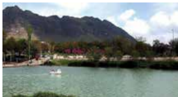
شکل ۲-۱۲- گردشگری در لرستان