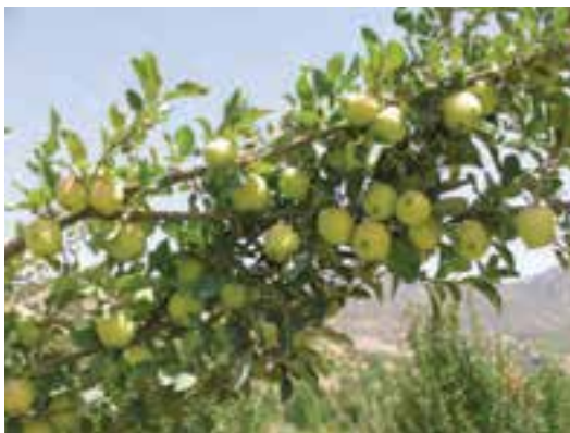
شکل ۱-۱۳- باغداری در استان