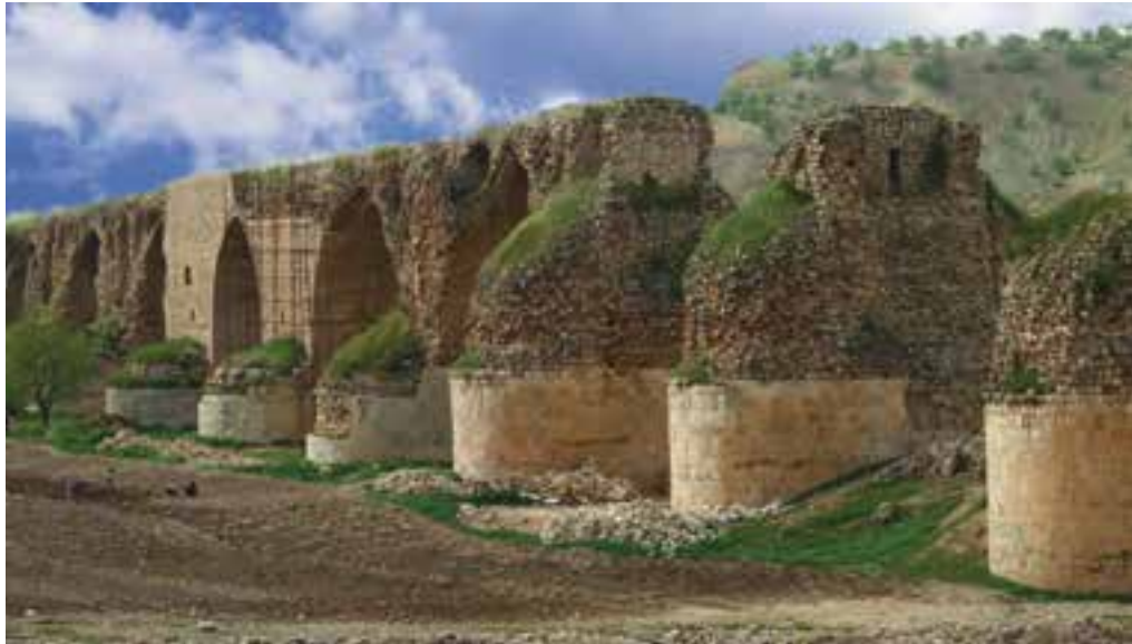
شکل ۷-۱۰- پل کشکان

در عهد ساسانیان، لرستان نیز بخشی از سرزمین پهلوی (پهله) بود و جزو استان خوروران یا الی مائیس محسوب می‌شد. حکومت ساسانی در بخش پیشکوه لرستان، شهر و قلعه مهم شاپورخواست و در الشتر کنونی آتشکده آروخش را بنا کرد. همچنین بر روی رودهای سیمره و کشکان در مسیر راه تیسفون به شرق ایران و نیز در مسیر راه شمال به جنوب، پل‌هایی در لرستان ساختند.