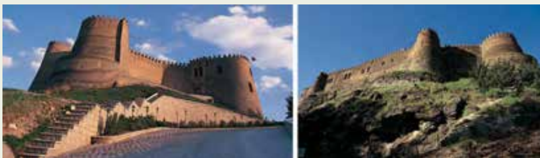
شکل ۶-۱۲- قلعه فلک‌الافلاک

آیا تاکنون از این قلعه بازدید کرده‌اید؟ این قلعه که از زمان قاجار به این نام خوانده شده بر فراز تپه‌ای در بلندترین نقطه شهر خرم‌آباد واقع شده است. نام قدیم آن «دژ شاپور خواست» بوده و قدمت آن به دوره ساسانی می‌رسد. آب