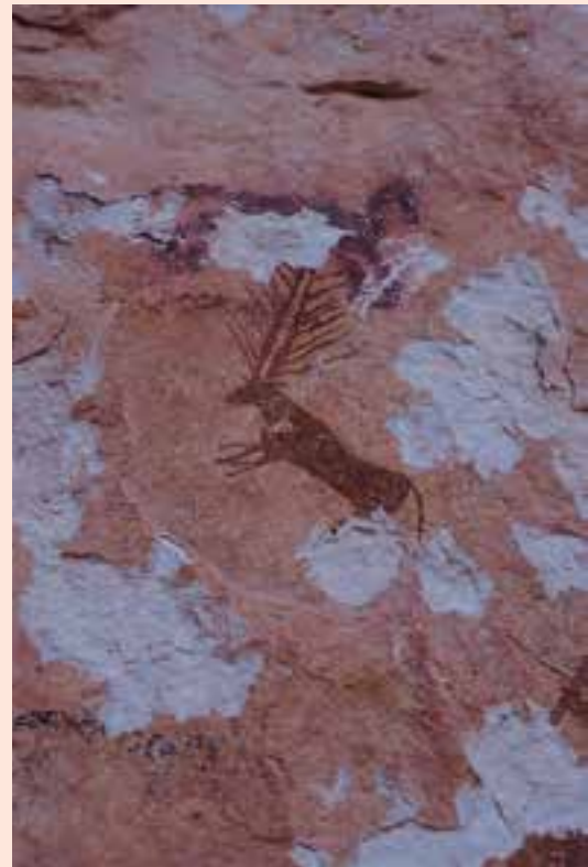
شکل ۲-۱۰- نقش دیواره، غار هومیان