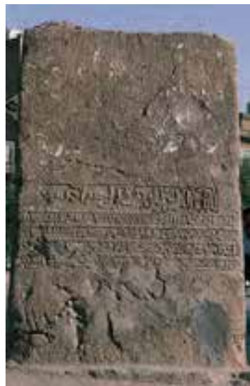
شکل ۱۰-۸- سنگ نوشته خرم‌آباد