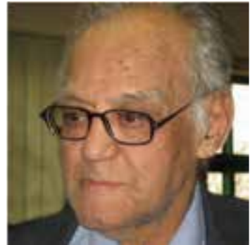
دکتر سیدجعفر شهیدی