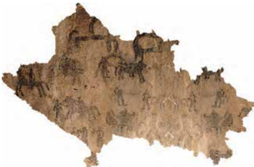
شکل ۱-۱- نگاره‌های غار دوشه، بخش چگنی

جاهایی مانند غارهای کُنْجی، یافته، پاسنگر، گرآرجه و قَمَری در خرم‌آباد و غارهای سنگ سفید (تَرْد اِسبی) و هومیان در کوه‌دشت از جمله مکان‌های شناسایی شده دوره پارینه‌سنگی میانه در لرستان هستند. همچنین تپه‌ها و محوطه‌های باستانی زیادی مربوط به دوره نوسنگی شناسایی شده‌اند. تپه باغ نو در نزدیکی خرم‌آباد و تپه شهن‌آباد دلفان از این نمونه هستند.