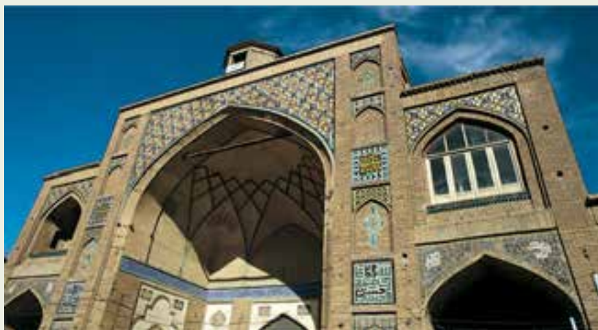
شکل ۹-۱۲- مسجد امام بروجرد

مسجد امام (سلطانی سابق): این بنا یکی از ارزشمندترین و ممتازترین بناهای دوره اسلامی در لرستان است. مسجد امام بروجرد دارای سه درگاه بسیار زیباست، که با کاشی‌خشت هفت رنگ به سبک دوره قاجاری تزیین شده است. طرح و نقشه این بنا از مسجد امام تهران الگوبرداری شده است. این بنا مربوط به دوره قاجاریه (فتحعلی‌شاه قاجار) است.