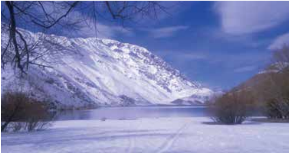
شکل ۱-۱۲- دریاچه گهر در فصل زمستان

گردشگری نه تنها تأمین‌کننده‌ی یکی از نیازهای روحی و روانی انسان است بلکه توسعه‌ی این صنعت می‌تواند آثار اقتصادی، اجتماعی و فرهنگی پرباری برای یک منطقه به ارمغان آورد. استان لرستان به دلیل دارا بودن چشم‌اندازهای زیبای طبیعی، جاذبه‌های تاریخی، فرهنگی و نقش ارتباطی، زمینه مناسبی برای توسعه‌ی این صنعت، دارد.