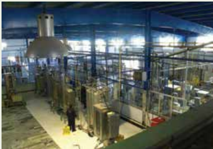
شکل ۶-۱۳- صنایع استان

برخی از صنایع مهم استان عبارت‌اند از: صنایع شیر ایران سهامی عام، دارو سازی اکسیر، دارو سازی بایر افلاک، کارخانه سیمان وفاسیت دورود، خودروسازی زاگرس، شیمیایی معدنی لرستان با تولید پودر میکرونیزه در الیگودرز، فروآلیاژ ایران، پتروشیمی لرستان، فولاد ازنا، نساجی بروجرد، صنایع غذایی گهر، آب معدنی بیشه، تعاونی تولید الکل اتیلیک، پلی استر لرستان، کاشی جم، کاشی سامان، آهک صنعتی و هیدراته لرستان، پارت لبن، پارسیلون، یخچال سازی، ماشین سازی.