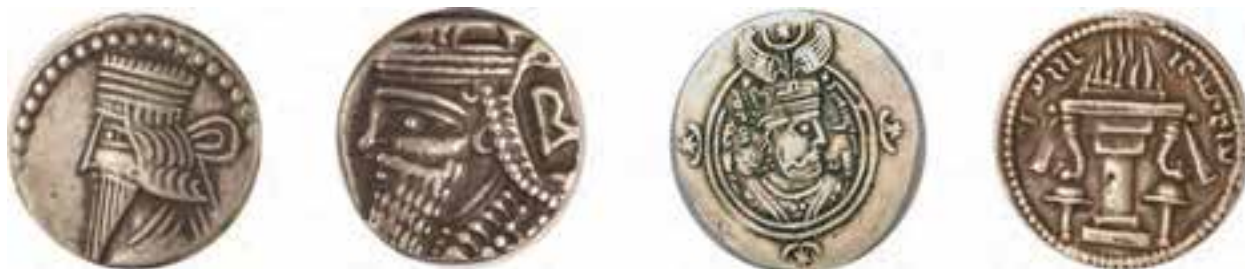
شکل ۶-۱۰- سکه‌های دوره اشکانی و ساسانی

در دوران سلوکی سرزمین لرستان قسمتی از قلمرو آنان محسوب می‌شد و در دوره اشکانیان بخشی از سرزمین پهلوی (پهله) بود. غار کوگان و آثار معبد مهر در رومشکان، از جمله یادگارهای دوره اشکانی هستند.