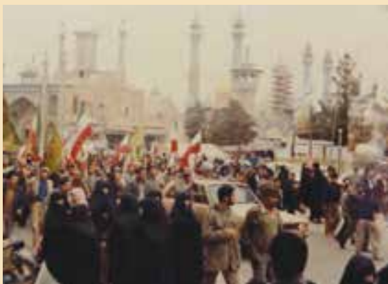
شکل ۱۰-۴- عزیمت رزمندگان استان قم به جبهه‌های جنگ

در آبان ماه ۱۳۶۱ با ایجاد تغییراتی در سازماندهی نیروهای سپاه، لشکر ۱۷ علی بن ابی‌طالب - علیه السلام - سازمان یافت و نیروهای اعزامی از استان قم به همراه چند استان دیگر در این لشکر سازماندهی شدند و به دفاع از میهن اسلامی پرداختند.