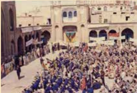
شکل ۱۱-۴- عزیمت رزمندگان روحانی به جبهه‌ها