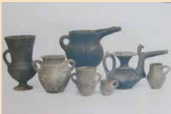
شکل ۴-۵- آثار کشف شده در تپه تاریخی صرم