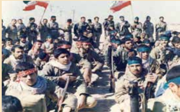
شکل ۱۶-۴- نقش دانش آموزان قمی در دفاع مقدس