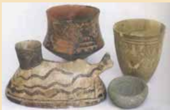
شکل ۴-۶- آثار کشف شده در قره تپه قمرود

ظروف از سفال‌های آجری و نخودی رنگ استفاده می‌کردند اما با ورود آریایی‌ها، سفالینه‌های خاکستری جایگزین آنها شد.