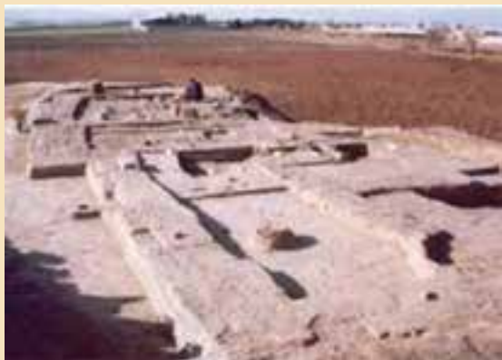
شکل ۴-۴- تپه تاریخی قلی درویش