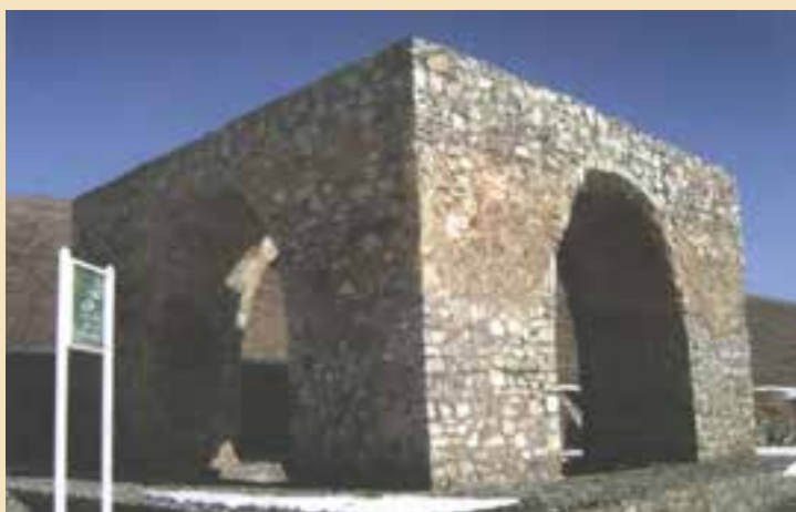
شکل ۷-۴- چهار طاقی (آتشکده) نویس در غرب استان

۲- چهار طاقی یا آتشکده : چهار طاقی یا آتشکده از آثار به جای مانده دوران پیش از اسلام در سرزمین قم است که معروفترین آنها چهار طاقی نویس (شکل ۷-۴) واقع در بخش خلجستان (روستای نویس) و چهار طاقی کزیمجگان واقع در جنوب استان قم (در روستای کرمجگان) است که هر دو مربوط به عصر ساسانی است.