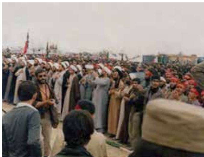
شکل ۱۴-۴- اعزام طلاب به جبهه