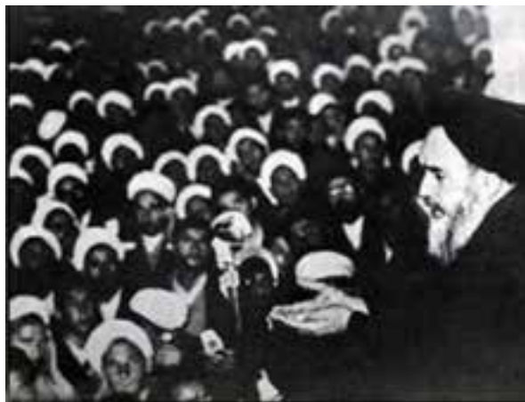
شکل ۳-۴- سخنرانی پرشور امام خمینی (ره) در ۱۲ خرداد سال ۱۳۴۲

پس از پیروزی شکوهمند انقلاب اسلامی ایران، شهر قم به پایتخت مذهبی کشور تبدیل شده است و علما و مردم آگاه قم در تحولات سیاسی کشور نقش مهمی ایفا می‌کنند و همواره پشتیبان برنامه‌ها و اهداف انقلاب اسلامی هستند.