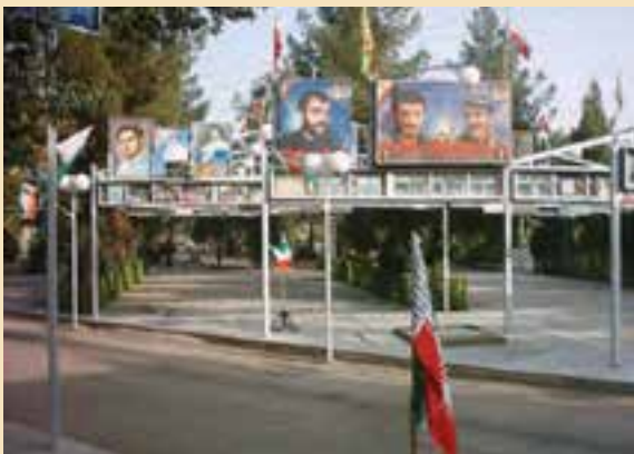
شکل ۱۲-۴- گلزار شهدای قم

در طول جنگ حدود ۵۰/۰۰۰ نفر از استان قم به جبهه‌های نبرد اعزام شدند. از این تعداد، حدود ۶۰۰۰ نفر از رزمندگان قمی به شهادت رسیدند، ۱۲۷۰۰ نفر به افتخار جانبازی نائل آمدند و ۵۴۰ نفر نیز از آزادگان سرافرازند.