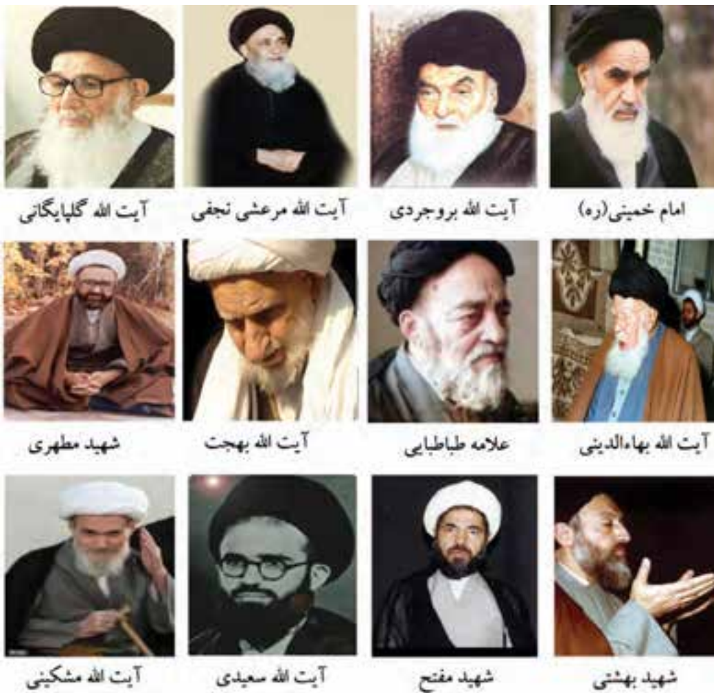
شکل ۹-۴- تصاویری از برخی شخصیت‌های بزرگ علمی و انقلابی استان قم در دوره معاصر

در دوره معاصر، بزرگان زیادی در این سرزمین مقدس زندگی کرده‌اند که به چند نفر از آنها اشاره می‌شود: حضرت امام خمینی (ره) بنیان‌گذار جمهوری اسلامی ایران، آیت الله حاج شیخ عبدالکریم حائری مؤسس حوزه علمیه قم، علامه محمد حسین طباطبایی صاحب تفسیر ارزشمند المیزان، آیت الله مرعشی نجفی، آیت الله بروجردی، آیت الله گلپایگانی، آیت الله خوانساری، آیت الله بهاء‌الدینی، آیت الله اراکی، آیت الله صدر، آیت الله بهجت، آیت الله مشکینی و استاد علی اصغر فقیهی معلم و پژوهشگر برجسته. گفتنی است شهید مفتاح، شهید مرتضی مطهری، شهید بهشتی، شهید آیت الله سعیدی و شهید حسین غفاری در راه پیروزی انقلاب اسلامی، به شهادت رسیدند.