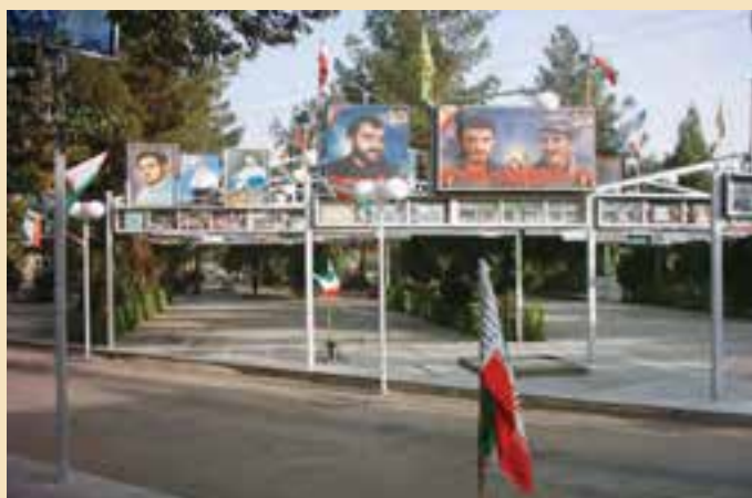
شکل ۱۸-۴- گلزار شهدای امام زاده علی بن جعفر علیه السلام قم

شهدای گمنام: یکی از مکان‌هایی که مورد بازدید و زیارت مردم قم و زائران حرم مطهر حضرت معصومه (س) قرار می‌گیرد مرقد پاک و مطهر ۱۴ شهید گمنام در محل کوه خضر نبی (ع) است. این شهدا که در پایین کوه خضر به خاک سپرده شده‌اند یکی از میعادگاهها و زیارتگاههای مردم به‌شمار می‌رود که در هفته به‌خصوص شب‌های جمعه پذیرای تعداد زیادی از زائران و هم‌زمان شهدا و مردم استان و دیگر مناطق کشور است.