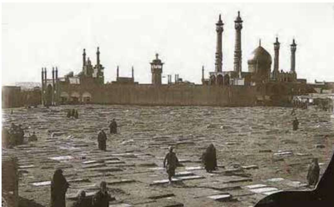
شکل ۲-۴- تصویر تاریخی از حرم مطهر حضرت معصومه (س)

در دوران سلطنت پهلوی دوم، قم به سنگر مبارزه فکری و مذهبی علیه سیاست‌های ضد مذهبی حکومت تبدیل شد. اولین جرقه انقلاب اسلامی در بهمن سال ۱۳۴۱ در شهر مقدس قم زده شد. مخالفت‌های علما و در رأس آنها حضرت امام خمینی (ره) با لایحه انجمن‌های ایالتی و ولایتی، فراندوم اصول ششگانه انقلاب شاه و لایحه کاپیتولاسیون، شهر قم را به پایگاه مبارزه علیه رژیم محمد رضا پهلوی تبدیل کرد.