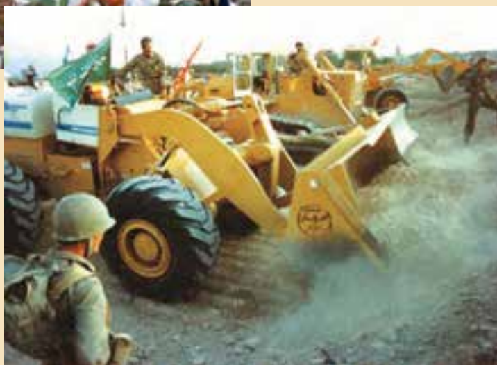
شکل ۱۵-۴- نقش جهادسازندگی در هشت سال دفاع مقدس