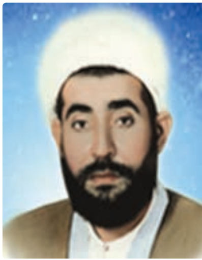
شکل ۵-۱- شهید ابوتراب عاشوری