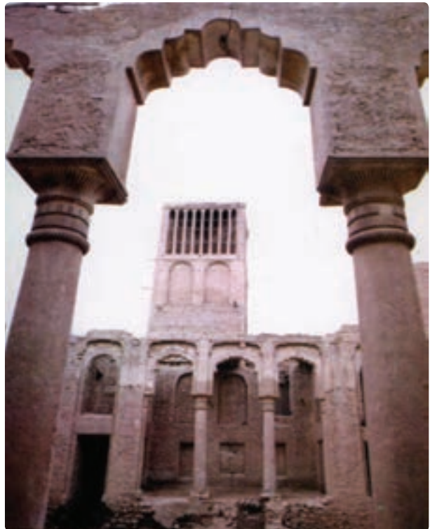
شکل ۱-۱۲- جاذبه‌های گردشگری استان