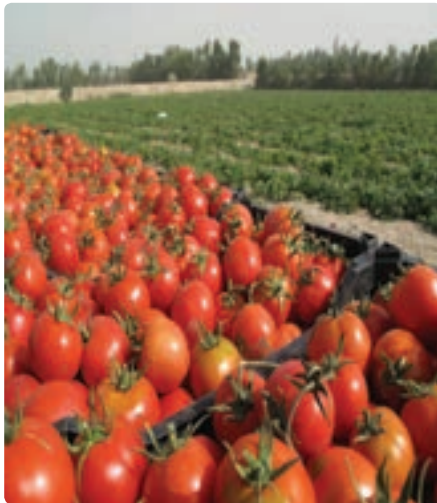
برداشت گوجه فرنگی از مزارع

از کل مساحت دشت‌ها و جلگه‌های استان که ۱/۸ میلیون هکتار است ۱۷ درصد به کشت انواع محصولات کشاورزی اختصاص یافته است. تأمین سرمایه کافی و آموزش‌های لازم و بهبود شیوه‌های بهره‌برداری از آب و خاک، می‌تواند سطح زیر کشت استان را افزایش دهد.