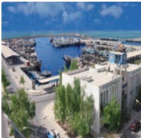
بندر صیادی دیر