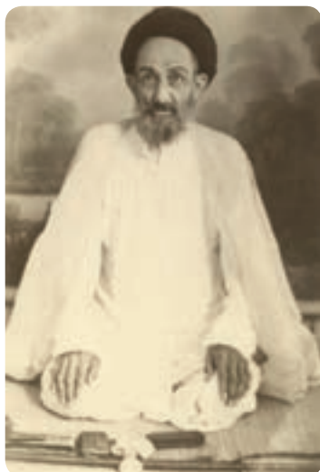
شکل ۱-۱- آیت‌الله سیدعبدالله مجتهد بلادی بوشهری

استان بوشهر در کنار آب‌های نیلگون خلیج فارس یکی از مراکز قدیمی تمدن ایران زمین است که در عرصه‌های گوناگون علمی، فرهنگی و مذهبی افتخارآفرین بوده است. در کنار مشاهیر و مفاخر ایران زمین، بوشهر هم مفتخر به بزرگانی است که در حیطه کاری، زندگی و آسایش خود را وقف بهتر زیستن هموعان کرده‌اند و در این راستا منشأ تحولات عمیق علمی، فرهنگی و مذهبی شده‌اند.