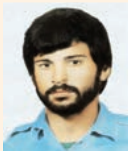
شکل ۱۳-۱۰ شهید علیرضا ماهینی

در دوران تجاوز هشت ساله عراق به ایران اسلامی، مردم استان بوشهر هم مانند دیگر شهرهای ایران به دفاع از مرزهای کشورمان به خصوص مرزهای دریایی پرداختند. نیروی دریایی بوشهر در آغازین سال‌های جنگ با نابود کردن نیروی دریایی عراق، کنترل این آبراه مهم جهانی را در اختیار گرفت. در این راستا ناخدا محمد ابراهیم همتی و دیگر پرسنل ناوچه پیکان حماسه‌ای بزرگ آفریدند. آنان با مقاومت و جان‌فشانی ضربات سختی بر نیروی دریایی عراق وارد کردند و با شهادت خود درس خوبی به متجاوزان آموختند.