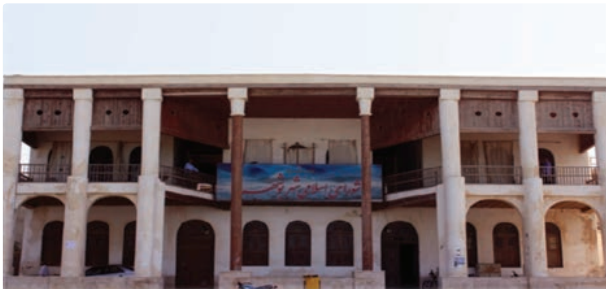
شکل ۱۳-۱۲- عمارت امیریه مربوط به دوره قاجار (شورای شهر کنونی) - بندر بوشهر