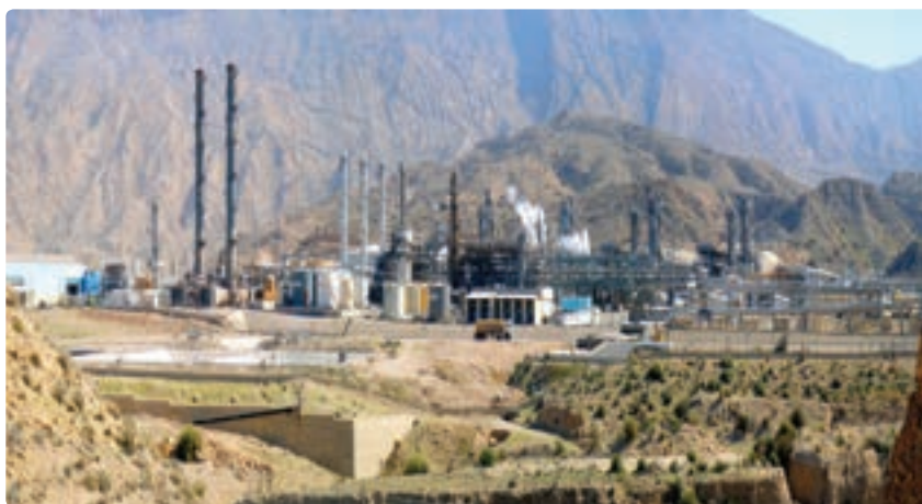
شکل ۱۲-۱۳- تأسیسات گازی پارس جنوبی