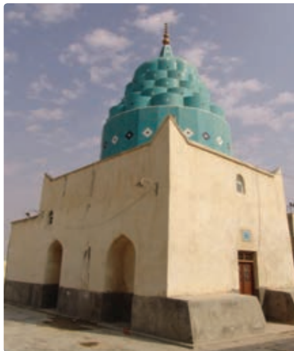
امام زاده سلیمان بن علی - گناوه

شکل ۱۹-۱۲- امامزاده‌ها اصلی‌ترین مکان‌های زیارتی استان