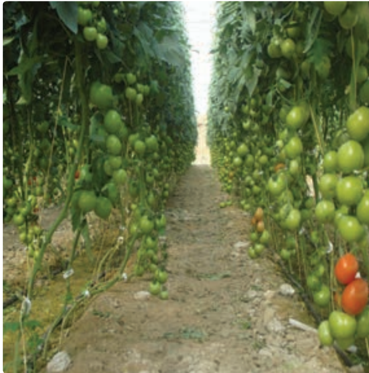
شکل ۲-۱۳- کشت گلخانه‌ای گوجه فرنگی

یکی از زمینه‌های جدید در بخش کشاورزی و استفاده بهینه از منابع آب و خاک، گسترش کشت گلخانه‌ای است. در سال‌های اخیر کشت گلخانه‌ای در استان گسترش یافته است.