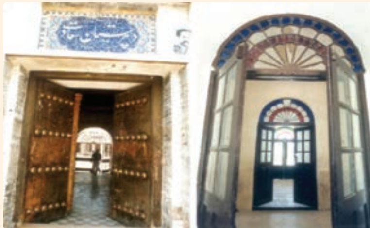
شکل ۲۱-۱۰- مدرسه سعادت بوشهر (تأسیس ۱۳۱۷ قمری)

مدرسه سعادت مظفری در سال ۱۳۱۷ ه.ق/۱۲۷۸ ه.ش در بندر بوشهر تأسیس شد. این مدرسه یکی از جدیدترین مؤسسات آموزشی ایران است که معلمان و شاگردان آن در سال‌های بعد در اهواز، خرمشهر، بندرعباس، بندر لنگه، آبادان، نجف اشرف و بحرین مدارس جدیدی ایجاد کردند و به همین دلیل به مادر مدارس جنوب ایران مشهور است.