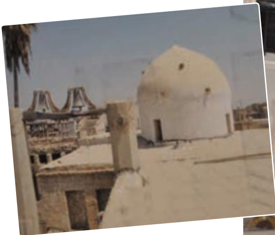
کلیسای آرامنه گریگوری بوشهر (تصاویر پس از بازسازی)