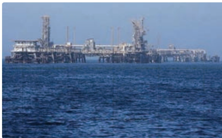
شکل ۹-۱۳- حوزه نفتی فلات قاره