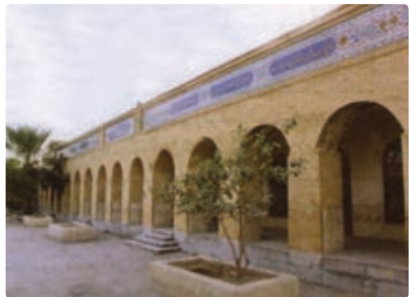
مدرسه سعادت بوشهر مربوط به دوره قاجار