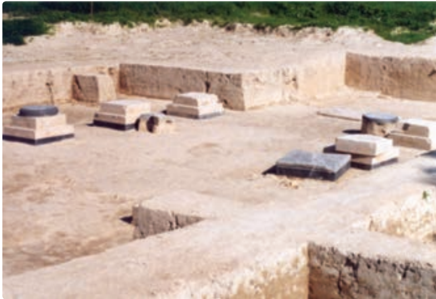
شکل ۲-۱۰- سرستون‌های کاخ کوروش در چرخاب برازجان

دوره اسلامی: یاقوت حموی، ابن خردادبه و بلاذری تصرف مناطقی چون توز، سینیز و راشهر را در کوره اردشیرخوره و شاپورخوره با اختلاف نظر بین سال‌های ۱۶ تا ۱۹ قمری ذکر کرده‌اند. بلاذری، تصرف ریشهر را به دست عثمان ابن ابی العاص در سال ۱۹ هـ. ق/۶۴۰ م ذکر می‌کند. سردار معروف ایرانی که در مقابل اعراب مسلمان مقاومت می‌کرد، شهرک نام داشت. برای تسخیر شهر، جنگ شدیدی در گرفت که شهرک و فرزندش به قتل رسیدند و ریشهر با تلفات زیادی تسلیم شد. بلاذری، این فتح را در دشواری و کثرت غنایمی که به دست مسلمانان افتاد، با فتح قادیسیه مقایسه کرده است.