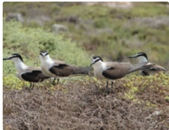
شکل ۱۲-۱۲- پرندگان و پوشش گیاهی منطقه حفاظت شده مند

(ب) جاذبه‌های انسانی : نواحی جنوبی ایران به خصوص استان‌های خوزستان و بوشهر، جزء نخستین زادگاه‌های تمدن بشری است، اما به دلیل شرایط اقلیمی (رطوبت و تبخیر زیاد و تأثیر فرسایش) تعداد کمی از میراث چند هزار ساله، از دولت‌های باستانی ایلام، هخامنشیان، اشکانیان، ساسانیان و دوره بعد از اسلام و قرون اخیر مخصوصاً افشاریه، زند، قاجار، پهلوی اول، باقی مانده که باعث شده استان بوشهر یکی از قطب‌های گردشگری در سطح ملی و جهانی تبدیل شود. از میان صدها اثر تاریخی استان بیش از ۲۷۲ اثر در فهرست ملی به ثبت رسیده است.