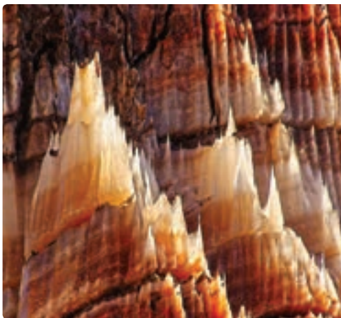
شکل ۱۰-۱۲- قندیل های گنبد نمکی جاشک (دیر- دشتی)