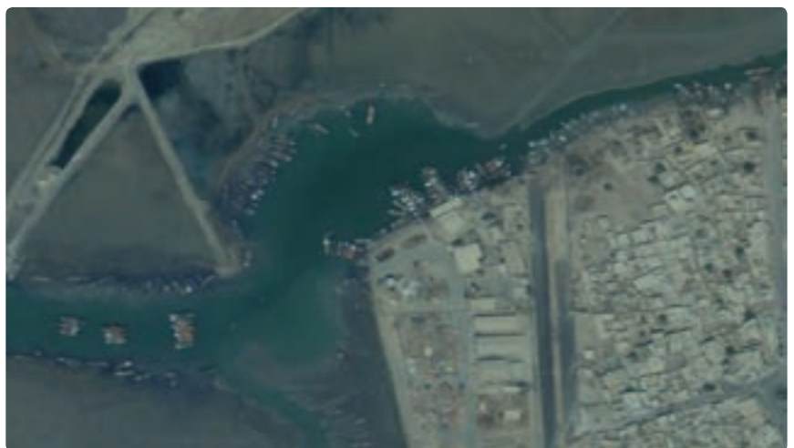
شکل ۱۶-۱۳- تصویر ماهواره ای از اسکله بندر دیلم