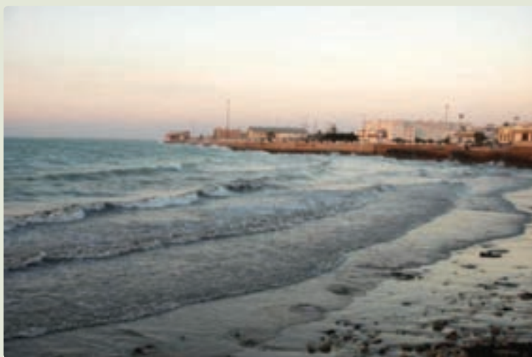
شکل ۳-۱۰- ساحل بوشهر

تاریخ جدید بوشهر، با پادشاهی نادر شاه افشار (۱۱۴۸-۱۱۶۰ ق/ ۱۷۳۶-۱۷۴۷ م) شروع می‌شود. نادر و سیاست دریایی او در مبارزه با عثمانی‌ها و گسترش قلمرو دریایی او در خلیج فارس سبب شد تا شهر بوشهر مورد توجه قرار گیرد. نادرشاه، بوشهر را که نام آن را به (بندر نادریه) تغییر داده بود، به صورت یک مرکز کشتی‌سازی و پادگان نظامی درآورد. با مرگ نادر، سپاه دریایی او میان حکام بوشهر و بندرعباس تقسیم شد. شیخ ناصر خان آل مذکور که ناخدا باشی کشتی‌های نادر بود، حکومت قدرتمندی با عنوان (خاندان آل مذکور) پدید آورد که صد سال بر بوشهر حکومت کردند. در دوران حاکمیت او و فرزندش شیخ نصر، بوشهر رو به عمران و آبادی گذاشت و روابط تجاری گسترده‌ای با انگلیسی‌ها و دیگر اروپائیان برقرار شد.