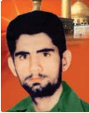
شکل ۲۰-۱۰- شهید غلامحسین توسلی