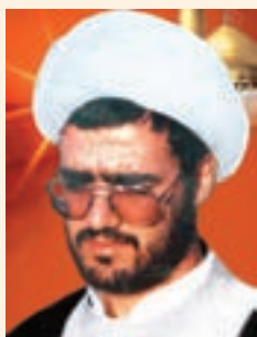
شکل ۱۵-۱۰- شهید صادق گنجی

شهید خضر نامور فرزند حاج محمود، خواهرزاده شهید رئیس علی دلواری در سال ۱۳۴۱ خورشیدی متولد شد. در فاصله سال‌های ۱۳۶۰-۱۳۵۹ خورشیدی در مدرسه راهنمایی بوالخیر از توابع بخش دلوار در پست معلم امور تربیتی به کار مشغول شد. این شهید بزرگوار در تاریخ ۱۳۶۱/۱/۷ در عملیات غرور آفرین فتح‌المبین در منطقه شوش به شهادت رسید.