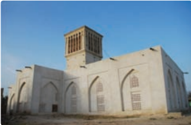
مسجد بردستان - یکی از قدیمی ترین مساجد جنوب ایران مربوط به قرن نهم هجری - دیر