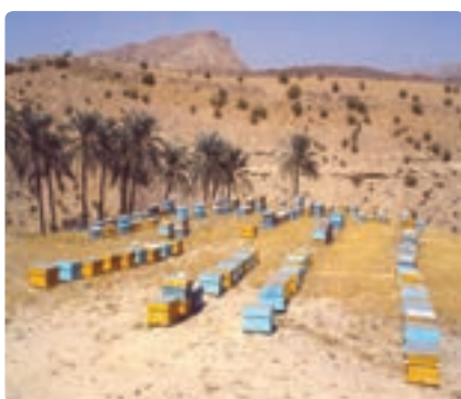
شکل ۷-۱۳- پرورش زنبور در استان

د) دامداری و دامپروری: دامداری در کنار زراعت و باغداری به عنوان حرفه‌ای اصلی یا تکمیلی در تمام طول تاریخ در روستاهای استان متداول بوده است. ضعف روزافزون مراتع استان، دامداری سنتی را با مشکل روبه‌رو کرده است. نیازهای پروتئینی استان از طریق توسعه دامپروری صنعتی فراهم شده است.