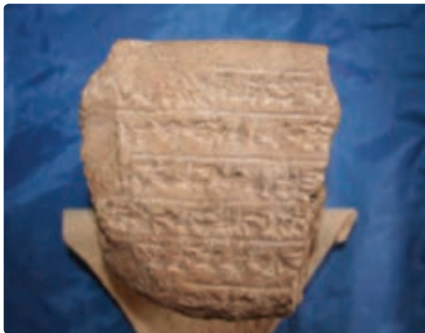
شکل ۱-۱۰ - خشت نبشته ایلامی (لیان)

بوشهر، از قدیمی‌ترین ایام تاکنون نام‌های گوناگون داشته است. در دوره ایلامی، آن را لیان می‌نامیدند. در زمان اردوکشی نئارخوس (نئارک) - دریاسالار اسکندر مقدونی - مسامبریا (Mesamberia)، و در روزگار حکمرانی سلوکیان بر ایران، انطاکیه پارس خوانده می‌شد. در منابع عصر ساسانی آن را بخت اردشیر و ریواردشیر Rivardshir می‌نامیدند. در دوره اسلامی نام آن به صورت ریشهر، راشهر، زبصهر، راکسل Raxel، بندر نادریه، ابوشهر و سرانجام بوشهر آمده است. گمان می‌رود یاقوت حموی، نخستین کسی باشد که از بوشهر قدیم نام برده است. برخی از صاحب‌نظران معتقدند که «بوشهر» دگرگون شده نام قدیم این شهر در دوره ساسانی «ریواردشیر» می‌باشد.