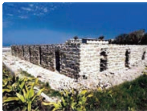
آب انبار قوام - بوشهر