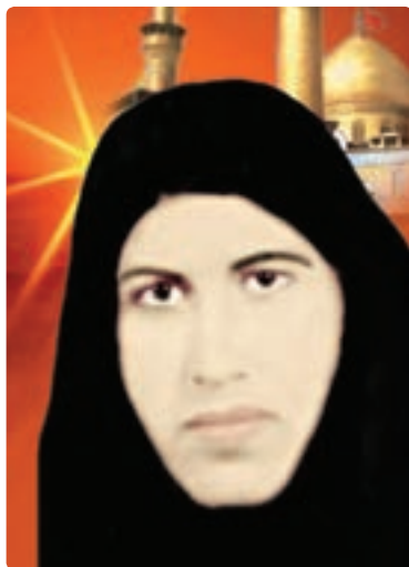
شکل ۶-۱- شهیده سمنبر عالی پور

مردم استان بوشهر نیز مانند دیگر شهرهای ایران از آغازین روزهای نهضت امام خمینی (ره) به مبارزه با رژیم استبدادی محمدرضا شاهی اقدام کرده و در این راستا ۱۷ شهید تقدیم انقلاب اسلامی کردند که از چهره های شاخص این مبارزات می توان به روحانی شهید حجة الاسلام ابوتراب عاشوری و شهیده سمنبر عالی پور از دیر اشاره کرد.