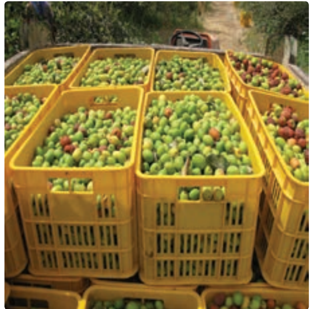
شکل ۴-۱۳- کنار پیوندی از محصولات صادراتی بخش کشاورزی استان بوشهر