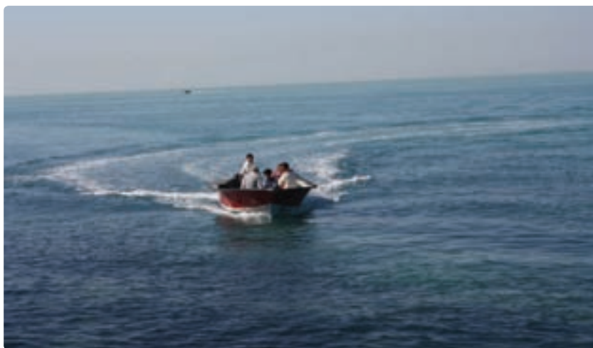
شکل ۲-۱۲ - قایقرانی یکی از جاذبه‌های ساحلی استان

در اختیار دارد، چنان‌که سواحل بندر بوشهر، گناوه، دیلم، ریگ، ماسه‌ای، سواحل سیراف (طاهری)، نای‌بند، عسلویه، صخره‌ای و سواحل جزیره خارک مرجانی از زیبایی خیره‌کننده برخوردارند. این سواحل در نیمه دوم سال با توجه به شرایط آب و هوایی مناسب از ظرفیت بالایی برای ورزش‌های آبی برخوردار است که می‌تواند پذیرای گردشگران زیادی باشد.