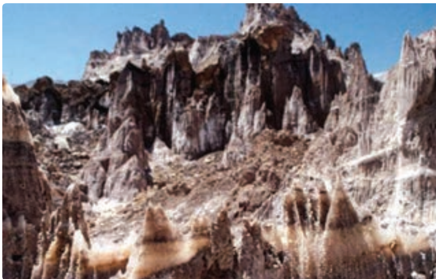
شکل ۴-۱۲- گنبد نمکی جاشک - شهرستان‌های (دیو - دشتی)

۲- کوه‌ها : بخش اعظم نواحی شمال شرقی و شرق استان را کوه‌های کم ارتفاع و بلند در بر گرفته که امکانات متنوعی برای فعالیت‌های گردشگری و علمی فراهم نموده است. از آن میان می‌توان به کوه «نمک» یا گنبد نمکی در جاشک (حد فاصل شهرستان دیو و دشتی) اشاره نمود که به‌عنوان یک پدیده کم‌نظیر و فوق‌العاده زیبا و حیرت‌انگیز از شاهکار طبیعت که در آن غارها و چشمه‌های نمکی و قندیل‌های زیبا به فراوانی به چشم می‌خورد به‌همین جهت همه ساله تعداد زیادی گردشگر برای دیدن این پدیده طبیعی به منطقه سفر می‌کنند.