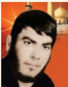
شکل ۱۴-۱۰- شهید خضر نامور

شهید خضر نامور فرزند حاج محمود، خواهرزاده شهید رئیس علی دلواری در سال ۱۳۴۱ خورشیدی متولد شد. در فاصله سال‌های ۱۳۶۰-۱۳۵۹ خورشیدی در مدرسه راهنمایی بوالخیر از توابع بخش دلوار در پست معلم امور تربیتی به کار مشغول شد. این شهید بزرگوار در تاریخ ۱۳۶۱/۱/۷ در عملیات غرور آفرین فتح‌المبین در منطقه شوش به شهادت رسید.