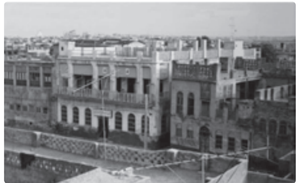
شکل ۴-۱- بافت قدیم بوشهر