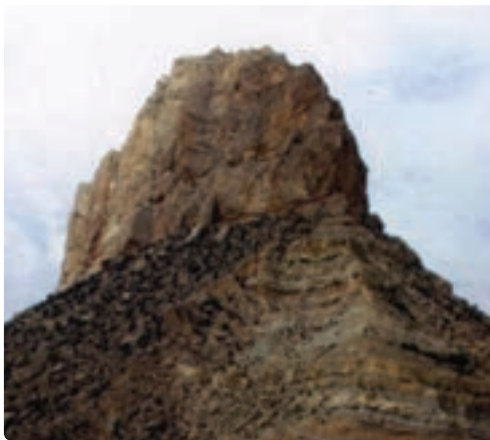
شکل ۸-۱۲- کوه پردیس - جم