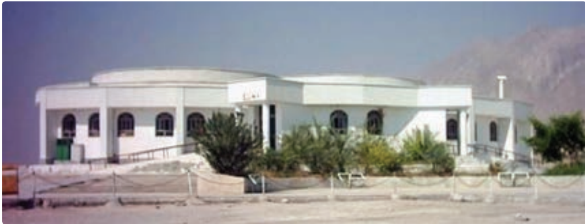
شکل ۶-۱۲- چشمه های آبگرم اهرم - تنگستان