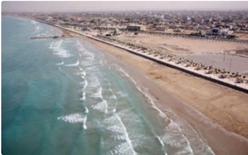
شکل ۳-۱۲- استفاده از پتانسیل سواحل و دریا برای توسعه گردشگری - (بندر گناوه)

۲- کوه‌ها : بخش اعظم نواحی شمال شرقی و شرق استان را کوه‌های کم ارتفاع و بلند در بر گرفته که امکانات متنوعی برای فعالیت‌های گردشگری و علمی فراهم نموده است. از آن میان می‌توان به کوه «نمک» یا گنبد نمکی در جاشک (حد فاصل شهرستان دیو و دشتی) اشاره نمود که به‌عنوان یک پدیده کم‌نظیر و فوق‌العاده زیبا و حیرت‌انگیز از شاهکار طبیعت که در آن غارها و چشمه‌های نمکی و قندیل‌های زیبا به فراوانی به چشم می‌خورد به‌همین جهت همه ساله تعداد زیادی گردشگر برای دیدن این پدیده طبیعی به منطقه سفر می‌کنند.