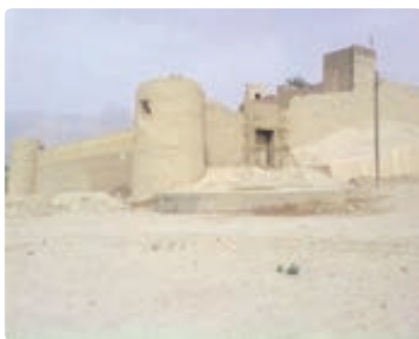
قلعه زایر خضرخان تنگستان - اهرم