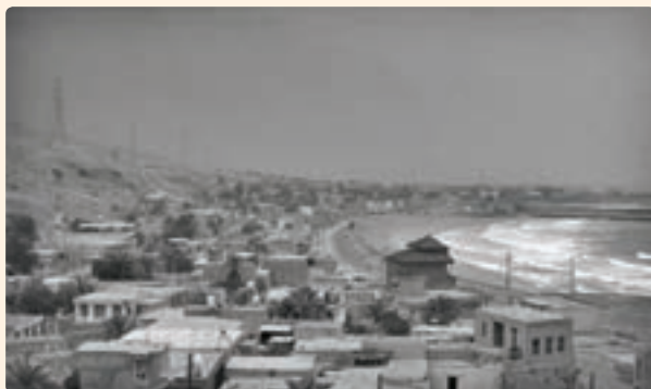
شکل ۱۷-۱۲- نمایی از بندر سیراف

این بندر عظیم در دو زلزله ای که در سال های ۳۶۷ و ۳۹۸ هجری رخ داد ویران شد و امروزه ویرانه های آن در کنار بندر کوچک سیراف (طاهری) مشاهده می شود.