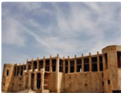
عمارت تاریخی «میلک» میلک «میلک» التجار بوشهری - بوشهر