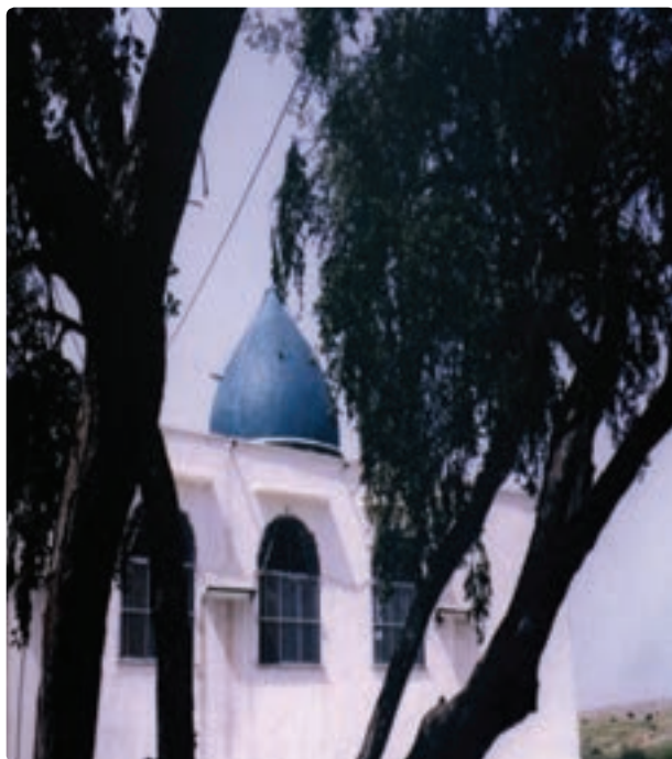
امام زاده شاهزاده ابراهیم - دشتستان