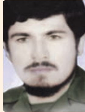
شکل ۱۹-۱۰- شهید نصرالله شفیعی