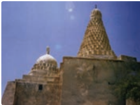
امام زاده محمد حنیفه - جزیره خارک