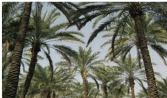
شکل ۵-۱۲- نخلستان‌های استان بوشهر (تنگستان)

۳- نخلستان‌ها : گرچه نخلستان‌ها یک پدیده کاملاً طبیعی نیستند، اما وجود نزدیک ۱۰ میلیون اصله درخت خرما و استقرار آنها در مسیر رودها و جاده‌ها مناظر فوق‌العاده زیبا و دیدنی را به وجود آورده است که نظیر آن از نظر تراکم و نحوه استقرارشان در هیچ جای ایران نمی‌توان مشاهده کرد، بیشتر این نخلستان‌ها در شهرستان دشتستان، تنگستان، جم و دشتی قرار دارد و به همین جهت استان بوشهر را سرزمین نخل و دریا می‌نامند.