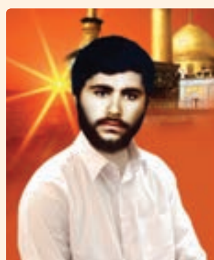
شکل ۱۶-۱۰- شهید بیژن گرد