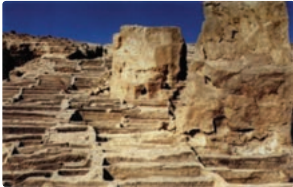
شکل ۱۶-۱۲- خرابه‌های بندر باستانی سیراف مربوط به دوره ساسانی - سیراف، شهرستان کنگان