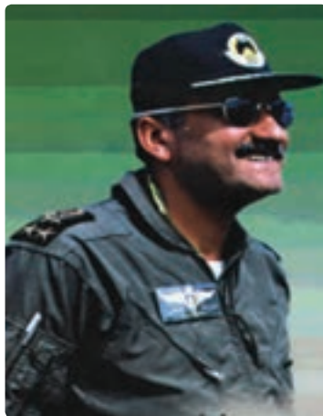
شکل ۱۰-۱- سرلشکر خلبان شهید سید علی‌رضا یاسینی

در تاریخ ۳۱ شهریورماه ۱۳۵۹ رژیم بعثی عراق به طور هماهنگ فرودگاه‌های مهم کشور را مورد تجاوز هوایی قرار داد که فرودگاه بوشهر نیز مقارن ساعت ۱۴ مورد حمله قرار گرفت و خساراتی به باند فرودگاه و منازل مسکونی مردم وارد آمد. مردم استان بوشهر از کوچک و بزرگ با تشکیل هسته‌های خودجوش و ایجاد سنگر در سواحل خلیج فارس آمادگی خود را برای دفاع از کشور به نمایش گذاشتند.