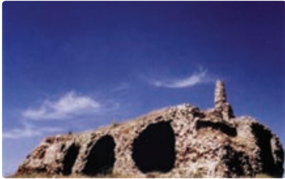
شکل ۱۵-۱۲- کوشک اردشیر مربوط به دوره ساسانی - دشتستان