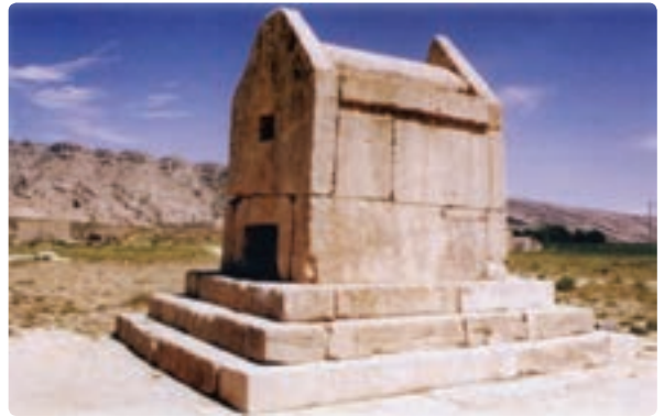
شکل ۱۴-۱۲- گور دختر مربوط به دوره هخامنشیان - دشتستان