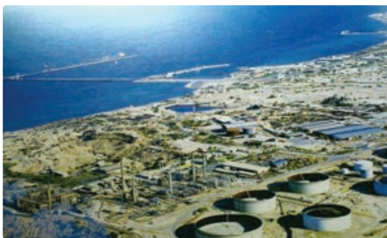
شکل ۱۰-۱۳- جزیره خارک