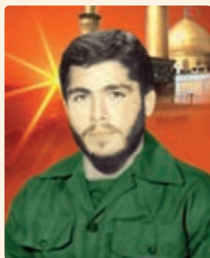
شکل ۱۷-۱۰- شهید نادر مهدوی