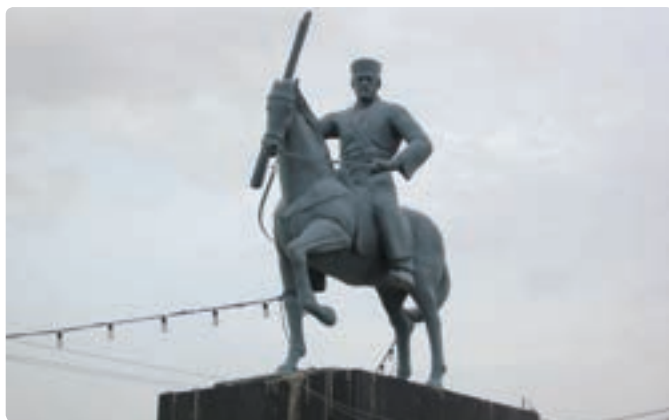
شکل ۱-۲- مجسمه شهید رئیس علی دلواری نماد مقاومت مردم بوشهر

جهانی اول در سال ۱۲۹۹ ه.ق/ ۱۲۵۹ ه.ش در قریه دلوار از توابع تنگستان ساحلی پا به عرصه حیات گذاشت. هنگامی که در