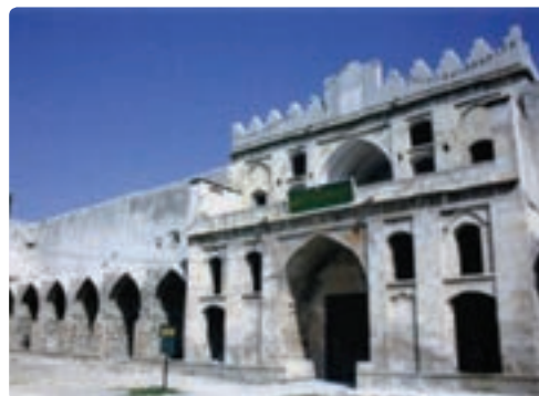
دژ، کاروان سرای مشیر الملک - برازجان