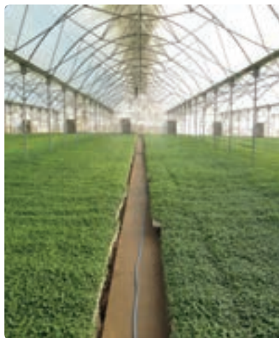
تولید نهال گلخانه‌ای