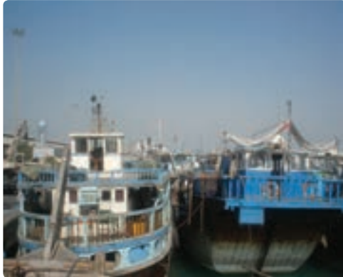
شناورهای سنتی (صیادی و تجاری)

میزان صید استان طی سال‌های ۱۳۷۹ تا ۱۳۸۴ کاهش چشمگیری یافته و از ۱۶ درصد کل کشور به ۱۱ درصد رسیده است. این در حالی است که سهم تعداد شناورها و تعداد صیادان استان به نسبت کل کشور بالاتر بوده و نشان از بهره‌وری پایین در استان است.