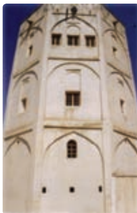
برج قلعه (قلعه محمدخان) خورموج - دشتی