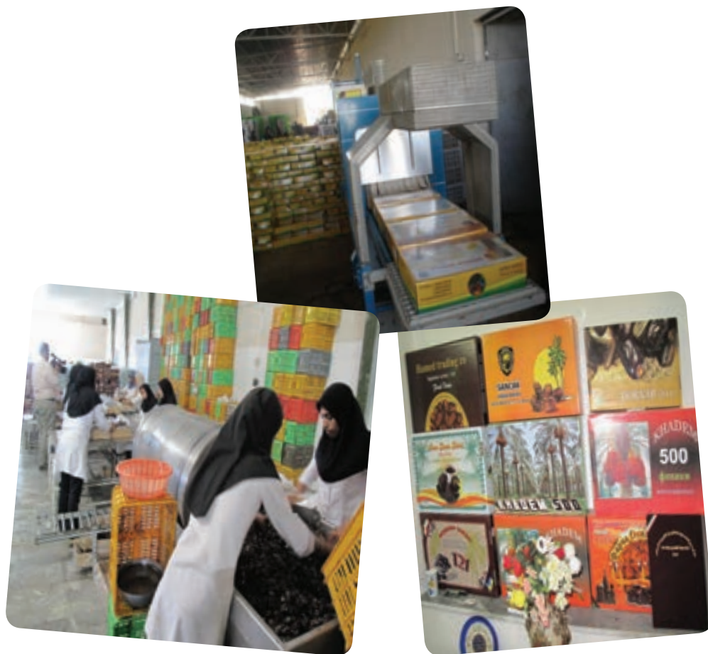
شکل ۱۳-۱۳- کارخانه بسته‌بندی خرما

علاوه بر صنایع موجود، شرایط و امکانات طبیعی و انسانی استان وجود کدام صنایع را ممکن می‌سازد؟ شهرستان محل زندگی شما در زمینه ایجاد کدام صنایع امکانات بالقوه دارد؟