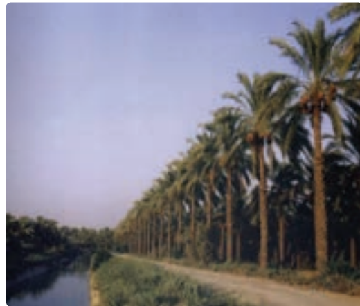
شکل ۷-۱۲- نخلستان های آبپخش - دشتستان