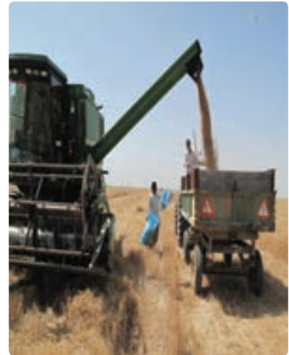
کشت و برداشت مکانیزه