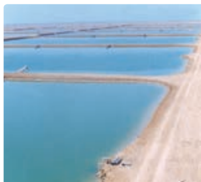
شکل ۶-۱۳- پرورش آبزیان در استان