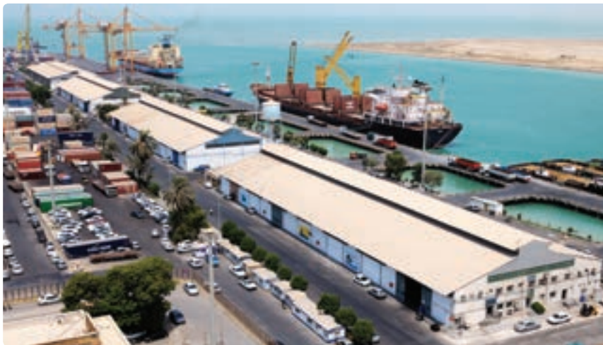
شکل ۱۵-۱۳- گمرک بندر بوشهر