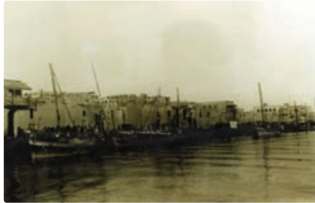
شکل ۱۱-۱۰ ساحل بوشهر

درباره مناطق تاریخی سیراف، سینیز، مهروبان، جتّابه، توز و پشت پر تحقیق و در کلاس گزارش نمائید.