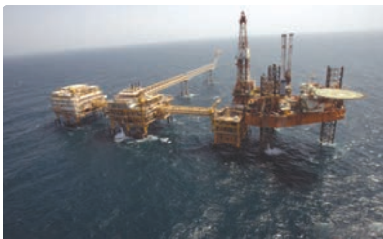
شکل ۱۱-۱۳- سکوه‌های نفتی فراساحلی (دریایی)