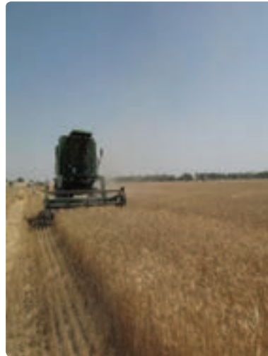
کشت و برداشت مکانیزه