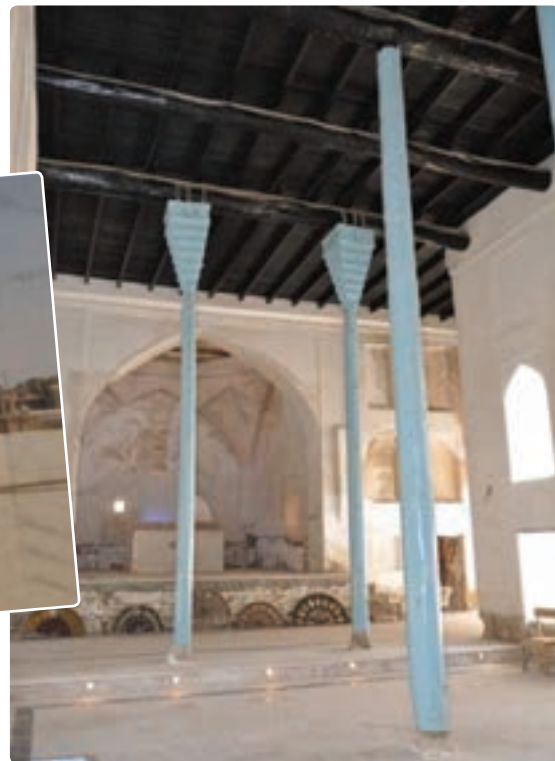
شکل ۲۰-۱۲- تصاویری از بناهای تاریخی فرهنگی استان

موزه‌ها: موزه شهید رئیس‌علی دلواری (در دلوار تنگستان) که آثار ارزنده‌ای از مبارزات ضد استعماری شهید رئیس‌علی دلواری و مردم استان بوشهر را به نمایش گذاشته است، موزه مردم‌شناسی، موزه دریانوردی ایران که در نوع خود کم نظیر است و موزه علمی و تاریخی مدرسه سعادت در بوشهر، همه ساله عده زیادی از گردشگران داخلی و خارجی را به خود جلب می‌کنند.