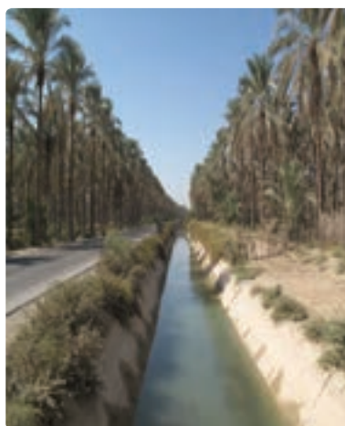
شکل ۳-۱۳- تصاویری از نخلستان‌های استان و برداشت محصول از آن