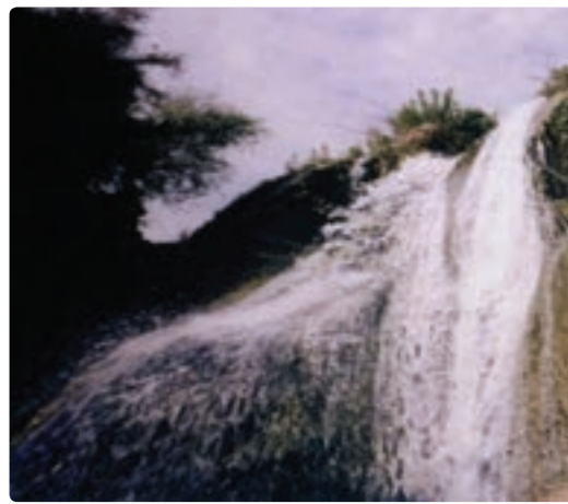
شکل ۹-۱۲- آبشار رود فاریاب - دشتستان