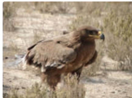
شکل ۱۱-۱۲- پوشش گیاهی و زندگی جانوری مناطق حفاظت شده مُند و خاییز