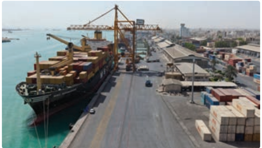
شکل ۱۴-۱۳- اسکله صادراتی بندر بوشهر