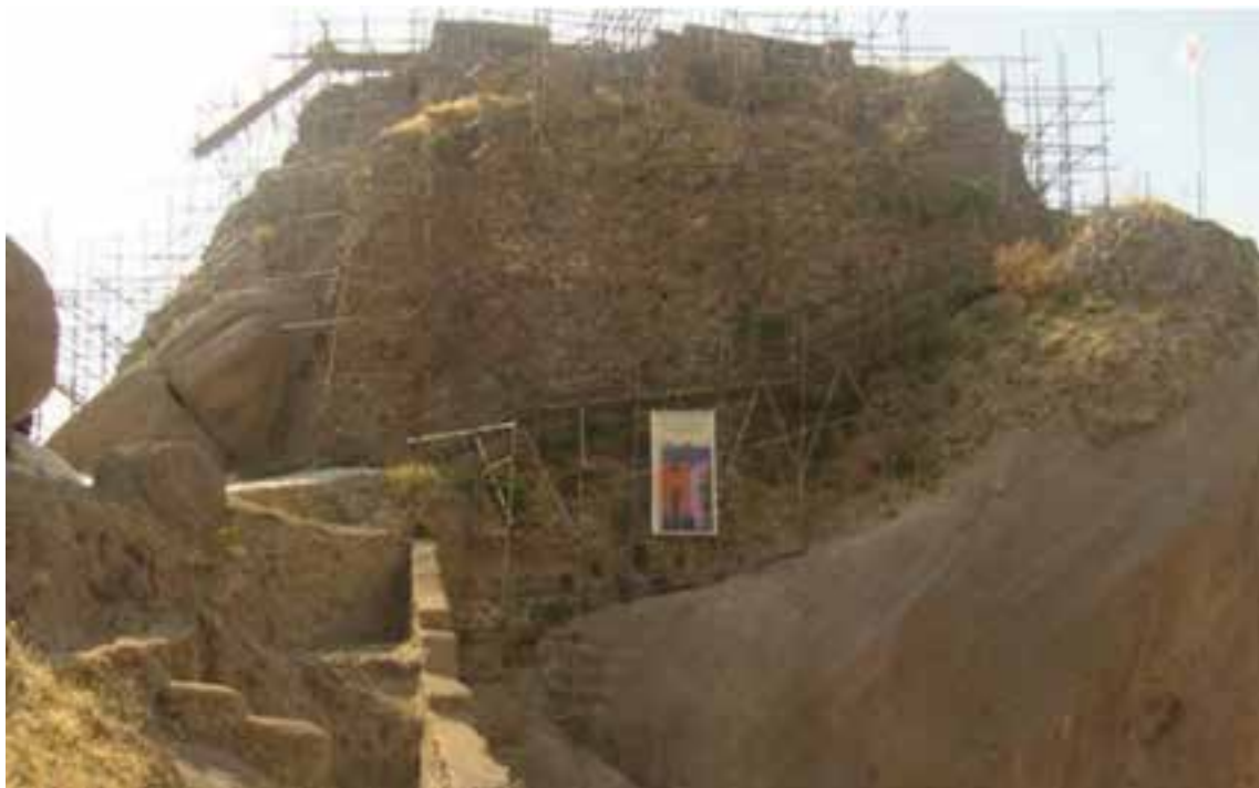
شکل ۲-۴- قلعه حسن صباح الموت، در حال مرمت