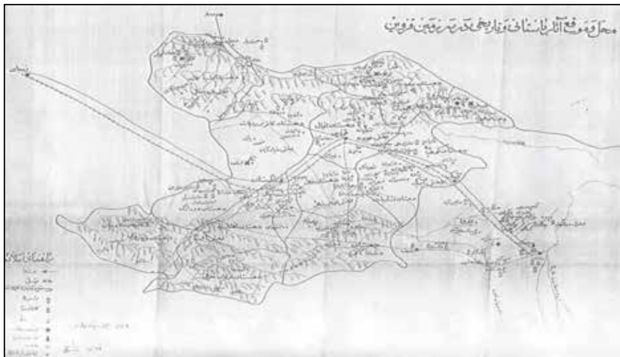
شکل ۱-۴- محل و موقع آثار باستانی و تاریخی در سرزمین قزوین