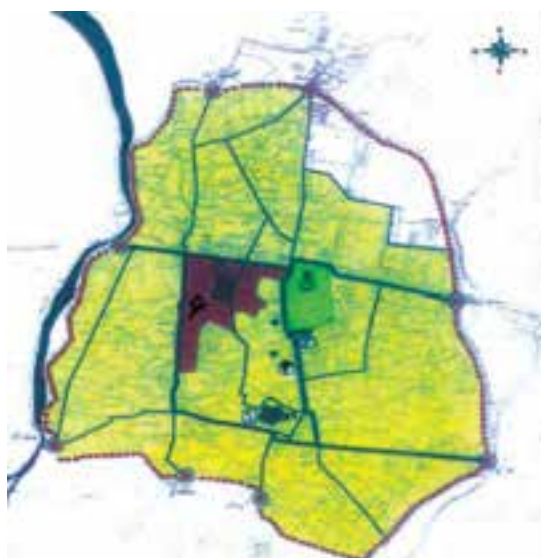
شکل ۴-۴- شهر قزوین در دوره قاجاریه

هـ. ق) پس از پیروزی بر افغان‌ها عازم قزوین شد. او به هنگام اقامت در قزوین تاجی را که بزرگان محلی در اختیارش نهاده بودند به سر نهاد و در داخل ارگ قزوین کوشکی بنا نهاد و تالاری برای پذیرایی پی افکند که به نام تالار نادری معروف شد. با مرگ نادر و درهم ریختگی اوضاع کشور، کریم خان زند (۱۱۹۳-۱۱۶۳ هـ. ق) بر تخت پادشاهی ایران نشست. قزوین در این دوره جزئی از حاکمیت این سلسله به‌شمار می‌رفت. با تأسیس سلسله قاجاریه، قزوین توسط حکام منصوب دربار قاجار یا نمایان آنان که بیشتر از شاهزادگان و وابستگان دربار بودند اداره می‌شد.