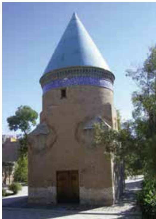
شکل ۶-۴- آرامگاه حمدالله مستوفی

حمدالله مستوفی : او نویسنده و مورخ و جغرافیدان معروف سده هشتم (تولد ۶۸۰هـ. و وفات ۷۵۰هـ.ق) و مؤلف تاریخ گزیده نزه القلوب و ظفرنامه، در دوره ایلخانان مغول می باشد. مستوفی در کارهای دیوانی و محاسباتی سرآمد بود. مزار او در محله ملک آباد قزوین واقع است.