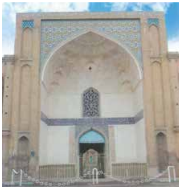
شکل ۳-۴- سردر عالی قابو از بناهای دوران صفویه

ورود سپاهیان مغول به ایران موجب ویرانی‌های بسیاری شد. با ورود آنان به شهر قزوین مردم شهر، تا سه روز با رشادت و شجاعت در مقابل مغولان مقاومت کردند، اما در نهایت سپاه مهاجم وارد شهر شد و خسارات فراوانی بر آن وارد کرد. پس از پایان حکومت مغولان و نبود حکومت قوی، صفویان توانستند دولتی نیرومند در ایران تأسیس نمایند و ثبات و نظم را به کشور بازگردانند. در زمان شاه تهماسب اول (۹۸۴-۹۳۰ ه.ق) قزوین به‌عنوان پایتخت ایران برگزیده شد و این موجب رونق و توسعه شهر گردید و واحدهای تجارتي جدیدی چون: کاروانسراها، بازارها و قیصریه‌ها در آن بنا شد. کالاها از نواحی مختلف به سوی آن سرازیر شد و راه‌های تجارتي توسعه و رونق یافت.