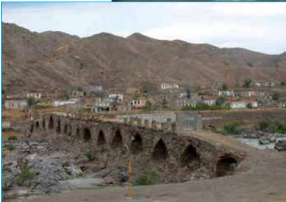
شکل ۸-۴- پل بزرگ خدا آفرین - اثری متعلق به دوران معاصر