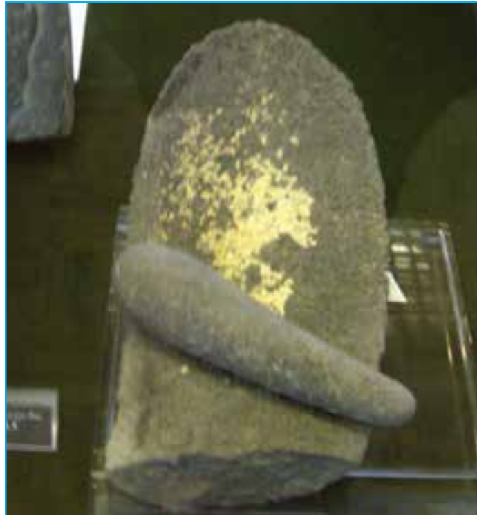
شکل ۲-۱ سنگ سیاب مربوط به هزاره سوم ق. م - خده آفرین