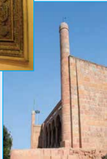
شکل ۱۹-۴ نمایی از امامزاده عون بن علی - قلعه عون بن علی مربوط به قرن هشتم و نهم و مرمت شده در دوره های بعدی