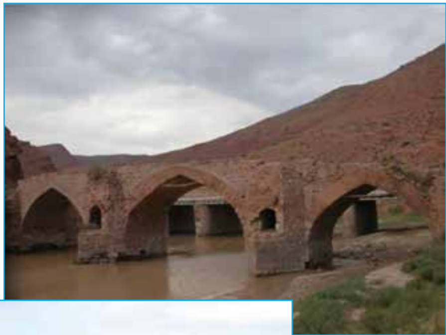
شکل ۷-۴- پل و نیار - شهرستان تهریز اثری متعلق به دوران معاصر

کشته شد، والی آذربایجان بود. در عهد بنی عباس نیز ابو جعفر منصور دوانیقی دومین خلیفه عباسی و یحیی بن خالد برمکی وزیر معروف ایرانی، از والیان معروف آذربایجان بودند. در سال ۱۹۲ فرقه خرم‌دینان در این ناحیه علیه خلفای غاصب و ستمگر عباسی به رهبری جاویدان بن سهلک سر به شورش برداشتند. این قیام بعد از مرگ او به رهبری بابک خرم‌دین ادامه یافت. عاقبت این قیام در دوره خلافت معتصم هشتمین خلیفه ستمگر عباسی به وسیله افسین سردار دیگر ایرانی که در خدمت عباسیان بود، سرکوب شد. بابک اسیر گردید و در سال ۲۲۳ هـ. ق در بغداد به دار آویخته شد.