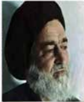
شهید آیت الله سیداسدالله مدنی