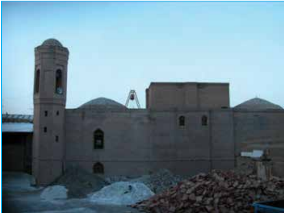
شکل ۹۲- مسجد جامع مرند دوره اتابکان قرن ۶ هـ. ق