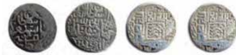
شکل ۱۷-۲- سکه‌های متعلق به دوران قرا قویونلوها