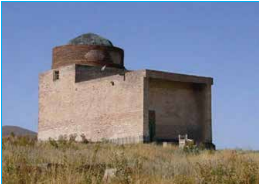
شکل ۱۲-۶- مقبره شیخ اسحاق هریس - دوره صفوی ۹۹۰ هـ.ق