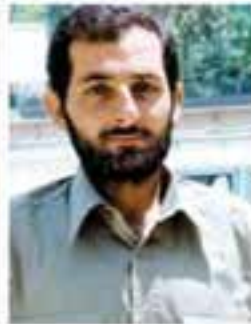
شهید مهدی باکری