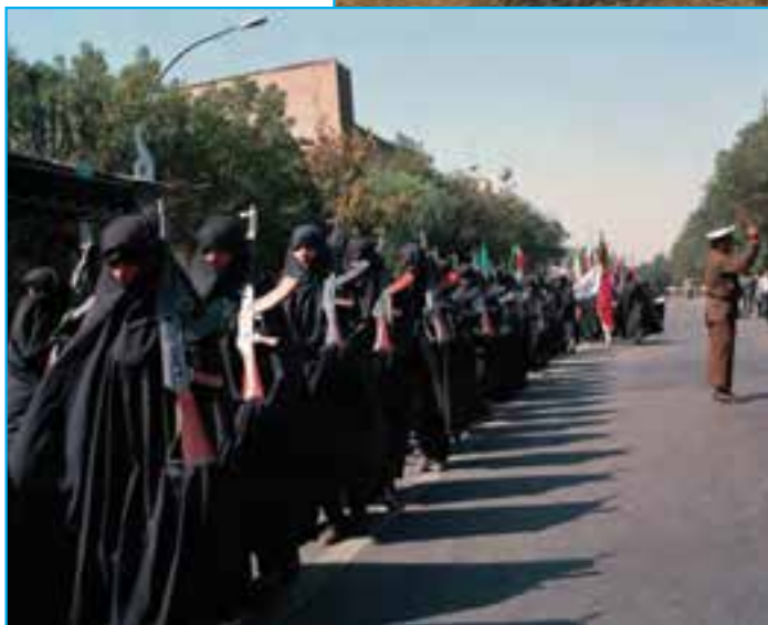
شکل ۳۱-۴- بسیج خواهران در استان