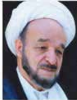
علامه محمدتقی جعفری