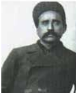
ستارخان سردار ملی