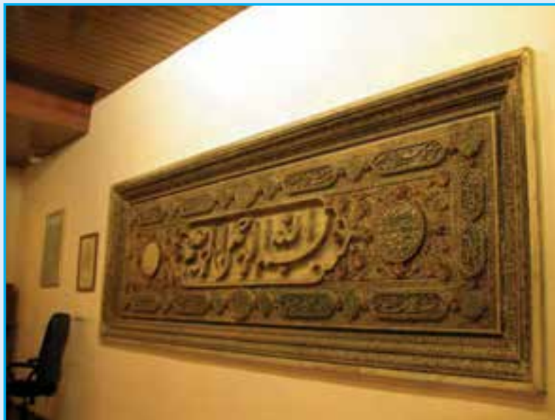
شکل ۱۸-۴ سنگ «بسم الله» - قرن دهم هجری

۶- دوره قاجاریه : در زمان سلطنت فتحعلی شاه قاجار، آذربایجان به دلیل همسایگی با دو کشور بزرگ روسیه و عثمانی، از اهمیت فراوانی برخوردار بود. به همین جهت شهر تبریز ولیعهد نشین شد. این سنت تا انقراض