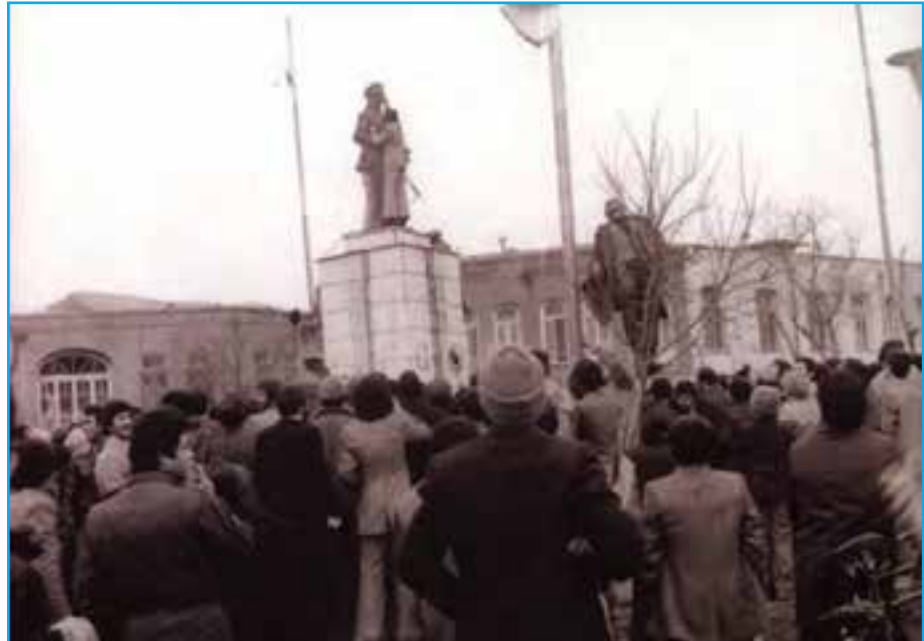
شکل ۲۴-۴ — تخریب مجسمه شاه توسط مردم غیور تبریز در ۲۶ دی ماه ۱۳۵۷ — روز فرار شاه (میدان ساعت تبریز)

تلاش انقلابی مردم آذربایجان بعد از پیروزی انقلاب اسلامی تا به امروز گواه روشن، بر حمایت بی دریغ مردم آذربایجان از آرمان‌های مقدس انقلاب اسلامی ایران به رهبری حضرت امام (ره) و آیت‌الله خامنه‌ای است. در جریان هشت سال دفاع مقدس، جوانان غیور و باایمان آذری حمایت بی چون و چرای خود را از اسلام و انقلاب به نمایش گذاشتند. اقدامات ایثارگرانه مردم آذربایجان