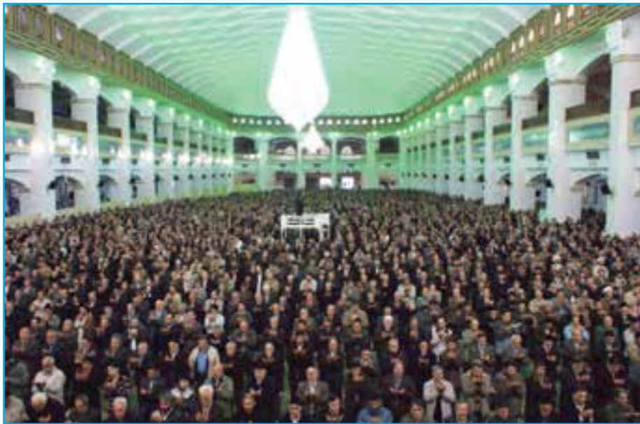
شکل ۲۵-۴ — برگزاری پرشکوه نماز جمعه در مصلائی امام خمینی (ره) — تبریز

تلاش انقلابی مردم آذربایجان بعد از پیروزی انقلاب اسلامی تا به امروز گواه روشن، بر حمایت بی دریغ مردم آذربایجان از آرمان‌های مقدس انقلاب اسلامی ایران به رهبری حضرت امام (ره) و آیت‌الله خامنه‌ای است. در جریان هشت سال دفاع مقدس، جوانان غیور و باایمان آذری حمایت بی چون و چرای خود را از اسلام و انقلاب به نمایش گذاشتند. اقدامات ایثارگرانه مردم آذربایجان