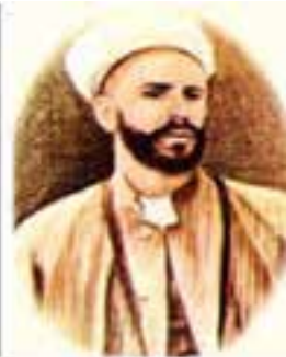
شیخ محمد خیابانی