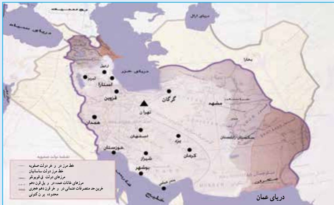
شکل ۲۰-۱ نقشه ایران در دوره صفویه که در آن تبریز به عنوان اولین پایتخت جهان تثبیت محسوب می‌شود.

قاجاریه در سال ۱۳۰۴ هـ.ش ادامه داشت. در جنگ‌های ایران و روسیه، (۱۲۱۸-۱۲۴۳ هـ.ق) آذربایجان اهمیت سیاسی و نظامی فراوانی داشت. مردم آذربایجان با دادن کشته‌های زیاد از این آب و خاک دفاع کردند و در جریان جنگ‌های دوره اول و دوم ایران و روسیه علاوه بر شهرت‌نشینان و روستاییان، عشایر آذربایجان نیز نقش عمده‌ای داشتند. این ایالت بعد از شکست قشون ایران، از قوای روسیه در سال ۱۲۴۳ هـ.ق به وسیله نیروهای روسی اشغال شد و بعد از پذیرش عهدنامه ترکمن‌چای و از دست دادن مناطق شمالی رود ارس، از قوای بیگانه تخلیه گردید. در نهضت تنباکو اعتراض از آذربایجان و شهر تبریز آغاز شد و در جریان انقلاب مشروطه در سال ۱۳۲۴ هـ.ق آذربایجان از ایالات پرچمدار آزادی بود و تبریز از شهرهای پیشگام در انقلاب و مرکز فعالیت آزادی‌خواهان مشروطه طلب محسوب می‌شد. پس از مرگ مظفرالدین شاه و اعلان سلطنت محمد علی‌شاه، تبریزی‌ها، با توجه به شناختی که در دوران ولیعهدی از او داشتند، به سلطنت وی روی خوش نشان ندادند. لذا پس از به توپ بستن مجلس اول در سال ۱۳۲۶ هـ.ق به وسیله محمد علی‌شاه و آغاز دوره استبداد صغیر، تبریز مرکز مقاومت ملی علیه شاه مستبد شد. ستارخان و باقرخان دو تن از سرداران غیور آذربایجان، با کمک مردم و علمای آزادی‌خواه آذربایجان مدت ۱۱ ماه در مقابل نیروهای دولتی مقاومت کردند و با برکناری پادشاه مستبد از سلطنت در سال ۱۳۲۷ هـ.ق دوباره نظام مشروطه را برقرار نمودند.