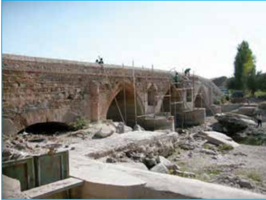
شکل ۱۱-۶- پل دختر - ملکان - دوره صفوی ۹۵۱ هـ.ق