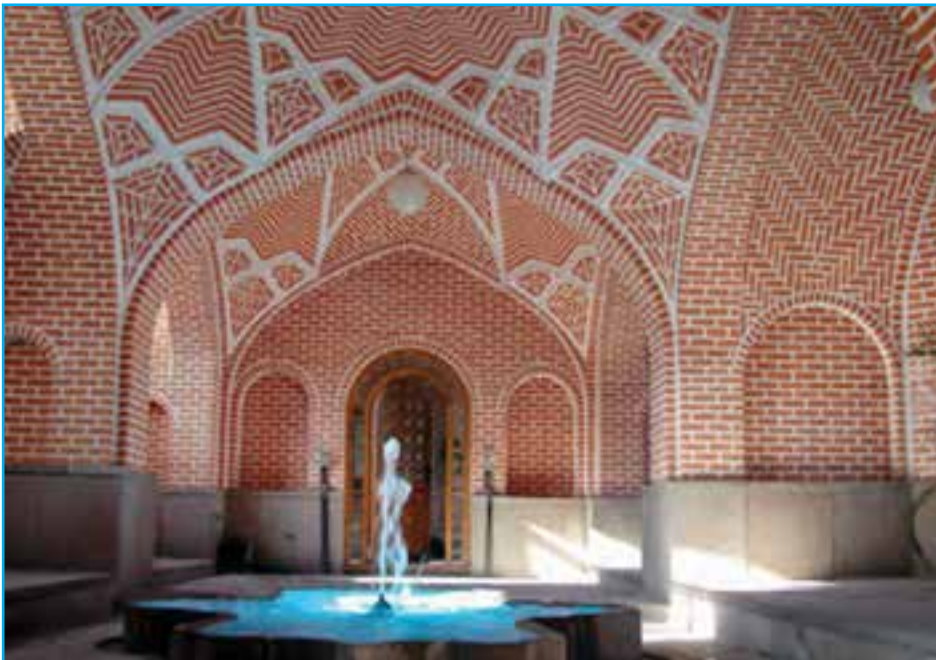
شکل ۱۰۲- خانه بهنام (دانشکده معماری) - دوره قاجار