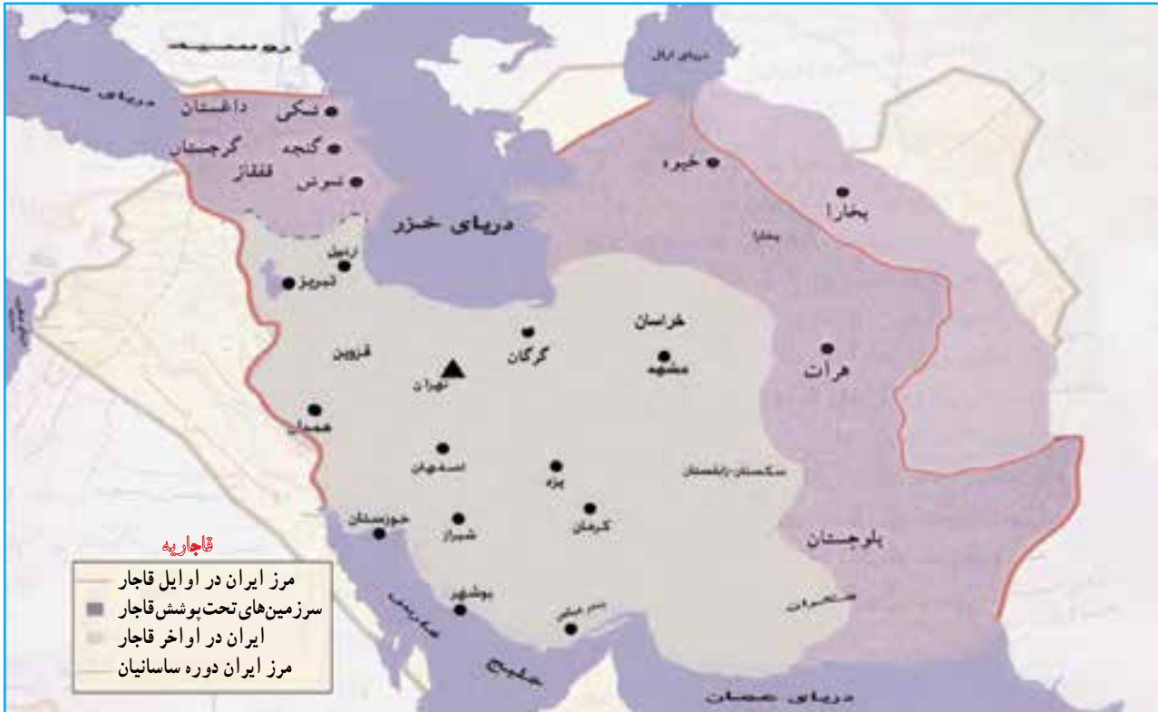
شکل ۲۱-۴ نقشه ایران در اوایل قاجاریه که در آن آذربایجان مرکز فرماندهی جنگ‌های ایران و روس بود