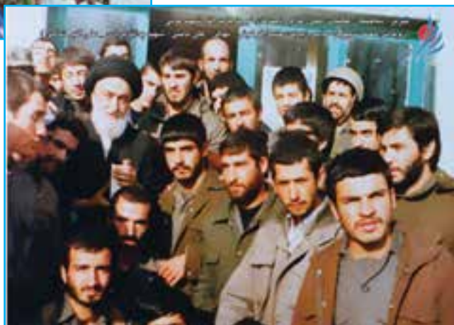
شکل ۲۶-۴- صحنه‌هایی از اعزام رزمندگان آذربایجان شرقی به جبهه‌ها در دوران دفاع مقدس