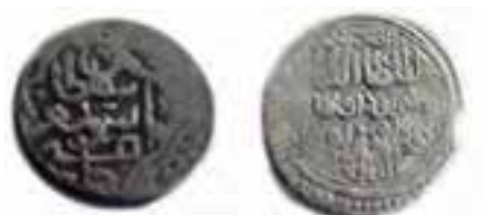
شکل ۱۶-۲- سکه‌های متعلق به دوران آق قویونلوها

اوزون حسن بنیان گذار دولت آق قویونلوها بود. او تبریز را پایتخت خود قرار داد و قلمرو خود را تا بغداد و هرات توسعه داد. بعد از مرگ او فرزندش سلطان یعقوب به سلطنت رسید اما او در جوانی از دنیا رفت و با مرگ یعقوب دولت آق قویونلوها در آذربایجان فروپاشید. مدرسه دینی «نصریه» و مسجد «حسن پادشاه» واقع در خیابان دارایی جدید تبریز از آثار آنها است.