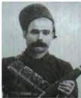
باقرخان سالار ملی