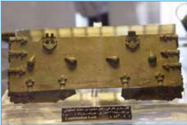
شکل ۴-۱-۲ قفل رمزخوان اثری متعلق به قرن هشتم ه.ق - عجیب‌شهر

شده بودند. بعد از اتحاد با دولت «مانتا» دولت آشور را شکست دادند و نخستین دولت آریایی را به رهبری «دیا کو» (۷۰۱ یا ۷۰۸-۶۵۵) ایجاد کردند و به این خاطر آذربایجان را کشور «ماد» می‌گفتند.