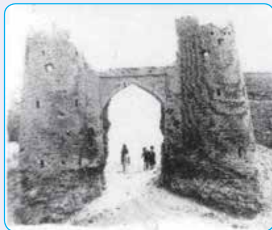
شکل ۱۴-۴- نمایی از ربع رشیدی اولین دانشگاه ایران در دوره مغول