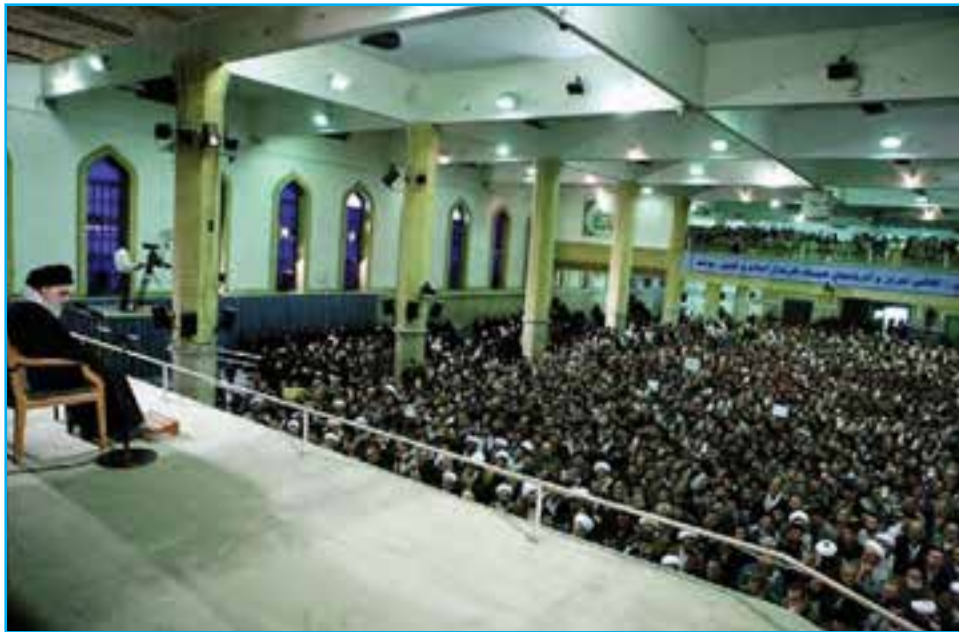
شکل ۲۳-۴- دیدار جمعی از مردم استان با رهبر معظم انقلاب اسلامی در سالروز ۲۹ بهمن، قیام مردم تبریز

مردم آذربایجان شرقی، بارها مخالفت خود را با برنامه‌های ضداسلامی دولت پهلوی‌ها چه در موضوع تغییر لباس و کشف حجاب و چه در اجرای برنامه «اصلاحات ارضی» ابراز نمودند و از حریم اسلام و روحانیت دفاع کردند. اعتراض آنها در قیام پانزده خرداد ۱۳۴۲ ه.ش به رهبری امام خمینی (ره) بعد از انقلاب مشروطه و نهضت ملی شدن نفت، قدرت ایمان و عزم ملی مردم آذربایجان را به نمایش گذاشت. قیام توفنده مردم تبریز در ۲۹ بهمن سال ۱۳۵۶ ه.ش که به مناسبت گرامیداشت چهلمین روز شهادت شهدای ۱۹ دی ماه ۵۶ شهر قم اتفاق افتاد، لرزه بر بنیاد دولت پهلوی انداخت و این اعتراض بذر انقلاب را در سراسر کشور پاشید.