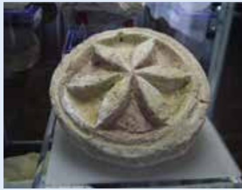
شکل ۶-۴- گنج‌پری‌های نقش خورشید و شیر آذری متعلق به دوره اشکانی (قلعه شجاع - اشکانی - هشترود)