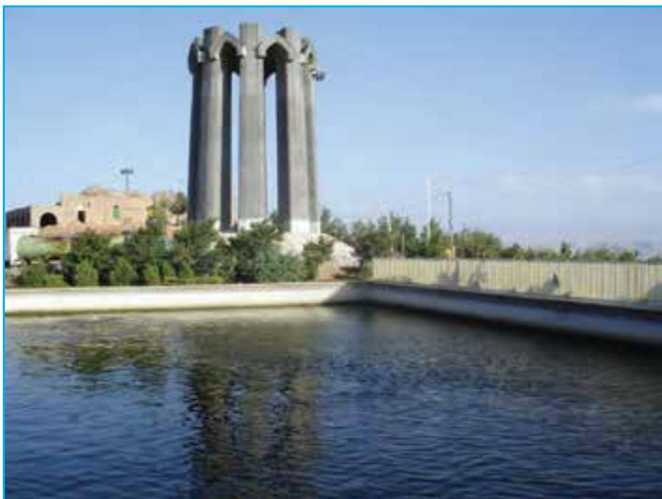
شکل ۲۷-۴. یادبود شهدای گمنام واقع در کنار امام‌زاده عون‌بن علی تبریز

ملت آذربایجان همواره در طول تاریخ با فداکاری‌ها و نثار خون خویش مدافع ایران و اسلام بوده‌اند و در جنگ تحمیلی در هشت سال دفاع مقدس نقش مهمی را ایفا نمودند. لشکر سرفراز ۳۱ عاشورا از رزمندگان دلاور و سرداران رشید آذربایجان تشکیل شده بود که در طول جنگ تحمیلی لرزه بر اندام دشمن بعثی و پشتیبانان جهان‌خوار آنها می‌انداختند. حماسه آفرینی‌های رزمندگان و سرداران لشکر ۳۱ عاشورا در جنگ تحمیلی «تیر» اول روزنامه‌ها و سرفصل اخبار رادیوهای بیگانه بود. حملات اعجاب‌انگیز و خط‌شکنی‌های متهورانه رزمندگان آن لشکر سرفراز، موجب تعجب ناظران سیاسی و مفسران نظامی اروپا و آمریکا می‌شد. سرداران بزرگی چون شهید مهندس مهدی باکری و برادرش شهید مهندس حمید باکری، شهید علی تجلایی، شهید مرتضی باغچیان و شهید حسن شفیع زاده از نامی‌ترین و پرافتخارترین سرداران این استان بودند که حیات پراچ خود را عاشقانه در طبق اخلاص نهاده و تقدیم انقلاب و اسلام و ایران نمودند و اوراق زرین دیگری بر کتاب افتخارات ملت آذربایجان، افزودند. روانشان شاد و یادشان جاودانه باد.