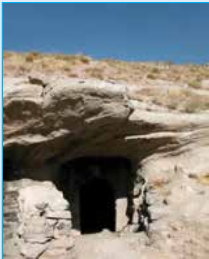
شکل ۵-۲- اثری متعلق به دوره اشکانی (غار قدمگاه - اشکانی - آذرشهر)

ق.م به دست اسکندر مقدونی، خستریوان والی ماد، آترویات (آذربید) فرمانده طلایه قشون داریوش سوم در جنگ گوگمل بود. بعضی‌ها او را مرد روحانی می‌دانند، او و بازماندگانش با تدبیر توانستند استقلال ماد و حاکمیت خاندان خود را تا سال ۲ ق.م حفظ کنند، در طول دوره‌ای نزدیک به هفت قرن فرمانروایی اشکانیان و ساسانیان، آذربایجان جزء جدایی ناپذیر ایران و از ایالات بسیار مهم این دو دولت محسوب می‌شده است. آذربایجان در عهد ساسانیان به دلیل استقرار پایتخت تابستانی آنها در شهر «شیز» ۱ یا «گنزک» ۲ و وجود آتشکده مقدس «آزرگشنسب» ۳ در این محل از تقدس خاص و اهمیت فوق‌العاده‌ای برخوردار بوده است.