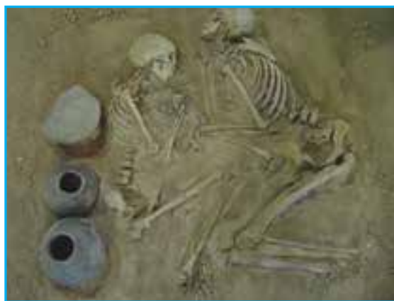
شکل ۲-۲- آثار مکشوفهٔ هزارهٔ اول ق.م در محل محوطه مسجد کبود

در جواب این سؤال که آذربایجان کی و چگونه محل سکونت شد و ساکنان اولیهٔ آن از کدام اقوام بوده‌اند، اطلاع دقیقی در دست نیست. برخی از دانشمندان، با توجه به اشکال سفالینه‌های به دست آمده، در کاوش‌های باستان‌شناسی ساکنان اولیه آذربایجان را مردمی دامدار و از نژاد مدیترانه‌ای می‌دانند. در آغاز هزارهٔ اول ق.م. درهٔ آجی‌چای و ناحیهٔ کنونی تبریز متعلق به قوم متمدن دالیان بوده است. کاوش‌های باستان‌شناسی در این منطقه کم‌انجام گرفته و مدارک قابل استناد در این زمینه بسیار ناچیز است. تپه‌های فراوان مکشوفه و غیرمکشوفهٔ باستانی، سنگ‌نگاره‌های متعلق به پادشاهان اورارتی و وجود قبرستان‌های کلان‌سنگی در نقاط مختلف استان که به قبرهای «گور» معروف‌اند، بیانگر سکونت طولانی انسان در این استان است. از سویی آذربایجان در طول تاریخ، دالان جابه‌جایی اقوام از شرق به غرب و بالعکس بوده و نقش عمده‌ای در تبادلات فرهنگی اقوام گوناگون داشته است. در نتیجهٔ کاوش‌های باستان‌شناسی سال‌های اخیر آثار فراوانی در جنوب شرقی استان به دست آمده که متعلق به عهد حجر قدیم است و قدمت تمدن آذربایجان را به هزارهٔ چهارم ق.م می‌رساند.