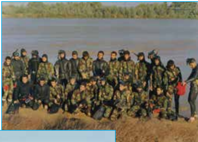
شکل ۳۰-۴- رزمندگان استان در ساحل اروندرود