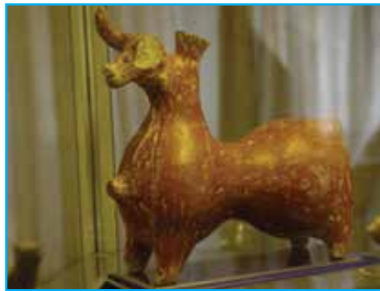
شکل ۱-۴- ریختون سفالی هزارهٔ اول ق.م. میانه