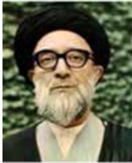
شهید قاضی طباطبایی