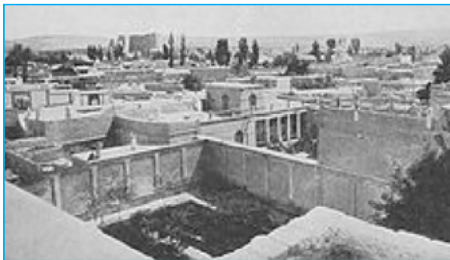
شکل ۲۲-۴- تبریز قدیم مربوط به اوایل عهد قاجار

با دشمن تا آخرین نفس تأکید می‌کردند و عباس میرزا را به ادامه آن و عدم قبول شرایط روس‌ها تشویق می‌کردند. در این میان رفتار پیرزنی از زنان آذربایجانی از همه افتخارآمیزتر بود. این زن سالخورده با شنیدن خبر متارکه جنگ، از قیمت ریسمان دست تاب، مقداری لوازم جنگ و خواروبار برای سربازان تهیه کرده و به مقر فرماندهی عباس میرزا آورده بود تا در تجهیز سربازان وطن در مقابل دشمن سهمی داشته باشد.