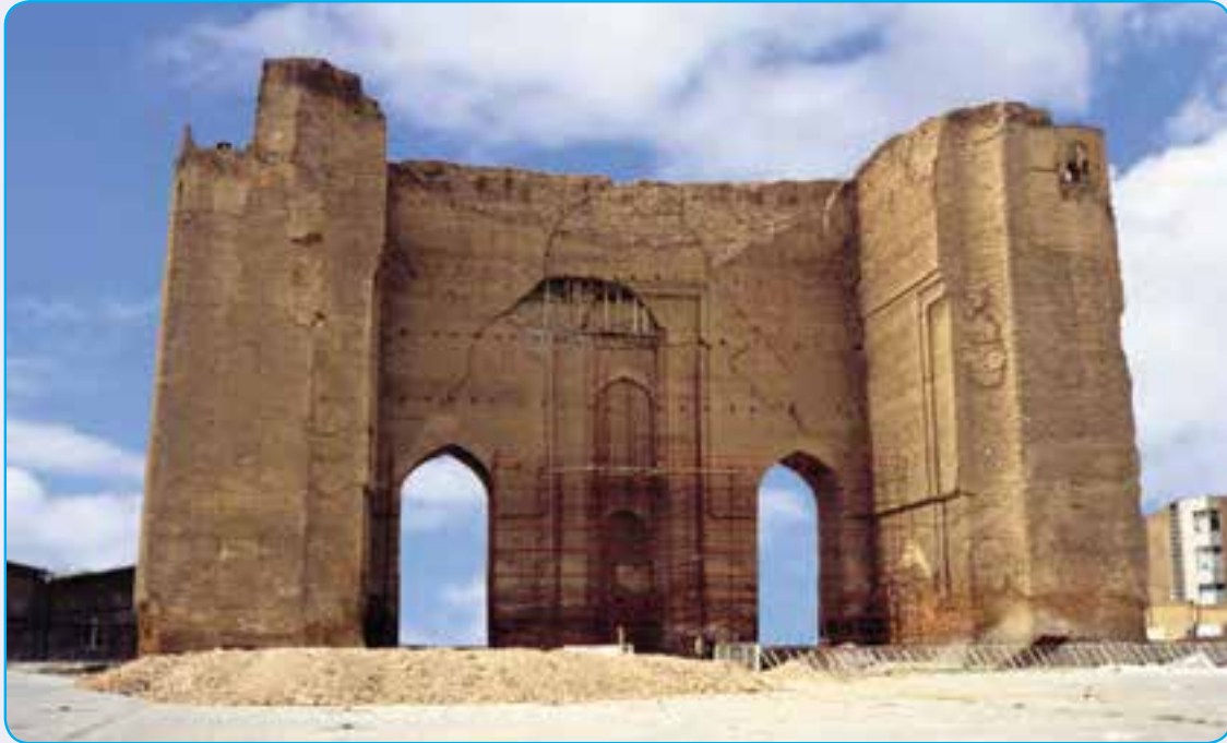
شکل ۱۳-۴- ارگ علیشاه از آثار دوره مغول

ربع رشیدی به عنوان بزرگ‌ترین دانشگاه جهان اسلام در قرون ۷-۸ هـ. ق شناخته می‌شد.