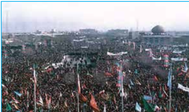
شکل ۲۸-۴- صحنه‌ای از اعزام رزمندگان به جبهه‌ها در دوران دفاع مقدس

اگر حمزه سیدالشهداء در جنگ‌های صدر اسلام، مدافع اسلام و آرمان‌های رسول خدا بود، تا پای جان از اسلام دفاع نمود و در جنگ احد عاشقانه به شهادت رسید، لشکر ۲۱ حمزه آذربایجان نیز همراه با افراد غیور و شجاع و خلبانان تیزپرواز پایگاه دوم شکاری تبریز، از آغاز جنگ تحمیلی و دفاع مقدس، در جبهه‌های حق علیه باطل با دشمن یعنی نبرد کردند. امیران و فرماندهان رشید و از جان گذشته و غیور مردان این لشکر سرافراز آذربایجان با جان فشانی‌ها و حماسه‌سازی‌های خود چهره ایران و ایرانی را در پیشگاه تاریخ و اجداد سلحشور خود سفید کردند. حملات خلبانان متهور پایگاه دوم شکاری آذربایجان به عمق خاک و استحکامات دشمن و بمباران مراکز حیاتی، نظامی و صنعتی عراق، فرماندهان آن کشور که خواب تصرف تهران را دیده بودند به زانو درآوردند. لشکر سرافراز ۲۱ حمزه و پایگاه دوم شکاری تبریز با پایداری خود در مقابل دشمن خسارات و تلفات سنگینی بر آنها وارد کردند. این پایگاه افسران و سربازان و امرای شهیدی چون سرلشکر شهید فکوری را تقدیم اسلام و ایران نمودند. نامشان جاودانه تاریخ پرافتخار گلگون کفنان ارتش ایران اسلامی باد.