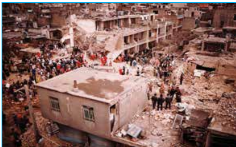
شکل ۲۹-۴- بمباران دبیرستان دخترانه زینبیه شهر میانه در جنگ تحمیلی عراق علیه ایران