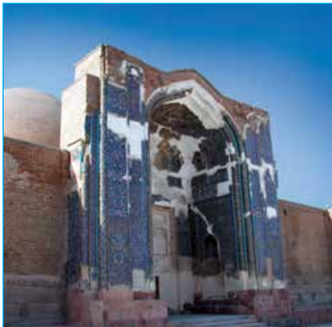
شکل ۱۵-۲- نمایی از مسجد کبود معروف به فیروزه اسلام متعلق به معماری قرن نهم هجری قمری

۴- عصر ترکمنان : با فروپاشی دولت تیموریان در آغاز قرن نهم اقوام ترکمن (آق. قویونلوها و قرا قویونلوها) در آذربایجان نیرومند شدند. در نتیجه مؤسس دودمان قرا قویونلوها قرایوسف در سال ۸۲۳ ه.ق در آذربایجان به قدرت رسید. وی تبریز را پایتخت خود قرار داد. پس از وفات او، فرزندش جهانشاه که مشهورترین پادشاه این دودمان است به سلطنت رسید. وی عاقبت در جنگ با اوزون حسن «آق قویونلو» در سال ۸۷۲ ه.ق به قتل رسید. پس از مرگ جهانشاه، دولت قرا قویونلوها در آذربایجان برچیده شد؛ مسجد کبود از آثار او است.