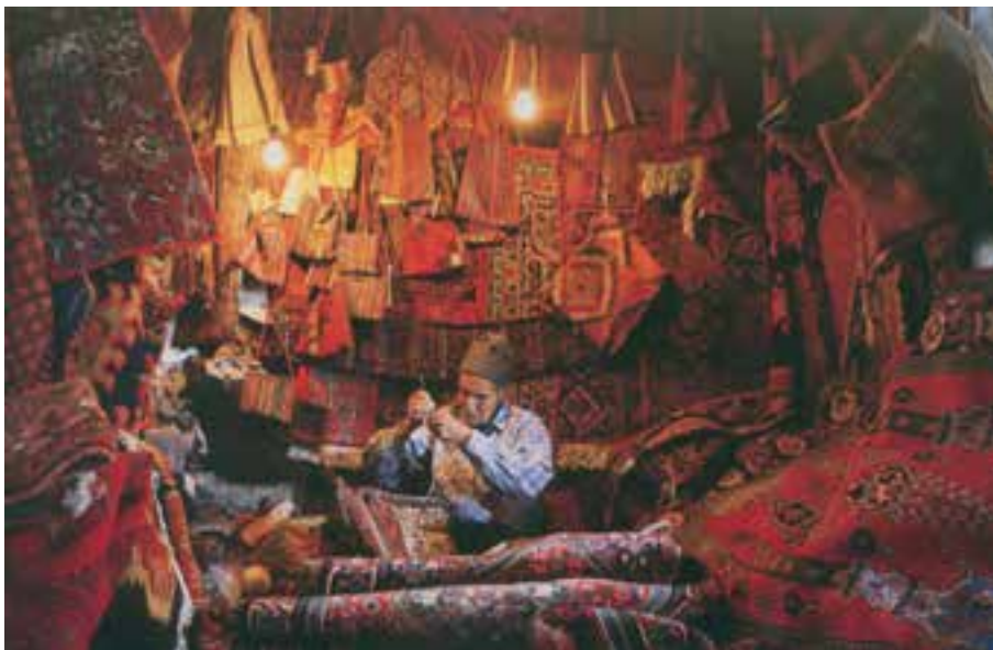
شکل ۲۷-۵- نمونه‌ای از بازار صنایع دستی تهران

۳- صنایع دستی عشایری: قدیمی‌ترین نوع صنایع دستی استان است که تولید آن عموماً به‌طور خانگی و فصلی انجام می‌پذیرد. این نوع از صنایع دستی، با توجه به ترکیب قومی منطقه، در میان صنایع دستی استان جایگاهی ویژه دارد و هم‌اکنون یکی از نقاط برجسته و مثبت صنایع دستی استان محسوب می‌شود. دست‌اندرکاران این بخش از دست‌ساخته‌های ایرانی که بافت انواع قالی و قالیچه، جاجیم و گلیم، چننه ۱ ، رویه پستی، جوال ۲ ، خورجین ۳ و نیز رنگرزی و ریسندگی پشم را در انحصار خود دارند، گروهی از عشایر لر، قشقایی، شاهسون و... هستند که در دهه‌های اخیر از زادگاه خود به تهران، ری، ورامین و کرج مهاجرت کرده‌اند.