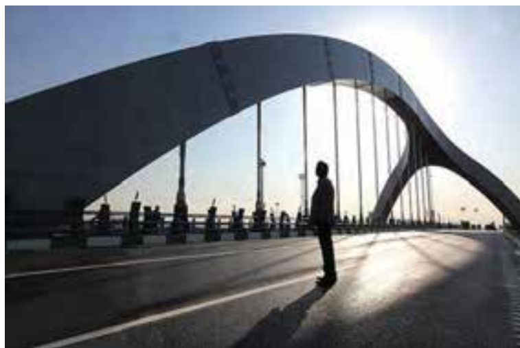
شکل ۳-۶- پل جوادیه

آغاز به کار متروی تهران در سال ۱۳۷۸ نقطه عطفی در توسعه شبکه ریلی استان محسوب می شود که روزانه هزاران مسافر را جابه جا می کند.