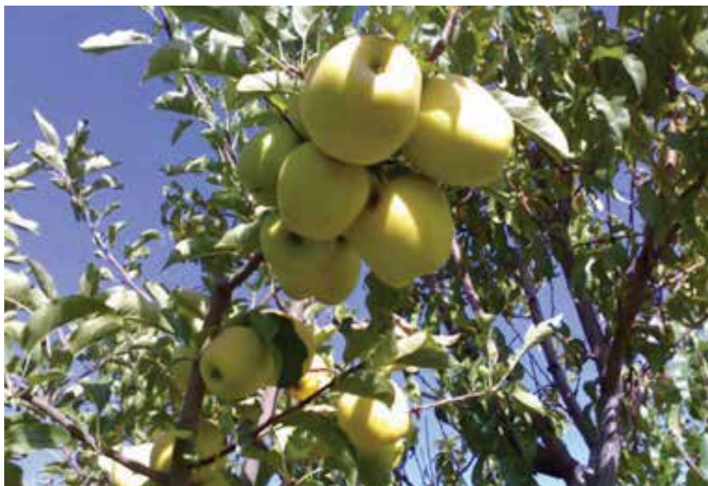
شکل ۲۱-۵- باغ سیب در شهرستان دماوند

۲- دشت‌ها و کوهپایه‌های جنوبی البرز؛ شامل ورامین، ری، شهریار و رباط کریم است. این بخش برای کشاورزی مساعد است؛ زیرا از منابع آب‌های سطحی و زیرزمینی برخوردار است اما زمین‌هایی که در نزدیکی شوره‌زارها واقع شده‌اند، برای کار کشاورزی مناسب نیستند.