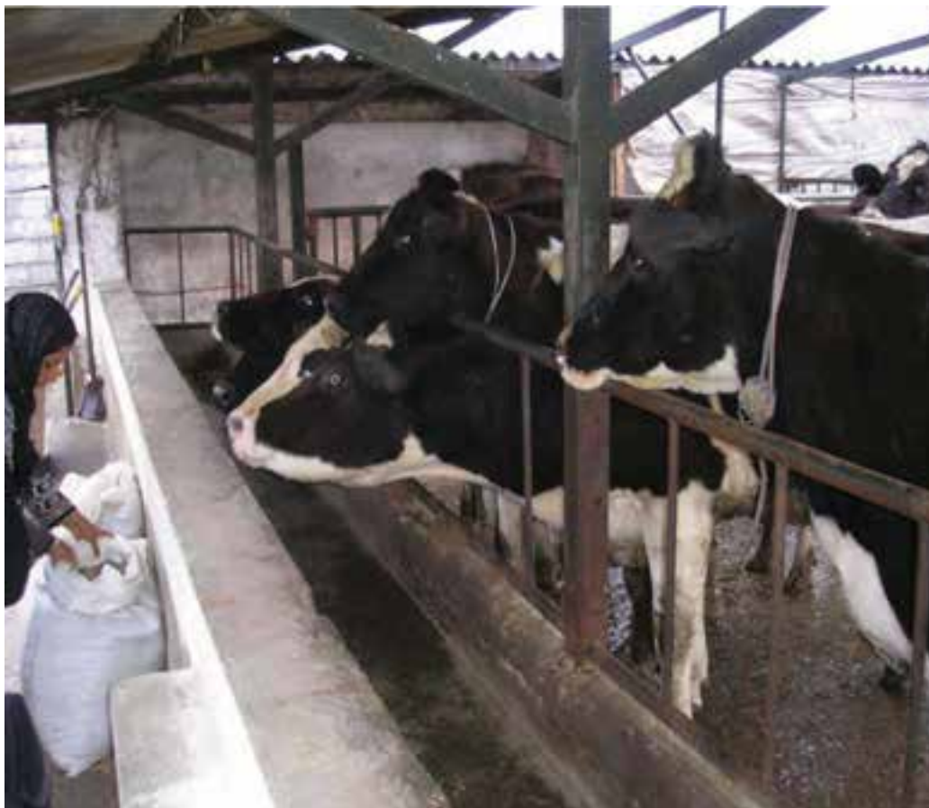
شکل ۲۴-۵- مرکز دامداری صنعتی

اشکال عمده دامداری در این استان شامل گاوداری‌های صنعتی بزرگ، پرورش طیور، مرغ داری‌ها، پرورش زنبورعسل و پرورش ماهی است.