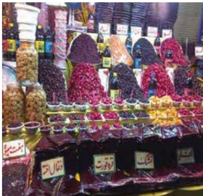
شکل ۲۸-۵- فروشگاه‌های در منطقه دربند