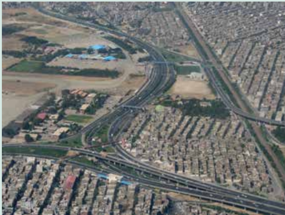
شکل ۱-۶- راه‌های ارتباطی شهر تهران

راه‌های ارتباطی یکی از عوامل توسعه صنعتی در استان تهران محسوب می‌شود. بعد از انقلاب اسلامی، توجه زیادی به احداث راه‌های استان صورت گرفته است؛ به طوری که در سال ۱۳۶۰ طول شبکه راه‌های استان (آزادراه، بزرگراه، راه‌های اصلی و فرعی و راه‌های روستایی) معادل ۲۴۱۷ کیلومتر بوده در حالی که تا پایان سال ۱۳۸۷ به ۴۹۸۳ کیلومتر رسیده است که نشان دهنده رشد بسیار بالای آن است.