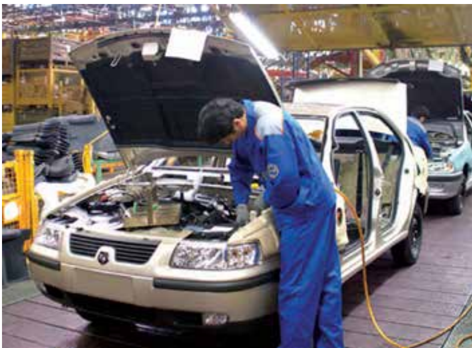
شکل ۲۶-۵- تولید اتومبیل در کارخانه ایران خودرو