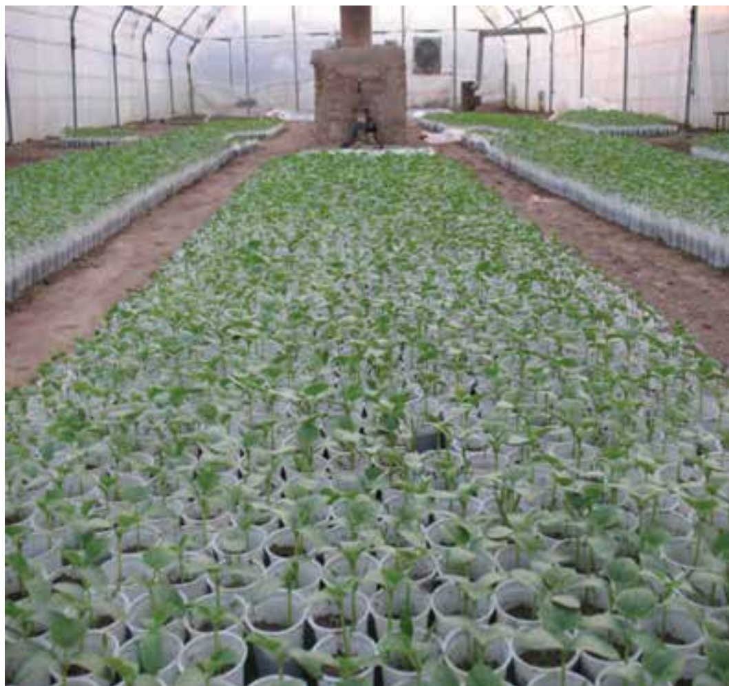
شکل ۲۳-۵- کشت گلخانه‌ای

محصولات عمده این بخش را گندم، جو، یونجه، ذرت علوفه‌ای، گوجه فرنگی، خیار، سبزی‌ها، سیب‌زمینی، نباتات علوفه‌ای، انگور، چغندر قند و پنبه تشکیل می‌دهد. از نواحی مهم آن می‌توان به دشت شهریار و ورامین اشاره کرد.