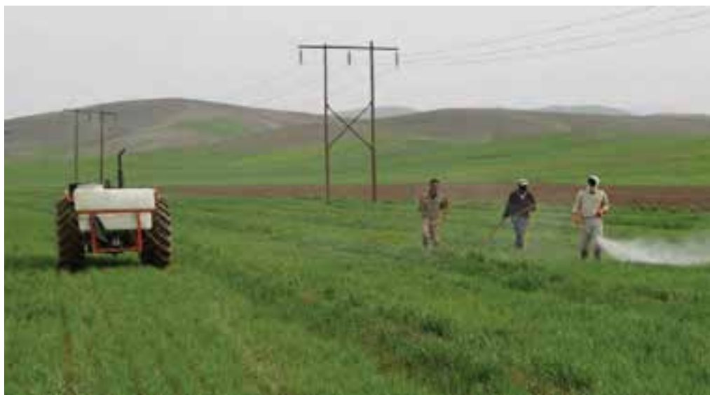
شکل ۲۲-۵- فعالیت‌های کشاورزی در اطراف شهر ری

۲- دشت‌ها و کوهپایه‌های جنوبی البرز؛ شامل ورامین، ری، شهریار و رباط کریم است. این بخش برای کشاورزی مساعد است؛ زیرا از منابع آب‌های سطحی و زیرزمینی برخوردار است اما زمین‌هایی که در نزدیکی شوره‌زارها واقع شده‌اند، برای کار کشاورزی مناسب نیستند.