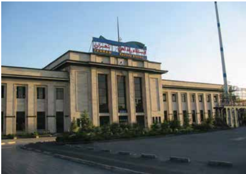
شکل ۲-۶- ایستگاه راه آهن تهران

آغاز به کار متروی تهران در سال ۱۳۷۸ نقطه عطفی در توسعه شبکه ریلی استان محسوب می شود که روزانه هزاران مسافر را جابه جا می کند.