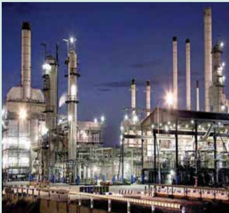
شکل ۵-۶- نیروگاه برق در تهران

صداوسیما: ارتباطات رسانه‌ای و وسایل ارتباط جمعی به‌عنوان یکی از ابزارهای نیرومند در جهت فرهنگ‌سازی، نقش مؤثری را در توسعه اجتماعی، اقتصادی و فرهنگی جامعه به‌عهده دارد. براساس آمار و اطلاعات موجود در طی سال‌های ۱۳۷۵ تا ۱۳۸۵، تعداد ایستگاه‌های رادیویی موج متوسط، تلویزیون و اف. ام از ۱۵۴ ایستگاه به ۳۵۵ ایستگاه (۲/۳ برابر) و هم‌چنین، تعداد مجموع فرستنده‌های اصلی از ۲۷۷ به ۱۰۱۵ فرستنده افزایش یافته است.