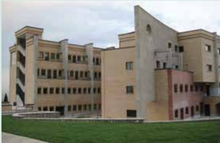
شکل ۶-۷- دانشگاه آزاد اسلامی واحد تهران

اماکن مذهبی در استان تهران براساس آمار سال ۱۳۸۶، به تعداد ۳۹۹ مکان متبرکه بوده است. در این استان، ۳۵۶۵ مسجد و ۶۰۱ حسینیه برای انجام فرایض دینی و مذهبی وجود دارد. همچنین، تعداد ۱۹ مکان مذهبی مربوط به اقلیت‌های مذهبی در شهر تهران وجود دارد.