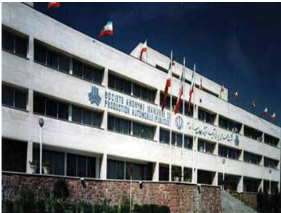
شکل ۲۵-۵- شرکت خودروسازی سایپا