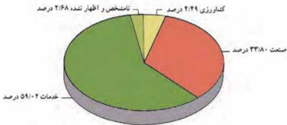
شکل ۲۰-۵. نمودار درصد شاغلان در بخش‌های مختلف اقتصادی استان

استان تهران یکی از قطب‌های اقتصادی کشور است. تجمع کانون‌های اقتصادی در این استان و موقعیت سیاسی و اداری و نیز مرکزیت آن باعث شده است که بخش عمده امکانات در محدوده آن متمرکز شود. نمودار زیر، شاغلان را در سه بخش کشاورزی، صنعت و خدمات در استان تهران نمایش می‌دهد.