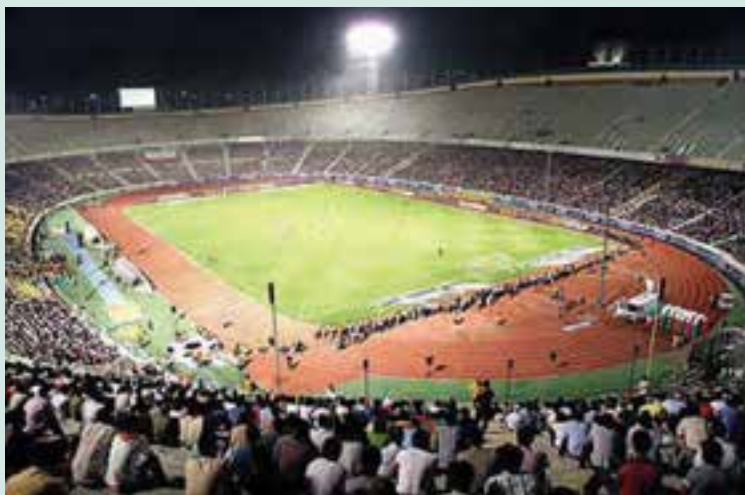
شکل ۶-۸- استادیوم آزادی تهران

استان تهران طی سی سال گذشته به خصوص از دهه ۱۳۷۰، شاهد رونق فعالیت‌های ورزشی بوده است. تعداد فضاهای ورزشی روباز و سرپوشیده استان از ۲۷۶ مورد در سال ۱۳۶۸ به ۲۷۶۸ مورد در سال ۱۳۸۷ رسیده است، اما به علت افزایش جمعیت، رشد سرانه فضای ورزشی برای هر نفر ۲۳٪ در سال ۱۳۸۷ بوده است.