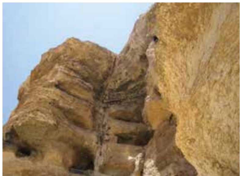
شکل ۴-۲- غار کرفتو از قدیمی‌ترین سکونتگاه‌های انسان