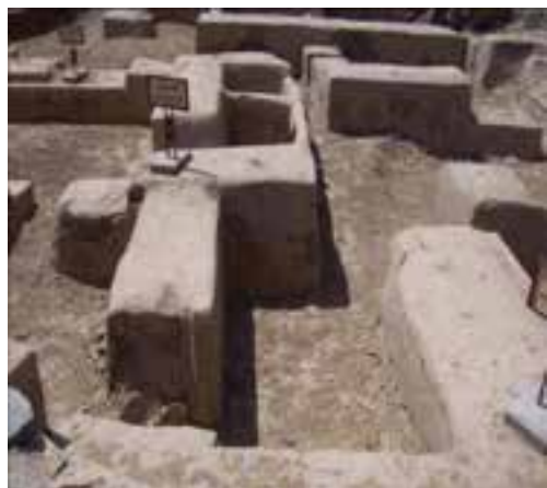
شکل ۷-۴. بخشی از هگمتانه (بایتخت ماد)

● کردستان قبل از اسلام: در دوران تاریخی یعنی از حدود ۳۰۰۰ سال قبل از میلاد مسیح (ع)، کردستان که در منطقه کوهستانی پهناور زاگرس واقع بوده، به دلیل تماسی که با ممالک متمدن عهد عتیق مانند عیلام (ایلام)، سومر، بابل و اکد داشته است، نام اقوام بسیاری از ساکنان این کوهستان مثل گوتی، لولوبی، کاسی، مانایی و غیره در الواح و کتیبه‌های بابلی، آشوری و عیلامی ذکر شده است. زمانی که آشوری‌ها دائماً به کوهستان زاگرس حمله می‌کردند، و بیشتر قصد تصرف سرزمین کردستان و الحاق ولایات و مناطق زاگرس به قلمرو خود را داشتند، برای رسیدن به مقصود خودشهرهایی مانند هارهار (در هورامان) را در این مسیر ساختند.