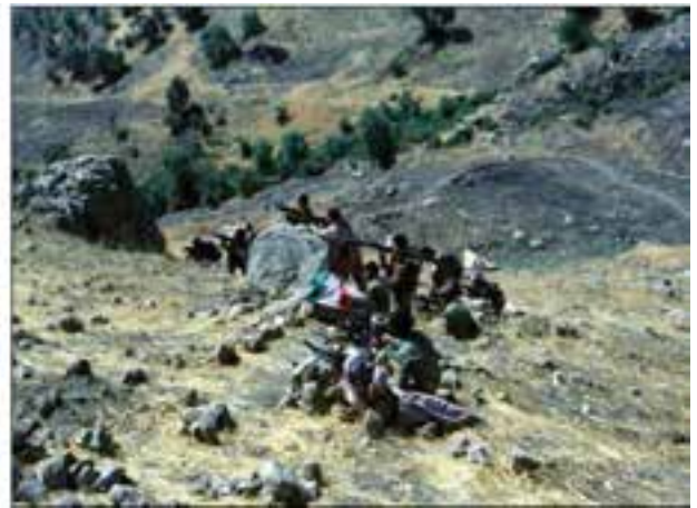
شکل ۱۶-۴- رزمندگان اسلام در حین عملیات علیه دشمن یعنی