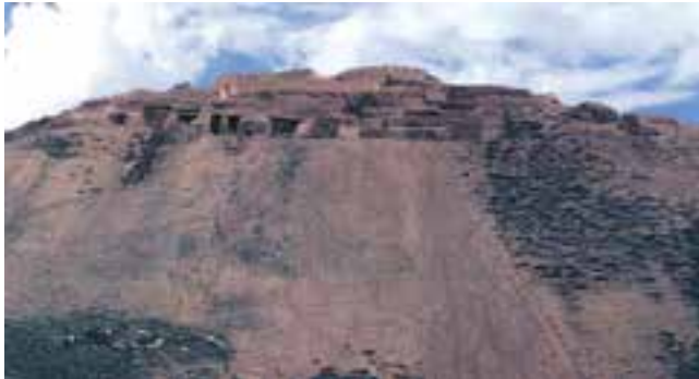
شکل ۴-۱- تپه باستانی زیویه

کردستان به دلیل برخورداری از موقعیت ممتاز جغرافیایی و ویژگی‌های طبیعی همواره یکی از کانون‌های فرهنگ و تاریخ و به طور کلی میراث‌دار تعداد زیادی از تمدن‌های کهن ایران زمین بوده است. شما در این درس با برخی از این تمدن‌ها و میراث فرهنگی و تاریخی استان محل زندگی خود آشنا می‌شوید.