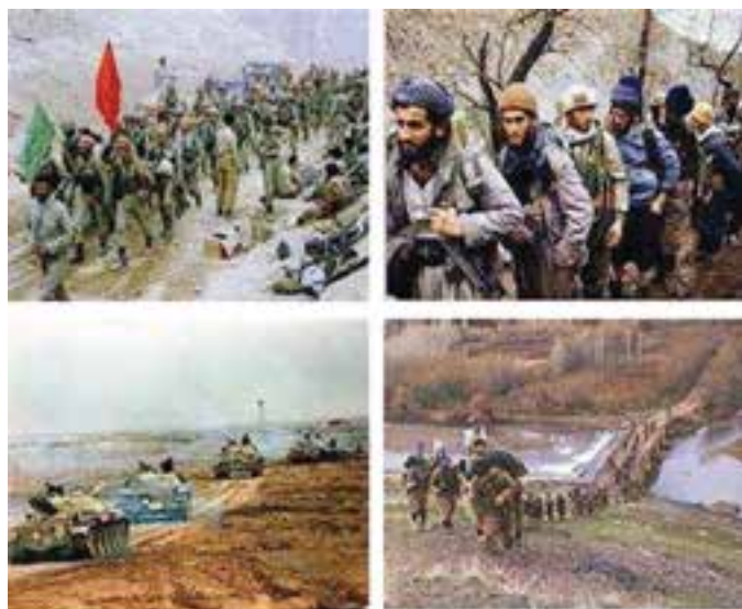
شکل ۱۳-۴- مشارکت گسترده رزمندگان کُرد در دفاع از سرزمین ایران اسلامی

دشمنان ایران اسلامی با سرکردگی استکبار جهانی و در رأس آن‌ها آمریکا به منظور سرکوب یا جلوگیری از صدور انقلاب اسلامی، هر روز در نقطه‌ای از سرزمین پهناور ایران اسلامی، غائله و آشوبی برپا می‌کردند که همواره ناکام می‌ماندند. * به نظر شما علل ناکامی دشمنان، در ضديت با انقلاب اسلامی چه بود؟