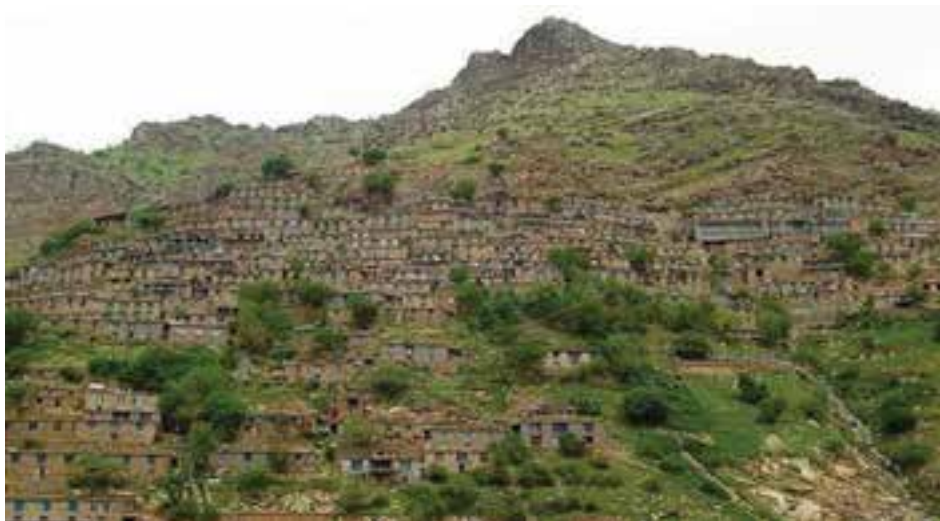
شکل ۸-۴. هورامان از سکونتگاه‌های قدیمی کردستان

در اواسط قرن ششم قبل از میلاد پس از سقوط امپراطوری ماد و به قدرت رسیدن هخامنشیان، کردستان که بخشی از سرزمین‌های تحت تسلط مادها بود، در اختیار هخامنشیان قرار گرفت.