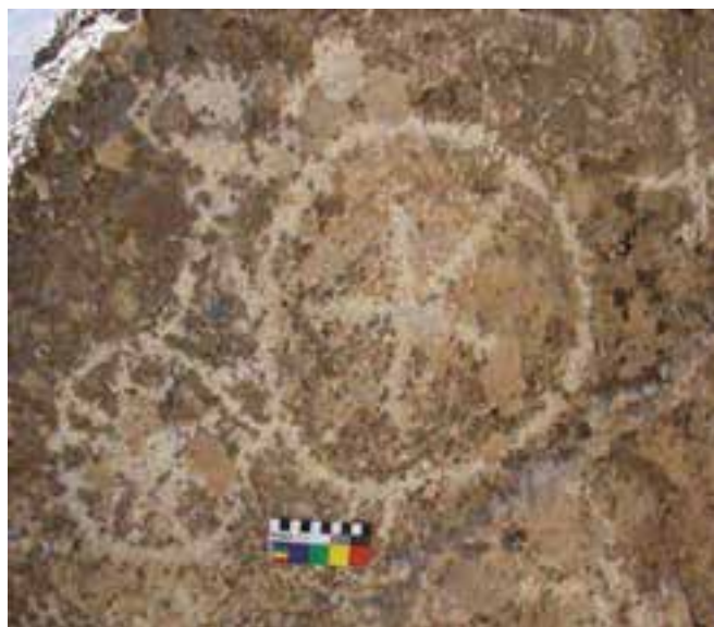
شکل ۴-۴ - سنگ نگاره‌های منطقه سارال