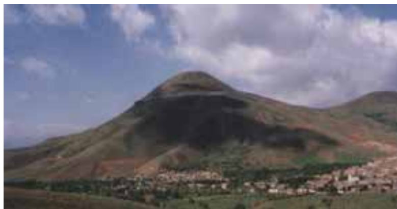
شکل ۹-۴- قلعه حسن آباد (قلعه حکومتی اردلان‌ها)

تاریخ کردستان از صفویه تا دوره پهلوی: در دوره صفویه شاه اسماعیل صفوی حاکمیت و اداره کردستان را به امرای قزلباش واگذار کرد. مدتی بعد با توجه به سیاست شاهان صفوی در محدود کردن قدرت قزلباش‌ها، تقسیم‌بندی جدیدی که حاکی از اطلاق نام ایالات و طوایف مسلط بر مناطق، سرزمین‌ها و قلمرو تحت تسلط آن‌ها بود، معمول و متداول شد. با توجه به این تقسیم‌بندی‌ها، کردستان به سه ولایت «اردلان با مرکزیت سنندج»، «مُکری با مرکزیت مهاباد» و «بابان با مرکزیت سلیمانیه» تقسیم شد. در این دوره، ابتدا خاندان اردلان به عنوان حاکمان محلی مستقل، کردستان را اداره می‌کردند اما در زمان شاه صفی، آن‌ها تحت نظر و وابسته به حکومت مرکزی در کردستان حکومت می‌کردند. این رویه در دوره‌های افشاریه و زندیه نیز ادامه داشت. در زمان قاجار با توجه به تقسیمات کشوری آن دوران، ایران به چهار ایالت و هشت ولایت تقسیم شد که بر اساس آن اداره قلمرو هر یک از ایالات و ولایات توسط نمایندگان حکومت مرکزی صورت می‌گرفت. در دوره پهلوی اول (سال ۱۳۱۶ ه. ش) تقسیم‌بندی‌های کشوری به صورت استان تغییر یافت و ایران به ۱۰ استان تقسیم شد که طبق آن کردستان، جزئی از استان پنجم ایران محسوب می‌شد و در سال ۱۳۳۷ این منطقه از استان پنجم مجزا و به استان کردستان تبدیل شد.