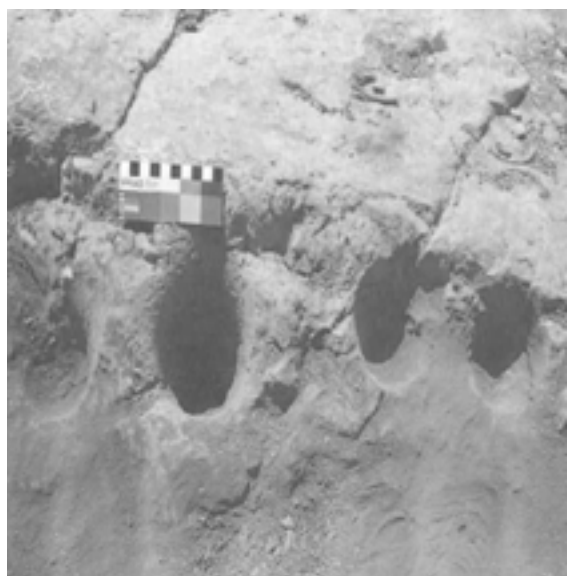
شکل ۵-۴ - فنجان نماهای کردستان