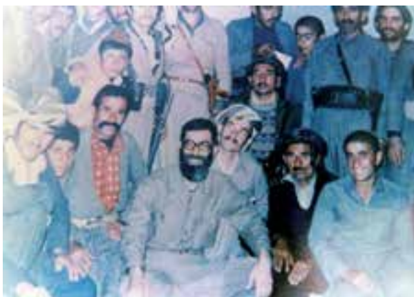
شکل ۱۵-۴- حضور مقام معظم رهبری در جمع پیش مرگان مسلمان گُرد

● عملیات‌های نظامی در مرزهای کردستان: در طول هشت سال دفاع مقدس در مرزهای استان کردستان ده‌ها عملیات پیروزمندانه با حمایت همه جانبه رزمندگان گُرد برای حفاظت از کیان و مرزهای ایران اسلامی صورت گرفته است که در جدول صفحه بعد به برخی از این عملیات‌ها اشاره می‌شود.