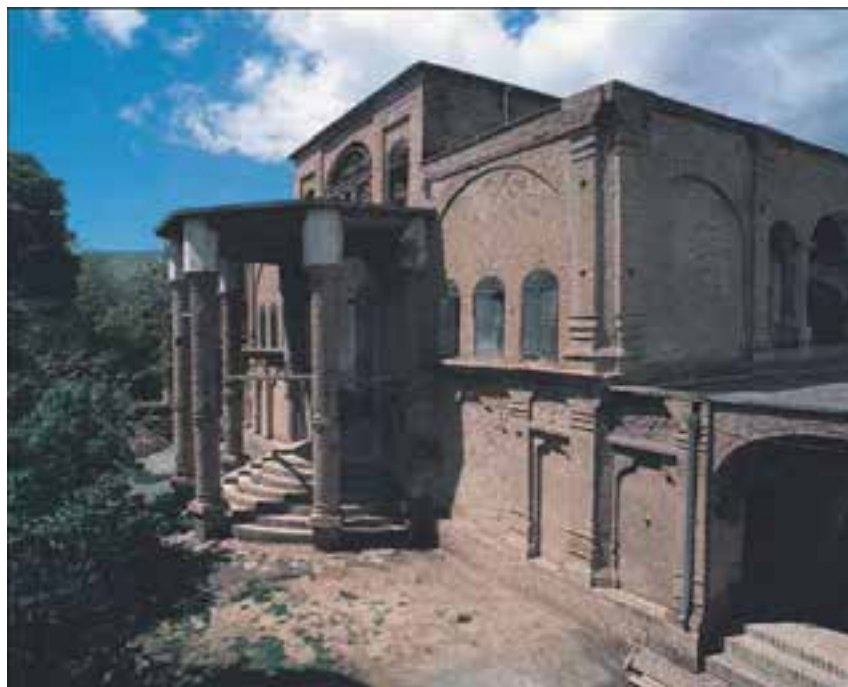
شکل ۱۰-۴. عمارت خسروآباد متعلق به دوره اردلان‌ها