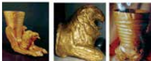
شکل ۴-۶- نمونه‌هایی از آثار به دست آمده از مناطق باستانی استان کردستان