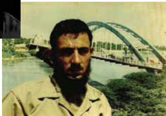
شکل ۱۷-۴- شهید ملا حیدر فهیم و شهید حاج هوشنگ ورمقانی

با توجه به این که کردستان دارای گذشته پر بار و پرافتخاری از جنبه‌های فرهنگی، علمی و دینی بوده و در این منطقه از سرزمین ایران، نام آوران و عالمان بسیاری پرورش یافته‌اند و در تمام عرصه‌ها صاحب نام بوده‌اند و نیز در فداکاری و ایثار و پاسداری از کیان سرزمین ایران نقشی قابل توجه و درخور تقدیر داشته‌اند، اکنون نیز این استان در تمام عرصه‌ها، نام آوران علمی، فرهنگی، مذهبی، انقلابی و سرداران دلیر و بنام را به خود دیده است. با توجه به فراوانی شخصیت‌ها و مفاخر کردستان، در این جا به ذکر اسامی برخی از نام آوران اشاره می‌شود و در هر بخش به معرفی و شرحی کوتاه از زندگی چند چهره برجسته بسنده می‌شود.