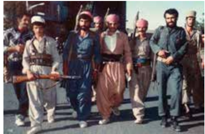
شکل ۱۴-۴- جمعی از پیش مرگان مسلمان گُرد