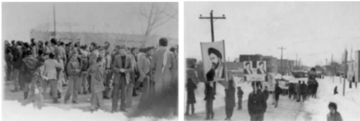
شکل ۱۲-۴- تظاهرات مردم کردستان علیه رژیم ستم‌شاهی - دوران انقلاب، سال ۱۳۵۷

پس از پیروزی انقلاب اسلامی، با توجه به این که کشورهای استعمارگر، نمی‌خواستند ایران مستقل و سربلند باشد، برای از بین بردن انقلاب اسلامی، دست به ترفند و حيله‌های بسیاری زدند که از جمله می‌توان به تحمیل هشت سال جنگ علیه ایران اسلامی، اشاره کرد. در این زمان مردم کردستان که همواره در طول تاریخ، خود را به عنوان مرزداران ایران زمین معرفی کرده‌اند، برای دفاع از انقلاب اسلامی با دشمن بعثی به مقابله برخاستند.