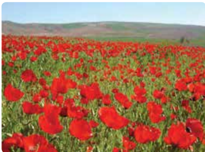
شکل ۱-۵ - دشت شقایق حسین آباد کالپوش در شهرستان میامی

۵- تعدد جاذبه‌های طبیعی، فرهنگی و اقتصادی - معیشتی.