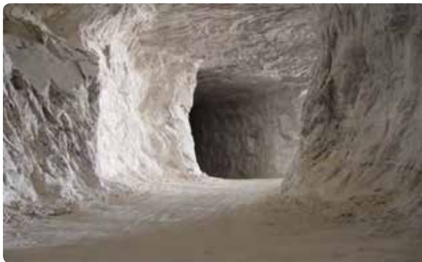
شکل ۲۷-۵- معدن نمک در شهرستان گرمسار

استان سمنان تأمین کنندهٔ ۵۰ درصد نمک، ۴۰ درصد گچ، ۸۵ درصد زئولیت، ۱۰۰ درصد سلسیتین، ۸ درصد سولفات سدیم و ۲۰ درصد کرومیت کشور است.