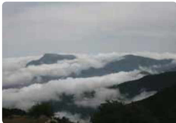
شکل ۱۰-۵- جنگل ابر در شهرستان شاهرود