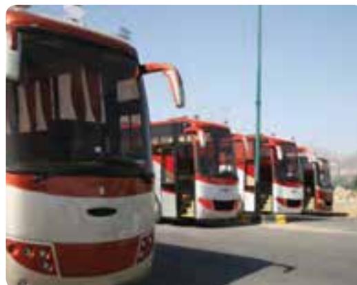
شکل ۲۵-۵- نمونه‌هایی از واحدهای تولیدی - صنعتی استان سمنان