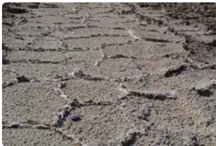
شکل ۷-۵ - کویر نمک

۸- دریاچه مسیله در جنوب غربی استان سمنان