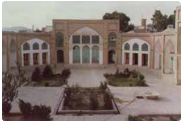
شکل ۱۷-۵- مدرسه موسیقی شهر دامغان