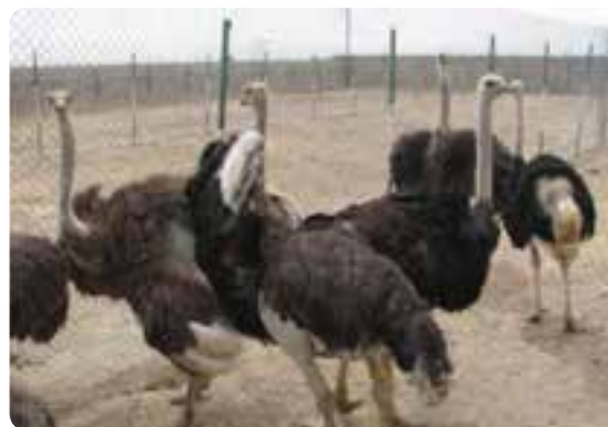
شکل ۲۴-۵- پرورش مرغ و شتر مرغ در استان

توانمندی‌های بخش صنعت و معدن استان: صنعت از بخش‌های عمده و حساس هر منطقه به‌شمار می‌رود که اهمیت این بخش ناشی از نقش بالا و روزافزون آن در جهت رفع نیاز جامعه به کالاهای ضروری صنعتی، کمک به رشد و توسعه سایر بخش‌های تولیدی و زیربنایی و در نهایت تحقق استقلال اقتصادی را به دنبال دارد.