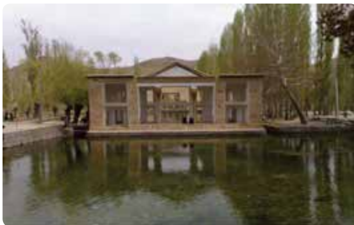
شکل ۶-۵ - چشمه علی در شهرستان دامغان

۵- چشمه‌های آب شیرین: نزدیک به ۳۵۰ چشمه در استان جریان دارد که مناظر بدیع و زیبایی را به وجود آورده‌اند؛ مانند چشمه علی دامغان