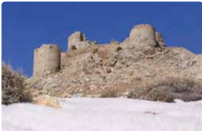
شکل ۱۸-۵- شیر قلعه شه میرزاد در شهرستان مهدی شهر