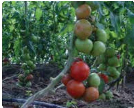
شکل ۲۰-۵- گوجه از محصولات گلخانه‌ای استان