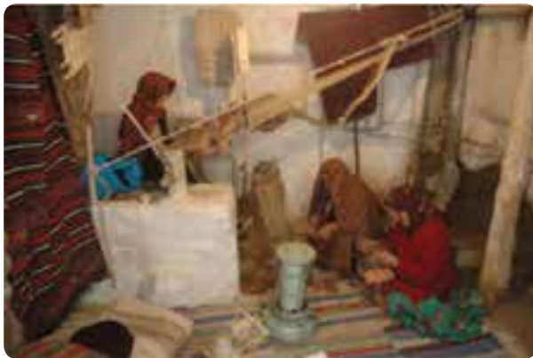
شکل ۱۶-۵- کارگاه تولیدی گلیم و جاجیم در استان