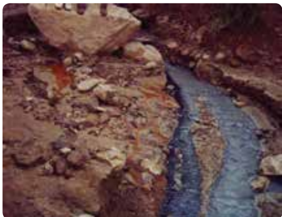
شکل ۴-۵ - چشمه هفت رنگ مجن در شهرستان شاهرود

۳- آب‌های معدنی و درمانی : چشمه شاه و عین‌الرشید در جنوب شهرستان گرمسار، تلخاب لاسجرد و آب گرم در شهرستان سمنان، آب معدنی دیباج در شهرستان دامغان و چشمه هفت‌رنگ مجن در شهرستان شاهرود.