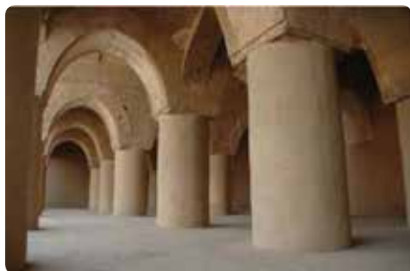
شکل ۱۴-۵- مسجد تاریخانه در شهر دامغان