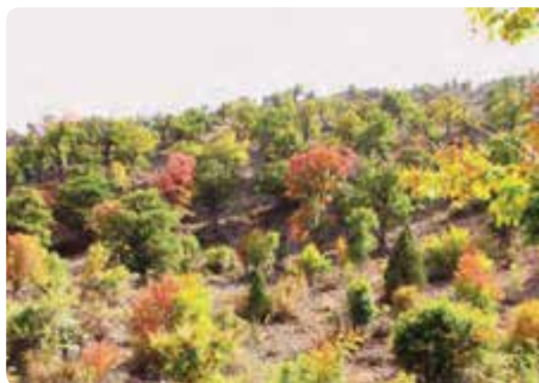
شکل ۹-۵- جنگل بادله کوه در شهرستان دامغان

۱۰- پوشش گیاهی و مرتعی مطلوب در برخی از مناطق شمالی استان مانند: جنگل فینسک و رودبارک در شهرستان مهدی شهر، جنگل سیاه خانی، بادله کوه و اسپيرو در شهرستان دامغان، جنگل کالپوش در شهرستان میامی، ابر و اولنگ در شهرستان شاهرود.