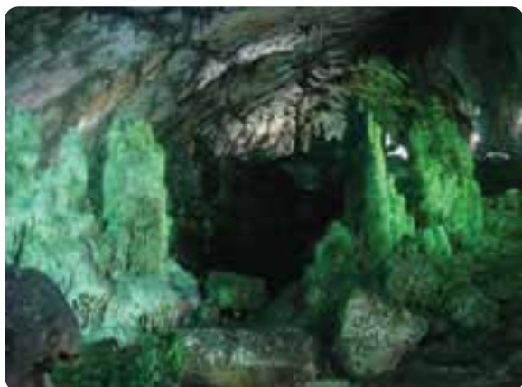
شکل ۳-۵ - تالار و ستون‌های سنگی زیبای غار دربند در شهرستان مهدی شهر

۲- غارها : غار دق کشکولی (زندان افغان) در شهرستان گرمسار، دربند در شهرستان مهدی شهر، شیربند در شهرستان دامغان، غارهای ناروان و یخان در شهرستان میامی، خواجه قنبر و ملحدو در شهرستان شاهرود.