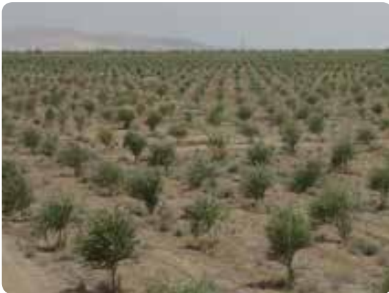
شکل ۲۱-۵- زیتون از محصولات باغی استان

۲) باغدار/ری: با توجه به تنوع شرایط آب و هوایی در استان سمنان محصولات باغی را می‌توان در دو گروه طبقه‌بندی کرد: * میوه‌های گرمسیری و نیمه‌گرمسیری مانند: زیتون، پسته، انار، انجیر، خرما و ... * میوه‌های معتدل و سردسیری مانند: انگور، گردو، زردآلو، آلبالو، بادام، آلو، گیلاس، سیب و ... از سویی دیگر نزدیک بودن استان سمنان به مرکز جمعیتی ایران زمینه را برای توسعه کشت‌های گلخانه‌ای فراهم نموده است.