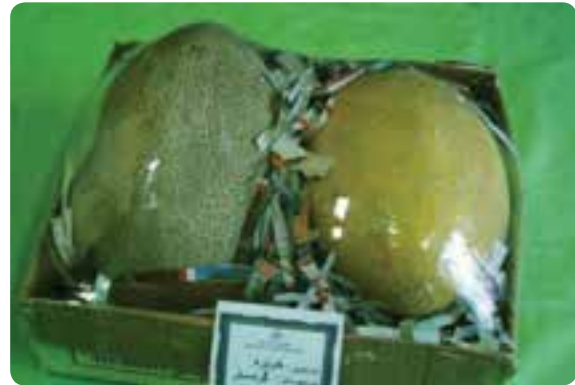
شکل ۲۹-۵- دو نمونه از محصولات کشاورزی صادراتی استان