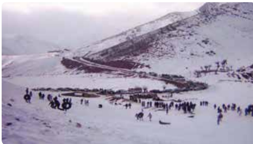
شکل ۲-۵ - منظره زمستانی با پوشش برفی شهمیرزاد در شهرستان مهدی شهر

۱- تنوع آب و هوایی و وجود مناطق بیلاقی البرز: استفاده از هوای معتدل تابستان و چشم‌اندازهای برفی زمستان مناطقی مانند بنه کوه در شهرستان گرمسار، شهمیرزاد در شهرستان مهدی شهر، چشمه علی و کلاته رودبار و تویه دروار در شهرستان دامغان، بسطام و کالپوش در شهرستان شاهرود.