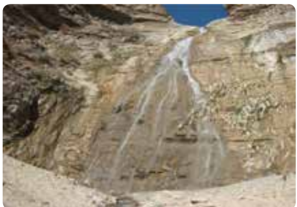
شکل ۵-۵ - آبشار رامه در شهرستان آرادان

۴- آبشار : آبشار روزیه در روستای چاشم از شهرستان مهدی شهر، آبشارهای نام نیک کالپوش در شهرستان میامی و تنگه داستان مجن در شهرستان شاهرود، آبشار نسرهای دیباج در شهرستان دامغان و آبشار رامه در شهرستان آرادان.