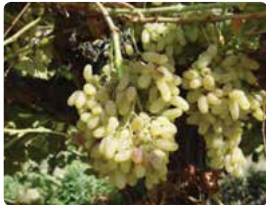
شکل ۲۲-۵- انگور از محصولات باغی شهرستان شاهرود

۳) پرورش دام و طیور: با توجه به گستردگی، تنوع ناهمواری و آب و هوا، استان سمنان یکی از قطب‌های پرورش دام و طیور در کشور به‌شمار می‌رود. بر این اساس اشکال مختلف پرورش دام و طیور در سطح استان به شرح زیر است: * پرورش دام سبک شامل: گوسفند، بز و دام سنگین شامل: گاو، شتر، گاو میش و اسب * پرورش طیور شامل انواع مرغ‌های گوشتی، تخم‌گذار، بوقلمون، شتر مرغ، بلدرچین و کبک