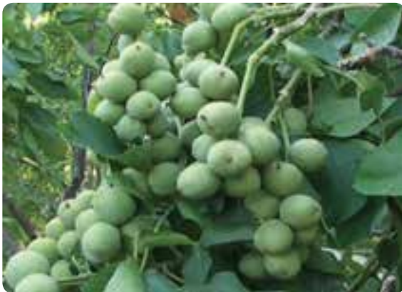
شکل ۲۳-۵- گردو از محصولات باغی شه‌میرزاد، در شهرستان مهدی‌شهر و مناطق شمالی دامغان