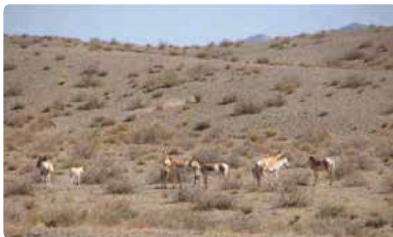
شکل ۸-۵- گور خر آسیایی زیست کره توران در شهرستان شاهرود

۱۰- پوشش گیاهی و مرتعی مطلوب در برخی از مناطق شمالی استان مانند: جنگل فینسک و رودبارک در شهرستان مهدی شهر، جنگل سیاه خانی، بادله کوه و اسپيرو در شهرستان دامغان، جنگل کالپوش در شهرستان میامی، ابر و اولنگ در شهرستان شاهرود.