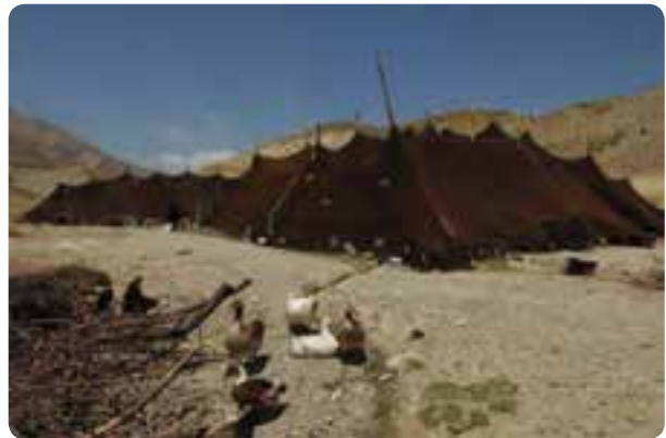
شکل ۱۵-۵- زندگی عشایری در استان