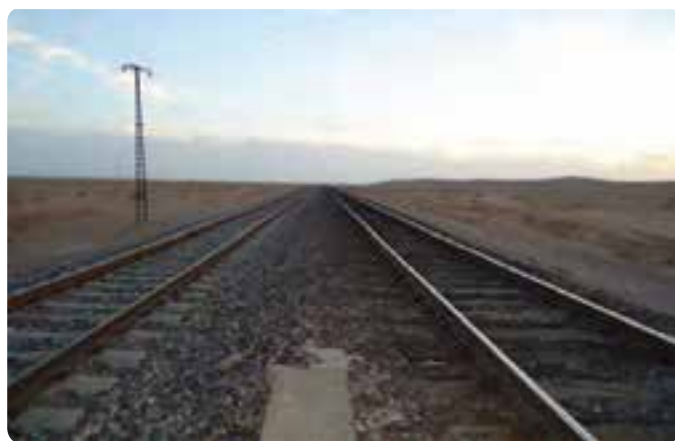
شکل ۲۸-۵- راه آهن دوخطهٔ تهران - مشهد در استان سمنان

الف) عبور راه اصلی آسفالتی دوباندهٔ مواصلاتی آسیای مرکزی - اروپا از استان سمنان