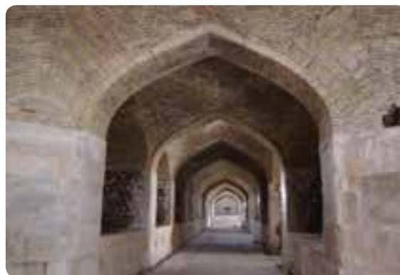
شکل ۱۳-۵- قصر بهرام در شهرستان گرمسار

پ) جاذبه‌های اقتصادی - معیشتی : این نوع جاذبه‌ها به فعالیت‌هایی گفته می‌شود که انسان با ساخت بناها و اشیای خاص ضمن تأمین معاش خود، موجب جلب توجه هر بیننده‌ای نیز می‌شود.