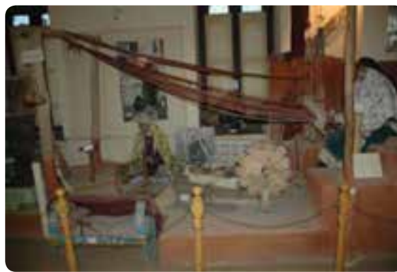
شکل ۱۱-۵- موزه مردم شناسی در شهر شاهرود