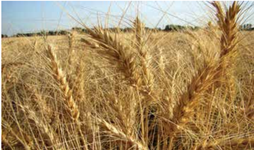
شکل ۲۵-۵ گندم، نماد کشاورزی در فارس