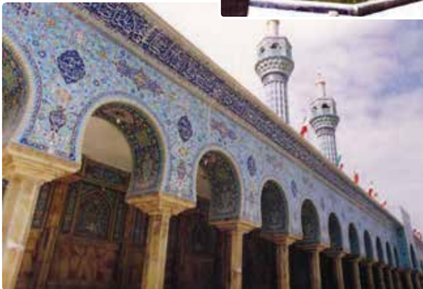
شکل ۹-۵- مسجد اعظم گراش