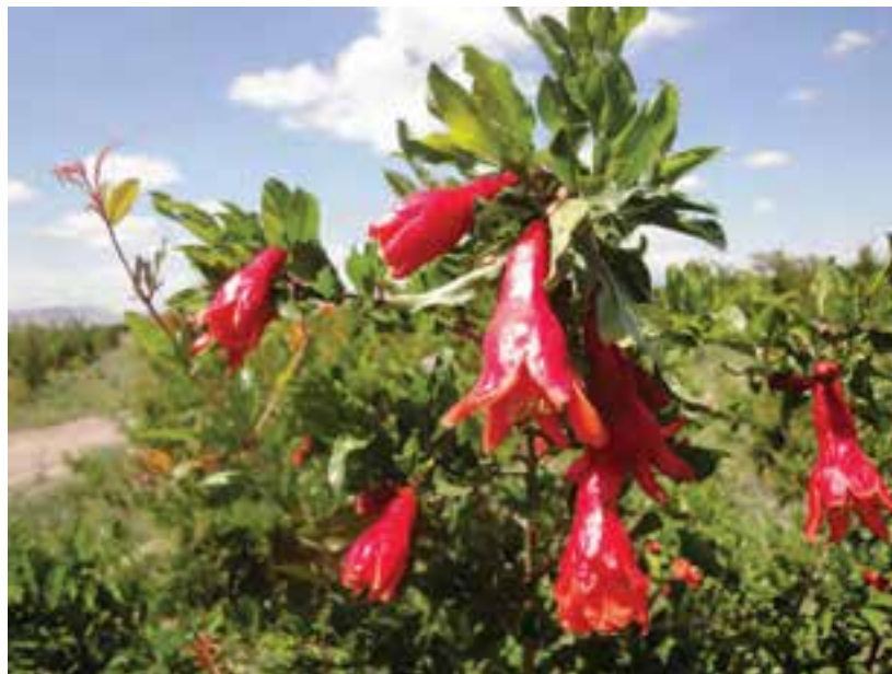
شکل ۲۴-۵- محصول انار در نیریز

بخش کشاورزی در این استان به گونه‌ای است که بعضی از فراورده‌ها جنبه صادراتی و ارزآوری به خود گرفته‌اند؛ همچون گندم و انار و مرکبات. تعدادی از محصولات کشاورزی استان در کشور، رتبه‌های اول تا سوم را به خود اختصاص داده‌اند، حتی تولید و صادرات انجیر فارس در جهان رتبه اول را به خود اختصاص داده است.