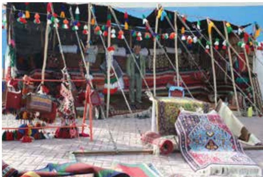
شکل ۱۷-۵- دست بافته های کوچ نشینان فارس