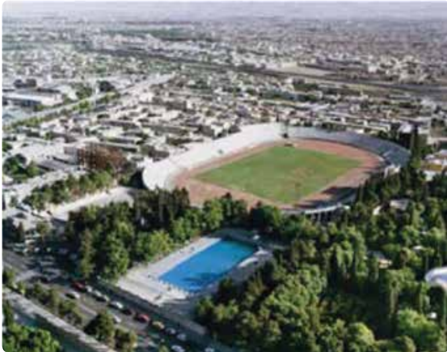
شکل ۲۳-۵- نمایی از استادیوم حافظیه - شیراز

تاکنون فعالیت‌های زیادی برای جذب گردشگر انجام گرفته است، اما برخی راه‌کارهای دیگر می‌تواند به رونق و توسعه این صنعت در استان بینجامد که عبارت‌اند از: