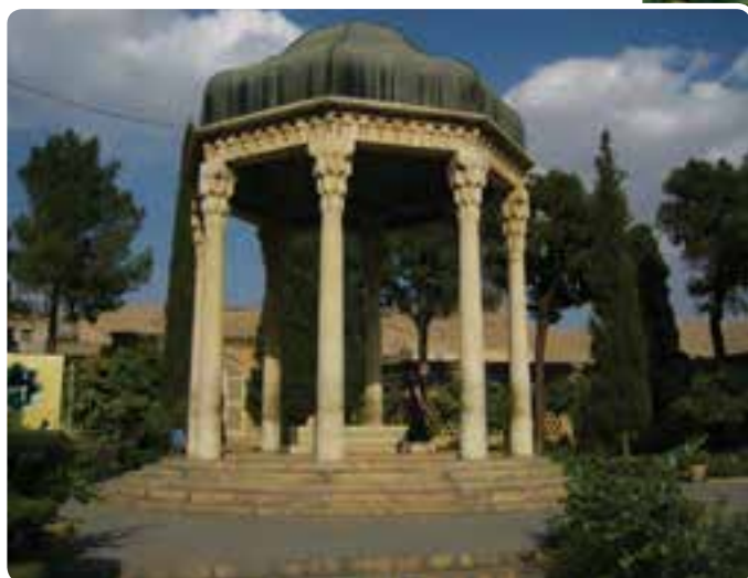
شکل ۱۶-۵- حافظیه - شیراز