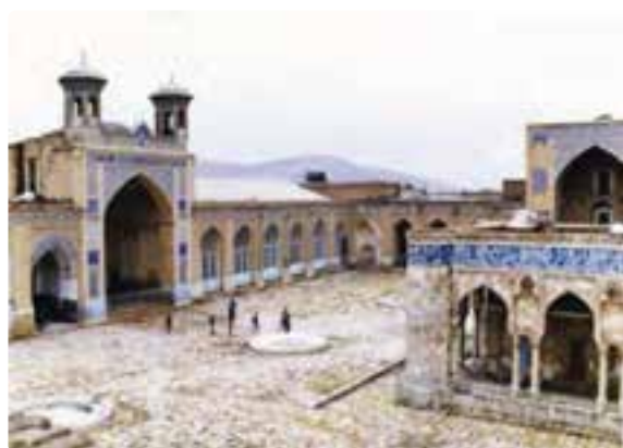
شکل ۲۰-۵- مسجد جامع عتیق - شیراز