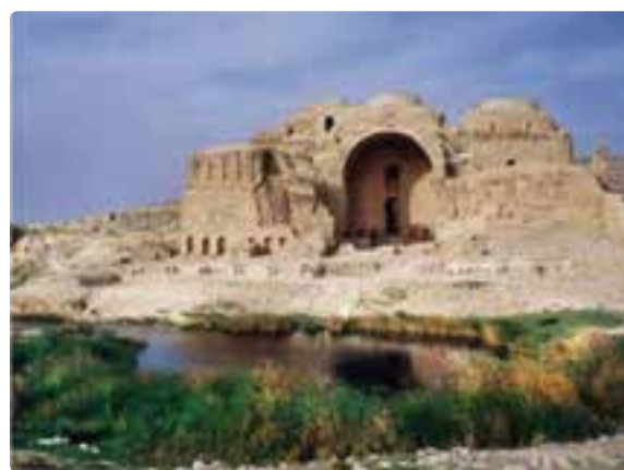
شکل ۲۲-۵- کاخ اردشیر - فیروز آباد