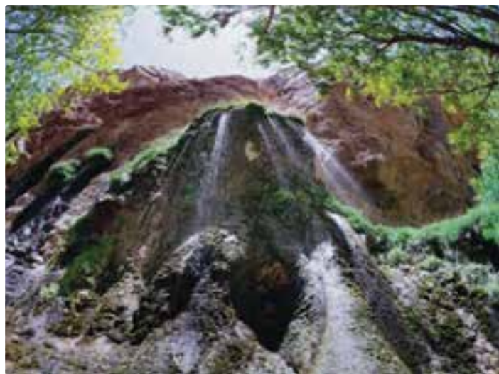
شکل ۱۱-۵- تنگ براق اقلید