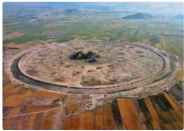
شکل ۱-۵- شهر دارابگرد - داراب

اگر قرار باشد که آثار تمدنی کشورها در یک مسابقه مشارکت داده شوند ارائه تخت جمشید از ایران کافی است که ما را در ردیف پنج کشور اول جهان قرار دهد. همچنین گسترش فرهنگ اسلامی در میان مردم فارس موجب خلق آثار تحسین‌برانگیزی از سوی مسلمانان ایرانی شد و همین آثار به سرزمین فارس اهمیت خاصی بخشیده است.