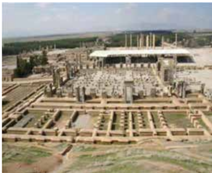
شکل ۵-۶- تخت جمشید مرودشت