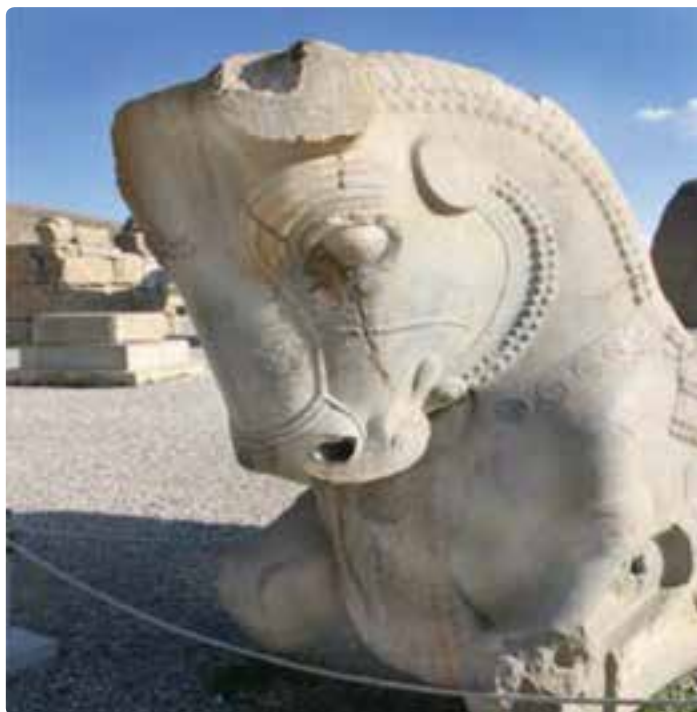
شکل ۵-۷- تخت جمشید

قدمت سکونت آریایی ها در این استان، حکومت های هخامنشیان و ساسانیان و بعد از آن حکومت های اسلامی، همگی آثار و بناهایی را از خود بر جای گذاشته اند که بازدید از آنها هدف بسیاری از گردشگران داخلی و خارجی است.