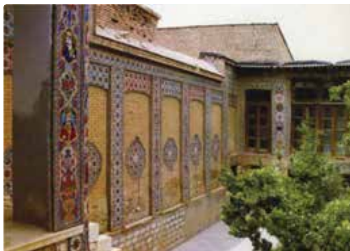
شکل ۱۳-۵- خانه ضیائیان شیراز

— جاذبه‌های تاریخی: همچون مجموعه‌های زندیه، مشیر و قوام در شیراز و فسا و داراب و خانه‌های قدیمی که به‌طور عمده از زمان قاجاریه در این استان به جای مانده‌اند و توسط سازمان میراث فرهنگی به ثبت رسیده‌اند و یا به موزه تبدیل شده‌اند؛ به عنوان نمونه، از خانه ضیائیان در محله سنگ سیاه و در مجاورت آرامگاه سیبویه می‌توان نام برد که مجموعه‌ای زیبا شامل پنجاه تصویر از بزرگان دینی و اجتماعی بر دیوارهای این خانه و بر روی کاشی‌های رنگی منقوش شده است.