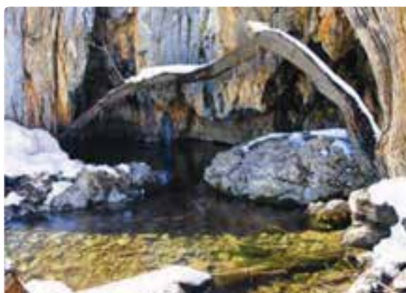
شکل ۱۹-۵- سرچشمه رودخانه شش پیر- سپیدان