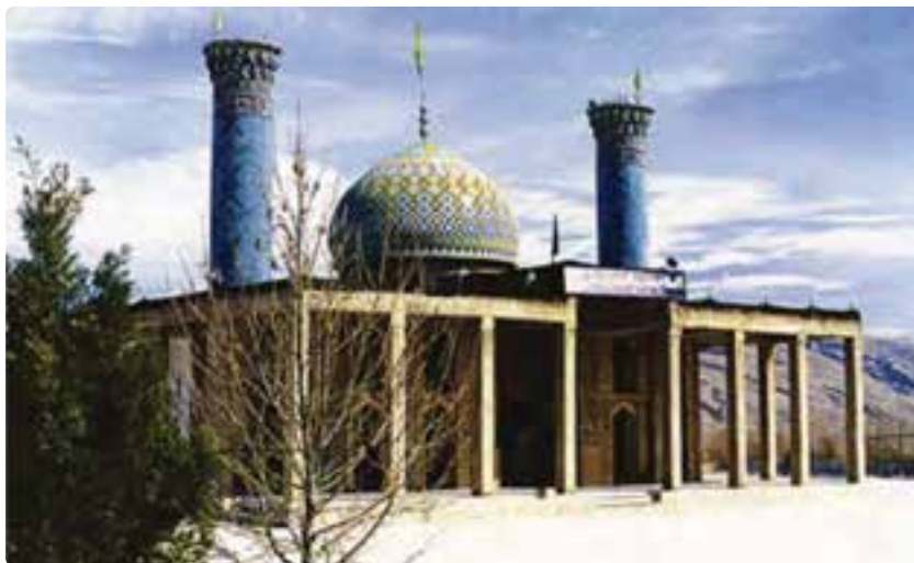
شکل ۱۴-۵- امامزاده شهید - فراشبند

— جاذبه‌های فرهنگی: سعدیه - حافظیه - سیبویه در شیراز و مقبره شیخ بیضاوی در سروستان.