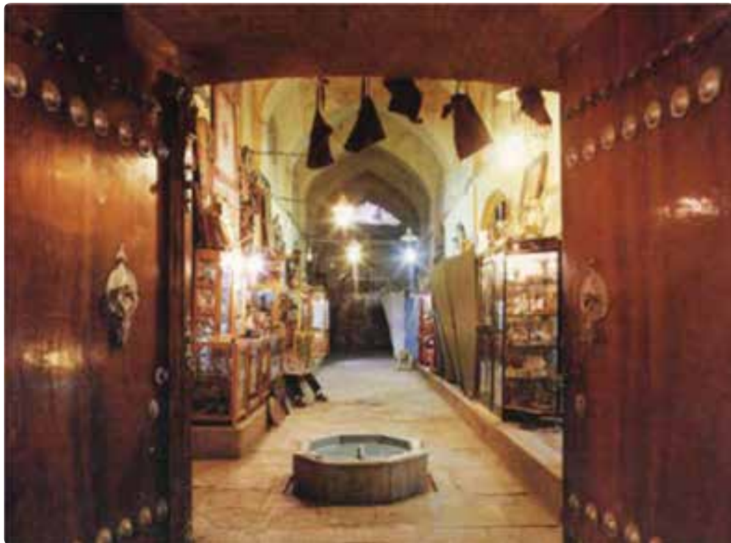
شکل ۱۲-۵- بازار مشیر - شیراز