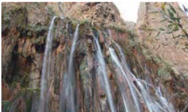
شکل ۱۰-۵- آبشار مارگون - سپیدان

توان‌ها و جاذبه‌های گردشگری در این استان را می‌توان به دو دسته کلی تقسیم کرد :