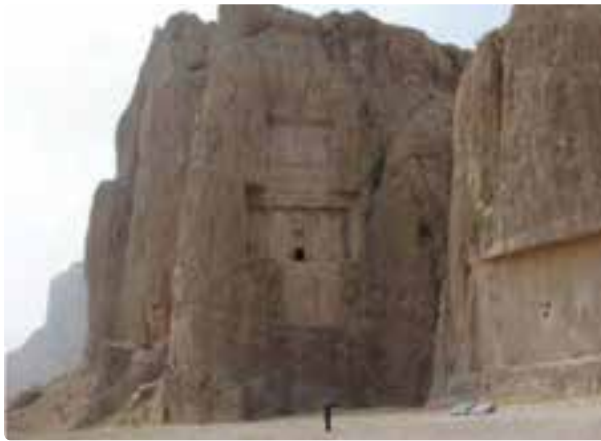
شکل ۲-۵- نقش رستم - مرودشت

در اهمیت پارسیان و تمدنی که بر جای گذاشته‌اند، می‌توان گفت اولین حکومت مقتدر و امپراطوری ایرانی را در این مرز و بوم بر جای گذاشتند که آوازه آن در فرهنگ جهانی خودنمایی می‌کند. این استان پیشینه‌ای هم‌پایه تاریخ ایران دارد و همواره یکی از مراکز شکل‌گیری و شکوفایی تمدن‌های کهن ایران زمین به‌شمار می‌رود.