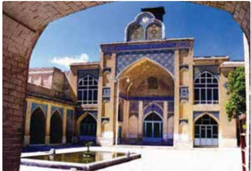
شکل ۸-۵- مسجد مشیر شیراز