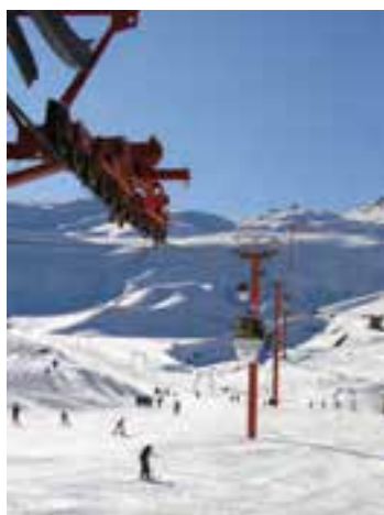
شکل ۱۸-۵- مجتمع بولاد کف