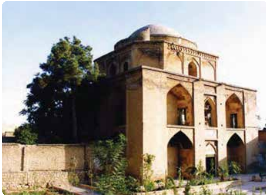
شکل ۵-۵- بی بی دختران شیراز

در کشور ما گام‌های نخست در توسعه این بخش برداشته شده است، به گونه‌ای که اکنون بیش از ۵۰ هزار نفر به طور مستقیم در زمینه گردشگری مشغول به کارند. از این تعداد در استان فارس در حال حاضر ۴۵۰۰ نفر در این صنعت شاغل‌اند. گردشگری و خودباوری: نهر، نخست‌وزیر هند در کتاب نگاهی به تاریخ جهان می‌نویسد: من هرگاه در برابر ایران و تمدن ایران قرار می‌گیرم، ناخودآگاه سر تعظیم فرود می‌آورم.