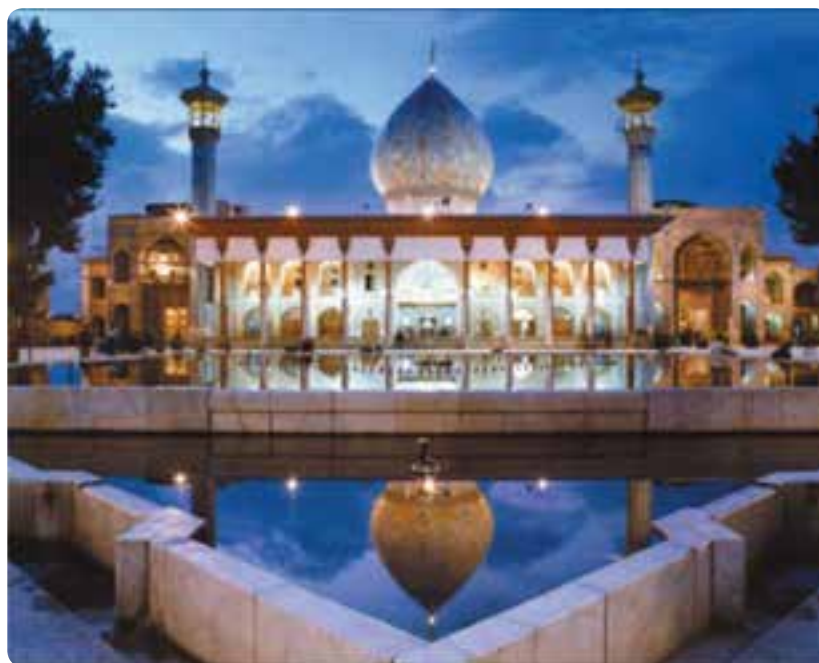
شکل ۴-۵- حرم متبرک حضرت احمد بن موسی (ع) معروف به شاهچراغ - شیراز

جالب است بدانیم که از این سه اصل، اولین و مهم ترین عنصر را گردشگری به حساب آورده اند. استان فارس در این زمینه توانمندی های زیادی دارد (با دو مورد دیگر در فصل های بعد آشنا می شوید).