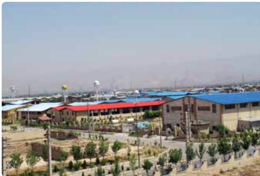
شکل ۲-۱۴- شهر صنعتی نظرآباد

در سال‌های اخیر به دنبال ممنوعیت تأسیس کارگاه‌های صنعتی در تهران، بخش‌هایی از استان برای احداث شهرک‌های صنعتی مورد توجه قرار گرفت که بسیاری از آن‌ها به مرحله بهره‌برداری رسیده است و تعدادی دیگر در حال تکمیل است. اشتغال‌زایی و افزایش تولیدات داخلی از نتایج ایجاد این شهرک‌های صنعتی می‌باشد.