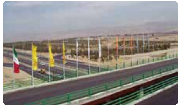
شکل ۷-۱۴- راه‌های استان