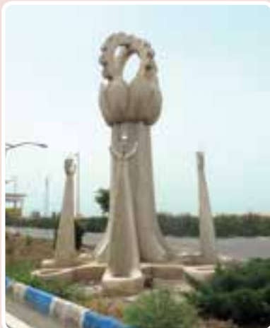
شکل ۳-۱۴- ورودی شهرک صنعتی اشتهارد

شهرک صنعتی اشتهارد: این شهرک به علت دسترسی به راه‌های ارتباطی و زمین‌های بایر و وسیع در مسیر جاده اشتهارد- بومین زهرا مکان‌یابی شد و در حال حاضر با داشتن ۵۲۵ واحد صنعتی فعال (فلزی - غذایی - شیمیایی و...) از اصلی‌ترین مناطق صنعتی کشور محسوب می‌شود.