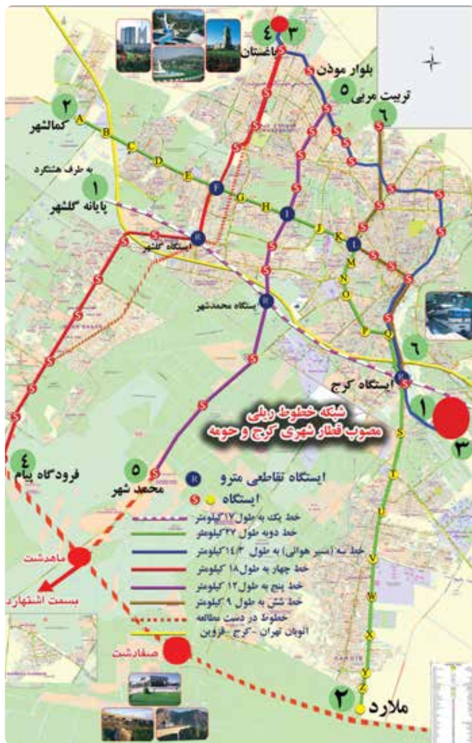
شکل ۹-۱۴ نقشه خطوط مترو کرج و حومه