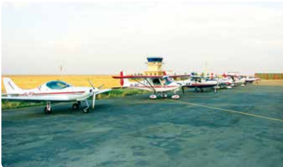
شکل ۱۱-۱۴- فرودگاه آزادی - نظرآباد

✳️ فرودگاه آزادی: این مجتمع فرودگاهی سال ۱۳۷۹ در شرق روستای صالحیه شهرستان نظرآباد افتتاح شد. مهم‌ترین اهداف احداث این فرودگاه تربیت نیروی انسانی در زمینه طراحی و ساخت هواپیماهای کوچک و آموزش هوانوردی است.