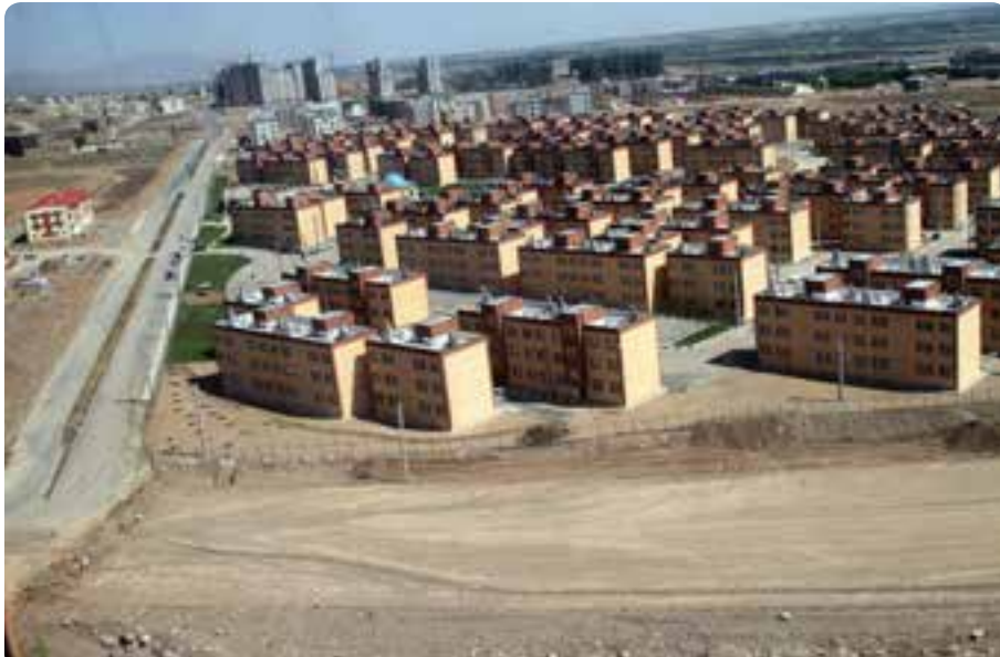
شکل ۱- ۱۵- مسکن مهر