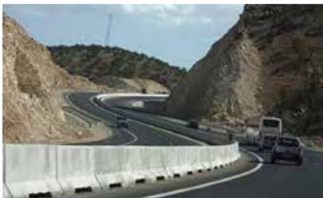
شکل ۲۱-۱۴ - آزادراه