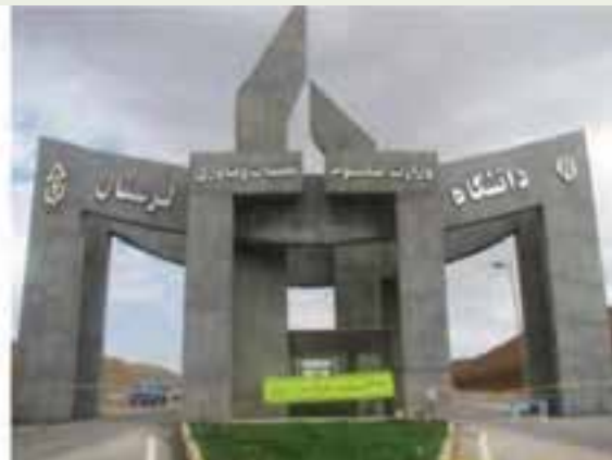
شکل ۱۶-۱۴- مراکز آموزشی استان

همان‌طور که انقلاب اسلامی در زمینه‌های مختلف در جهت توسعه و رونق استان لرستان دستاوردهای مهم و چشمگیری داشته است، در زمینه علمی – آموزشی نیز اقدامات زیادی انجام شده است که می‌توان به افزایش سطح پوشش تحصیلی در کلیه دوره‌های ابتدایی تا پایان دوره متوسطه، توسعه دانشگاه‌ها و مراکز آموزش عالی، گسترش رشته‌های مختلف برای ادامه تحصیل در سطوح مختلف دانشگاهی از کاردانی تا دکتری اشاره کرد.