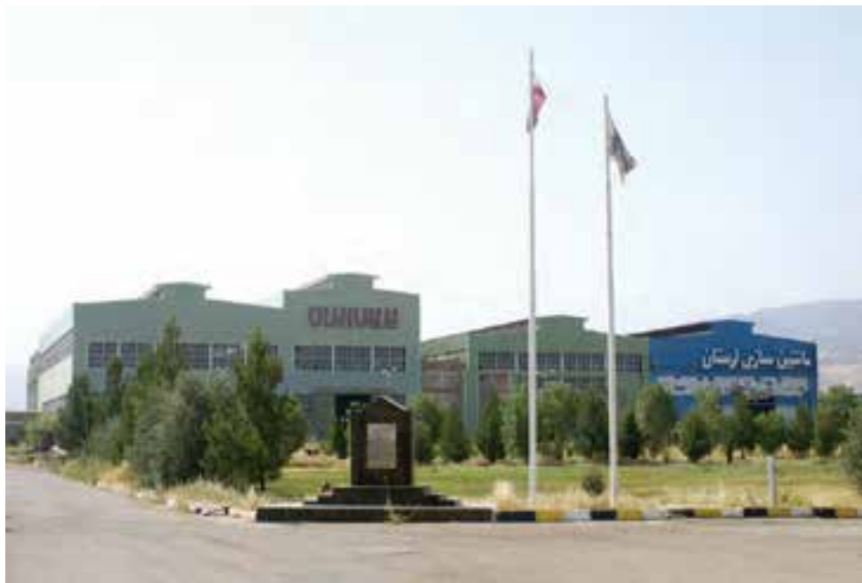
شکل ۱-۱۴- کارخانه برس لرستان

استان لرستان از زمینه‌های مناسب توسعه صنعتی به‌ویژه در صنایع معدنی، کانی غیرفلزی، صنایع غذایی و نساجی برخوردار است. با وجود این مزایا، سهم استان از صنایع مادر تخصصی و پیشرفته ناچیز است. استان ما توسعه صنعتی را با اولویت به حفظ صنایع موجود و سرمایه‌گذاری در صنایع تبدیلی کشاورزی، کانی غیرفلزی، صنایع پایین دست پتروشیمی و دارویی انتخاب کرده است. پس از انقلاب شکوهمند اسلامی ۱۵۱۱ پروانه بهره‌برداری در بخش صنعت و معدن صادر شد که در این جهت، چهارده شهرک صنعتی، هفت شهرک فعال، چهار ناحیه صنعتی فعال و تعدادی شکل صنعتی و صنفی تشکیل شده است.