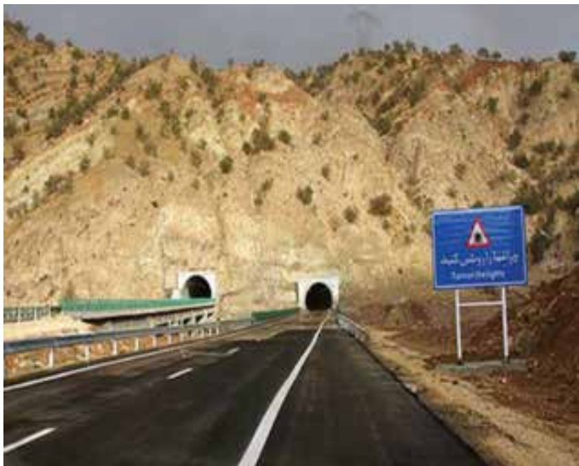
شکل ۱۲-۱۴- آزادراه خرم‌آباد - پل زال