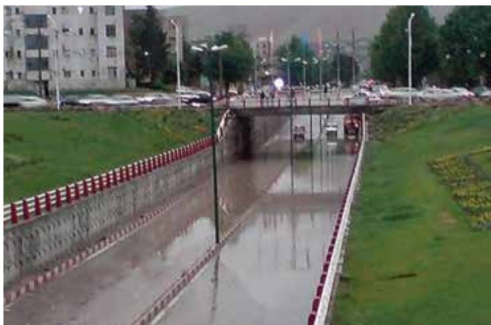
شکل ۱۰-۱۴- یکی از زیرگذرهای شهر خرم آباد

۳- حمل و نقل: استان لرستان به دلیل واقع شدن در مسیر راه های اصلی کشور و همجواری با استان های مرزی و صنعتی به عنوان پل ارتباطی، میان شمال و جنوب کشور از موقعیت خاصی برخوردار است. از مهم ترین طرح های عمرانی در سال ۱۳۸۹ می توان به افتتاح آزاد راه خرم آباد - پل زال و چهارخطه کردن محورهای اصلی استان اشاره کرد. همچنین، آغاز عملیات پروژه های مهم آزاد راه خرم آباد - اراک، احداث خطوط ریلی دورود - بروجرد - غرب کشور و شبکه ریلی دورود - خرم آباد - اندیمشک و