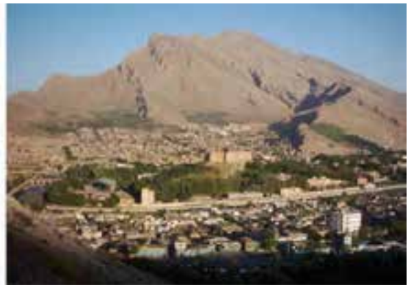
شکل ۱-۱۵- نمایی از چشم‌اندازهای شهرهای استان