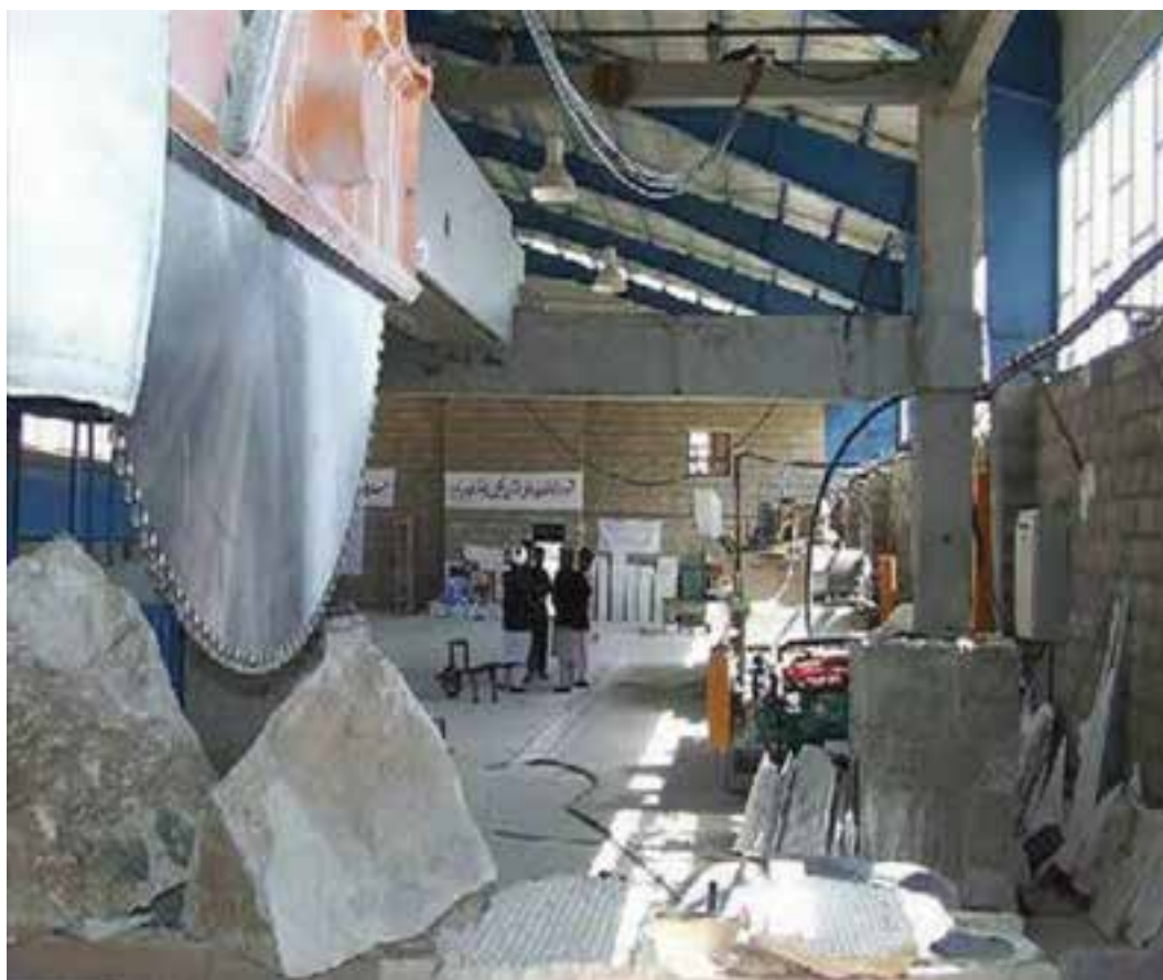
شکل ۷-۱۴- کارخانه سنگبری