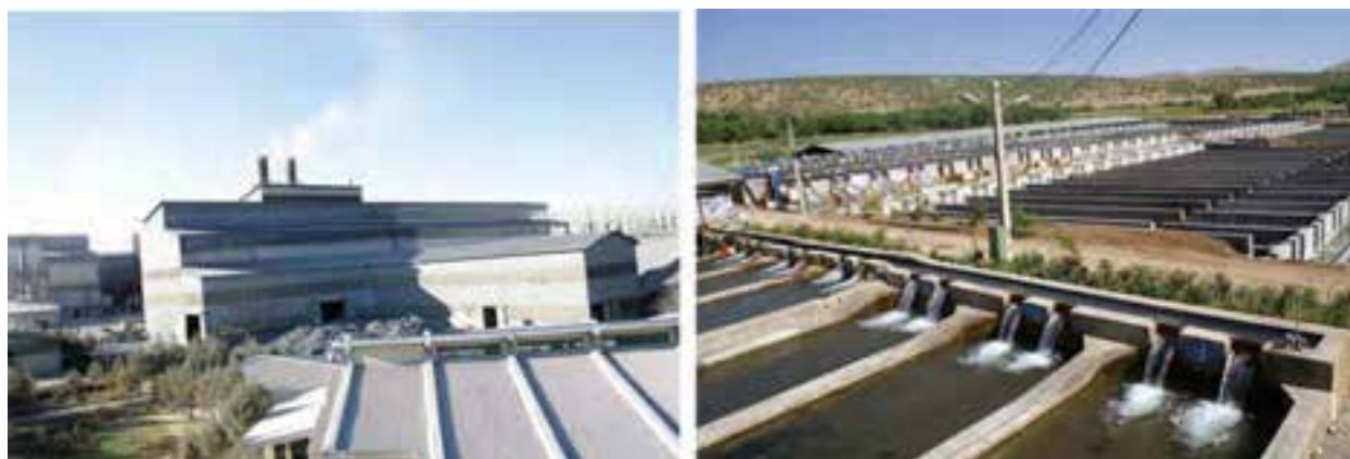
شکل ۲-۱۵- نمایشی از فعالیت‌های اقتصادی در استان