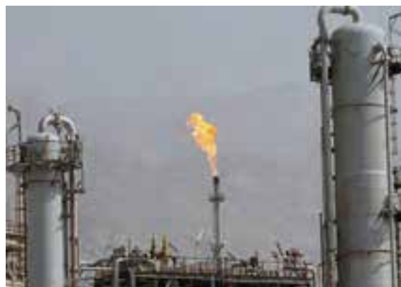
شکل ۲۰-۱۴ - نمایی از صنایع استان