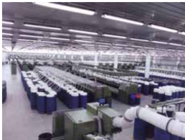
شکل ۴-۱۴- کارخانه نساجی بروجرد