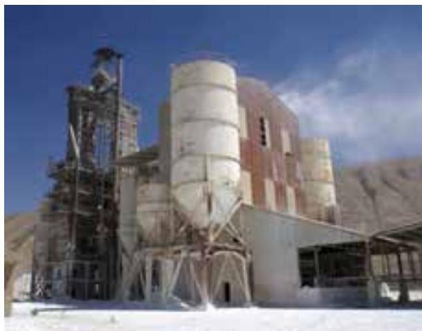
شکل ۳-۱۴- کارخانه آهک هیدراته پلدختر