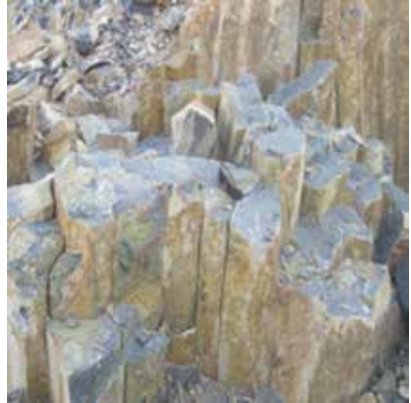
شکل ۷-۱۳- توانمندی های اقتصادی در بخش معدن