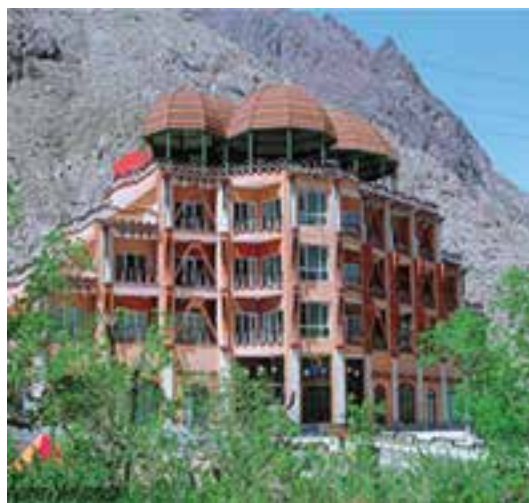
شکل ۱۱-۱۲- هتل کوهستان بند عمرشاه (امیرشاه) بیرجند