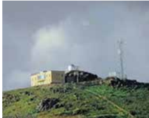
شکل ۲۷-۱۲- رصدخانه دکتر مجتهدی

● منطقه نمونه گردشگری تون و باغستان - آبگرم فردوس : شهر تاریخی و قدیمی تون در جنوب شهر فردوس با وسعتی حدود ۱۸ هکتار واقع شده است که مجموعه‌ای از جاذبه‌های تاریخی و فرهنگی را تشکیل می‌دهد؛ اما منطقه نمونه گردشگری باغستان آبگرم بیشتر از جاذبه‌های طبیعی برخوردار است.