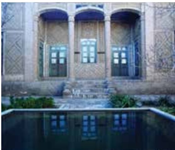
شکل ۱۰-۱۲- خانه فرهنگ بیرجند