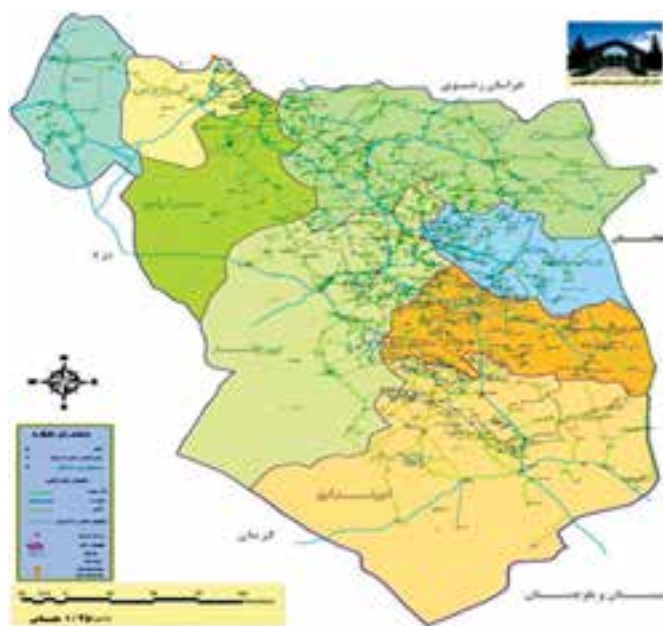
شکل ۸-۱۳- نقشه راه‌های خراسان جنوبی