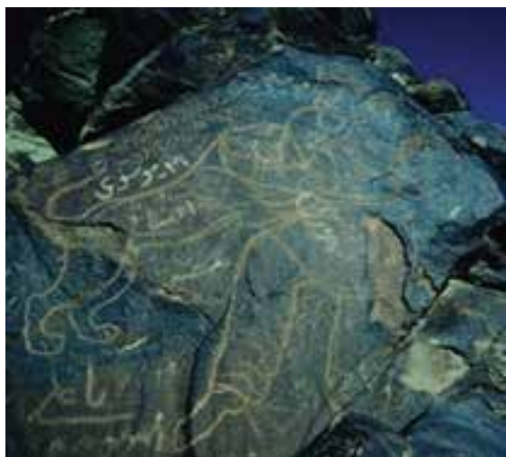
شکل ۱۲-۱۲- سنگ نگاره کال جنگال بیرجند