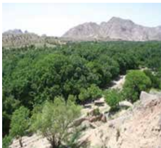
شکل ۲۰-۱۲- دره ییلاقی کریمو و مصعبی سرایان