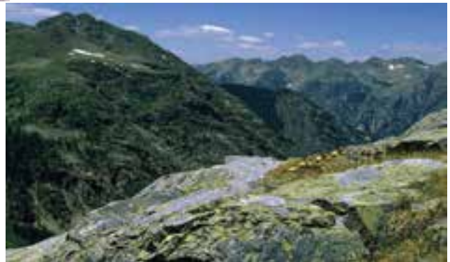
شکل ۲۳-۱۲- قلّه میلاد شاسکوه شهرستان زیرکوه