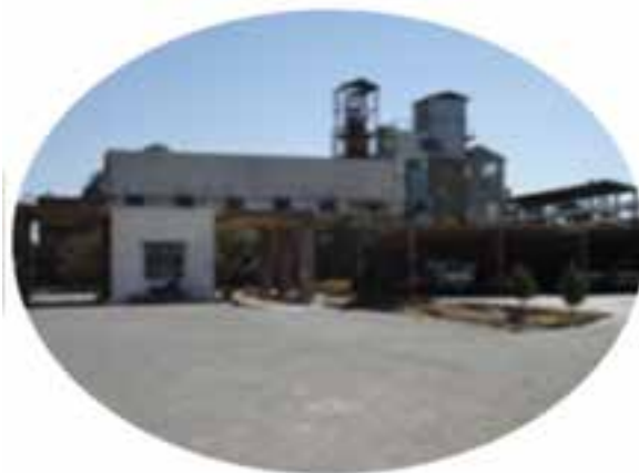
شکل ۵-۱۳- توانمندی‌های اقتصادی در بخش صنعت