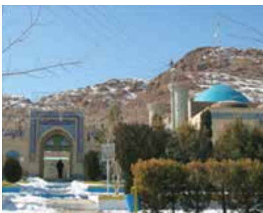
شکل ۶-۱۲- امامزاده هوگند بشرویه