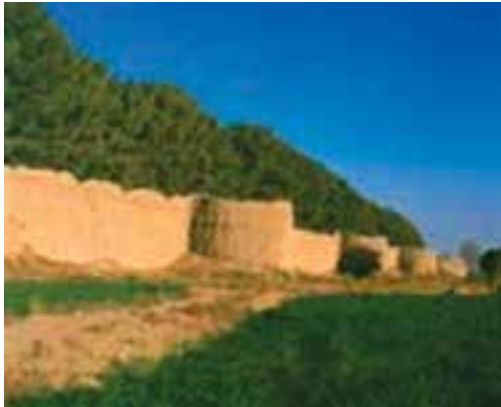
شکل ۲۸-۱۲- قلعه باغ شهرمود