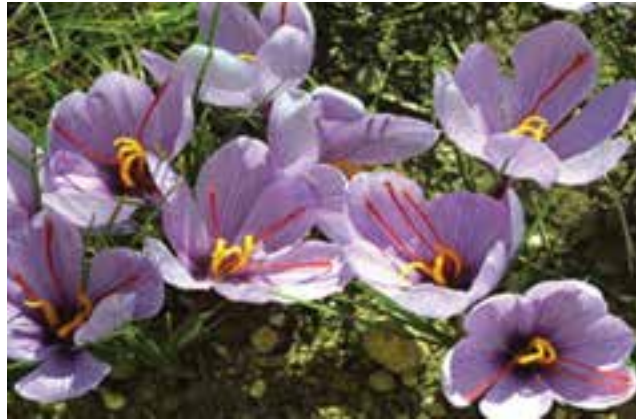
شکل ۳۵-۱۲- مزارع زعفران (طلای سرخ) قاینات

● روستای هدف گردشگری دهسلم در نهبندان: شرایط اقلیمی مناطق کویری از جمله نهبندان باعث شده تا مردم کویرنشین از ابتکار و خلاقیت خود استفاده کنند و با حداکثر بهره‌گیری از عوامل و شرایط طبیعی آن را در اختیار خود درآورند.