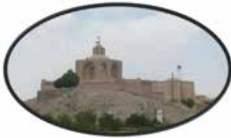
شکل ۱۶-۱۲- آرامگاه ابن حسام در شهر خوسف