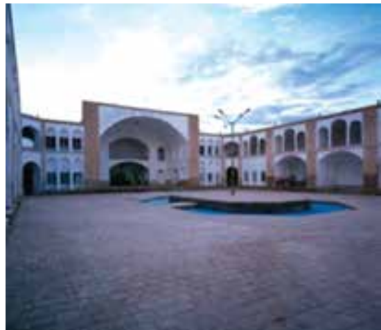
شکل ۹-۱۲- مدرسه شوکتیه بیرجند