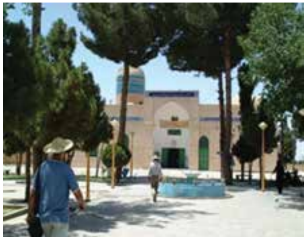
شکل ۲۹-۱۲- امامزادگان سلطان محمد و سلطان ابراهیم