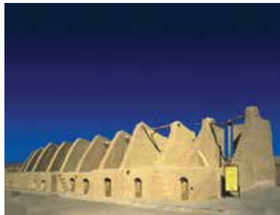
شکل ۳۶-۱۲- آسبادهای خوانشرف نهبندان