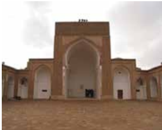
شکل ۳۱-۱۲- مسجد جامع فردوس

● منطقه نمونه گردشگری بوذرجمهر قاین : منطقه نمونه گردشگری بوذرجمهر با وسعتی حدود ۵۰۹ هکتار در ضلع شرقی شهر قاین واقع شده است که پیوند تنگاتنگی با پایتخت زعفران جهان و کانون شهری دیرینه و پایدار سرزمین قهستان و فرهنگ و تمدن کهن دارد.