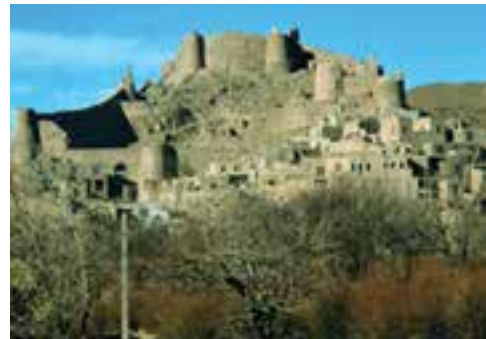
شکل ۱۷-۱۲- قلعه فورگ در میان