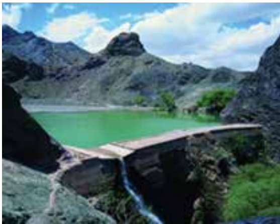
شکل ۸-۱۲- بنددره بیرجند