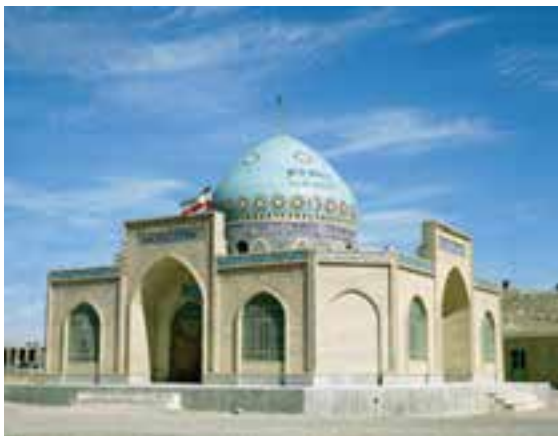
شکل ۳۷-۱۲- مزار آقا سید علی نهبندان