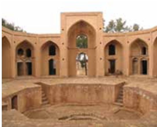
شکل ۳۲-۱۲- مدرسه علیای فردوس