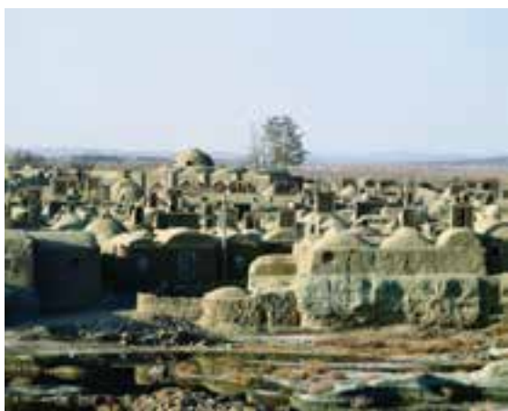
شکل ۱۴-۱۲- بافت تاریخی روستای خور شهر خوسف