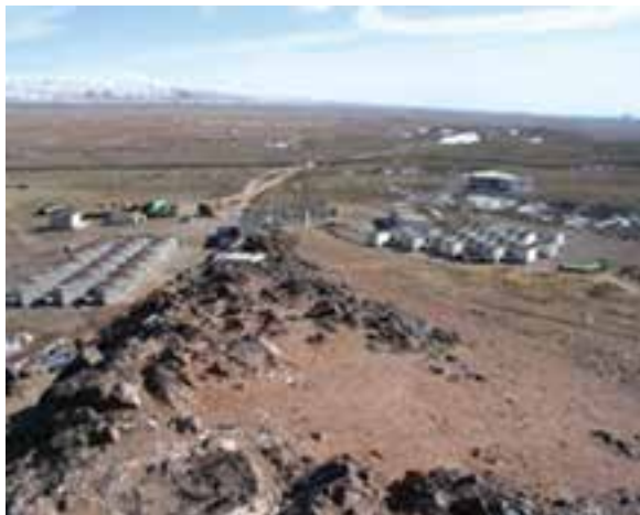
شکل ۳۰-۱۲- آب گرم فردوس