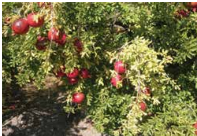
شکل ۳-۱۳- باغات انار در استان خراسان جنوبی

پ) دامپروری : علی‌رغم شرایط نامناسب اقلیمی، بیش از ۱۵۱۵۳ خانوار عشایری در استان به فعالیت‌های دامی مشغول‌اند. علاوه بر آن در بخش دامپروری، پرورش مرغ گوشتی و تخم‌گذار، گاو شیری و گوشتی، گوسفند، بز و شتر به صورت سنتی و صنعتی انجام می‌پذیرد.