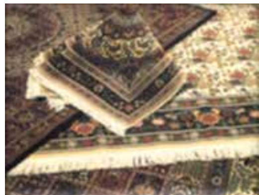
شکل ۶-۱۳- فرش مود