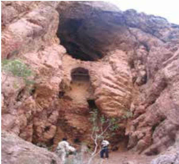
شکل ۲۲-۱۲- غار پهلوان شهرستان زیرکوه