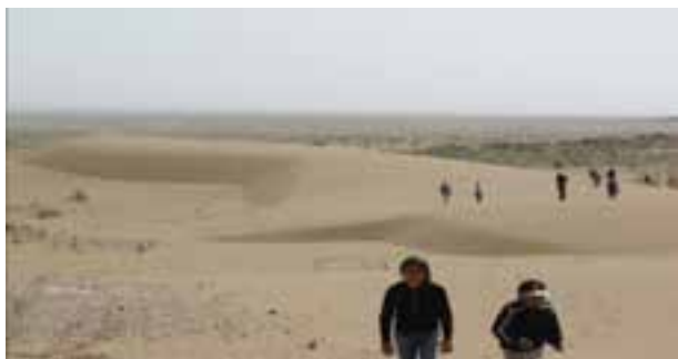
شکل ۲۴-۱۲- کویر همت آباد شهرستان زیرکوه