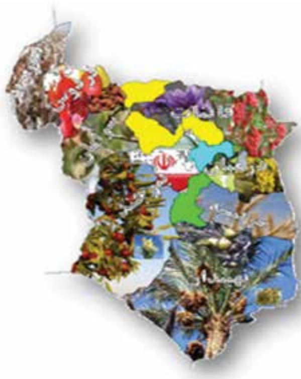
شکل ۲-۱۳- نقشه پراکندگی محصولات کشاورزی استان

استان ما دارای ۱۳۲۶۳۹ هکتار اراضی زیر کشت محصولات زراعی با تولید ۵۷۰۴۱۲ تن و ۴۶۸۸۸ هکتار سطح زیر کشت محصولات باغی با تولید ۶۱۸۹۳ تن است. همچنین از لحاظ دام، استان دارای ۳۴۱۹۳۷۷ واحد دامی می‌باشد که علاوه بر تولید نیاز استان، به سایر استان‌های همجوار نیز تولیدات آن ارسال می‌شود.