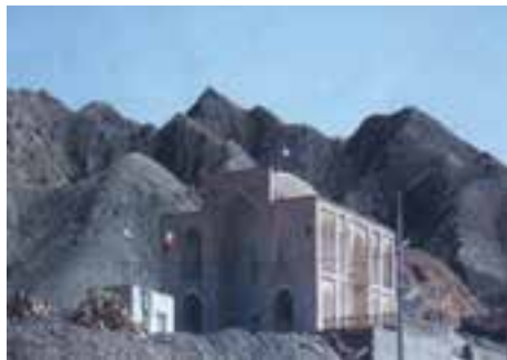
شکل ۱۸-۱۲- امامزاده سلطان ابراهیم رضا