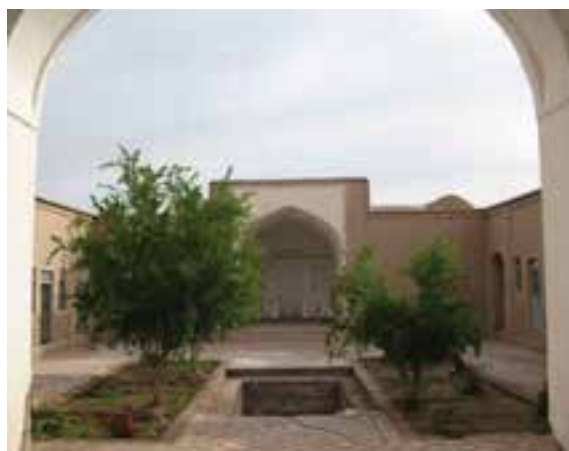
شکل ۱۳-۱۲- خانه تاجور شهر خوسف