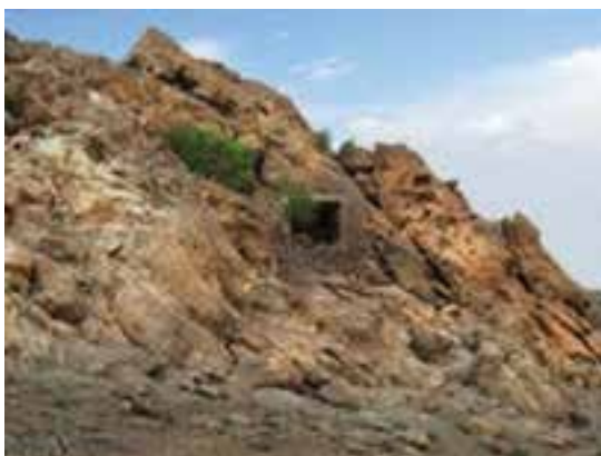
شکل ۲۶-۱۲- غار چنشت