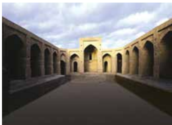
شکل ۲۱-۱۲- کاروانسرای سرایان