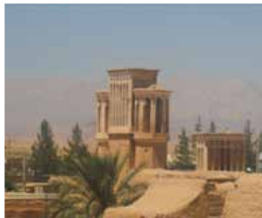
شکل ۳-۱۲- بادگیرهای بشرویه