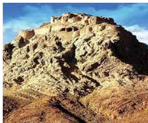
شکل ۵-۱۲- قلعه دختر