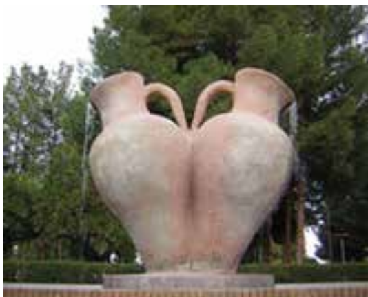
شکل ۴-۱۲- بوستان شهری بشرویه