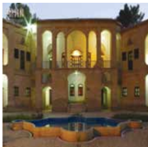
شکل ۱-۱۲- باغ موزه و عمارت اکبریّه بیرجند