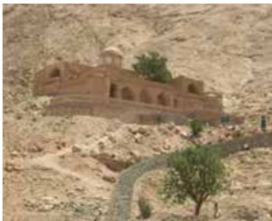
شکل ۳۴-۱۲- بوذرجمهر قاین