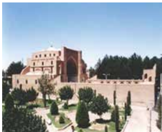
شکل ۳۳-۱۲- مسجد جامع قاین