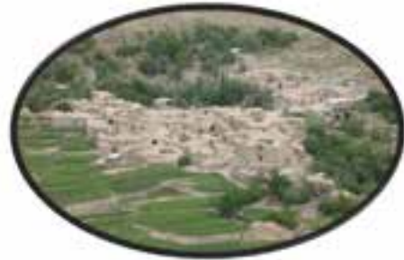
شکل ۱۵-۱۲- روستای آرک شهر خوسف

● منطقه نمونه گردشگری درخش و آسیابان (قهستان)، روستای هدف گردشگری در میان و فورگ در شهرستان در میان : این منطقه در شهرستان در میان در ۷۰ کیلومتر محور بیرجند - در میان - زیرکوه واقع شده است و یکی از قدیمی ترین نقاط استان خراسان جنوبی محسوب می شود. اهمیت آن بیشتر از لحاظ جاذبه های تاریخی و فرهنگی است؛ هرچند دارای مناطق بیلاقی با درختان و باغات سرسبز می باشد و روستاهای هدف گردشگری در میان و فورگ در مسیر جاده اسدیبه به سریشه و بیرجند واقع شده است.