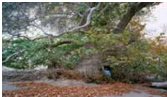
شکل ۱۹-۱۲- درخت هزار ساله دوشنگان