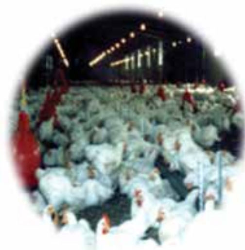
شکل ۴-۱۳- توانمندی‌های اقتصادی در بخش پرورش دام و طیور