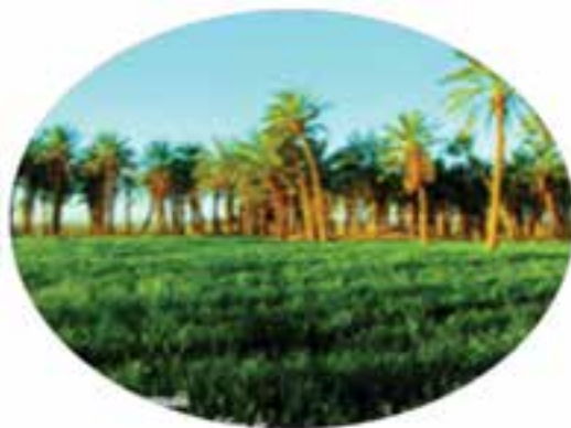
شکل ۳۸-۱۲- نخلستان‌های دهسلم