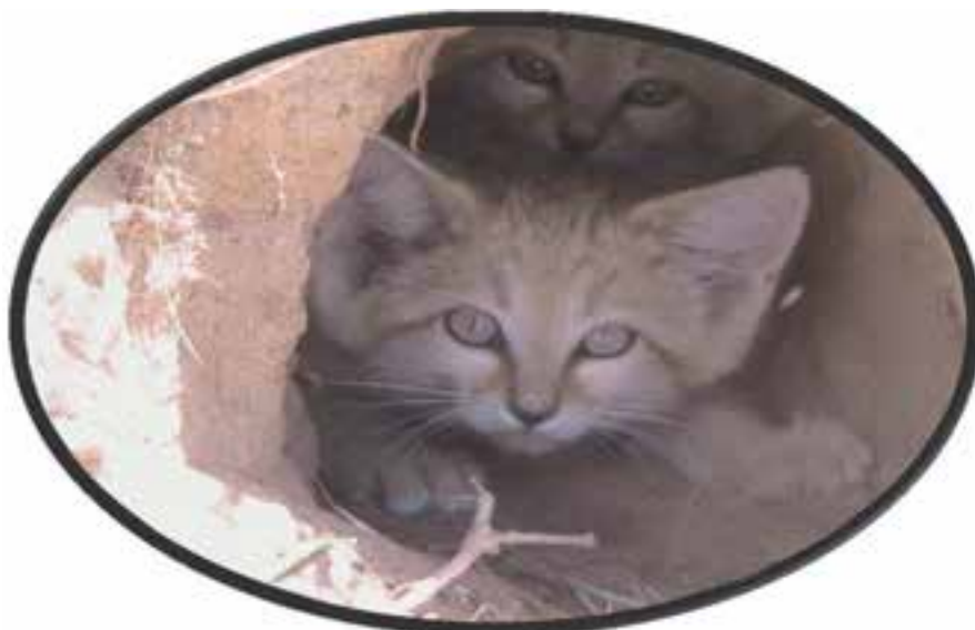
شکل ۲۵-۱۲- گربه شنی در حال انقراض شهرستان زیرکوه

● روستاهای هدف گردشگری چنشت و ماخونیک در سریشه: روستای هدف گردشگری چنشت در ۳۵ کیلومتری شهر مود واقع شده است و از نظر جاذبه‌های طبیعی و تاریخی - فرهنگی اهمیت خاصی دارد اما روستای ماخونیک در محور سریشه به دُرُح قرار دارد. و بیشتر از اهمیت تاریخی برخوردار است.