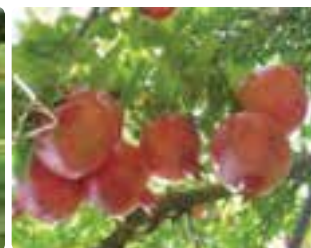
شکل ۴-۶ انار (اول)