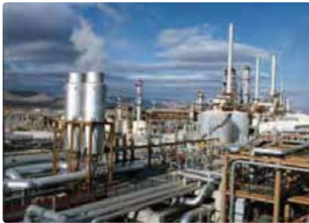
شکل ۳۲-۶ پتروشیمی فارس