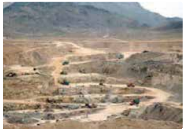
شکل ۳۱-۶ کانی غیرفلزی