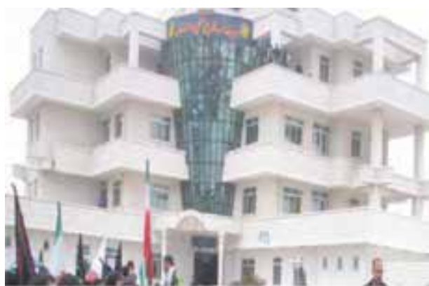
شکل ۲۷-۶- ساختمان فرودگاه لار

براساس آمارهای موجود طول شبکه راه‌های اصلی استان که در سال ۱۳۵۷ برابر ۱۲۲۱ کیلومتر بوده در سال ۱۳۸۶ به حدود ۲۲۲۹ کیلومتر افزایش یافته که ۵۶۹ کیلومتر آن بزرگراه است. تعداد فرودگاه‌های استان نیز که پیش از انقلاب اسلامی تنها به فرودگاه شیراز محدود می‌شد، امروز به شش فرودگاه فعال افزایش یافته است (آیا اسامی این فرودگاه‌ها را می‌دانید؟).