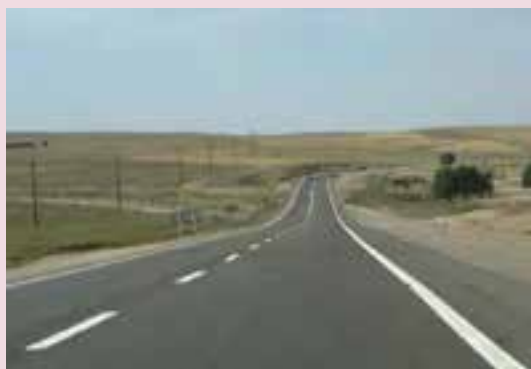
شکل ۴۳-۶- راه‌های بین شهری

در بخش انرژی کارهای بزرگی در استان فارس شروع شده که علاوه بر گسترش واحدهای تولیدی مجتمع پتروشیمی شیراز پالایشگاه گاز پارسیان که از آن به عنوان نقطه اتکا از کشور یاد می‌شود، کشف منابع جدید نیز در زمینه نفت در مناطق مختلف استان صورت گرفته است و امید می‌رود در زمینه صنعت نفت استان فارس قدم‌های بزرگی در آینده برداشته شود.