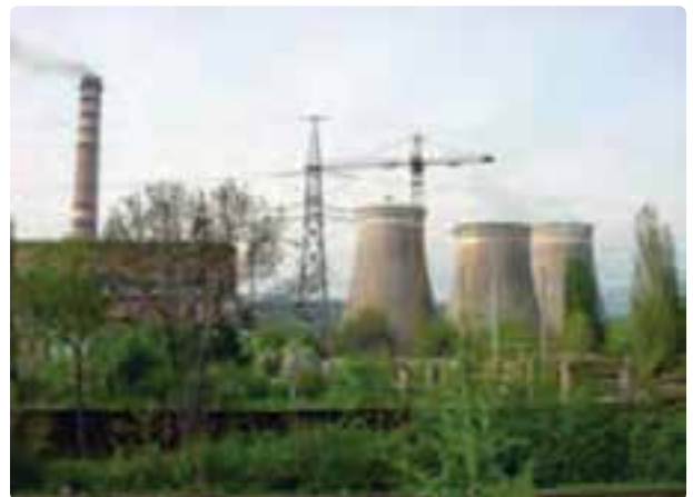
شکل ۳۳-۶ سیکل ترکیبی