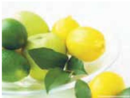
شکل ۱۷-۶ مرکبات (دوم)