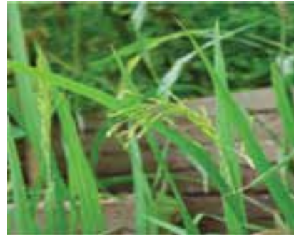
شکل ۱۶-۶ شلتوک (دوم)