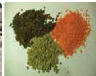
شکل ۱۲-۶ حبوبات آبی (اول)