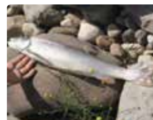
شکل ۱۳-۶ ماهی سرد آبی (اول)