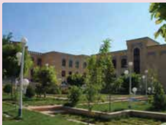
شکل ۳۵-۶ دانشگاه آزاد شیراز

علمی و آموزشی: یکی از ابعاد توسعه همه‌جانبه استان علاوه بر گسترش سوادآموزی، رشد فعالیت علمی و آموزشی در دانشگاه‌ها و توسعه مراکز آموزشی در مقاطع گوناگون تحصیلی در استان فارس بوده است. میزان باسوادی در استان فارس از ۴۹/۵ درصد سال ۱۳۵۵ به ۸۷ درصد در سال ۱۳۸۵ افزایش یافته که بیانگر تحول قابل ملاحظه‌ای در سوادآموزی است.