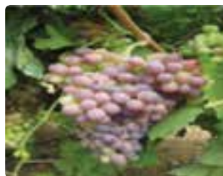
شکل ۵-۶ انگور دیم (اول)