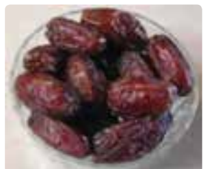
شکل ۱۵-۶ خرما (دوم)