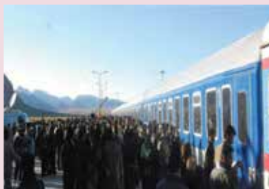
شکل ۴۲-۶- ایستگاه راه آهن