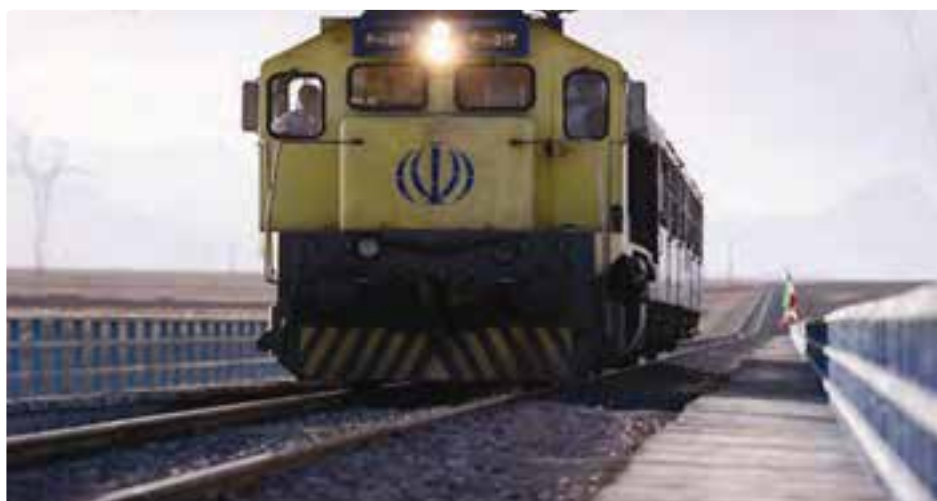
شکل ۳-۶- حمل و نقل و ارتباطات