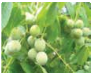
شکل ۱۴-۶ گردو (دوم)