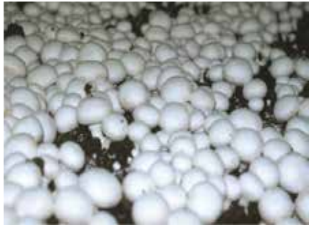
شکل ۲۹-۶ صنایع غذایی بیضا