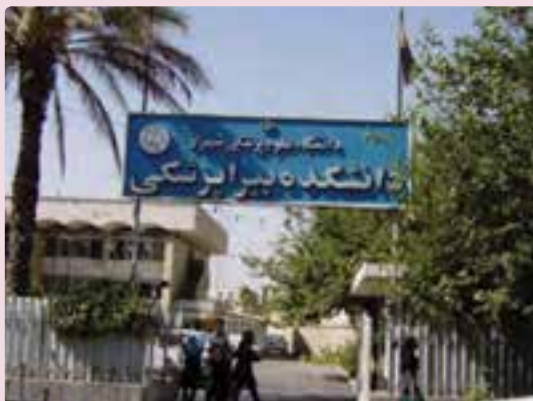
شکل ۳۶-۶ دانشگاه شیراز