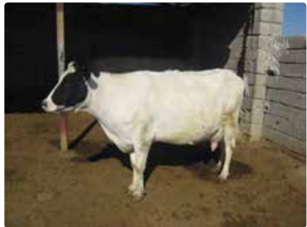
شکل ۱۹-۶- گاوداری صنعتی

علاوه بر فعالیتهای زراعی و باغی در زمینه دامپروری و تولیدات دامی و پرورش آبزیان و ماهیان پرورشی روستائیان و عشایر فارس توانسته‌اند سهم عمده‌ای از تولید گوشت قرمز و سفید کشور را به خود اختصاص دهند. جدول ۲-۶ بخشی از فعالیتهای دامپروری و تولیدات آن را در سال ۱۳۸۶ نشان می‌دهد.