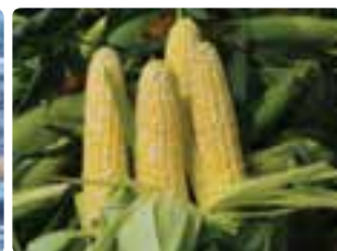
شکل ۸-۶ ذرت دانه‌ای (اول)