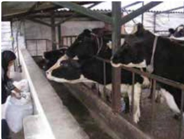
شکل ۲۰-۶- گاوداری صنعتی