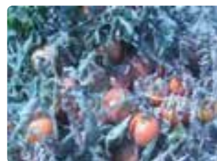
شکل ۹-۶ گوجه‌فرنگی (اول)