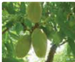
شکل ۷-۶ بادام (اول)