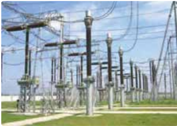
شکل ۳۰-۶ صنایع الکترونیک