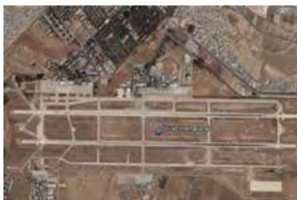
شکل ۲۶-۶- فرودگاه شیراز