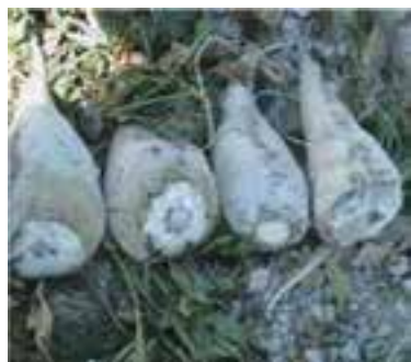
شکل ۱۸-۶ چغندر قند (سوم)