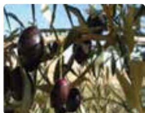
شکل ۱۱-۶ زیتون (اول)