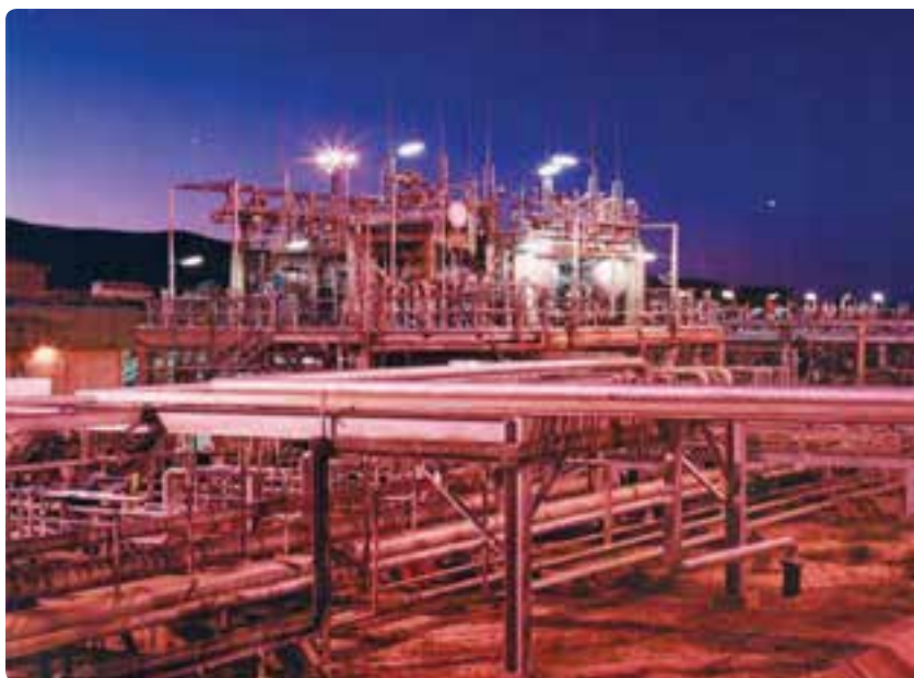
شکل ۱-۶- توسعه صنعتی