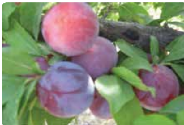
شکل ۴۰-۶- باغداری