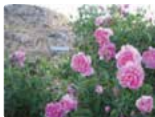
شکل ۱۰-۶ گل محمدی (اول)