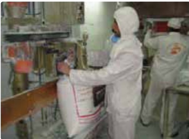
شکل ۳۴-۶ صنایع غذایی بیضا