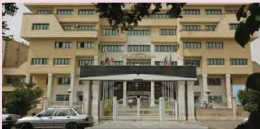
شکل ۳۷-۶ اداره کل آموزش و پرورش استان فارس

از نظر مراکز آموزش عالی نیز تعداد دانشجویان استان در سال ۱۳۵۷ تنها ۶۴۷۰ نفر بوده است که این تعداد در سال ۸۷-۱۳۸۶ به ۱۷۴,۰۰۰ دانشجوی دانشگاه دولتی و آزاد اسلامی افزایش یافته است. تأسیس دانشگاه صنعتی شیراز و تبدیل آن به دو بخش دانشگاه شیراز و دانشگاه علوم پزشکی، تأسیس دانشگاه دولتی در فسا، جهرم و ... تأسیس ۱۳ آموزشکده فنی در نقاط مختلف استان، تأسیس دانشگاه مجازی شیراز و تأسیس دوره دکتری در رشته‌های مختلف در دانشگاه شیراز، بخشی از اهداف علمی استان بوده است.