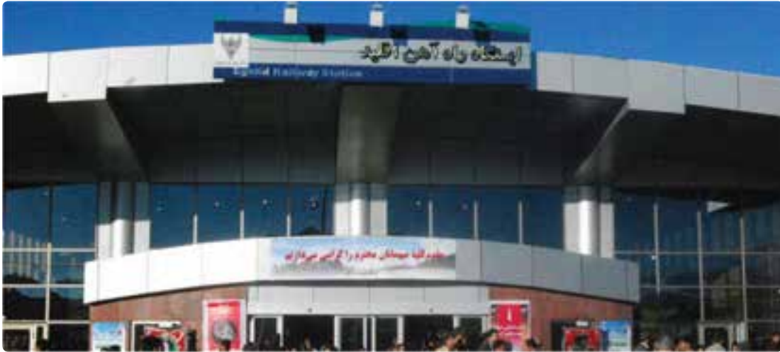
شکل ۲۸-۶- ایستگاه راه آهن اقلید

اگر بخواهیم پرافتخارترین طرح عمرانی استان فارس را در سال‌های اخیر نام ببریم، بی شک راه‌اندازی قطار شیراز - اصفهان است که کلیه مراحل مطالعه - برنامه‌ریزی و اجرای آن در زمان جمهوری اسلامی انجام شده است.