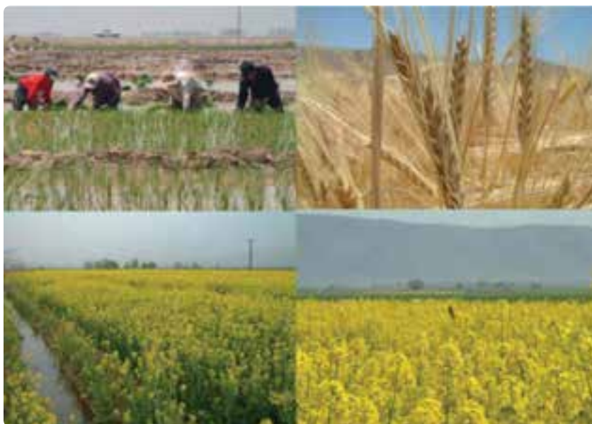
شکل ۲-۶- توسعه کشاورزی