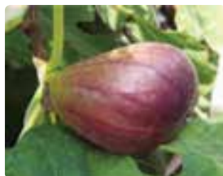
شکل ۶-۶ انجیر (اول)