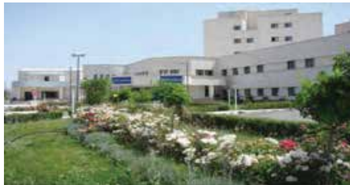
شکل ۸-۶ - بیمارستان امام خمینی اردبیل