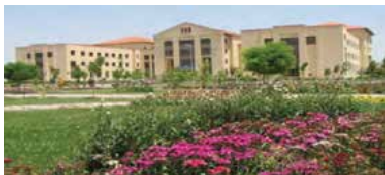
شکل ۶-۷- دانشگاه محقق اردبیلی