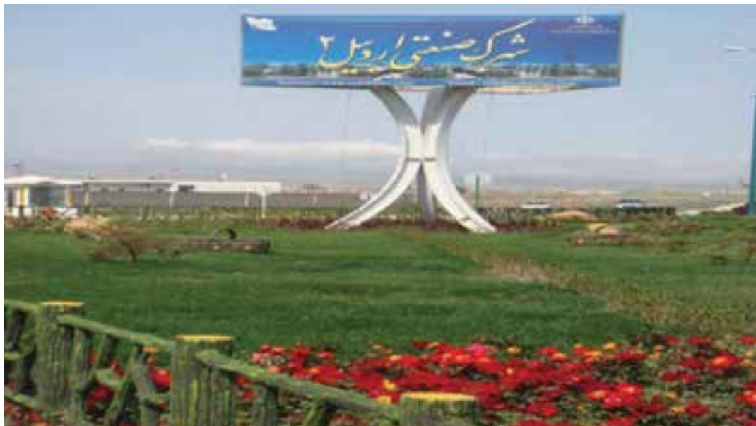
شکل ۳-۶- شهرک صنعتی اردبیل ۲

۲- شهرک صنعتی اردبیل (۲): عملیات اجرایی این شهرک از سال ۱۳۸۰ در زمینی به مساحت ۶۰۰ هکتار (امکان توسعه تا ۷۰۰ هکتار) آغاز شد. این شهرک که بزرگ‌ترین شهرک صنعتی استان است در فاصله ۱۳ کیلومتری بزرگراه اردبیل- آستارا واقع شده است همجواری این شهرک با گمرک و فرودگاه و نیز واقع شدن در مسیر بزرگراه اردبیل به تهران و نداشتن محدودیت‌های زیست محیطی برای استقرار واحدهای صنعتی مختلف از مزایا و جاذبه‌های این شهرک می‌باشد.