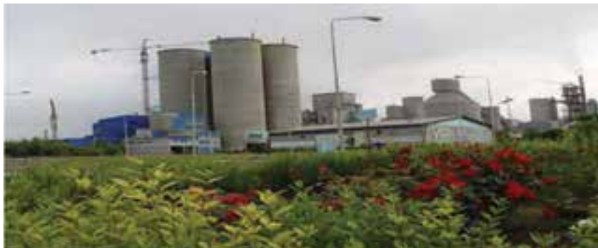
شکل ۱-۶- کارخانه سیمان آرتا اردبیل

پس از انقلاب شکوهمند اسلامی ایران نیز به‌علت مشکلات سیاسی مخصوصاً جنگ تحمیلی، تحول عمده‌ای در صنعت استان رخ نداد. اما پس از استان شدن اردبیل و با شروع برنامه اول توسعه اقتصادی، مسئولان منطقه در صدد توسعه صنعتی استان برآمدند و با تشکیل ادارات کل اقتصادی مخصوصاً اداره کل صنایع و معادن و شرکت شهرک‌های صنعتی، رغبت و علاقه برای سرمایه‌گذاری افزایش یافت به طوری که با راه اندازی واحدهای صنعتی بزرگ در کنار واحدهای صنعتی و معدنی کوچک، کارخانجاتی مانند: سیمان، لاستیک، خودرو، شیرخشک صنعتی، رنگ و ابزار آلات صنعتی، ریسندگی، پنبه پاک کنی، فولاد، نئوپان سازی، قطعات خودرو، ... احداث و به مرحله بهره‌برداری رسید.