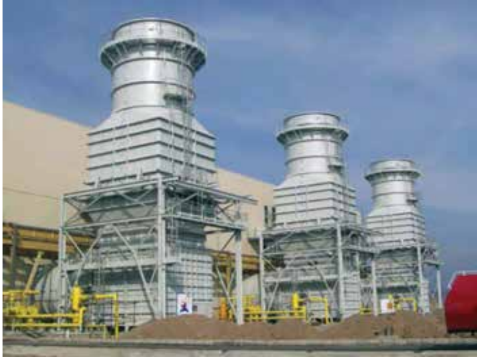
شکل ۵-۶- نیروگاه گازی سبلان اردبیل واقع در کیلومتر ۲۵ جاده اردبیل به مشکین شهر