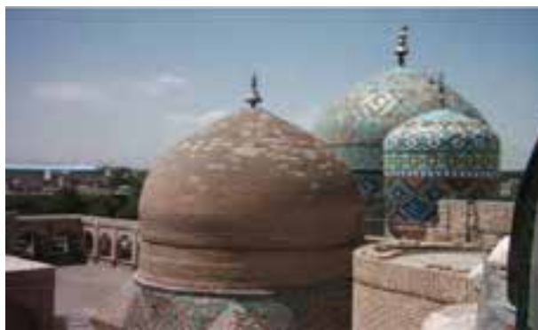
شکل ۱۱-۶ بقعه شیخ صفی در اردبیل