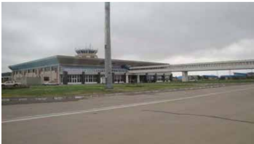
شکل ۴-۶- فرودگاه اردبیل