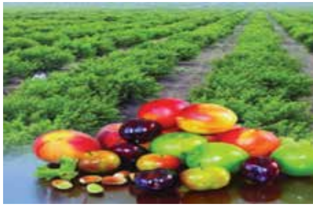
شکل ۱۴-۶- محصولات باغداری کشت و صنعت مغان

امروزه استان اردبیل با شرایط خاص جغرافیایی، تنوع محیطی، شرایط آب و هوایی، جاذبه‌های توریستی، قابلیت کشاورزی و باغداری از توان بالایی در مسیر توسعه فضایی یکپارچه برخوردار است. از طرفی همجواری با کشور جمهوری آذربایجان و ایجاد بازارچه مرزی و گمرک، ارتباط کشورمان ایران را با منطقه قفقاز و اروپا تسهیل کرده و جایگاه استان را در سطح فنی و بین‌المللی بهبود بخشیده است. با وجود قابلیت‌ها و مزیت‌های یاد شده، استان ما مسائل و مشکلاتی به شرح زیر دارد: - مرزی بودن استان و داشتن فاصله زیاد از مناطق مرکزی و توسعه یافته‌تر کشور - کوهستانی بودن استان و به تبع آن ضعف پیوند فیزیکی، اقتصادی و اجتماعی - طولانی بودن دوره سرما و یخبندان - عدم تجهیز فرودگاه‌های اردبیل و پارس آباد - نبود شبکه راه آهن