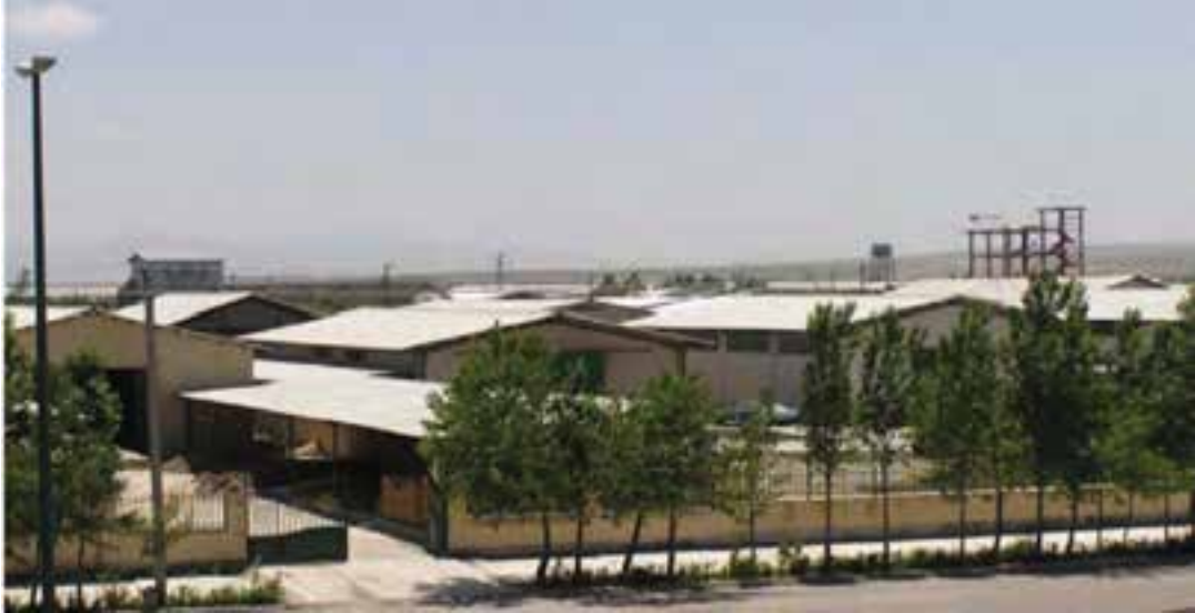
شکل ۲-۶- شهرک صنعتی اردبیل ۱

۲- شهرک صنعتی اردبیل (۲): عملیات اجرایی این شهرک از سال ۱۳۸۰ در زمینی به مساحت ۶۰۰ هکتار (امکان توسعه تا ۷۰۰ هکتار) آغاز شد. این شهرک که بزرگ‌ترین شهرک صنعتی استان است در فاصله ۱۳ کیلومتری بزرگراه اردبیل- آستارا واقع شده است همجواری این شهرک با گمرک و فرودگاه و نیز واقع شدن در مسیر بزرگراه اردبیل به تهران و نداشتن محدودیت‌های زیست محیطی برای استقرار واحدهای صنعتی مختلف از مزایا و جاذبه‌های این شهرک می‌باشد.