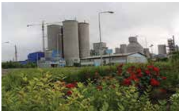
شکل ۱۰-۶ کارخانه سیمان در اردبیل

تصاویر پایین نشانگر بخشی از توانمندی‌های استان اردبیل در زمینه‌های کشاورزی و گردشگری و صنعتی و باغداری است. به نظر شما هر تصویر مربوط به کدام توانمندی‌های استان است؟ آیا می‌دانید استان اردبیل با وجود چنین توانمندی‌ها، با کدام موانع و محدودیت‌هایی در جهت توسعه مواجه است؟ این درس ضمن شرح وضعیت موجود، شما را با چشم انداز و برنامه‌های آتی توسعه استان آشنا می‌سازد.