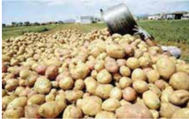
شکل ۱۳-۶- محصول سیب زمینی در دشت اردبیل