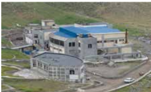
شکل ۱۲-۶ آبگرم قینرجه در مشکین شهر