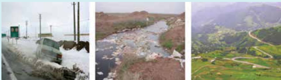
شکل ۱۵-۶- نمونه‌هایی از محدودیت‌ها و مشکلات توسعه در استان

در شکل ۱۵-۶ نمونه‌هایی از مشکلات و محدودیت‌های استان به تصویر کشیده شده است. هر تصویر کدام یک از مشکلات و محدودیت‌های استان را نشان می‌دهد؟ راهکارهای خود را برای حل این مشکلات بیان کنید.