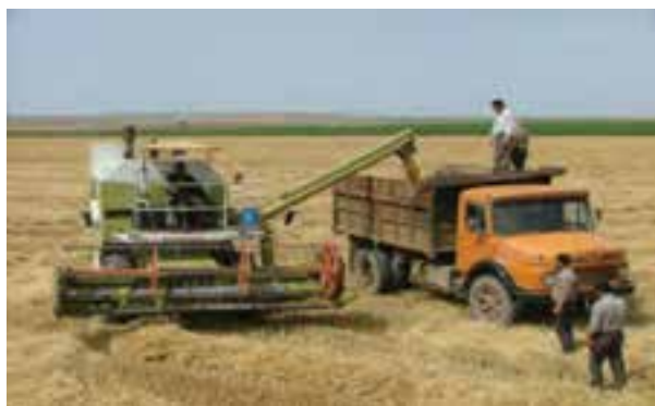
شکل ۹-۶ برداشت محصول گندم در جلگه مغان