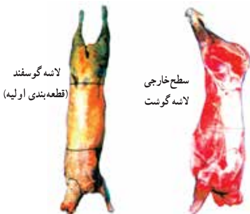
شکل ۱-۹- لاشه‌ی گوشت

گوشت عبارت است از مجموعه‌ای از بافت‌های عضلانی، چربی، پیوندی و استخوانی که از لاشه حیوانات یا دام‌های گوشتی به دست می‌آید. این تعریف معمولاً اندام‌های خوراکی دام (مانند کبد، کلیه‌ها، قلب و زبان) را شامل می‌گردد.