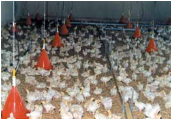
شکل ۱-۵ پرورش جوجه گوشتی در روی بستر

در پرورش طیور تخمگذار دو دوره پرورشی دیده می‌شود، دوره اول به نام پرورش پولت (Pullet) که در این دوره جوجه‌های یکروزه را تا حدود سه ماهگی روی بستر معمولی و یا کف توری نگهداری می‌کنند و واکسیناسیون واکسنهای ضروری منطقه در این دوره انجام می‌گیرد، پس از اتمام این دوره پرورش مرغان تخمگذار شروع می‌شود که از سه ماهگی تا آخر دوره تخمگذاری ادامه دارد، مرغان تخمگذار روی بستر معمولی با لانه‌های تخمگذاری و یا با سیستم پرورش در قفس نگهداری می‌گردند.