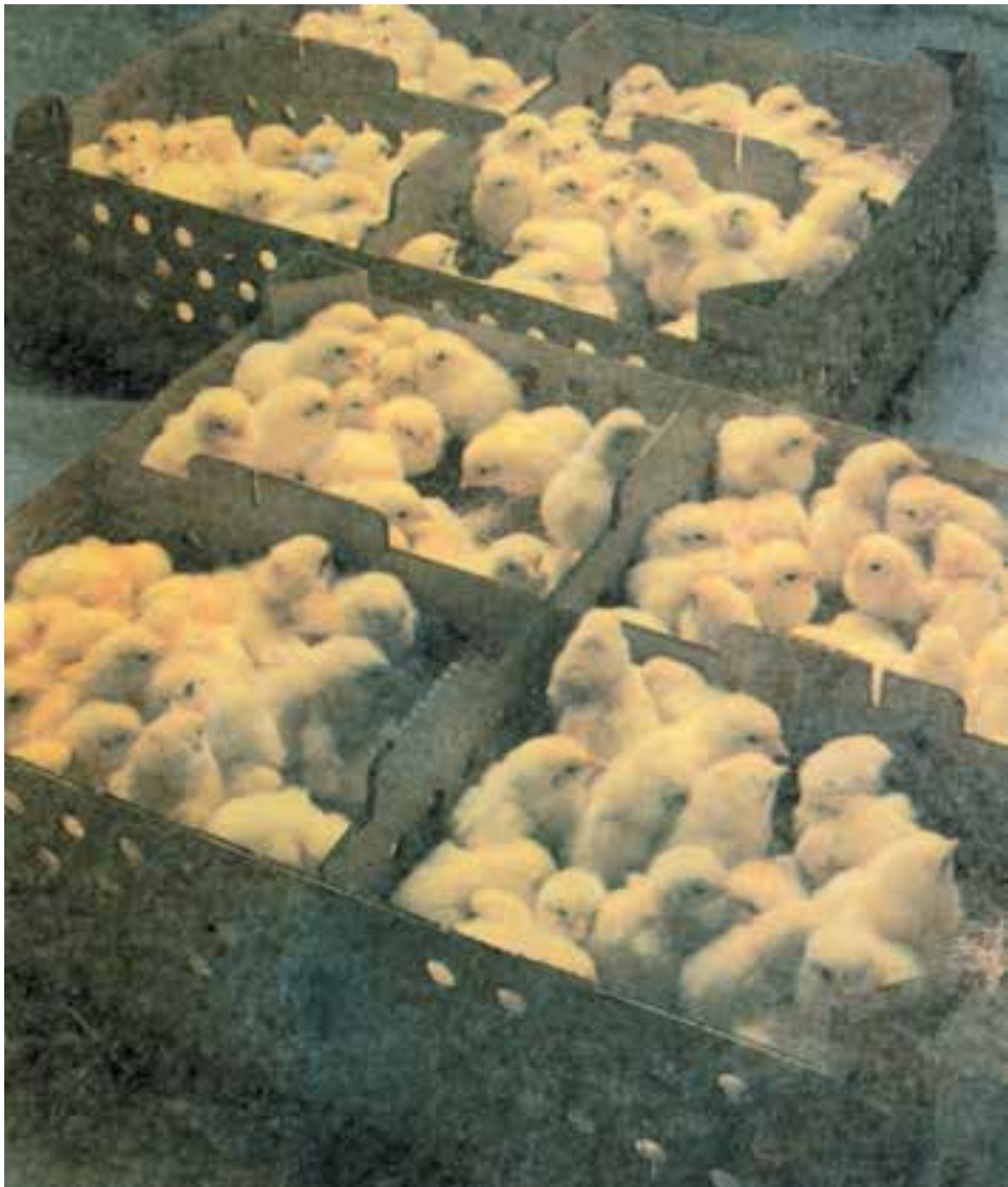
شکل ۱۰-۵ جوجه های حاصل از جوجه کشی مصنوعی (جوجه یکروزه)

جوجه کشی مصنوعی به مرغ کرج ندارد و در هر فصل از سال می توان عملیات جوجه کشی را انجام داد و در هر نوبت جوجه کشی با در نظر گرفتن ظرفیت دستگاه از تعداد بیشتری تخم مرغ نسبت به جوجه کشی طبیعی استفاده می گردد، ضمناً کنترل بیماریها، کنترل فاکتورهای حرارت، رطوبت و عمل چرخش تخم مرغها با دقت بیشتری صورت می گیرد، موارد ذکر شده از مزایا و برتریهای جوجه کشی مصنوعی می باشد ولی به این نکته نیز باید توجه داشت که در این نوع جوجه کشی آلودگی یک تخم مرغ به راحتی سبب آلودگی همه تخم مرغهای موجود در ماشین می گردد. چرا؟