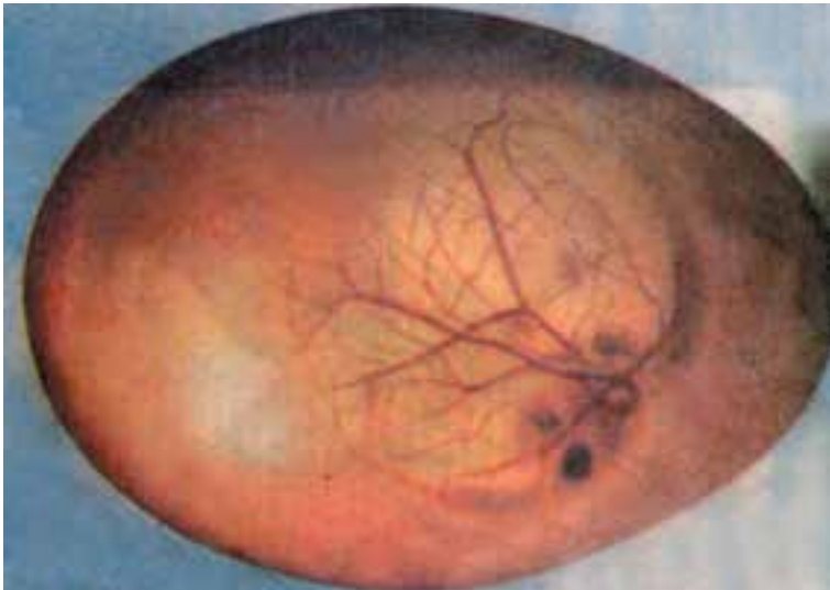
شکل ۸ - ۵ تخم مرغ نطفه‌داری که جنین درون آن در حال رشد می‌باشد.

برای این که از تخم مرغ نطفه‌دار پس از طی مدت زمانی جوجه به دنیا بیاید، مرغ کرج اعمالی را به طور غریزی بر روی آن انجام می‌دهد یعنی با حرارت بدن خود حرارت لازم برای رشد نطفه و جنین داخل تخم مرغ را فراهم و با رطوبت بدن خود مانع از تبخیر مایعات داخل تخم مرغ می‌گردد و همچنین مرغ کرج هر چند ساعت یکبار تخم مرغها را این طرف و آن طرف می‌چرخاند که این عمل مانع از حرکت جنین به طرف سطح و جلوگیری از توقف رشد آن خواهد شد. زمانی که بجای خوردن دانه و آب از روی تخم مرغها بلند می‌شود عمل تهویه جهت رشد جنین صورت می‌گیرد.