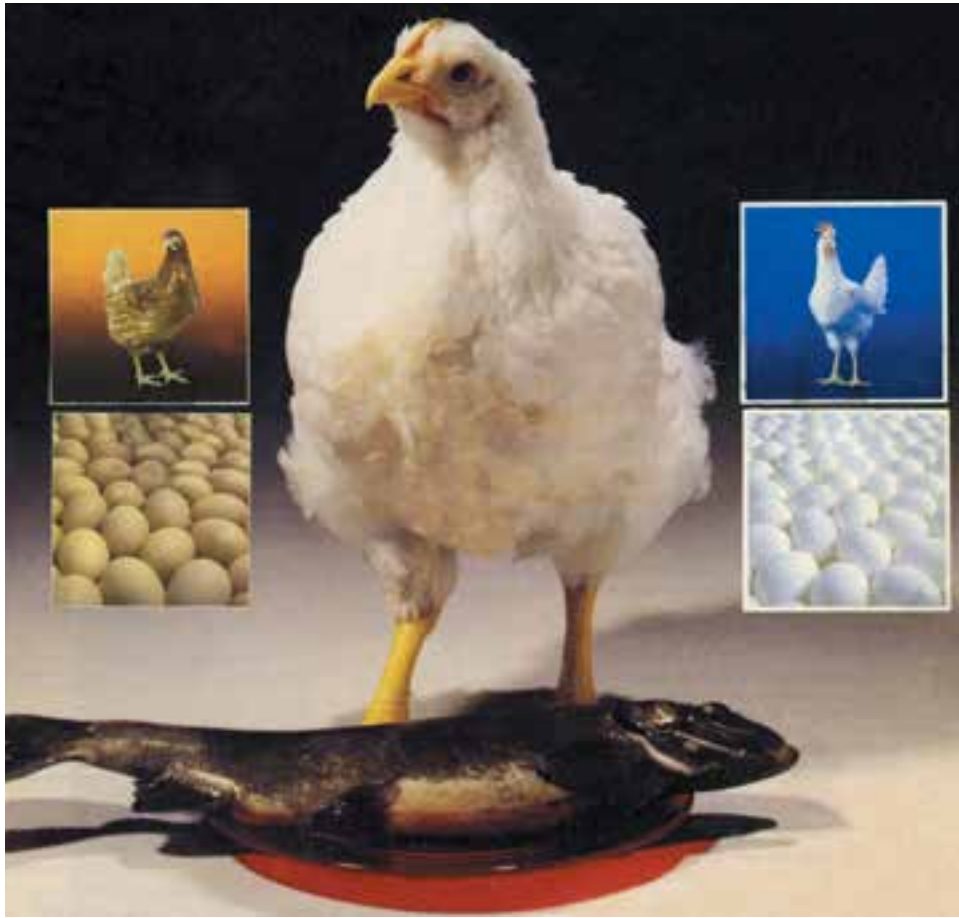
شکل ۴-۵ از تصویر چه مطالبی را می‌توانید درک کنید، به تفاوت فرم و قالب بدن مرغ گوشتی با تخمگذار بنگرید.

نسبت به بیماریها، فرم بدن، تلفات کم و توقف در تخمگذاری (تولک رفتن ...) مدنظر قرار گیرد.