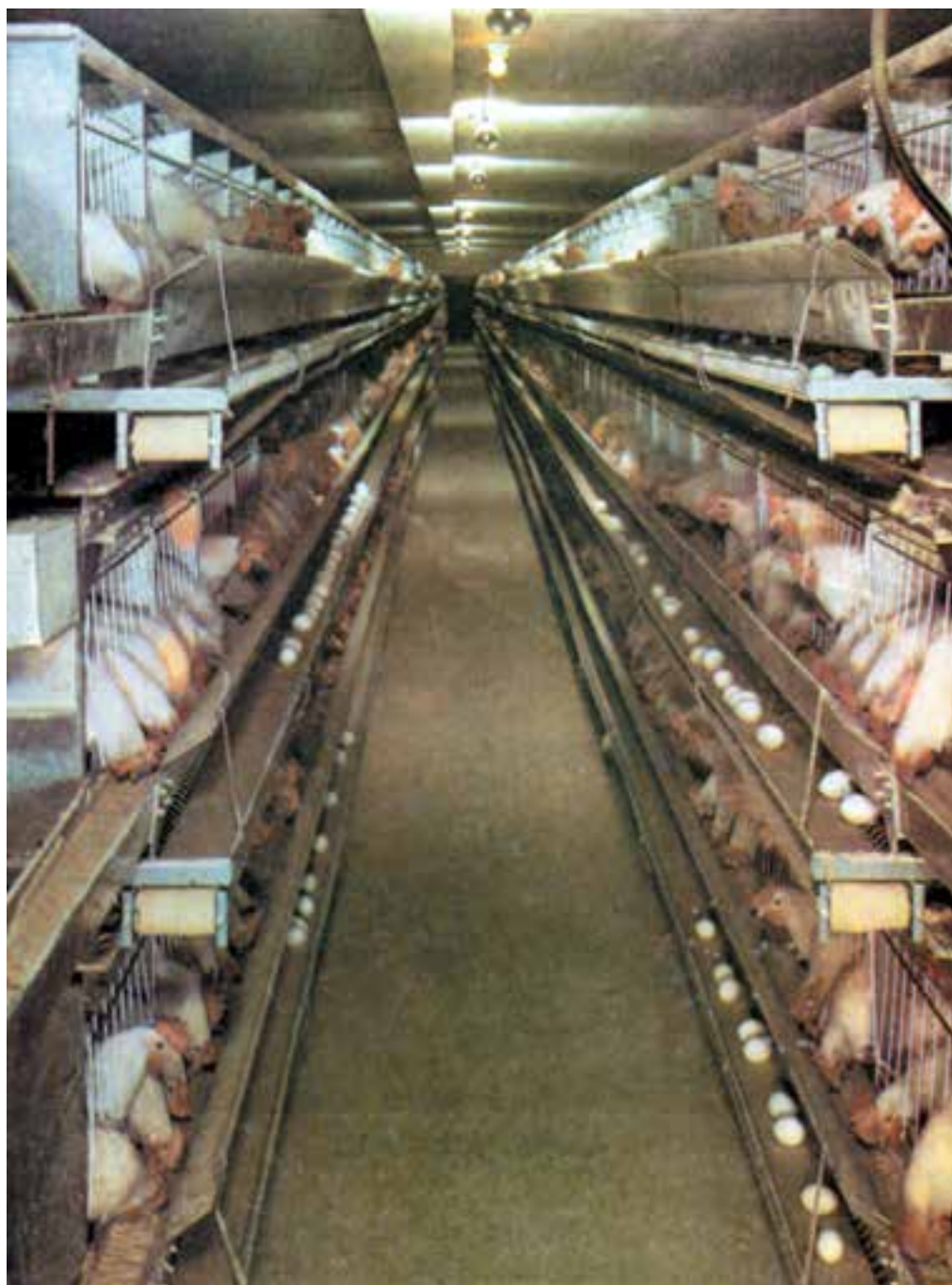
شکل ۳-۵ پرورش طیور در قفس