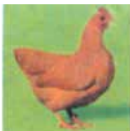
پلیموت روک نخودی