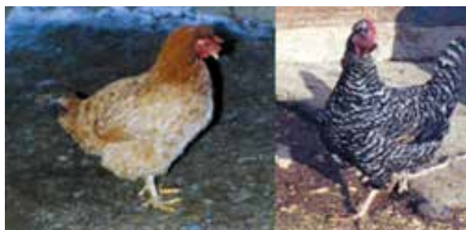
شکل ۷-۵ دو نمونه از مرغان دو بهره بومی روستایی ایران

با چه فاکتورهایی می‌توان نژادها را از همدیگر متمایز ساخت: در این مورد می‌توان گفت نوع، فرم و قالب بدن، تفاوت در شکل تاج، رنگ پر، شکل و اندازه ریش از جمله فاکتورهایی هستند که به‌وسیله آنها می‌توانید تفاوت‌های ظاهری بین نژادهای مختلف را دریابید. برای فهم این مطلب مجدداً به تصاویر نژادهای مرغان نگاه کنید و اگر می‌توانید با استفاده از تصاویر نژادهای گوشتی، تخمگذار و دو بهره را مشخص کنید. به‌عنوان مثال لگهورن تخمگذار، براهما گوشتی، و پلیموت روک دو بهره می‌باشند.