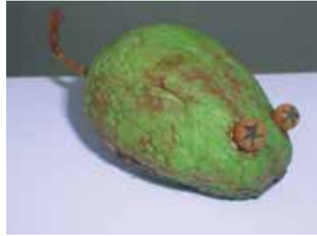
نمونه‌هایی از شکل‌سازی با مواد موجود در طبیعت