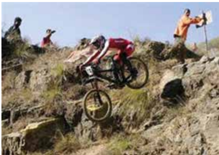
شکل ۲۶ - ۸ - الف - مسابقات کوهستان