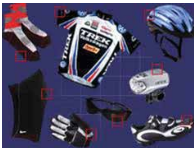
شکل ۲۲- ۸- وسایل دوچرخه سواری

از انواع کوهستان برای مسیرهای پرفراز و نشیب استفاده می‌شود. این نوع از دوچرخه دارای لاستیک‌های پهن و بدنه‌ای مستحکم است که به دلایل بالا بردن استقامت در مسیرهای کوهستانی و غیرصاف می‌باشد. نوع شهری معمولاً برای استفاده در شهر و جنگل کاربرد دارد. در هنگام دوچرخه سواری از وسایل ایمنی شامل کلاه، زانوبند و آرنج‌بند باید استفاده کرد. آچارکشی منظم، تنظیم باد لاستیک‌ها، جعبه ابزار و وسایل کمک‌های اولیه از ملزومات دیگر دوچرخه سواری است. شب‌نما و چراغ‌های چرخ و قمقمه آب و مقداری خرما نیز توصیه می‌شوند.