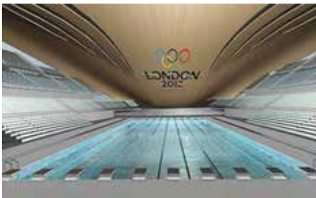
شکل ۱۸-۸ - خطوط شنا

استخرهای شنای عمومی با رعایت عمق و فضای لازم و تأمین نظارت کامل فقط مجاز به نصب تخته‌های پرشی تا ارتفاع ۳ متر از سطح آب می‌باشند. استخر واترپلو برای مسابقات رسمی و غیر رسمی واترپلو طراحی و تجهیز شده است. بازی واترپلو اغلب در