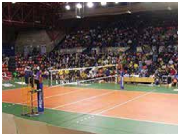
شکل ۲-۸- تور و پایه والیبال

در این ورزش تور و توپ از ابزار اصلی هستند. طول تور والیبال 9/5 و عرض آن ۱ متر است و از سوراخ‌های مربع شکل به ضلع 10 سانتی‌متر تشکیل شده است. پارچه‌ای از جنس کتان به ضخامت ۵ سانتی‌متر به لبه بالایی تور دوخته شده است. ارتفاع تور از مرکز زمین 2/43 متر است. هر دو انتهای تور از زمین به یک فاصله هستند. ارتفاع تور برای خردسالان و