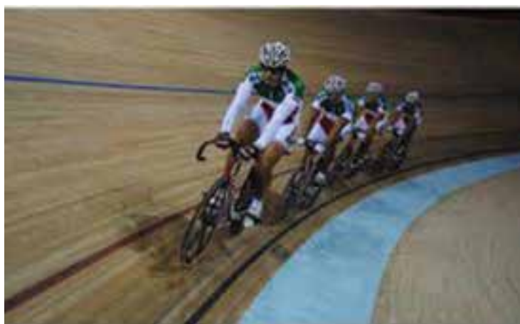
شکل ۲۵- ۸- الف- پیست دوچرخه سواری