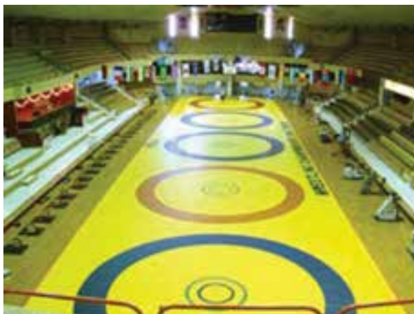
شکل ۱۲-۸ - سالن مسابقات کشتی و تشک کشتی