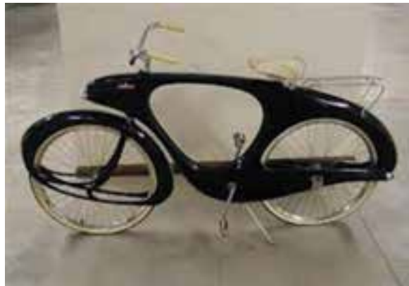
شکل ۱۹ - ۸ - دوچرخه غیر معمول