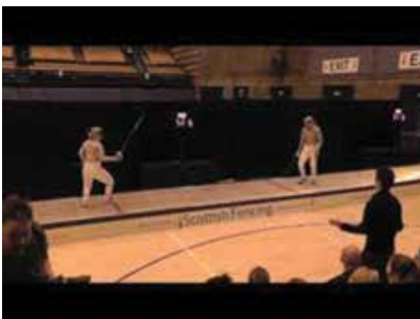
شکل ۱۴-۸ - سالن شمشیر بازی