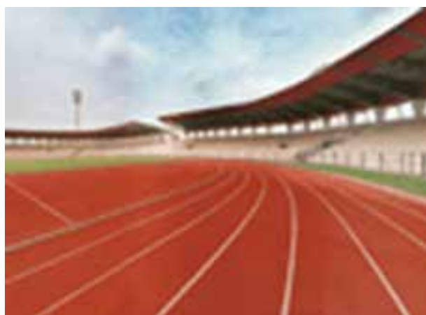
شکل ۲۷- ۸- پیست دو و میدانی

دو و میدانی : دو و میدانی از ورزش‌های محبوب بازی‌های المپیک است که شامل دویدن، پریدن و پرتاب کردن می‌باشد. انواع میدانی‌ها شامل : پرتاب‌ها : پرتاب نیزه، وزنه، دیسک و چکش (آقایان) است.