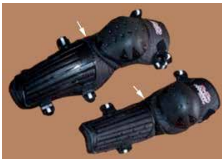
شکل ۲۳- ۸- زانوبند

اولین مسابقه جهانی دوچرخه سواری در ماه مه سال ۱۹۰۱ با حضور بیست هزار تماشاگر انجام شد و در سال ۱۹۰۳ اولین مسابقه تور دور فرانسه انجام شد رشته‌های مسابقات دوچرخه سواری به صورت پیست، جاده و کوهستان (دان هیل و کراکس کانتري X.C) برگزار می‌شود.