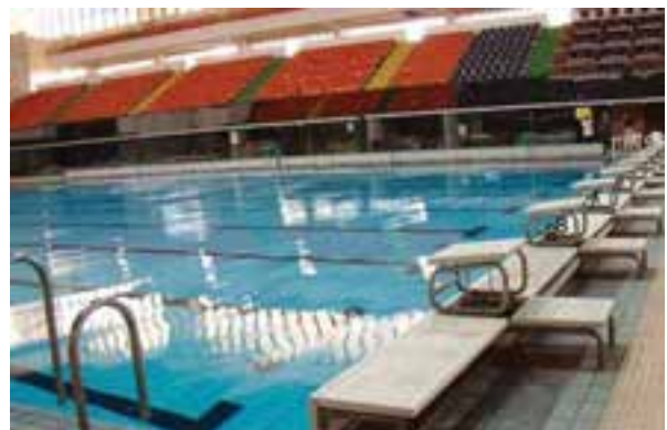
شکل ۱۷-۸ - سکوی استارت شنا