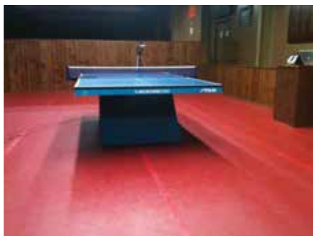
شکل ۱۰-۸- تور و میز تنیس روی میز