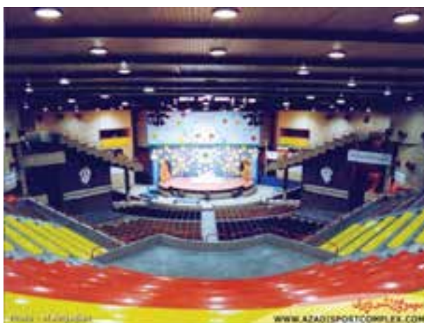
شکل ۱۳-۸ - سالن وزنه‌برداری