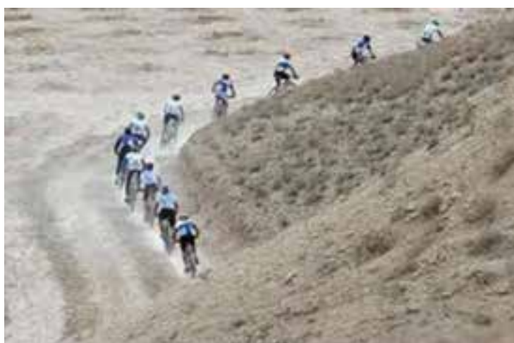
شکل ۲۶- ۸- ج- مسابقات کوهستان