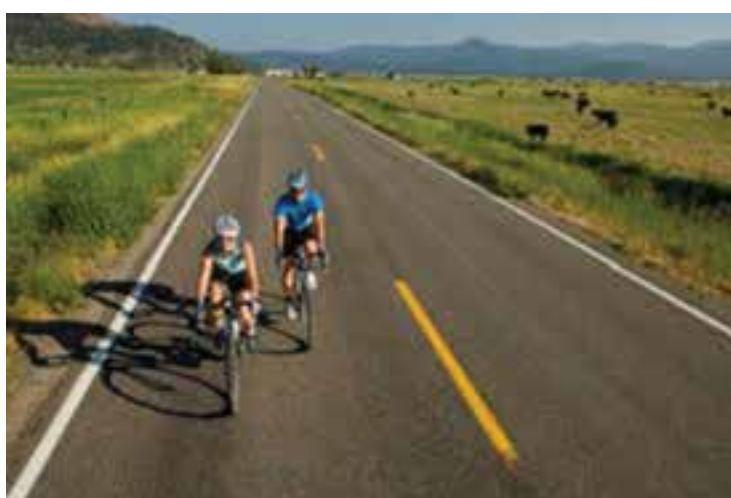
شکل ۲۵- ۸- ب- جاده