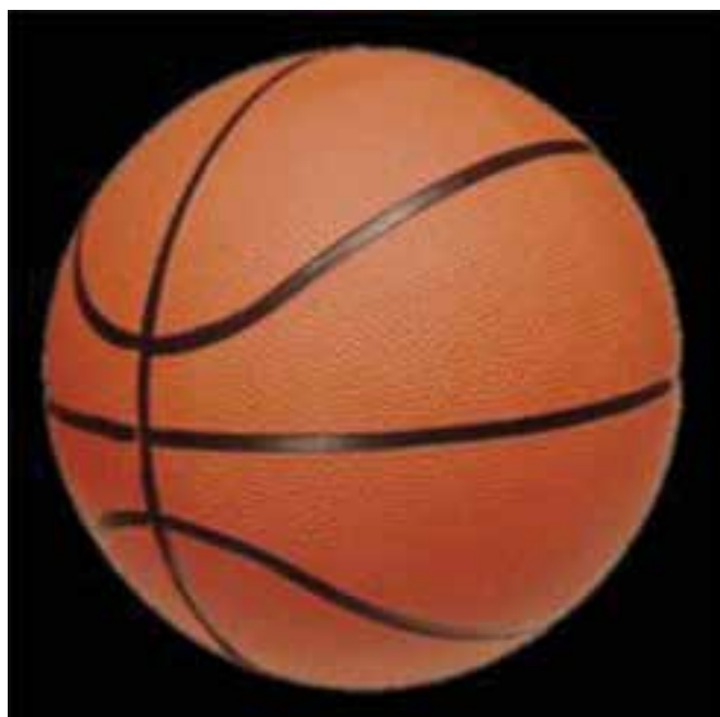
شکل ۵-۸- توپ بسکتبال

در فاصله ۳۰ سانتی متری قاعده تخته به آن متصل می شود. ارتفاع توری که به شکل سبد به حلقه بسکتبال متصل می شود، ۳۰ سانتی متر است. جنس حلقه فولادی می باشد و حداقل ۱/۶ سانتی متر و حداکثر ۲ سانتی متر ضخامت دارد. قطر داخلی حداقل ۴۵ سانتی متر و حداکثر ۴۵/۷ سانتی متر است. توپ بسکتبال از چرم، پلاستیک و یا مواد مصنوعی است. محیط توپ نباید کمتر از ۷۵ سانتی متر و بیش از ۷۸ سانتی متر باشد. وزن توپ باید حداقل ۵۶۷ گرم و حداکثر ۶۵۰ گرم باشد. اگر توپ به میزان مناسب باد شده باشد، وقتی آن را از ارتفاع ۱/۸۰ متر رها کنیم، پس از برخورد با زمین بازی تا ارتفاع ۱/۲۰ (حداقل) یا ۱/۴۰ (حداکثر) بالا می آید. عرض باندهای مشکی روی توپ نباید از ۶۳۵/۰ سانتی متر تجاوز کند.