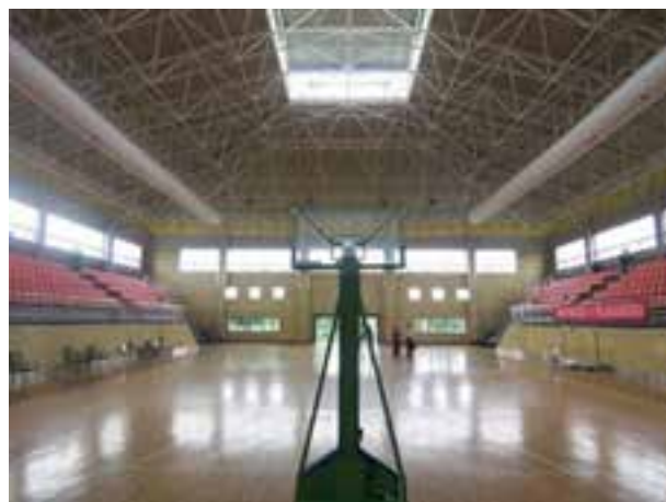
شکل ۴-۸- زمین بسکتبال بدون بازیکن

یک ورزش گروهی و با استفاده از یک توپ است. هدف هر تیم از انجام بازی کسب امتیاز از طریق انداختن توپ در داخل حلقه تیم مقابل می‌باشد. در ابتدا تعداد بازیکنان هر تیم 9 نفر و سپس به 7 نفر تقلیل یافت و بالاخره تعداد به 5 نفر در زمین کاهش و تثبیت شد. بسکتبال در آمریکا طراحی شد و در حال حاضر در چهار دوره 10 دقیقه‌ای (بین المللی) یا 12 دقیقه‌ای (ان - بی - ای) انجام می‌شود.