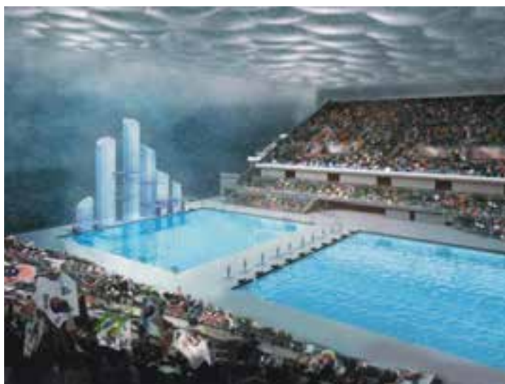
شکل ۲ - ۹ - شنا با جمعیت زیاد