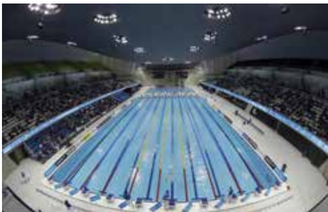
شکل ۱۶-۸ - استخر شنا

به مجموعه‌ای از ابنیه، لوازم، تجهیزات و امکانات، اطلاق می‌شود که هدف، آبتنی و شناکردن، شیرجه زدن، آموزش شنا و دیگر مقاصد تفریحی ایجاد شده است. استخرهای شنا بر حسب نوع فعالیت (آموزشی، تمرینی، مسابقه‌ای تفریحی و یا درمانی) تقسیم بندی شده و بر همین اساس دارای ویژگی‌هایی خاص هستند.