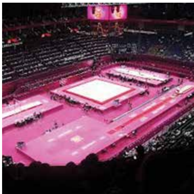
شکل ۱۵-۸ - تجهیزات ژیمناستیک مردان

عبارت است از یک سری حرکات منظم با اصول و روش طرح شده که ارائه آن اثر مخصوص روی ارگان‌های بدن دارد. رقابت‌های این ورزش به صورت انفرادی و تیمی برگزار می‌شود. هر تیم مرکب از ۶ نفر می‌باشد. مسابقه ژیمناستیک به دو صورت اجباری و اختیاری برگزار می‌گردد. مواد مسابقه مردان عبارتند از حرکات زمینی، خرک، دارحلقه، پرش خرک، بارفیکس. مواد مسابقه بانوان عبارتند از: حرکات زمینی، پرش خرک، چوب موازنه و بارفیکس.