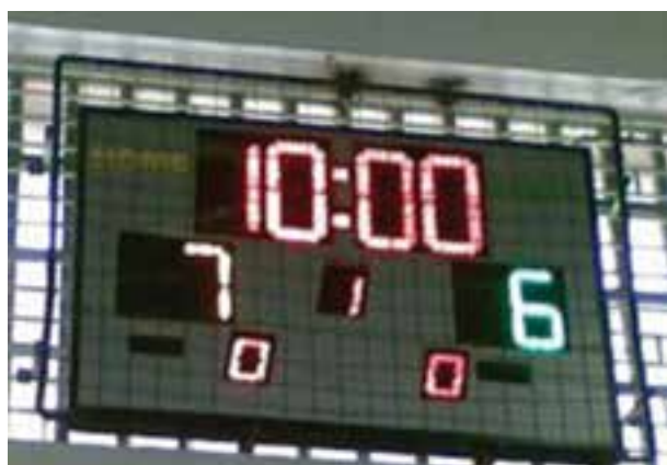
شکل ۱-۸- تابلو ثبت امتیازات در والیبال

والیبال یک ورزش گروهی است که با ترکیب بازی‌های بسکتبال، تنیس و هندبال ایجاد شده است و برای افرادی که تمایل به تحرک کمتری دارند، ابداع گردیده است. تور اولیه‌ای که برای این بازی در نظر گرفته شده بود با ایده از بازی تنیس ۲ متر انتخاب شد و با توپ بسکتبال شبیه به بازی هندبال انجام شد. این ورزش تا سال ۱۹۰۰ توپ مخصوصی برای خود نداشت و با هر تویی (از جمله توپ بسکتبال) آن را بازی می‌کردند. هدف هر تیم آن بود که توپ را در زمین حریف فرود بیاورد و در این راه توپ در دست یاران خود می‌چرخد. در سال ۱۹۱۲ امتیازهای هر تیم ۲۱ تعیین شد و ارتفاع تور نیز بیشتر شد. امروزه زمان بازی ۵