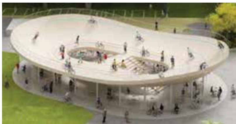
شکل ۲۵- ۸- ج- پیست دوچرخه سواری