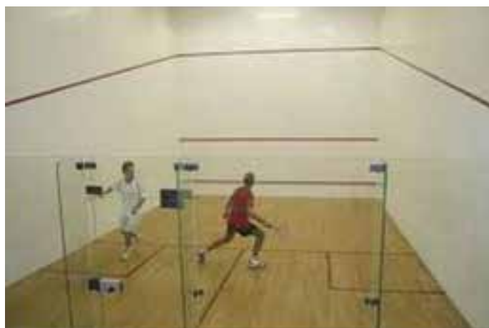
شکل ۱۱-۸- زمین اسکواش