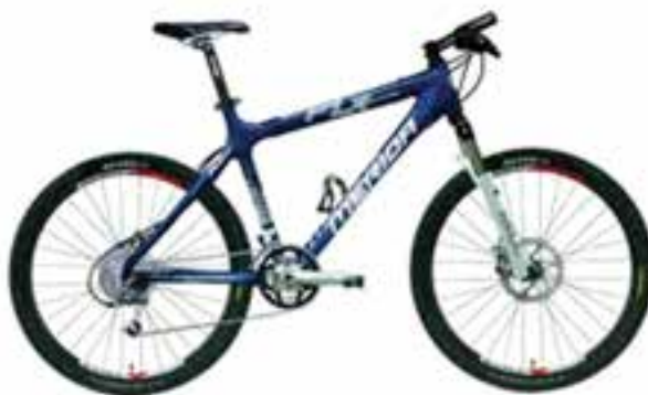
شکل ۲۱ - ۸ - دوچرخه کراس