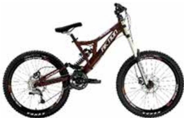
شکل ۲۰ - ۸ - دوچرخه کوهستان

انواع مختلفی از دوچرخه ارائه شده است که دو نوع مهم آن نوع کراس یا کورسی (۱) و کوهستان (۲). نوع دیگری که طرفداران زیادی هم دارد نوع BMX است که البته این نوع معمولاً برای تفریحات به اصطلاح غیر معمول (۳) نظیر حرکات نمایشی استفاده می شود. کراس یا کورسی معمولاً دارای چرخ های نازک و بدنه ای سبک است و برای شتاب بیشتر از آن استفاده می شود.