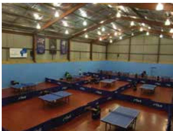
شکل ۹-۸- سالن تنیس روی میز، پارتیشن بندی