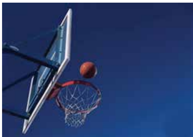
شکل ۶-۸- تور بسکتبال

متر بلندی دارند و از حلقه آویزان می گردند. تور باید ۱۲ حلقه برای اتصال به سبد باشد و لبه های تیز نداشته باشد و انگشت به داخل آن فرو نرود. بافت تور باید به گونه ای باشد که توپ پرتاب شده با مکث کوتاهی از آن عبور کند. باید دقت کرد که حریم های ایمنی تعیین شده خطوط اطراف زمین رعایت شود و پایه های تخته بسکتبال و موانع یا حفاظ های نزدیک به زمین توسط ابر، لایه های ضربه گیر لاستیکی و..... پوشانده شوند. از کف پوش های مناسب استفاده شود. از توپ های مناسب و استاندارد استفاده شده باشد.