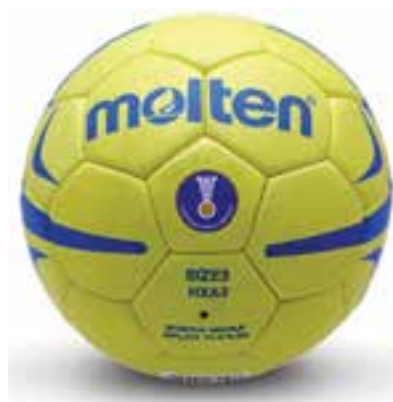
شکل ۸-۸ - توپ هندبال

لباس بازیکنان نیز شامل پیراهن یا تی‌شرت، که در پشت و جلو دارای شماره می‌باشند. شورت و جوراب و کفش ورزشی می‌باشد. بیشتر بازیکنان از زانو بند و محافظ آرنج هم استفاده می‌کنند. توپ هندبال از جنس چرم یا شبیه آن و از ۳۲ تکه تشکیل شده است. وزن آن برای مردان ۴۲۵ الی ۴۷۵ گرم و برای بانوان و نوجوانان ۳۲۵ الی ۴۰۰ گرم می‌باشد. رنگ توپ سفید، قرمز یا ترکیبات دیگری است. اندازه محیط توپ برای مردان ۵۸ تا ۶۰ سانتی‌متر و برای زنان ۵۴ تا ۵۶ سانتی‌متر می‌باشد. علاوه بر این توپ‌ها، از توپ اسفنجی پر شده (۳۵۰ گرم) و توپ مینی هندبال (۲۷۰ گرم) نیز استفاده می‌شود. ابعاد زمین قانونی هندبال ۲۰ × ۴۰ می‌باشد و طبق قوانین هندبال لازم است که در بیرون خطوط زمین، منطقه‌ای باشد که از طرفین (کناره‌های طولی) یک متر و از دو انتهای آن (کناره‌های عرضی) دو متر فاصله داشته