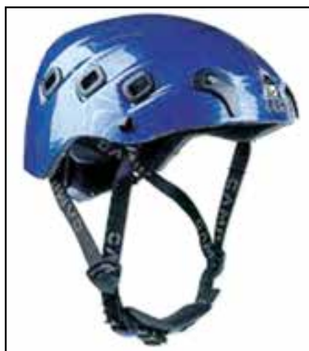
شکل ۲۴- ۸- کلاه دوچرخه سواری