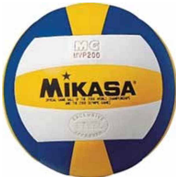
شکل ۳-۸- توپ والیبال

طول و یک متر عرض و ابعاد سوراخ‌های تور 10 \times 10 می‌باشد. طبق مقررات باید ۲۵ سانتی‌متر طرفین تور، خارج از خط باشد. بنابراین پایه‌ها باید طوری تعبیه شوند، که در زمان نصب تور این فاصله‌های دو طرف رعایت شود. پایه‌های والیبال به دو طریق ثابت می‌گردند، اول از طریق قرار گرفتن وزنه بر روی زوایای که در انتهای پایه‌ها قرار داده می‌شوند، دوم قرار دادن پایه‌ها در داخل گودال 40 سانتی‌متری که لوله‌ای با قطر بیشتر از پایه‌ها در آن تعبیه شده است. در روش اول پایه‌ها دارای ثبات زیادی نیستند، پس از آموزش و تمرین قابل بهره‌برداری هستند. در مسابقات رسمی و برای بزرگسالان پایه‌ها باید در داخل گودال‌ها قرار گیرند: ارتفاع تور از محل نصب آن بر روی پایه‌ها تا کف زمین برای مردان (بزرگسالان) 2/43 متر و برای زنان 2/24 متر برای جوانان (دختر) تا 18 سال 2/20 متر و در مینی والیبال