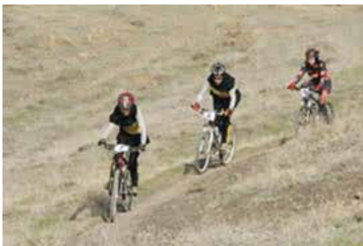
شکل ۲۶- ۸- ب- مسابقات کوهستان