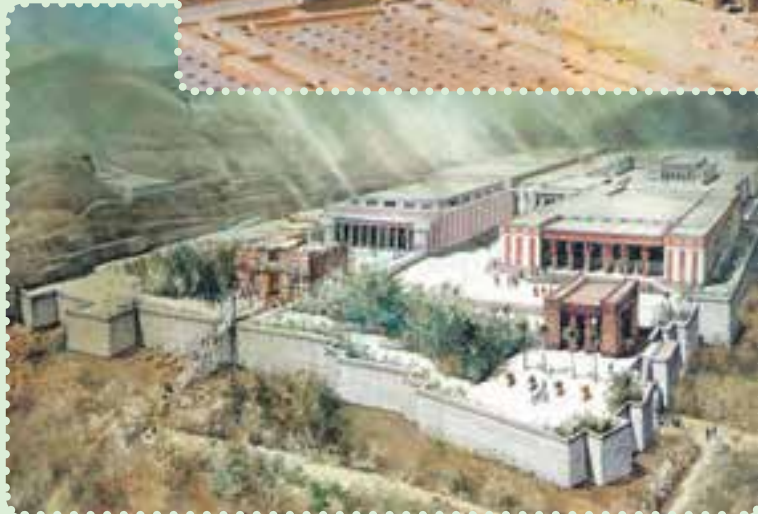
تخت جمشید و طرح خیالی آن

یافته است. ۱ برخی معتقدند، «ذوالقرنین» که در قرآن مجید ۲ به عنوان فرمانروایی نیک سیرت ستوده شده، همان کوروش پادشاه ایران است. ۳ با این که مؤسس دولت مقتدر هخامنشیان از سرزمین پارس