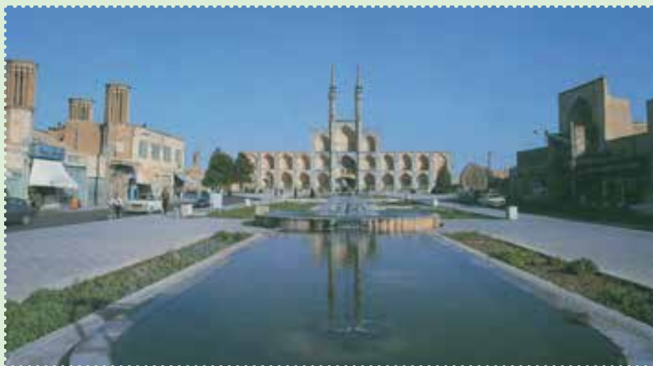
میدان تاریخی امیر چخماق در مرکز شهر یزد

با آن که مغولان در آغاز ویرانی های بسیاری به همراه آوردند، ولی بر اثر آشنایی با فرهنگ ایران و اسلام، از طریق آنان فرهنگ، هنر و تمدن ایران و اسلام رواج یافت. پس از پایان حکومت ایلخانان، حکومت های ملوک الطوائفی و محلی متعددی چون تیموریان، آل جلایر، آل مظفر، سرداران و آل کرت، اتابکان، قراقویونلوها و آق قویونلوها طی قرن های هشتم و نهم ق بر ایران حکومت کردند، اما هیچ کدام نتوانستند یکپارچگی ایران را حفظ کنند. سرانجام در سال ۹۰۷ق، حکومت صفوی