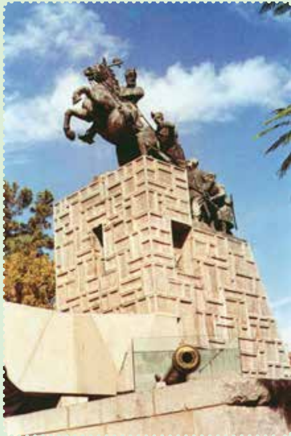
مجسمه و آرامگاه نادرشاه افشار در مشهد مقدس

توانست با شیوة حکومت داری توأم با ملاحظت، عدالت و رفاه نسبی، نام نیکی از خود بر جای بگذارد. ۱ وی تلاش کرد روابط خارجی ایران را که به دلیل هرج و مرج و نبود امنیت دچار اختلال شده بود، سامان بخشد، هم چنین در برابر گسترش فعالیت های بازرگانی انگلستان در ایران ایستادگی کرد ۲ و از منافع نامشروع و استعماری این دولت جلوگیری به عمل آورد.