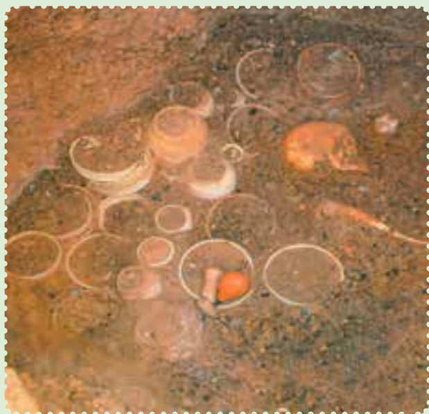
آثار یافت‌شده در شهر سوخته

پس از مدتی، زردشت که پیامبر ایران باستان است در میان ایرانیان ظهور کرد. او مردم را به پیروی از خدای یگانه که اهورامزدا نام داشت، دعوت کرد و مروج اندیشه، گفتار و کردار نیک بود. اعتقاد به سرای آخرت و جهان پس از مرگ، عقیده به آخرالزمان و ظهور یک منجی که حکومتی با عدل و داد و به دور از ناپاکی و ستم برپا خواهد کرد، از بنیان‌های استوار و اعتقادی ایرانیان بوده است که آن‌ها را از سایر ملل دوران باستان متمایز می‌ساخت. ۲