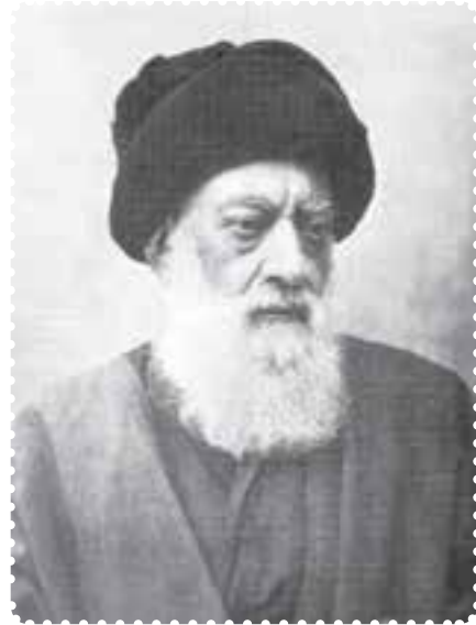
آیت الله طباطبایی

قیام شوند. در ادامه این جریان و همزمان با سفر سوم مظفرالدین شاه به اروپا، عده‌ای از بازرگانان در حرم حضرت عبدالعظیم (ع) تحصن کردند. ۱