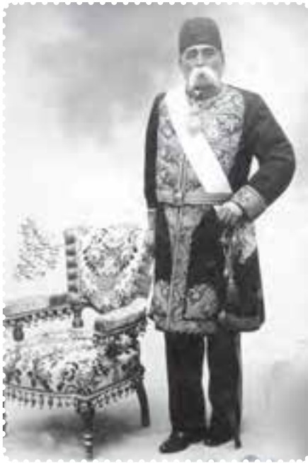
عبدالمجید میرزای عین الدوله

کشمکش بین طرفداران استبداد و عدالت خواهان، شدت گرفت. دولت به وحشت افتاد و با پا در میانی حاج میرزا ابوالقاسم امام جمعه، به طور موقت، قضیه فیصله یافت. حاج میرزا ابوالقاسم، داماد ناصرالدین شاه بود. او از جانب شاه به امامت جمعه تهران منصوب شده بود و از وی و دربار، پشتیبانی می کرد.