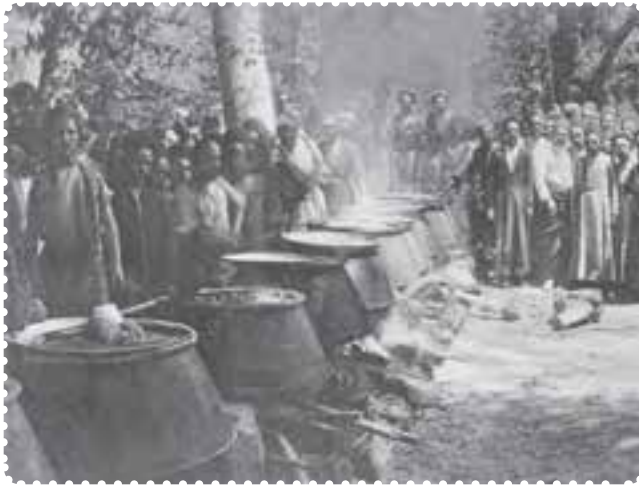
دیگ‌های غذا در سفارت انگلیس برای مشروطه خواهان

زیارتگاه‌ها و اماکنی صورت می‌گرفت که مورد احترام مردم قرار داشت و با باورهای دینی آن‌ها سازگار بود. مشروطه خواهان، بدون پناهندگی به سفارت انگلستان، می‌توانستند به خواسته‌های خود دست یابند. دولت انگلستان بر خلاف دولت روسیه که از دربار حمایت می‌کرد، به ظاهر