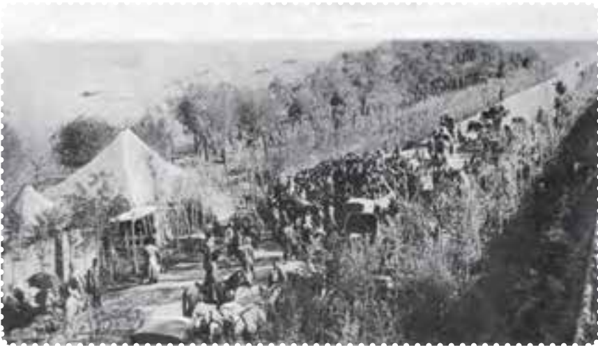
بازگشت علما از مهاجرت کبری

مظفرالدین شاه تسلیم خواسته‌های مردم شد. او عین الدوله را عزل کرد و فرمان تشکیل مجلس شورای ملی را در ۱۴ مرداد ۱۲۸۵ صادر کرد. هفت روز بعد، علما، با استقبال پرشکوه مردم، از قم بازگشتند. شهر چراغانی و جشن شادی به پا شد و در ۲۸ مرداد، اولین دوره مجلس شورای ملی با حضور نمایندگان تهران تشکیل گردید. عده‌ای از سیاستمداران مشروطه خواه، به تدوین قانون اساسی پرداختند. ۱ آنان با عجله آن را نوشتند و به امضای مظفرالدین شاه رساندند. شاه، ده روز پس از امضای قانون اساسی، درگذشت. به این ترتیب، کشور استبداد زده ما، با بهره‌گیری از اندیشه‌های سیاسی عالمان بزرگ دینی، کوشش فرهیختگان جامعه و مجاهدت مردم، به حکومتی دست یافت که می‌بایست براساس قانون اداره می‌شد.