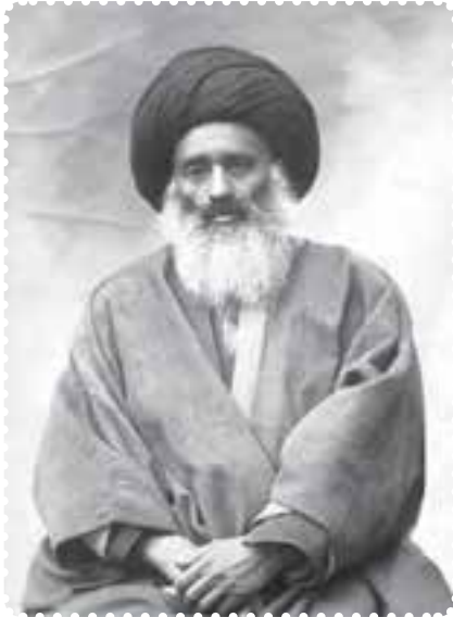
آیت الله بهبهانی