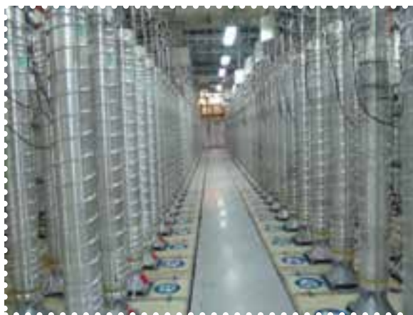
تأسیسات هسته‌ای نطنز

پیشرفت‌های عظیم در حوزه علم و فناوری از جمله دانش هسته‌ای، بیولوژی مولکولی و سلول‌های بنیادی، از دیگر دستاوردهای مهم انقلاب به‌شمار می‌روند. با وجود موانع، تهدیدها و تحریم‌های ناعادلانه کشورهای غربی، جمهوری اسلامی ایران با همت دانشمندان جوان ایرانی در ردف کشورها دارای فناوری هسته‌ای با کاربرد صلح‌آمیز قرار گرفته است. دست‌یابی به فناوری هسته‌ای از بزرگ‌ترین و افتخارآمیزترین دستاوردهای فنی و علمی انقلاب اسلامی است. چرخه کامل سوخت هسته‌ای، یعنی فرایند تبدیل اورانیوم طبیعی به انرژی هسته‌ای، دانشی بسیار پیچیده و پیشرفته است که تنها معدودی از کشورهای بزرگ صنعتی به آن دست یافته‌اند. با همت والا و عزم راسخ دانشمندان ایرانی