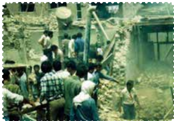
دزفول در پی یکی از حملات موشکی

در طول مدت جنگ شهرها، ارتش عراق موشک‌های دوربرد بسیاری به شهرهای ایران پرتاب کرد. ۱ به علاوه، استفاده از گازهای شیمیایی در جبهه‌های جنگ را در پیش گرفت. در چنین شرایطی، آمریکا رسماً به کمک نیروهای صدام آمد. اعزام ناوگان جنگی به خلیج فارس و هدف قرار دادن هواپیمای مسافربری ایران در تیرماه ۱۳۶۷، از جمله اقدامات ناجوانمردانهٔ آمریکایی‌ها بود.