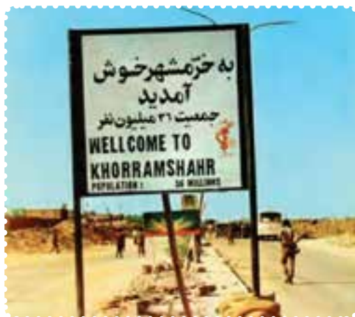
ورودی شهر خرمشهر در زمان جنگ تحمیلی

کمک به دفاع ملی دریغ نورزیدند. پس از چند هفته، دشمن متجاوز دریافت که خیال تصرف ایران، خام