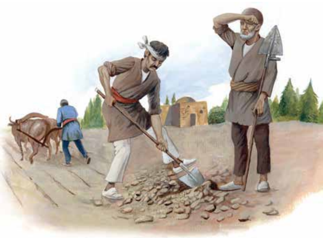
روستاییان عصر صفوی

روستاییان بیش از نصف جمعیت ایران را به خود اختصاص می‌دادند. این گروه تقریباً در ۴۰ هزار روستای بزرگ و کوچک زندگی می‌کردند. با وجود آنکه بیشتر دسترنج کشاورزان به جیب مالکان بزرگ و حاکمان و مأموران حکومتی می‌رفت، اما به گفته جهانگردان اروپایی، کشاورزان ایرانی در آن زمان از نظر تغذیه و پوشاک وضع بهتری نسبت به کشاورزان اروپایی داشتند. کوچ‌نشینان در حدود ۳۵ درصد کل جمعیت ایران بودند. مهم‌ترین آنها هفت قبیله تشکیل‌دهنده گروه قزلباشان بودند. گروه قزلباشان تا دوران پادشاهی عباس اول، قدرت سیاسی و نظامی زیادی داشتند، اما شاه عباس اول با انجام اصلاحاتی، از قدرت آنان کاست.