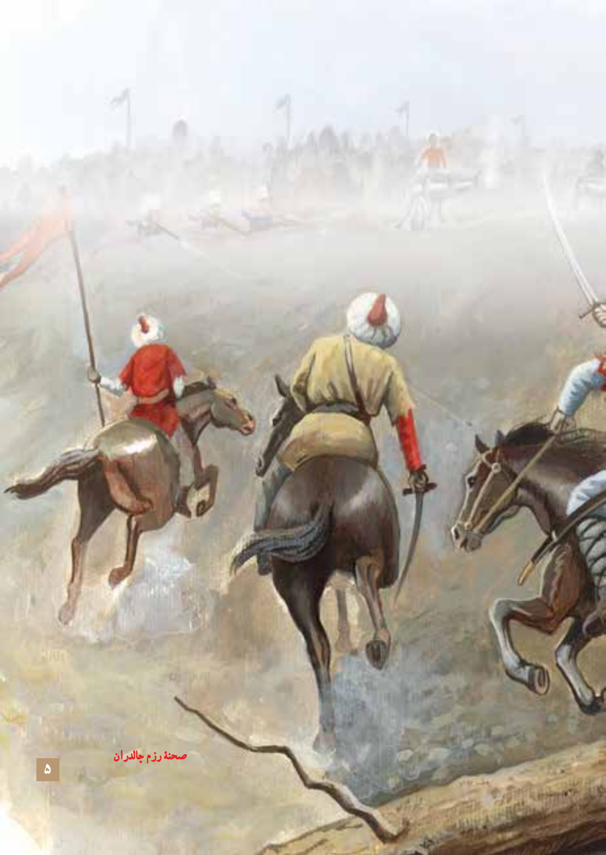
صحنه رزم چالدران