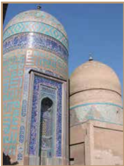
بقعه شیخ صفی‌الدین اردبیلی در شهر اردبیل

همزمان با تأسیس حکومت صفوی در ابتدای قرن ۱۰ ق، اوضاع سیاسی ایران بسیار آشفته