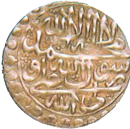
نمونه‌ای از سکه‌های عصر صفوی

مالیات اصلی‌ترین منبع درآمد حکومت بود که از کشاورزان و دامداران (کوچ‌نشینان) گرفته می‌شد. فعالیت‌های تجاری و پیشه‌وری نیز مشمول عوارض خاص خود بودند.