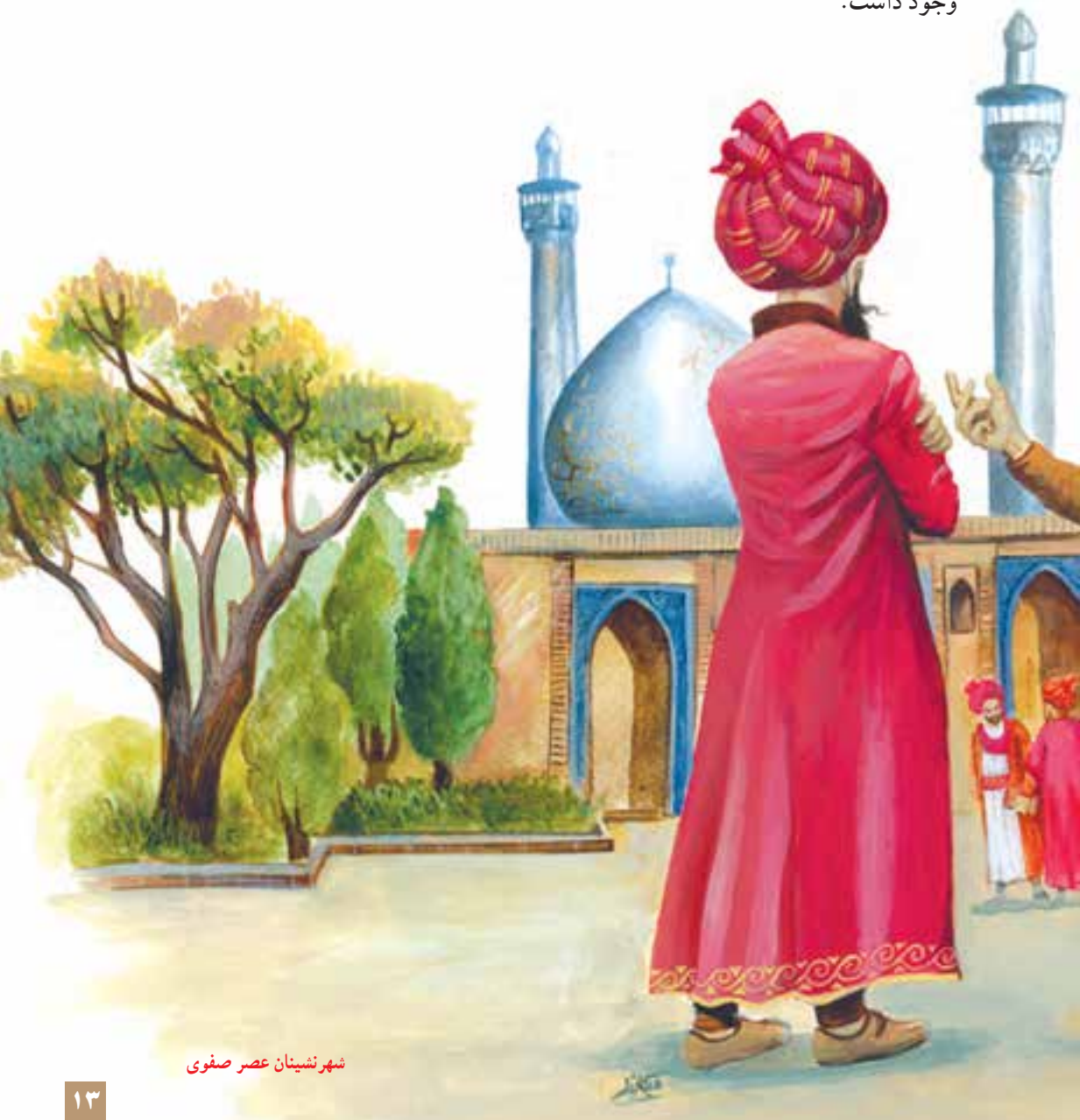
شهرنشینان عصر صفوی

شهرنشینان حدود ۱۵ درصد کل جمعیت کشور را تشکیل می‌دادند که عده زیادی از آنان ساکن اصفهان، پایتخت صفویان، بودند. علاوه بر آن، حدود ۹۰ شهر که برج و بارو داشتند در قلمرو صفویه وجود داشت.