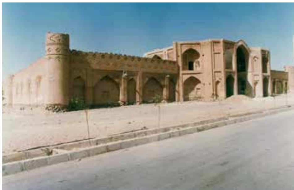
کاروانسرای کوهپایه اصفهان