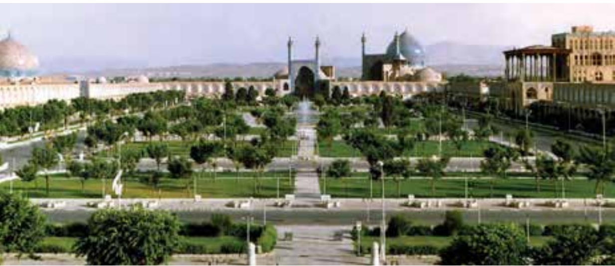
میدان نقش جهان (امام خمینی کنونی) اصفهان؛ طراحی و ساخته شده در عصر صفوی

همکاری نظامی انگلستان با حکومت صفوی علیه پرتغالی‌ها دو علت داشت :