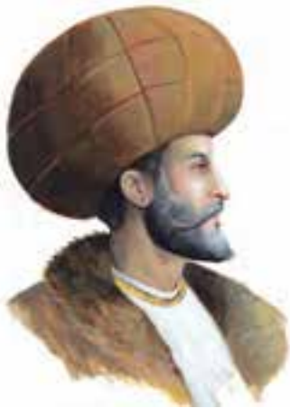
شاه اسماعیل اول صفوی

اسماعیل صفوی پس از پیروزی بر حاکم آق قویونلو و تصرف تبریز در سال ۹۰۷ ق، حکومت صفوی را بنیان نهاد و آن شهر را به پایتختی خود برگزید. او از نوادگان شیخ صفی الدین اردبیلی است. شیخ صفی دو قرن پیش از اسماعیل، سلسله طریقت صوفیانه‌ای را در اردبیل به وجود آورد که پس از مرگ او، توسط فرزند و نوادگانش رهبری می‌شد. بیشترین مریدان طریقت صفوی را اعضای هفت طایفه ترک تشکیل می‌دادند که به قزلباش معروف شدند. این طریقت تحت رهبری پدر بزرگ و پدر اسماعیل گام در مسیر فعالیت‌های سیاسی و نظامی گذاشت و سرانجام اسماعیل با پشتیبانی مریدان مطیع و پرشور به حکومت رسید.