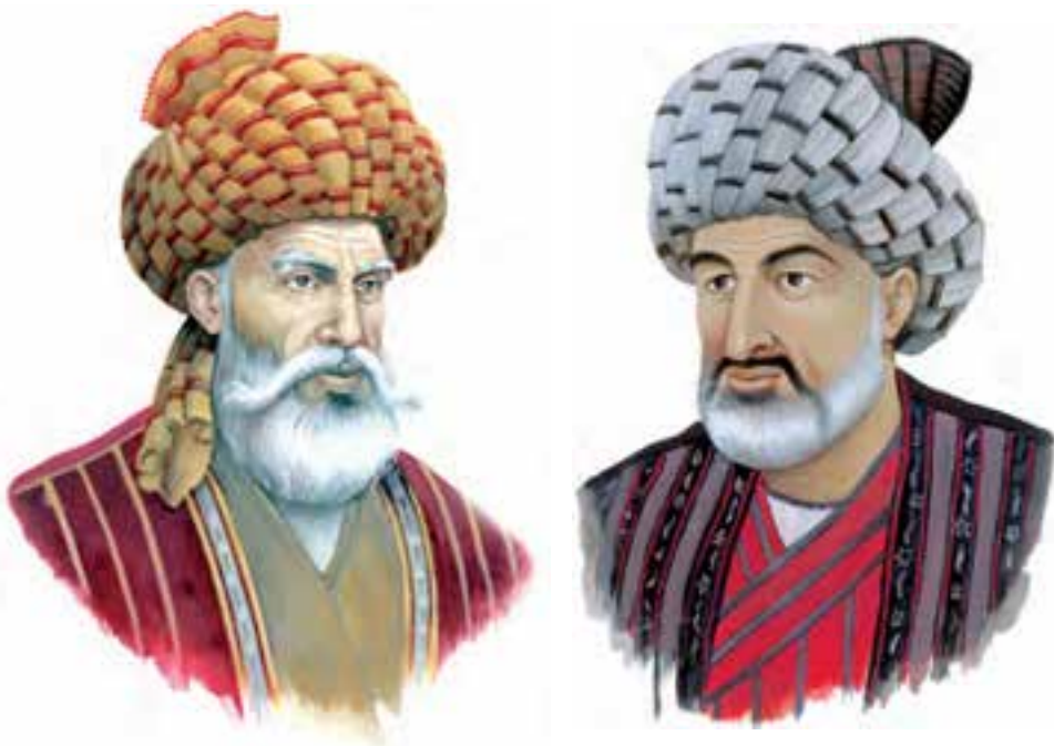
شیخ بهایی، عالم مشهور دوره شاه عباس اول