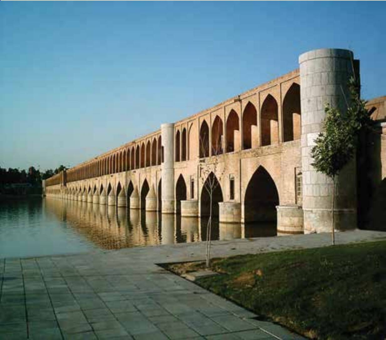
اصفهان — سی وسه پل (پل اللہ وردی خان)