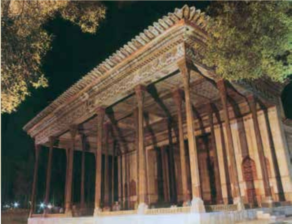
اصفهان - کاخ چهلستون