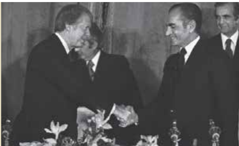
* محمدرضا شاه، خوشحال و سرمست از پشتیبانی کارتر، رئیس‌جمهور امریکا