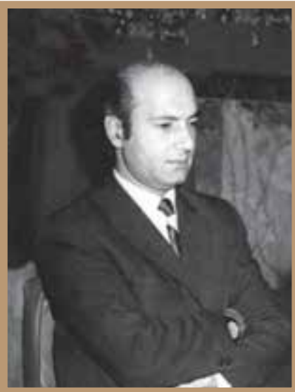
دکتر علی شریعتی، متفکر مسلمان