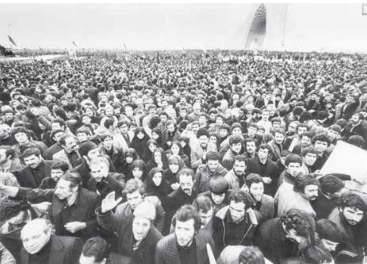
تظاهرات مردم تهران در عاشورای ۱۳۵۷؛ نشانه سقوط نزدیک رژیم پهلوی

راه پیمایی های تاسوعا و عاشورای ۱۳۵۷، نشانه سقوط نزدیک شاه: با فرا رسیدن ماه محرم، شور و اشتیاق برای مبارزه با حکومت طاغوت بالا گرفت. دولت نظامی از هاری می‌کوشید با ایجاد رعب و وحشت مانع تظاهرات مردم شود؛ اما حضور میلیونی مردم ایران، مخصوصاً مردم تهران در راه پیمایی های تاسوعا و عاشورای سال ۱۳۵۷ به جهانیان ثابت کرد که شاه و حکومت او را نمی‌توان