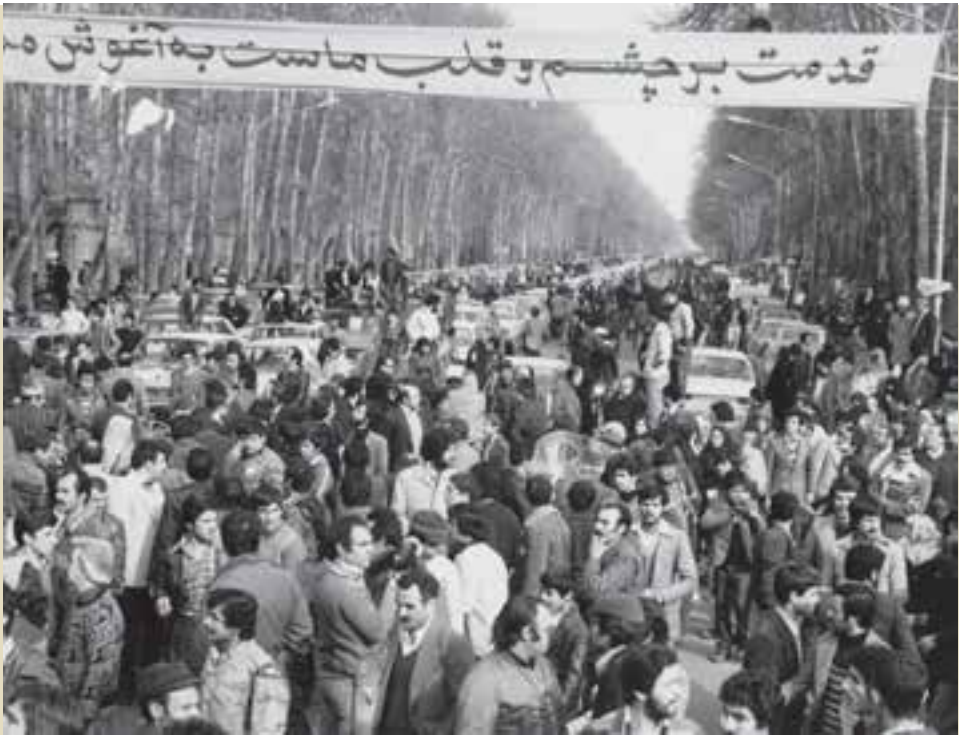
استقبال تاریخی از ورود امام خمینی (ره) به ایران

بازگشت امام خمینی به وطن : تلاش‌های امریکا و بختیار برای ممانعت از ورود امام به ایران، بر اثر مقاومت مردم درهم شکست و رهبر انقلاب روز ۱۲ بهمن ۱۳۵۷، پس از چهارده سال و چند ماه تبعید به میهن بازگشت. امام در میان استقبال تاریخی و بی‌سابقه مردم، از فرودگاه مهرآباد به بهشت زهرا رفت تا به شهیدان انقلاب اسلامی ادای احترام کرده باشد. دهه فجر انقلاب اسلامی : امام خمینی (ره) سه روز بعد از بازگشت، به پیشنهاد شورای انقلاب،