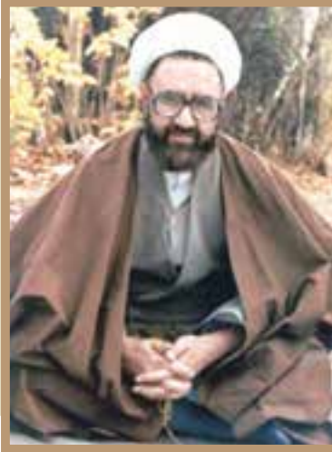
شهید آیت الله مرتضی مطهری، اندیشمند بزرگ اسلامی