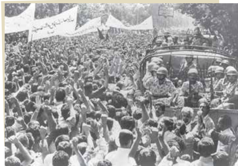
تظاهرات مردم تهران در شهریور ۱۳۵۷