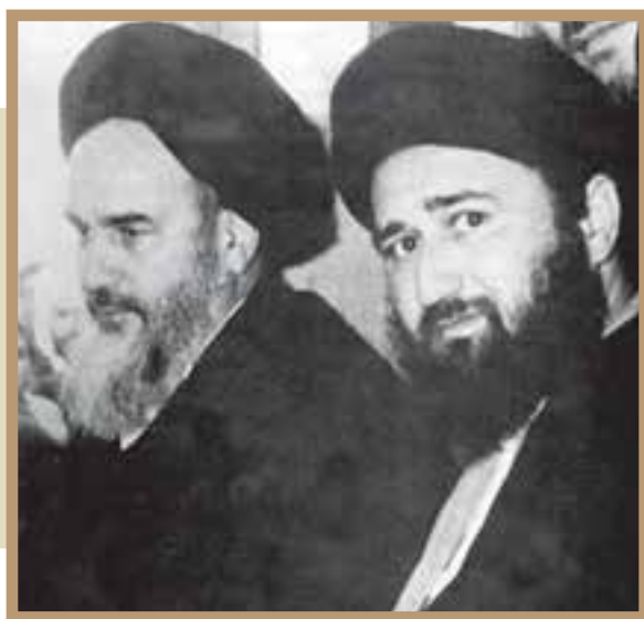
امام خمینی و فرزند بزرگوارشان حاج آقا مصطفی

شهادت حاج آقا مصطفی خمینی و مقاله توهین آمیز روزنامه اطلاعات: حاج آقا مصطفی خمینی، فرزند امام خمینی، در آبان ۱۳۵۶ به طرز مشکوکی در نجف به شهادت رسید و مردم ایران به شدت متأثر شدند. مجالس سوگواری فرزند امام در سراسر ایران حتی در روستاها، با شکوه خاصی