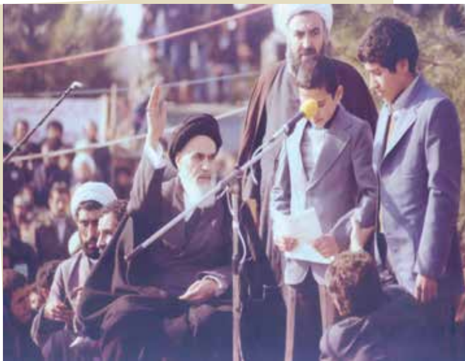
امام خمینی (ره) در بهشت‌زهرای تهران در ۱۲ بهمن ۱۳۵۷

مهندس مهدی بازرگان را به‌عنوان نخست‌وزیر دولت موقت انقلاب منصوب کرد و بار دیگر دولت بختیار را غیرقانونی شمرد. امام همچنین از ارتشیان خواست که به مردم بپیوندند. افسران نیروی هوایی اولین گروهی بودند که به انقلاب پیوستند. با هوشیاری امام و حضور مردم در صحنه، تلاش‌ها برای انجام یک کودتای نظامی ناکام ماند و سرانجام، روز ۲۲ بهمن ۱۳۵۷ انقلاب اسلامی به رهبری امام خمینی به پیروزی رسید و نظام طاغوت سرنگون شد.