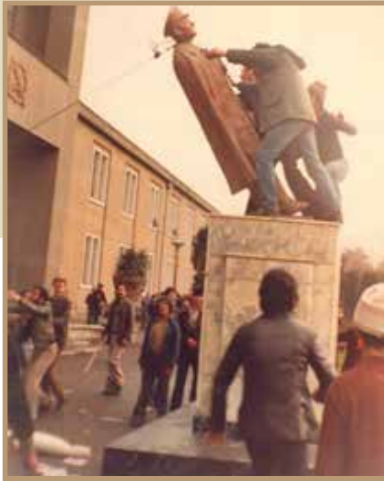
* سرنگونی نظام شاهنشاهی در ایران