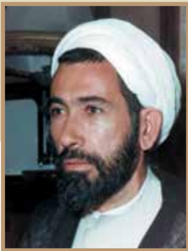
شهید دکتر محمد جواد باهنر