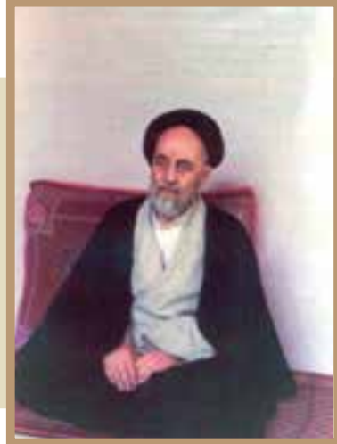
علامه محمدحسین طباطبایی، استاد نامدار فلسفه اسلامی و مفسر معروف قرآن کریم