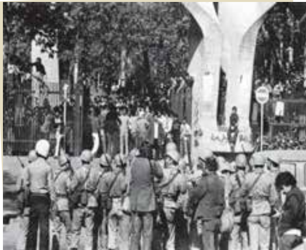
شُرکت گسترده دانش آموزان و دانشجویان در تظاهرات ضدحکومتی

کشتار دانش آموزان در ۱۳ آبان : دانش آموزان و دانشجویان در مبارزه با حکومت طاغوت نقش مؤثری داشتند. در روز ۱۳ آبان ۱۳۵۷، جمع زیادی از دانش آموزان و دانشجویان در حمایت