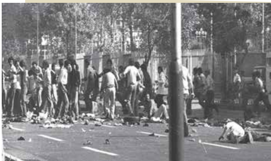
جمعه سیاه تهران (۱۷ شهریور ۱۳۵۷)

۱۷ شهریور (جمعه سیاه): رژیم، بامداد روز جمعه، ۱۷ شهریور، در تهران و یازده شهر دیگر اعلام حکومت نظامی کرد. مردم مبارز تهران براساس تصمیمی که در راه پیمایی روز قبل اعلام شده بود، صبح روز ۱۷ شهریور در خیابان و میدان ژاله (شهدای کنونی) گرد هم آمدند. مزدوران شاه بی رحمانه جمعیت را به گلوله بستند و صدها زن و مرد و کودک و جوان را به شهادت رساندند. امام خمینی (ره) در پیامی به مناسبت این جنایت وحشیانه فرمود: «ای کاش خمینی در میان شما بود و در کنار شما در جبهه دفاع برای خدای تعالی کشته می شد.» کارتر که با شعار «حقوق بشر» رئیس جمهور امریکا شده بود، بعد از این کشتار هولناک هم چنان به حمایت خود از شاه و حکومت او ادامه داد.