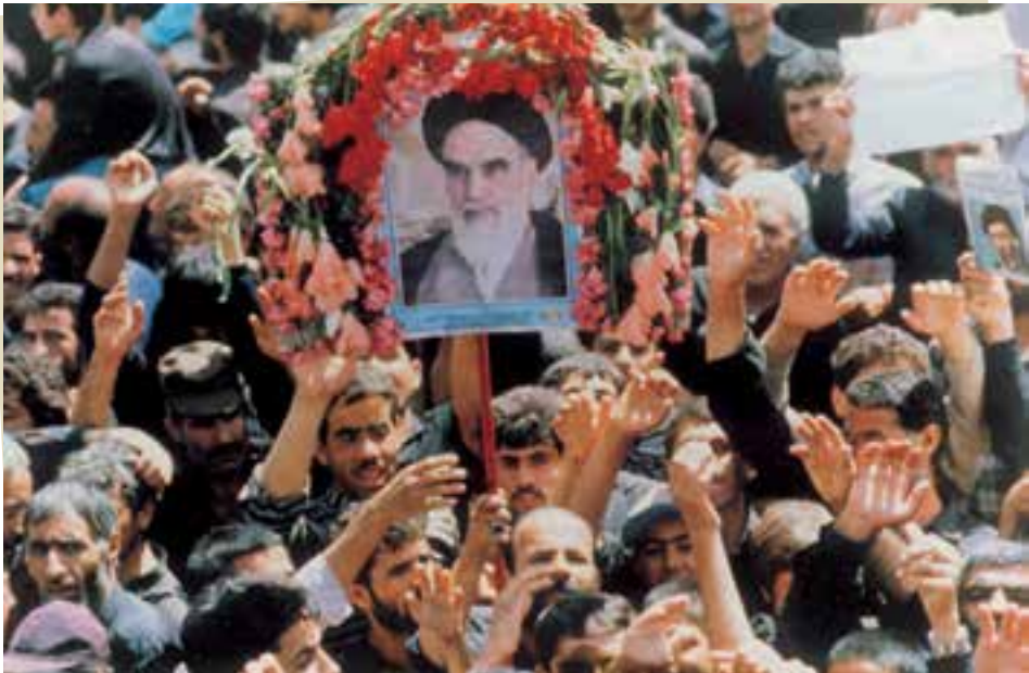
وداع جان‌سوز ملت با رهبر و امام خویش

امام خمینی پس از عمری مجاهدت علمی و مبارزه سیاسی برای سربلندی اسلام و استقلال ایران، سرانجام در ۱۴ خرداد ۱۳۶۸ به رحمت ایزدی پیوست. میلیون‌ها نفر پس از یک تشییع بی نظیر، پیکر ایشان را در بهشت زهراي تهران به خاک سپردند. امام، انقلابی را آغاز و رهبری کرد که به قول حضرت آیت الله خامنه‌ای «در هیچ کجای جهان بی نام او شناخته شده نیست».