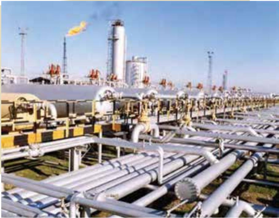
صنایع نفت و گاز پارس جنوبی در استان بوشهر، مظهر توانمندی و عزم راسخ ملت ایران برای سازندگی ایران