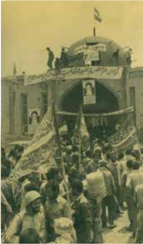
مسجد جامع خرمشهر، لحظاتی پس از آزادی از اشغال دشمن

آزادسازی مناطق اشغالی : نبرد رزمندگان ایرانی برای بیرون راندن متجاوزان بعثی از خاک ایران، به طور جدی، از مهرماه ۱۳۶۰ شروع شد. ابتدا نیروهای متحد بسیجی، سپاهی و ارتشی به فرمان امام، آبادان را از محاصره نجات دادند، سپس در عملیات فتح المبین، بخش وسیعی از سرزمین‌های اشغالی خوزستان را آزاد کردند. بعد از آن، در عملیات بیت المقدس که به فاصله کمی پس از عملیات فتح المبین انجام گرفت، خرمشهر بعد از ۱۸ ماه اشغال، روز سوم خرداد ۱۳۶۱ آزاد شد.