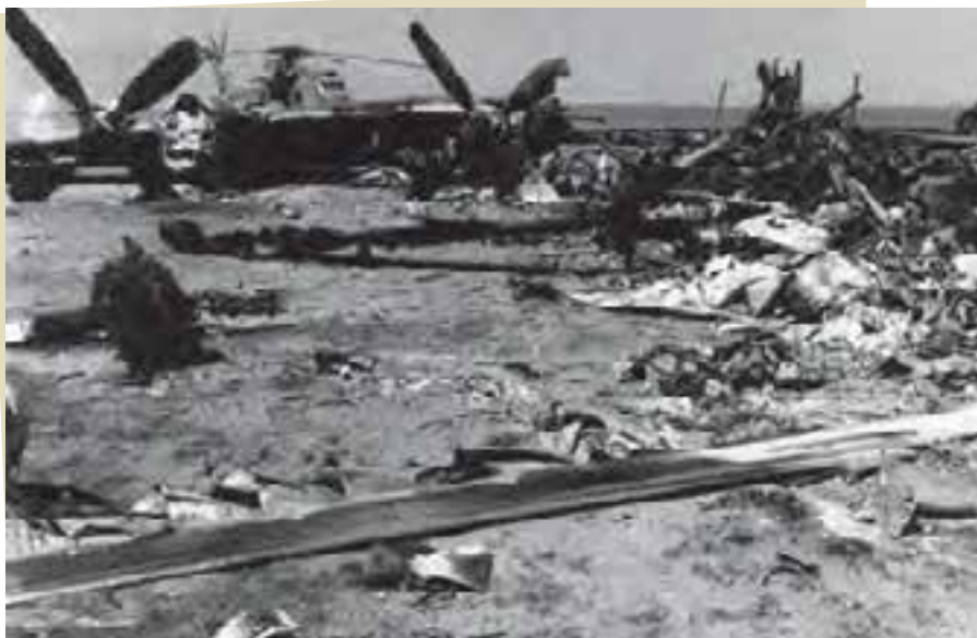
صحرای طبس؛ مدفن هلیکوپترها و هواپیماهای امریکایی

و هلیکوپترهای جنگی آن کشور در صحرای طبس گرفتار طوفان شن شدند و نیروهای امریکایی با تحمل تلفات و خسارت فرار کردند.