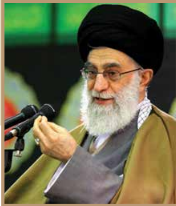
حضرت آیت الله سیدعلی خامنه‌ای مقام معظم رهبری