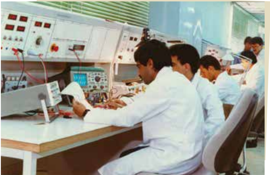
افتخار آفرینی مستمر دانشمندان جوان ایرانی

۲- شکوفایی علمی: انقلاب اسلامی علاوه بر تقویت بنیان‌های معنوی جامعه، موجب شکوفایی علم و دانش نیز شد. نرخ بی‌سوادی در سال‌های پس از پیروزی انقلاب اسلامی به‌طور چشمگیری کاهش یافت؛ تحصیلات دانشگاهی رشد و توسعه بسیاری داشته است و در رشته‌های مختلف علمی و فنی، به ویژه دانش پزشکی پیشرفت و موفقیت‌های زیادی حاصل شده است. دانشمندان جوان ایرانی با وجود فشارها و تحریم‌های آمریکا و هم‌بیمانانش، دانش هسته‌ای بومی و چرخه کامل سوخت هسته‌ای را بنیان نهادند؛ مراحل تهیه سوخت هسته‌ای از اورانیوم، بسیار پیچیده و ظریف است. دانش انجام این کار از