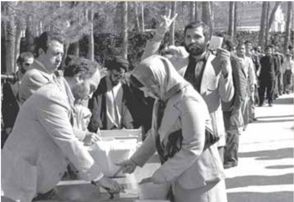
همه‌پرسی نظام جمهوری اسلامی ایران در فروردین ۱۳۵۸

در درس‌های گذشته خواندید که نهضت اسلامی از سال ۱۳۴۱ به رهبری امام خمینی (ره) آغاز شد و سرانجام، در ۲۲ بهمن ۱۳۵۷ به پیروزی رسید و حکومت پهلوی سقوط کرد. از فردای پیروزی انقلاب تلاش برای تحقق شعار «استقلال، آزادی، جمهوری اسلامی» با رهبری حکیمانه امام شروع شد.