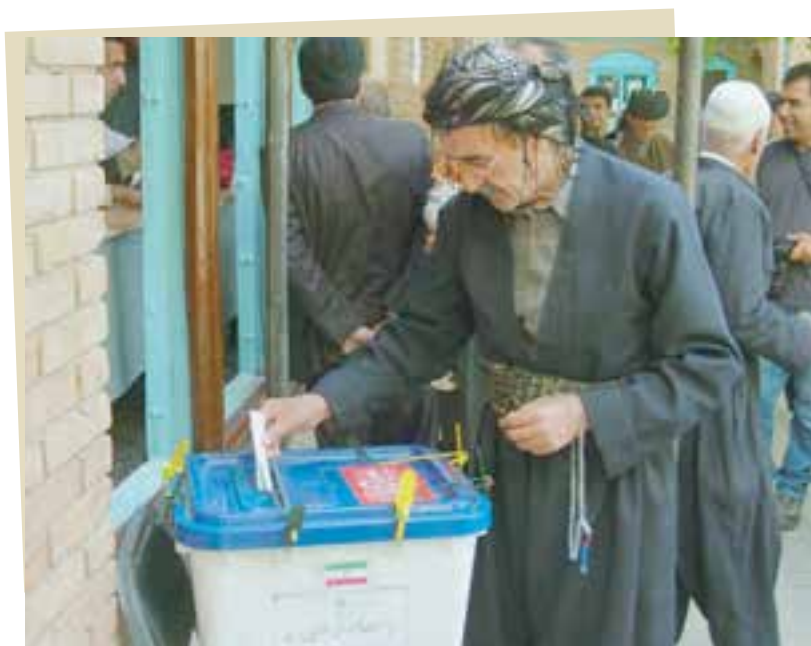
میزان رأی ملت است (امام خمینی)