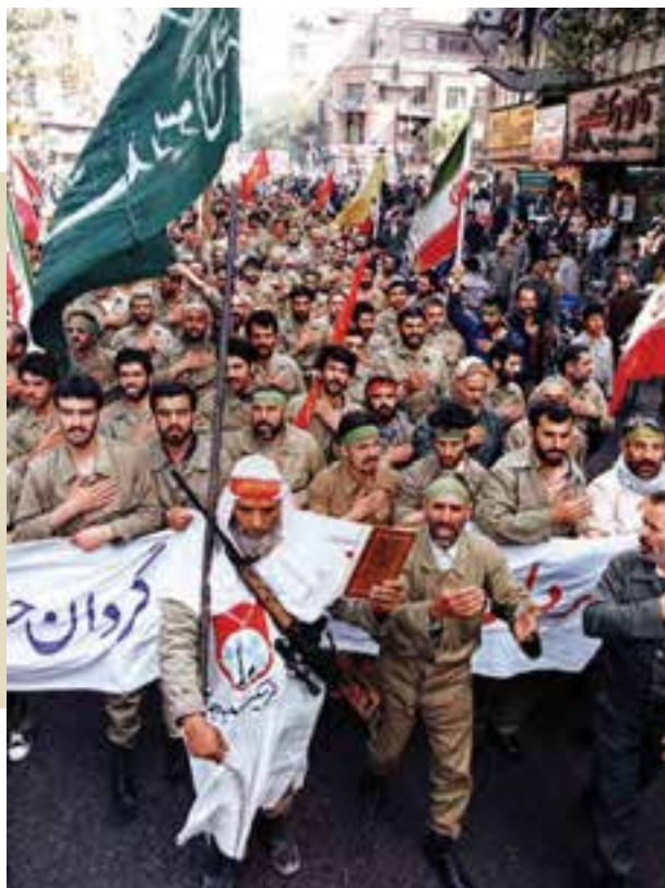
عزیمت داوطلبانۀ مردان ایران زمین به جبهه

بسیج ملت برای مقابله با متجاوزان : مردم مؤمن و میهن دوست ایران نمی توانستند نظاره گر تجاوز بیگانگان به سرزمین خود باشند؛ از این رو، وقتی امام خمینی ملت را به دفاع از کشور و انقلاب فراخواند، مردان ایران زمین از نوجوان سیزده ساله تا پیرمرد کهن سال، داوطلبانه عازم جبهه های جنگ تحمیلی شدند. آنان با فداکاری و تثار جان خویش، حماسه جاودانی را در تاریخ ایران خلق کردند. نوجوانان شهیدی چون حسین فهمیده، بهنام محمدی و سهام خیام به اسطوره های مقاومت و از جان گذشتگی ملت ایران معروف شدند. مردم ایران علاوه بر شرکت داوطلبانه در جبهه ها، با اهدای کمک های مالی نیز رزمندگان را یاری می رساندند. زنان ایرانی نیز در دفاع از مرز و بوم خویش نقش مؤثری داشتند؛ آنان افزون بر اینکه شرایط را برای حضور مردان در جبهه فراهم می کردند، در پاره ای از فعالیت های پشت جبهه مانند مداوای مجروحان جنگی سهیم بودند.