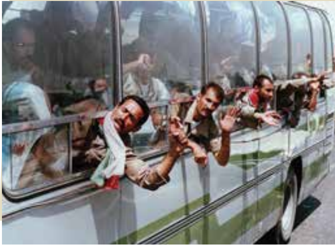
ورود آزادگان به میهن اسلامی