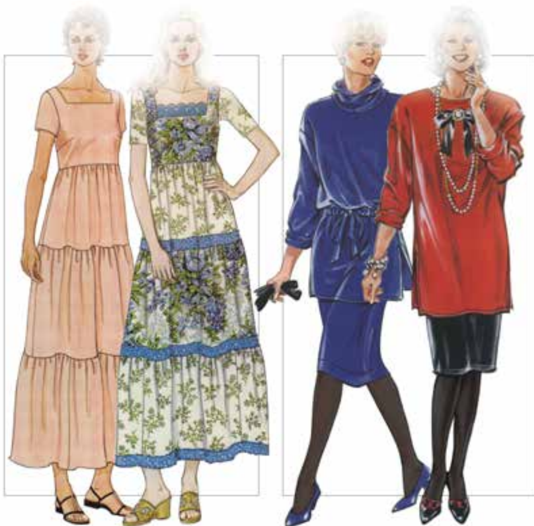
▲ شکل ۲۹-۴