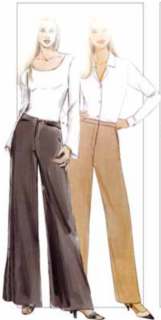
▲ شکل ۴-۳۴

▲ کمر لباسی که روی خط قرار می‌گیرد، کمر را ظریف تر از کمر لباسی که پایین تر از خط کمر است، نشان می‌دهد.