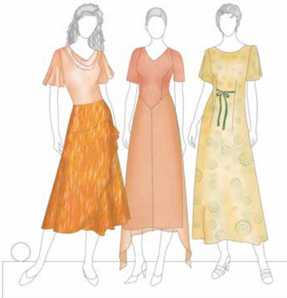
▲ شکل ۲۶-۴

تیرگی، روشنی و درجه‌ی درخشش رنگ‌ها، تأثیر به‌سزایی روی اندام دارد. رنگ‌های با خلوص بالا و والور نرمال سایز فرد را افزایش می‌دهد. برای مثال، رنگ قرمز چرخه‌ی رنگ فرد را چاق‌تر و درشت‌تر نشان می‌دهد، در صورتی که اگر قرمزی را انتخاب کنیم که خاکستری داشته باشد - قرمز مات با کمی خاکستری - روی اندام تأثیری نخواهد داشت (شکل ۲۶-۴).