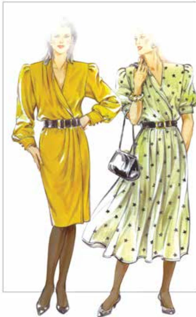
▲ شکل ۲۷-۴

به جز موارد ذکر شده عوامل دیگر مانند، قد لباس، گشادی لباس، محل قرارگیری کمر لباس، گشادی شلووار و دامن، دم پای شلووار، تزئینات لباس (چین، دگمه، نوار و، گردن بند . . .) تأثیر به سزایی در لباس دارند.