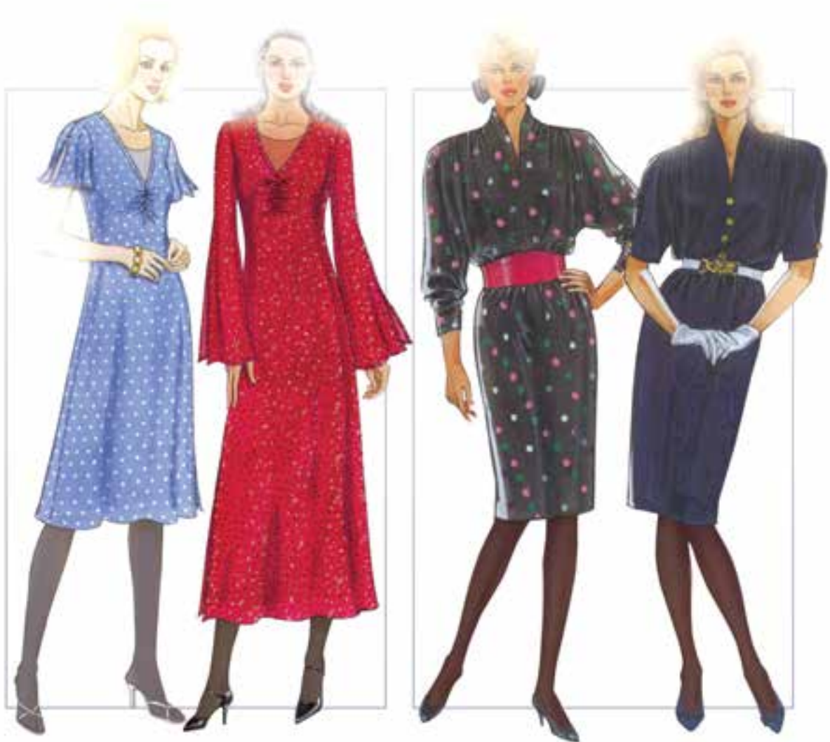
▲ شکل ۳۱-۴