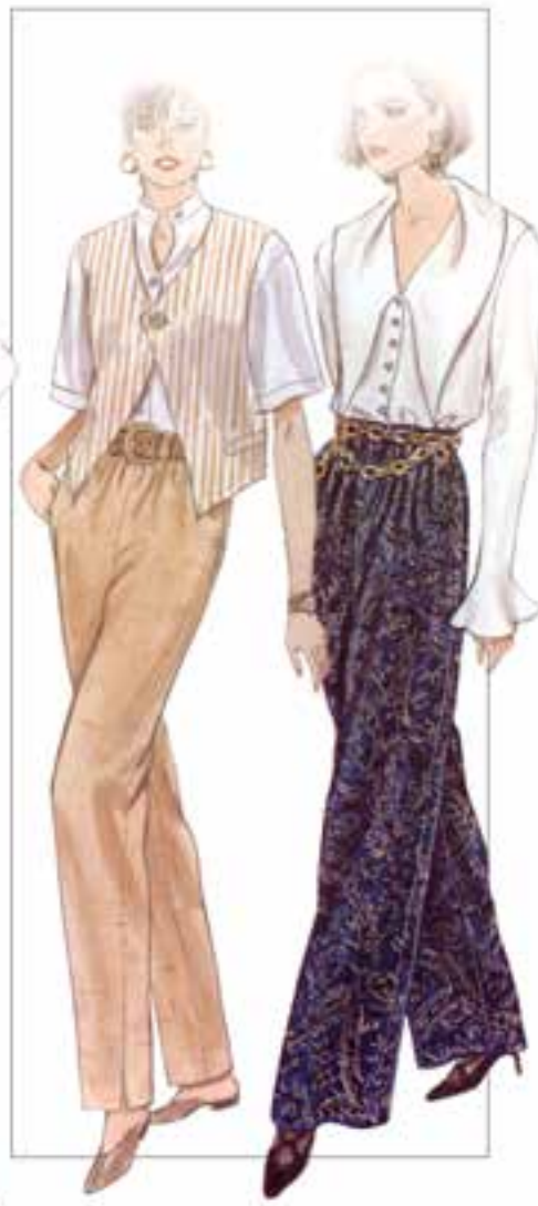
▲ شکل ۴-۳۳

▲ کمر لباسی که روی خط قرار می‌گیرد، کمر را ظریف تر از کمر لباسی که پایین تر از خط کمر است، نشان می‌دهد.