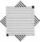
نشانه‌ی انجمن ویراستاران طراح: قباد شیوا

۲. به صورت خطوط باریک یا ضخیم یکنواخت باشند.