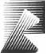
نشانه نوشته‌ی شرکت بی. بی طراح: نورالدین زرین کلک

خطوط عمودی، افقی، مایل و منحنی می‌توانند در مسیر حرکت خود دارای شرایط زیر باشند که برای آشنایی بیش‌تر شما با چگونگی استفاده از تغییرات انواع خطوط در طول مسیر حرکت، نمونه‌هایی از کارهای گرافیک را نیز در این‌جا می‌آوریم. ۱. ضخیم یا نازک، قوی یا ضعیف، تیره یا روشن شوند.