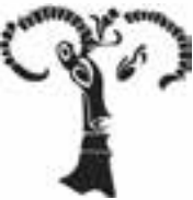
نشانه‌ی انتشارات مارلیک طراح: نیلوفر وکیل بهرامی

۳. می‌توانند در جهت مسیر اصلی خود به صورت بریده بریده یا ممتد باشند.