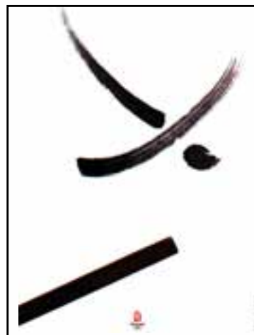
کان-تای کنونک - طراحی برای رشته‌های ورزشی المپیک