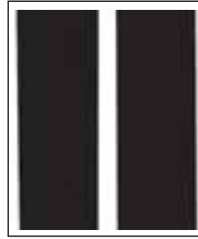
نشانه انتشارات سروش - قباد شیوا