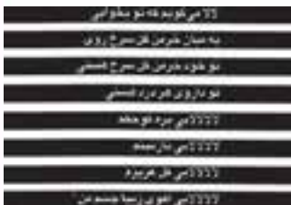
تصویرسازی کتاب - قباد شیوا