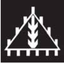
نمونه‌ی استفاده شده‌ی نقش مهر، هزاره‌ی سوم ق.م، شوش

پایدارترین شکل هندسی مثلث است. (خصوصاً مثلث متساوی الاضلاعی که بر سطح قاعده‌اش قرار گرفته باشد) اما چنانچه این مثلث بر یکی از راس‌های خود قرار بگیرد حالتی کاملاً متزلزل و ناپایدار دارد. مثلث به واسطهٔ زوایای تندی که دارد سطحی مهاجم و ستیزنده به نظر می‌رسد که همواره در حال تحول و پویایی است. راس تیز این شکل نیز نمادی از اشعه‌ی خورشید است.