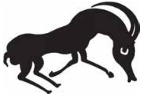
نقش روی ظرف سیلک کاشان