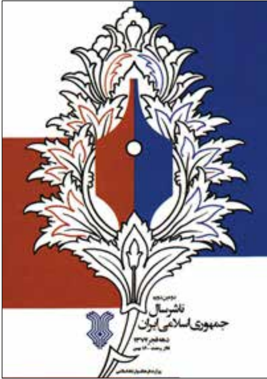
تعادل متقارن در اثر آقای مصطفی اسداللهی