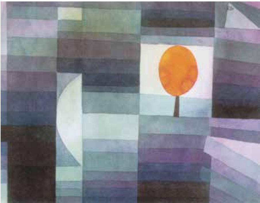
ترکیب غیر قرینه در تابلوی پیام آور پاییز اثر پل کله

در ترکیب غیر قرینه عناصر موجود در تصویر بر اساس ارزش‌های بصری خودشان مثل رنگ، تیرگی، روشنی، بافت و... در کادر قرار می‌گیرند نه بر اساس محورهای عمودی، افقی و مورب کادر.