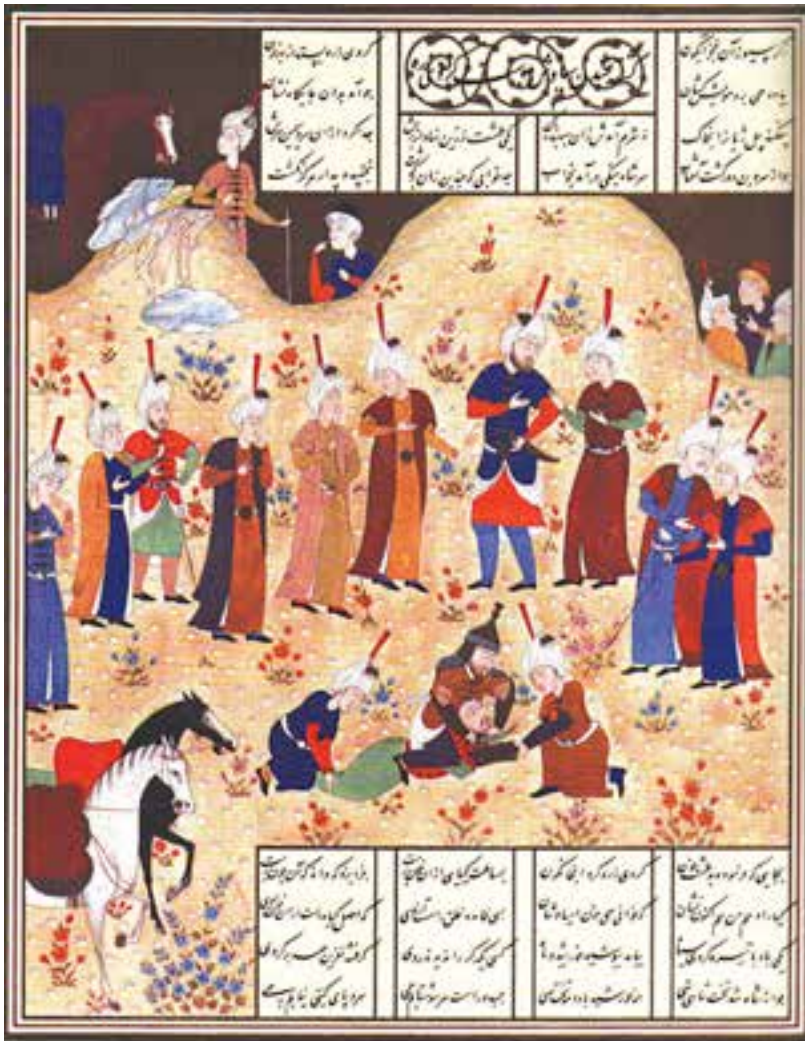
کشته شدن سیاوش، شاهنامه بایسنجری

۶. عامل مفروض: عنصر پر قدرتی که سایر عوامل موجود در کادر را در اطراف خودش سازماندهی می‌کند. برای آشنایی بیش‌تر با اصول نظام دهنده، به بررسی آن‌ها در اثر زیر می‌پردازیم: تصویر زیر صحنه‌ی کشته شدن سیاوش، از نگاره‌های شاهنامه‌ی بایسنجری است که اصول نظام‌دهنده‌ی آن عبارتند از: