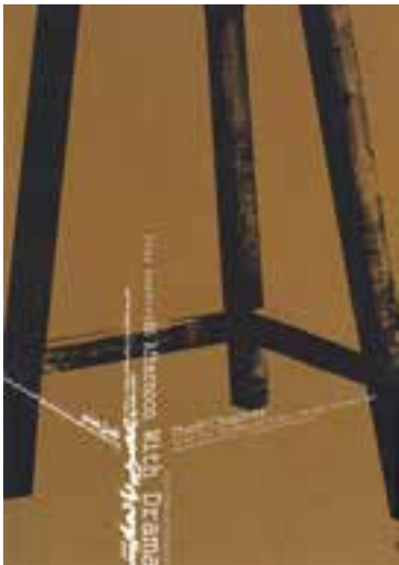
نمونه‌ی استفاده از ترکیب‌بندی مثلثی در یک پوستر (راس مثلث خارج از کادر واقع شده است.)

آثاری که دارای ترکیب‌بندی مثلثی هستند، عموماً از استحکامی استثنایی برخوردارند. هنرمندان رشته‌های مختلف هنری در بسیاری از موارد از استحکام و ساختار منسجم مثلث، برای ترکیب‌بندی سود برده و کیفیت آن‌را با نیاز تصویر مورد نظر خود منطبق کرده‌اند.