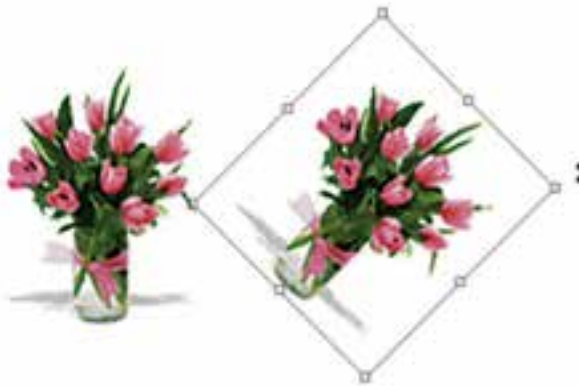
شکل ۷-۱۸ چرخاندن تصویر (Rotate)

برای این منظور در بخش دستوره‌های Transform گزینه‌ای به نام Rotate قرار داده شده است که با استفاده از آن می‌توانید کل تصویر یا بخش‌هایی از آن را با زاویه‌های مختلف و در جهت‌های مختلف چرخش دهید. برای این منظور متناسب با نیاز خود یکی از گزینه‌های ۱۸ Rotate (چرخاندن به اندازه ۱۸۰ درجه)، Rotate ۹۰ CW (چرخاندن به اندازه ۹۰ درجه در جهت عقربه‌های ساعت)، Rotate ۹۰ CCW (چرخاندن به اندازه ۹۰ درجه در خلاف جهت عقربه‌های ساعت) را اجرا کنید. (شکل ۷-۱۸)