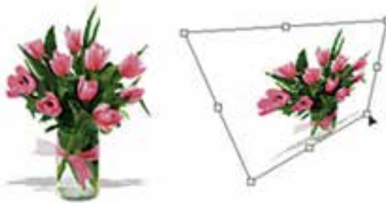
شکل ۱۸-۹ به هم ریختن تصویر

با استفاده از این دستور در Photoshop می‌توان عملی مشابه دستور Skew را انجام داد ضمن این که تا حدودی این دستور عمل تغییر مقیاس یا اندازه را نیز انجام می‌دهد. با این تفاوت که در این جا وقتی کادر مورد نظر در اطراف تصویر مورد نظر ایجاد می‌شود هنگامی که اقدام به کشیدن دستگیره‌های موجود می‌کنید این امکان به شما داده می‌شود که آن را به طرف گوشه مقابل نیز جابجا کنید. به طور کلی از این دستور برای به هم ریختن فرم اصلی یک تصویر و افقی کردن در جهات مختلف استفاده می‌شود. (شکل ۱۸-۹)