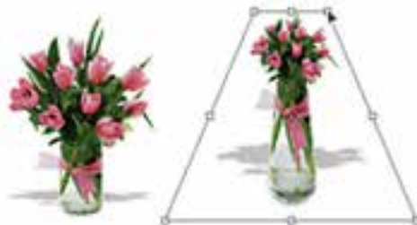
شکل ۱۸-۱۰ پرسپکتیو به تصویر

به کمک این دستور می‌توان بخش انتخاب شده یا کل یک تصویر را دارای عمق و زاویه دید مشخصی کرد. این گزینه یکی از مفیدترین و کاربردی‌ترین دستورهایی بخش Transform است، به طوری که با اجرای آن و با ایجاد کادر انتخاب مورد نظر در اطراف تصویر کاربر می‌تواند با استفاده از دستگیره‌های موجود در این کادر به تصویر خود عمق و زاویه خاص بدهد. ضمن این که در این دستور با تغییر دادن یک گوشه و جابه‌جا کردن آن، گوشه مقابل آن نیز متناسب با این گوشه تغییر خواهد کرد. این تفاوت اصلی‌ترین تفاوت این دستور با دستور Distort می‌باشد. (شکل ۱۸-۱۰)