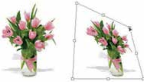
شکل ۱۸-۸ کج کردن تصویر (Skew)