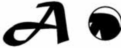
شکل ۲-۱۸ وضعیت پیکسل‌ها هنگام بزرگ کردن تصاویر برداری

شود هیچ گونه تأثیری بر کیفیت آن‌ها نخواهد داشت. (شکل ۲-۱۸) اما مهم‌ترین عیب این گونه نرم‌افزارهای گرافیکی آن است که برای ویرایش تصاویر با درجه رنگی پیوسته مناسب نمی‌باشند.