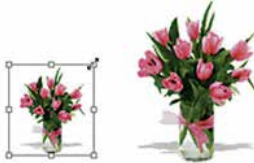
شکل ۶-۱۸ تغییر اندازه (Scale)

با اجرای دستور Scale در اطراف بخش انتخاب شده محدوده‌ای ایجاد می‌شود که دارای دستگیره‌های مختلفی برای تغییر اندازه در جهت‌های مختلف است و شما می‌توانید با پایین نگه داشتن کلید Shift و کشیدن یکی از گوشه‌های آن به‌طور متناسب بخش انتخاب شده را تغییر مقیاس دهید. برای اعمال تغییرات از کلید Enter یا دابل کلیک در داخل محدوده مورد نظر استفاده کنید. (شکل ۶-۱۸)