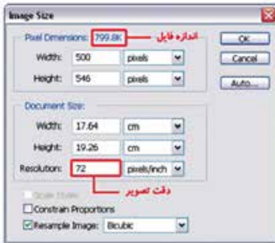
شکل ۳-۱۸ تغییر دقت تصویر و رابطه آن با حجم فایل

برای این که مشاهده کنید تفاوت Resolution تصویر که ما به آن دقت تصویر می‌گوییم چه تأثیری بر حجم فایل دارد به مثال زیر توجه کنید: (شکل ۳-۱۸)