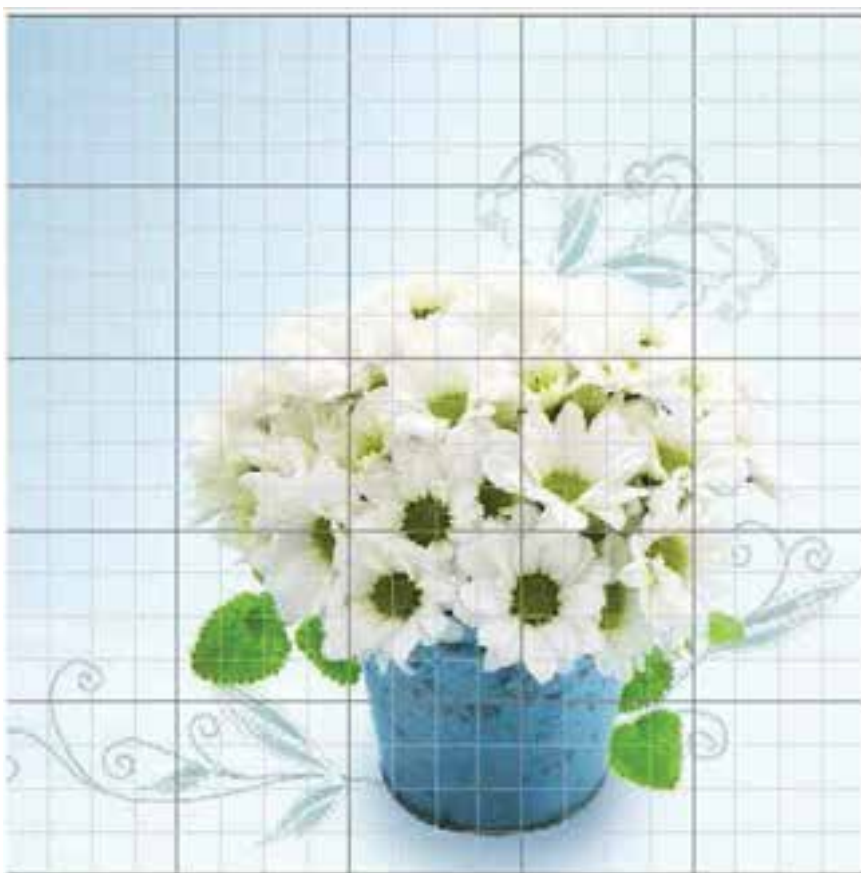
شکل ۴-۲۱- خطوط شبکه‌ای راهنما در فتوشاپ

علاوه بر خطوط راهنما که در بالا با کاربردشان آشنا شدید یکی دیگر ابزارهای کمکی فتوشاپ در حین انجام دادن عملیات، خطوط شبکه‌ای می‌باشند. این نقاط به صورت شبکه‌ای بر روی تصویر قرار گرفته و عناصر ترسیمی و انتخاب می‌توانند به این شبکه نقطه‌ای قفل شده یا متصل شوند و امکان انجام دادن ترسیماتی دقیق‌تر و راحت‌تر را برای کاربر فراهم نمایند. (شکل ۴-۲۱) برای نمایش خطوط شبکه‌ای بر روی تصویر از منوی view و زیرمنوی Show گزینه (Ctrl+G) Grid را فعال نمایید.