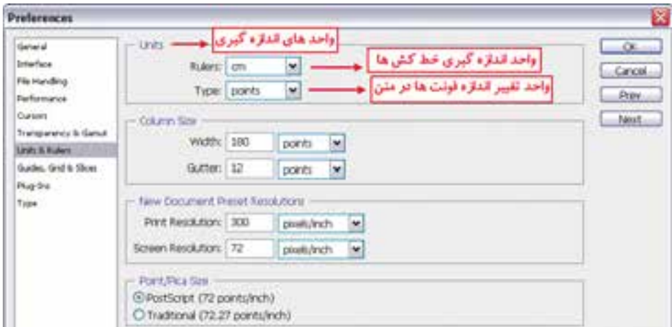
شکل ۲-۲۱- پنجره تنظیم واحد خط کش

در پنجره باز شده فوق از بخش Unit واحد اندازه‌گیری را سانتی متر تعیین کنید.