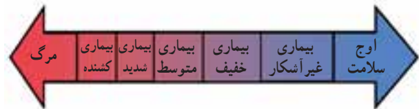
شکل طیف سلامت و بیماری

سلامت و بیماری دارای درجات مختلفی است. عده‌ای از مردم در ظاهر هیچ‌گونه ناراحتی یا علامتی از بیماری ندارند اما با انجام آزمایش و معاینه دقیق مشخص می‌شود که آن‌ها بیمارند. این‌گونه بیماری‌ها را بیماری‌های بدون علامت می‌نامند. در اغلب بیماری‌ها نشانه‌هایی هست که سبب تشخیص آن بیماری‌ها می‌شود، بیماری شدید شکل دیگر بیماری است که ممکن است به معلولیت و حتی مرگ منتهی شود. بنابراین طیف سلامت و بیماری از نقطه اوج سلامت شروع و به مرگ منتهی می‌شود.