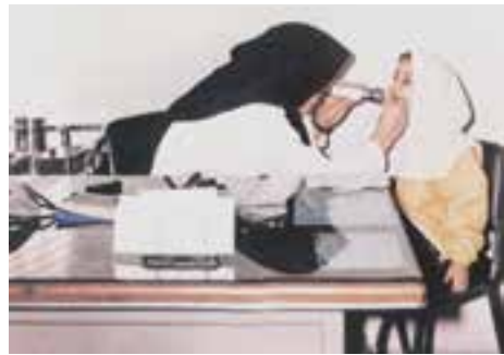
۳- سطح سوم: این سطح از پیشگیری زمانی مطرح از عینک و ... است.

بیماری یعنی تب رماتیسمی در شخص مبتلا می‌شود.